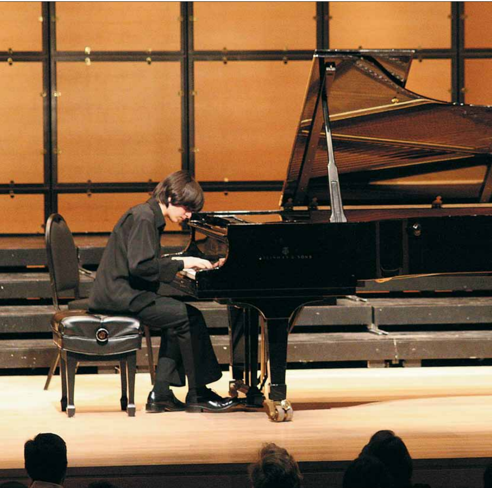
Концерт «Юные звезды юного века» в Культурном центре Торонто, Канада (Center of the Arts). 2007

нем Луке Мэри Давиташвили, народный артист СССР, композитор, профессор Тбилисской консерватории имени Вано Сараджишвили. «Я прослушал его собственные произведения – это очень талантливая и самостоятельная личность. Он глубоко проникает в исполняемые произведения и не раз очаровывал больших музыкантов.