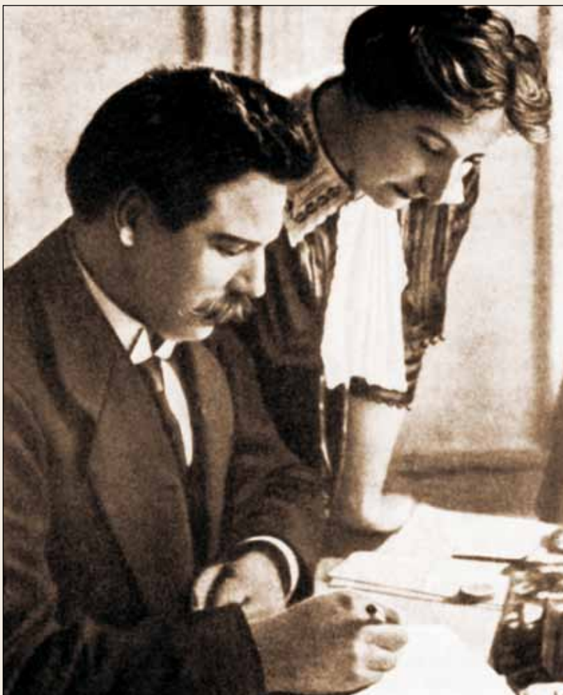
Альберт Швейцер с женой Еленой Бреслау. 1913

Жизнь этого человека разделена на два периода: европейский и африканский. Эльзасец по происхождению, он был выходцем из семьи бедного католического проповедника. С юности тяга к знаниям была так велика, что по окончании гимназии он поступил в Страсбургский университет сразу на два факультета, теологический и философский. Учиться было непросто, с трудом сдал экзамен по древнееврейскому языку. Велико было и увлечение музыкой, к которой он оказался чрезвычайно чувствительным – едва не упал в обморок, услышав впервые хор и органную музыку. Чтобы брать уроки игры на органе, стал ездить к знаменитому в те годы преподавателю в Париж, несмотря на стесненные материальные обстоятельства. Привлекала знаменитая парижская опера, особенно нравились произведения Вагнера.