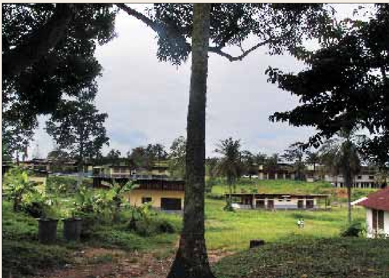
«Швейцар Хоспитал». Ламабарене, Габон

тельно, Швейцар не только не спешил встать в ряды борцов, но никогда не порицал общественных пороков, во всяком случае, таких, на которые ополчались революционеры, – неравенство, бедность, социальное угнетение. Пытался, еще живя в Европе, заняться попечительством о беспризорных, устройством жизни бродяг и бывших заключенных, но не порицал общество, в котором были эти беспризорные, бродяги и неустроенные бывшие заключенные. Держался в стороне от общественных организаций и гуманистически ориентированных движений и изменил этому правилу только в конце жизни, включившись в активную борьбу за запрещение испытаний атомного оружия. Он не стремился переделывать мир.