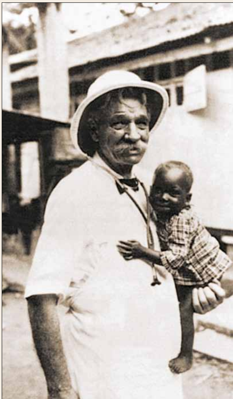
Альберт Швейцер с маленьким пациентом

Эта книга написана более семидесяти лет тому назад, однако общественные проблемы и негативные тенденции, обозначенные в ней, процветают и сегодня. Создание новых рабочих мест считается абсолютным благом. Внутренняя миграция переполняет столицы. Бюрократическая машина, организующая все в формальной части нашей жизни, постоянно наращивается. Никто, кроме небольшого количества ученых, государственных деятелей и деятелей культуры, не задумывается и не говорит о прессинге той формы общественного бытия на человека, которую теперь уже неизвестно кто создавал. Никто не ставит целью ее сломить, поскольку никто не знает ей альтернативы. Нет не только национальной идеи по переходу к новой форме общественного бытия – раскованного, свободного, планируемого и импровизационного одновременно. Нет самой идеи этого нового, нет нового общественного идеала. И когда массы недовольных людей высказывают свои пожелания (сделать пенсии побольше, а плату за услуги жилищно-коммунального хозяйства поменьше), они все равно принимают общественную систему такой, какова она есть в целом. Речь не о политическом устройстве, не об административной деятельности государства, не о правовых нормах, а о чем-то более