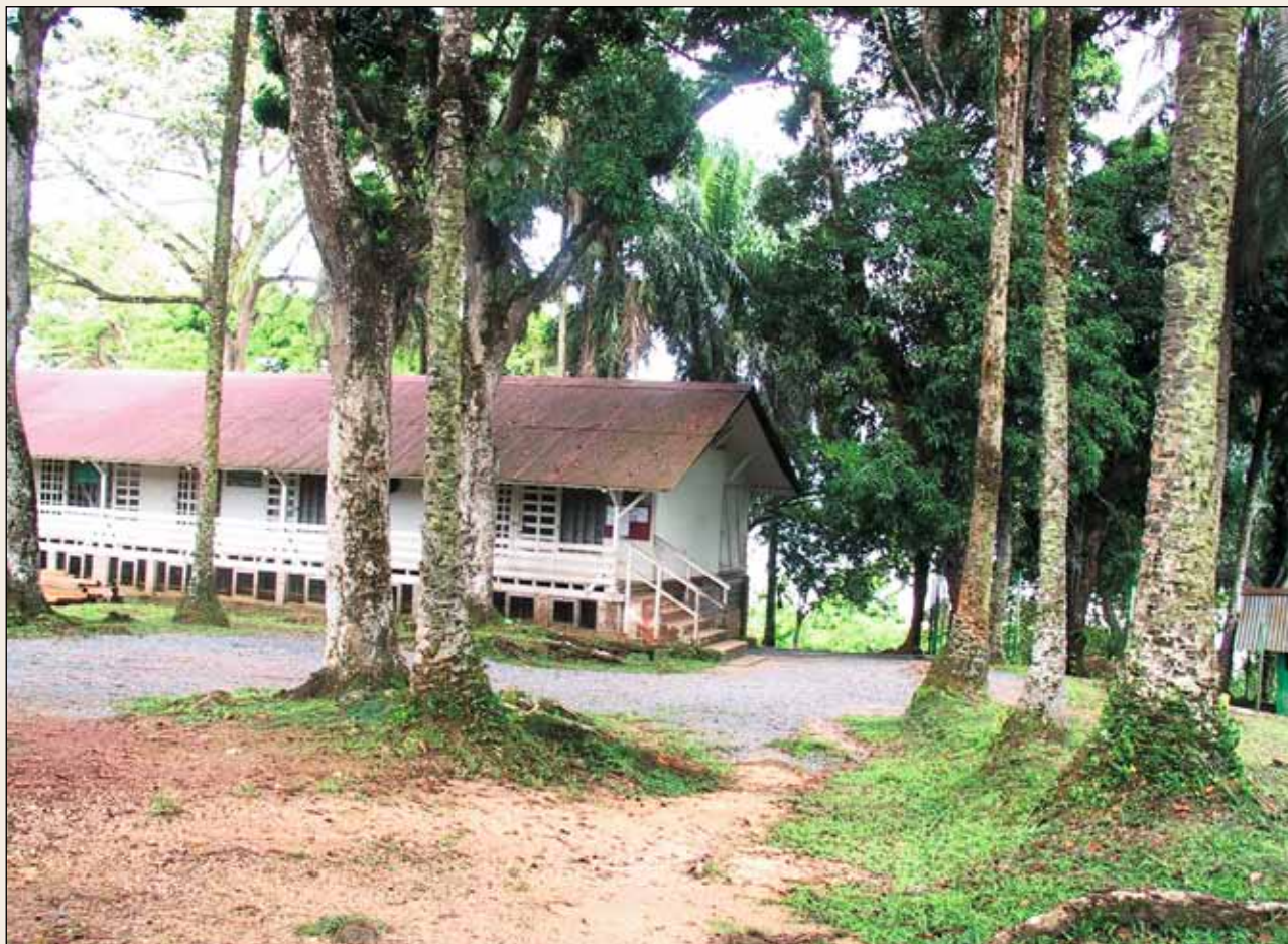
Больница, созданная А. Швейцером в Ламбарене, сегодня носит его имя

И все-таки почему сделавший успешную карьеру европеец начал жизнь с чистого листа в африканских джунглях? Его не понимали многие – журналисты, литераторы, размышляя над столь неординарным поступком, писали об индивидуализме, о самоотречении, упрекали его в том, что как человек, желавший принести максимальную пользу, он не пополнил ряды революционеров или борцов с фашизмом. Действи-