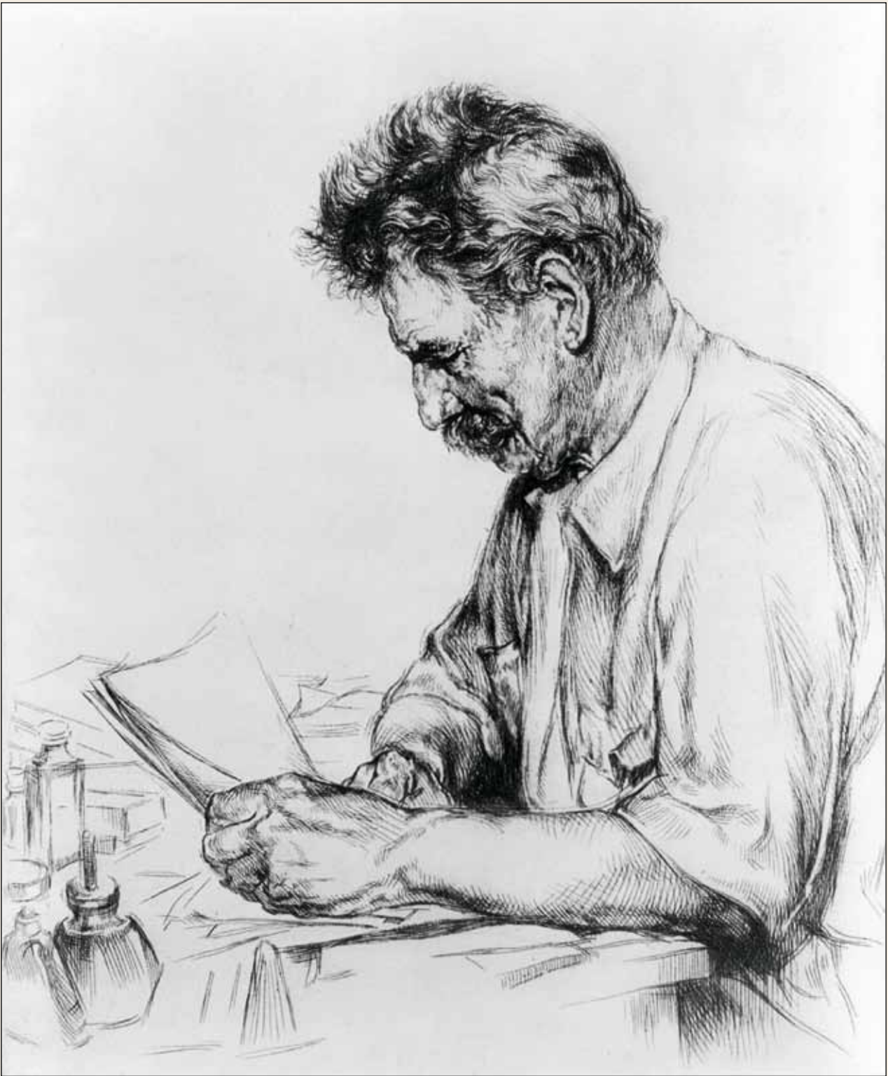
Артур Вильям Хайнцельман. Портрет Альберта Швейцера

нако, они уменьшают количество независимых существ внутри самого человечества» 6 .