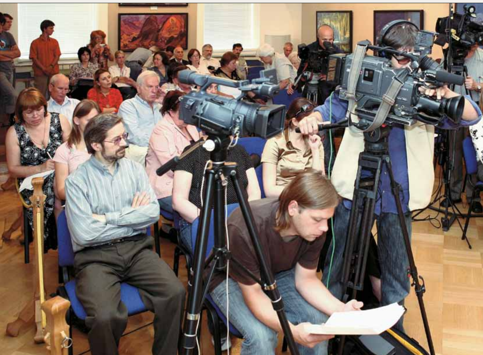
Пресс-конференция вызвала заинтересованную реакцию СМИ