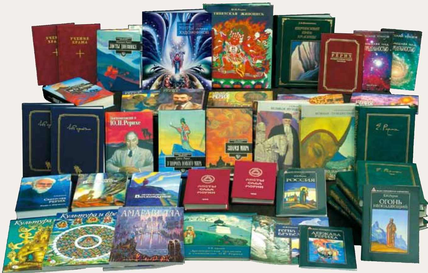
Издаия Международного Центра Рерихов

Советский Союз развалился, и в той правовой неразберихе чиновники попытались отобрать усадьбу Лопухиных. 4 ноября 1993 года вышло Постановление Правительства РФ №1121 о создании Государственного музея Н.К. Рериха. Музей создавался как филиал Государственного музея Востока и должен был разместиться в усадьбе