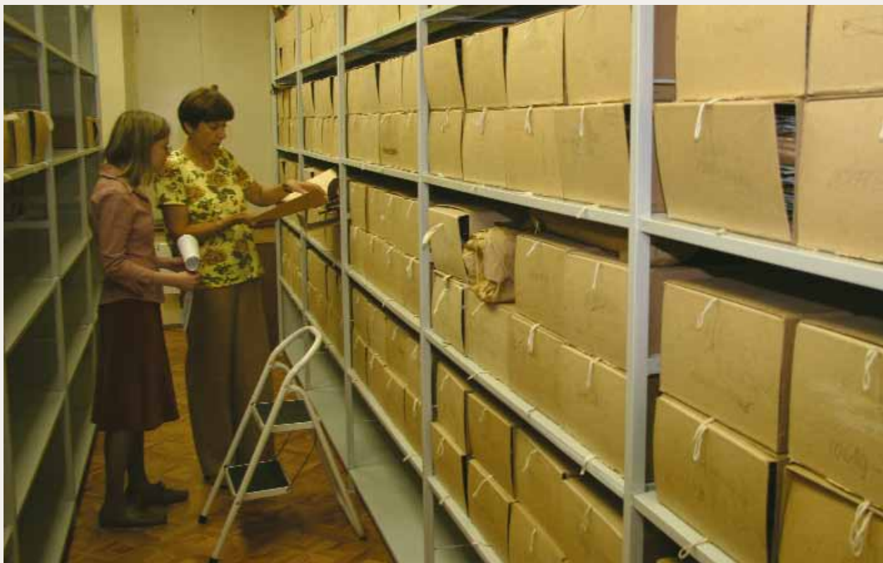
Хранилище отдела рукописей МЦР

В свое время Михаил Швыдкой, подавая на нас в суд, написал, что представляет интересы государства, которому принадлежит эта коллекция. Но это всего лишь слова, поскольку нет никакого распоряжения собственника – С.Н. Рериха – о передаче этой коллекции государству. Наоборот, завещательным распоряжением Святослава Николаевича она была закреплена за Международным Центром Рерихов. Вот и решайте сами, кто злодей в этой истории.