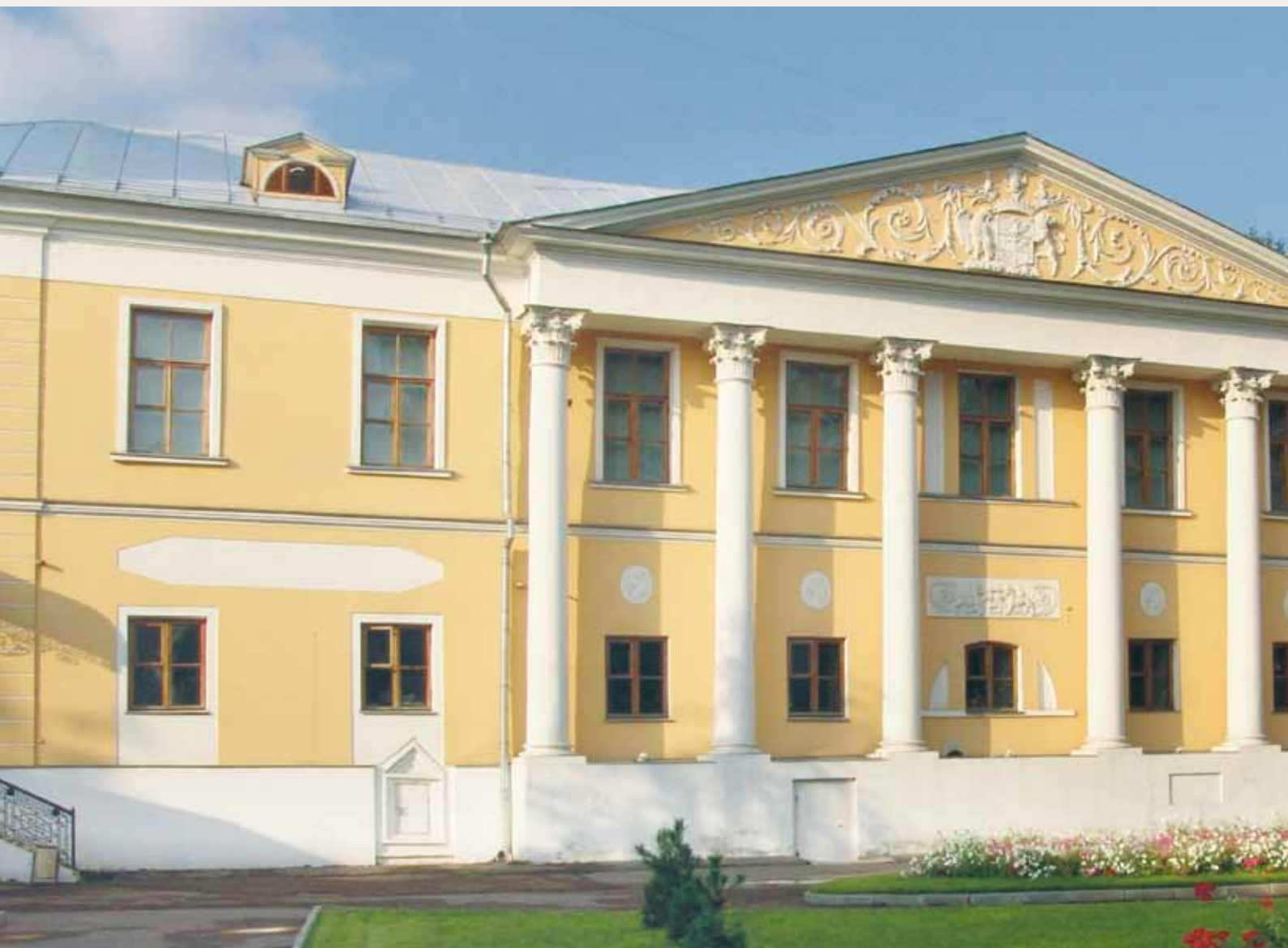
Так выглядит сегодня главное здание Усадьбы Лопухиных, где расположен Музей имени Н.К. Рериха

Мы вынуждены были подать в суд на тогдашнего премьера В.С. Черномырдина, чем возмути-