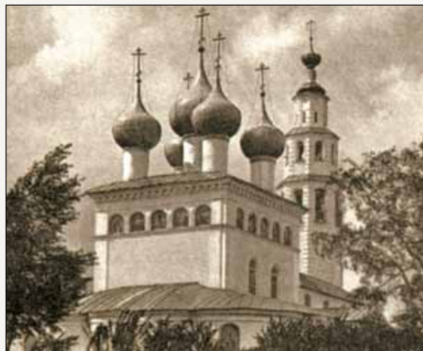
Воскресенский собор. Фото начала XX в.

Мологжане не зря рассказывали о своей родине как о райском месте. Молога славилась заливыми лугами – здешние травы, по мнению специалистов, своим качеством не уступали травам альпийских лугов. Мологское сено даже вывозилось в столицу для императорской кавалерии. А какие щедрые леса шумели в Мологском крае! Хвойные, дубовые, богатые ягодами и грибами, с многочисленным и разнообразным животным миром, многоголосьем птиц. Неслучайно Мологу стороной обходили страшные эпидемии болезней, воздух здесь был целебный. Чистейшие реки и озера, луга с медовым разнотравьем, множество