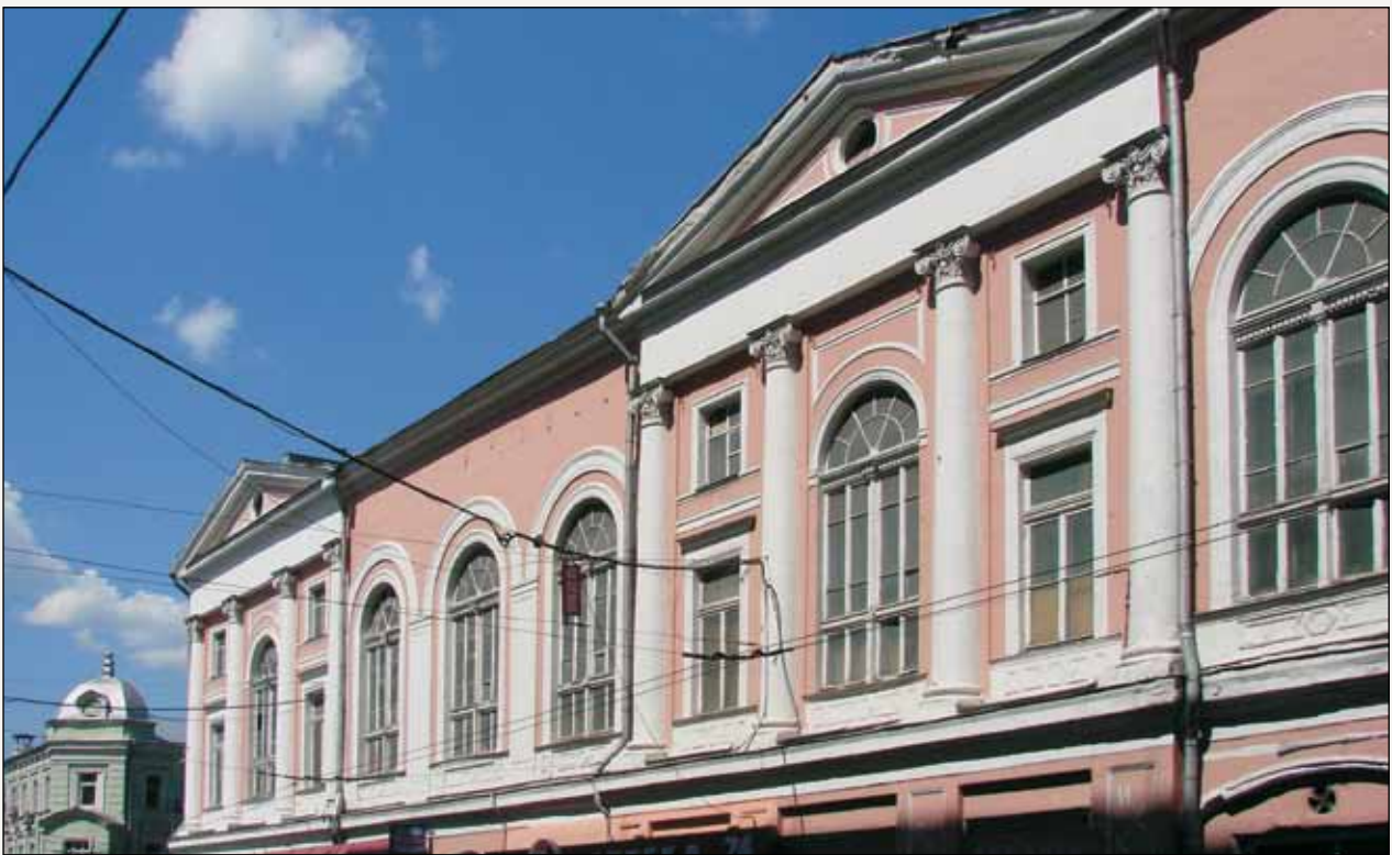
Центральный дом работников искусств. Пушкинская улица, 9. В этом здании в 1891 году К.С. Станиславский осуществил свои первые режиссерские постановки