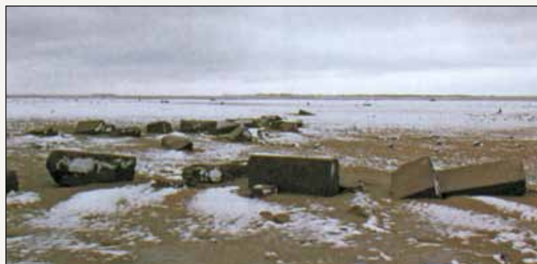
Богоявленский собор. Фото начала XX в. (вверху) На месте Богоявленского собора (внизу)