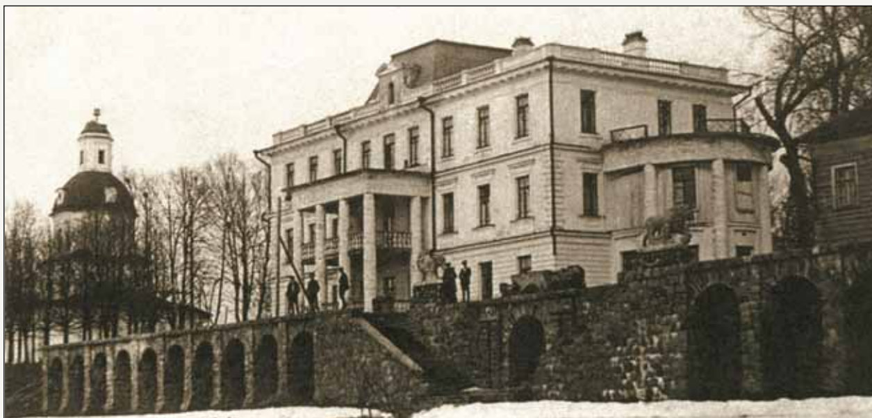
Усадьба Иловна. Фото начала XX в.

С проплывающих мимо города Мологи судов можно было любоваться храмами, которые красиво смотрелись со стороны реки. Это были Воскресенский собор и Крестовоздвиженская церковь, построенные в XVIII веке и наглядно отражавшие слитность русской храмовой архитектуры с природным ландшафтом. А в центре города располагался более поздний богатый Богоявленский собор, воздвигнутый на средства мологского купца П.М. Подосенова. Недалеко от Мологи находились два величественных, почитаемых паломниками монастыря: Афанасьевский, построенный в XIV веке, и Югская Дорофеева пустынь – монастырь XVII века, который состоял из пяти храмов и считался одним из самых крупных в Ярославско-Ростовской епархии.