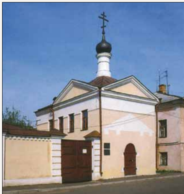
Музей Мологского края в Рыбинске

А пока шумят дискуссии, жизнь на нетронутых затоплением землях продолжает свой упрямый ход: прокладываются дороги, восстанавливаются храмы, возрождаются традиции и ремесла, строятся базы отдыха. Ведь память — это преодоление смерти. И важно, чтобы не прерывалась память о том, какой была Мологская земля. Важно, чтобы мы сохранили все, что на ней еще не разрушено, чтобы поняли самое главное — нельзя приносить природу и культуру в жертву любым, сколь угодно выгодным экономическим интересам.