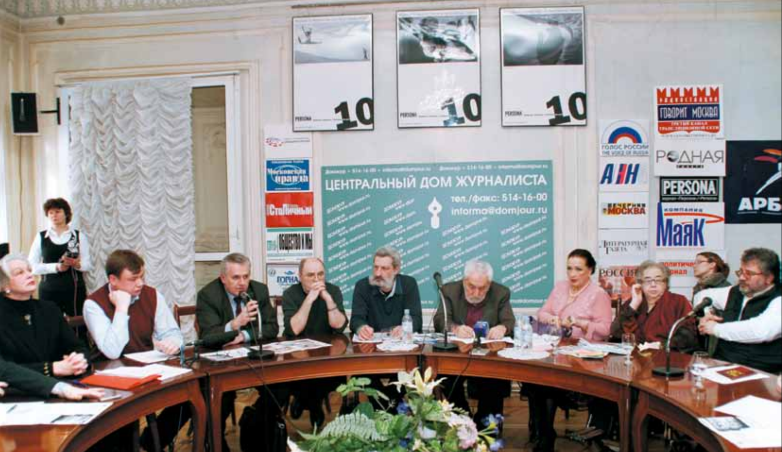
На пресс-конференции в Центральном доме журналиста. 25 марта 2008 г.