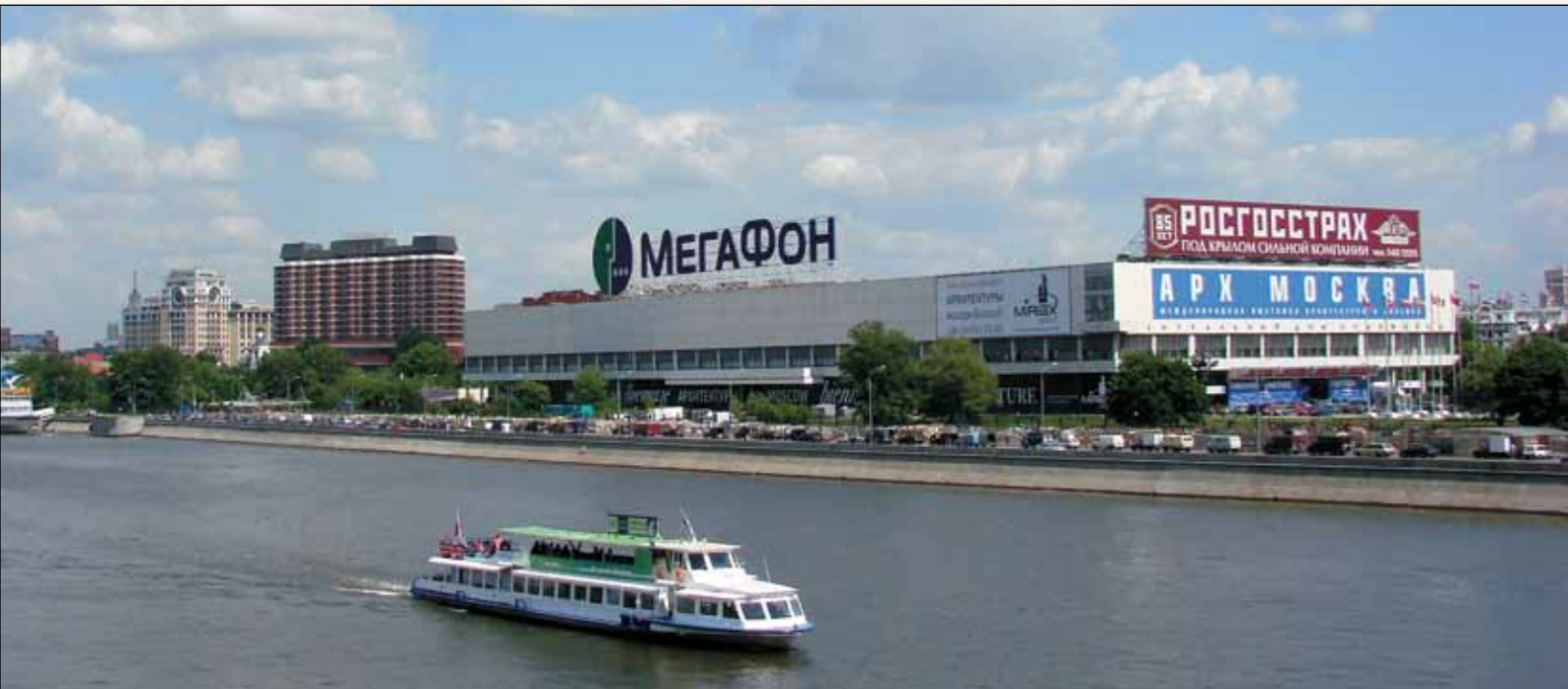
Центральный дом художника. Крымский Вал. Здание построено целиком на средства Союза художников СССР

остальные дома, где люди соединяются в покое и добре, без ненависти, – все это нужно не только нам, но и нашему государству. Невозможно вести подобную гражданскую войну!.. Ведь это же безумие! Поэтому безусловно Домам необходимо объединиться – и отстаивать свое право на культуру методами изнурительных, трудных переговоров и юридическими методами. Очень неприятно судиться, но судиться надо. Мы должны быть готовы к тяжелой, длительной осаде. Но поскольку мы люди закаленные, поскольку мы люди достаточно мужественные, поскольку мы прожили непростую жизнь – я думаю, что мы это преодолеем!»