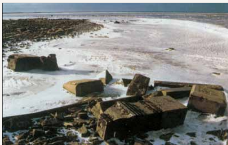
На городском кладбище

В 30-е годы прошлого века на всех крупных реках России согласно масштабным планам советского правительства строились гидроэлектростанции. И возникла идея затопить территорию между реками Молога и Шексна и устроить здесь водохранилище, обеспечивающее работу гидроэлектростанции. В сентябре 1935 года было принято постановление о сооружении Рыбинской ГЭС. По первоначальному плану Молога не попадала под затопление. Однако в январе 1937 года правительство решило увеличить мощность строящейся ГЭС с 200 до 330 МВт. Такое решение было фатальным для огромной территории и живших на ней людей: площадь водохранилища выростала