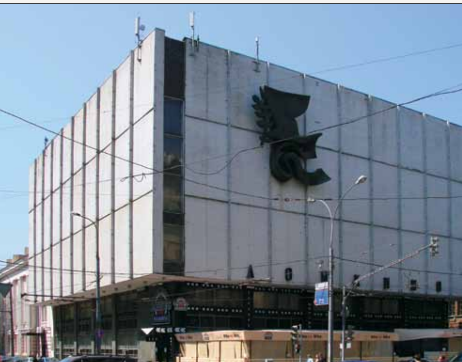
Центральный дом кино на Васильевской, 13, долгие годы остается самым любимым и престижным профессиональным клубом российских кинематографистов