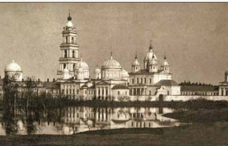
Югская Дорофеева пустынь. Фото начала XX в.

ской живописи Федор Солнцев – тоже мологжанин. Он иллюстрировал многие книги, оформлял журнал «Русская старина», под его руководством реставрировался Московский Кремль. Исторические рисунки Ф. Солнцева называли «живописной летописью Древней Руси».