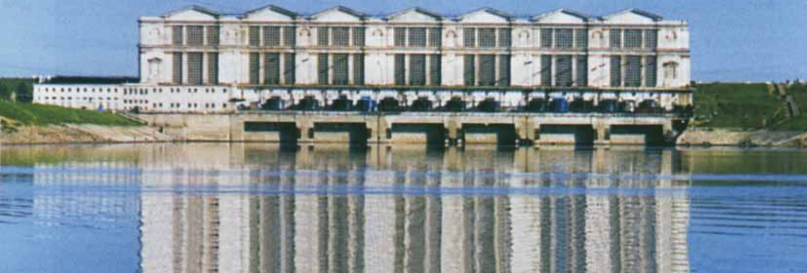
Рыбинская ГЭС. Вид на нижний бьеф

топления в этих местах. Подлинная трагедия природы!