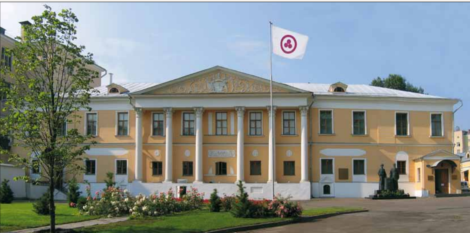
Музей имени Н.К. Рериха. Малый Знаменский переулок, 3/5