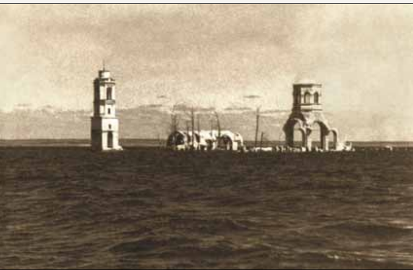
Развалины Леушинского монастыря. 1951

ми трудностями перевозили свои дома под Ярославль, Рыбинск, Тутаев. Те же, чьи дома были непригодны к перевозу, стали просто «выселенцами». Получив небольшую компенсацию за свои жилища, они вынуждены были скитаться по временным квартирам. А к весне 1941-го эвакуация людей из Мологи уже была похожа на бегство от неотвратимой беды. Дороги забиты машинами и подводами, от гибнущего города шли переполненные поезда. Саперы поспешно уничтожали большие каменные здания, чтобы потом не было помех судоходству. Некоторые из мологжан со слезами вспоминают, как взрывали Богоявленский собор. Когда раздался взрыв, весь храм поднялся на воздух, а потом опустился на прежнее место. Пришлось «добывать» его несколькими мощными зарядами.