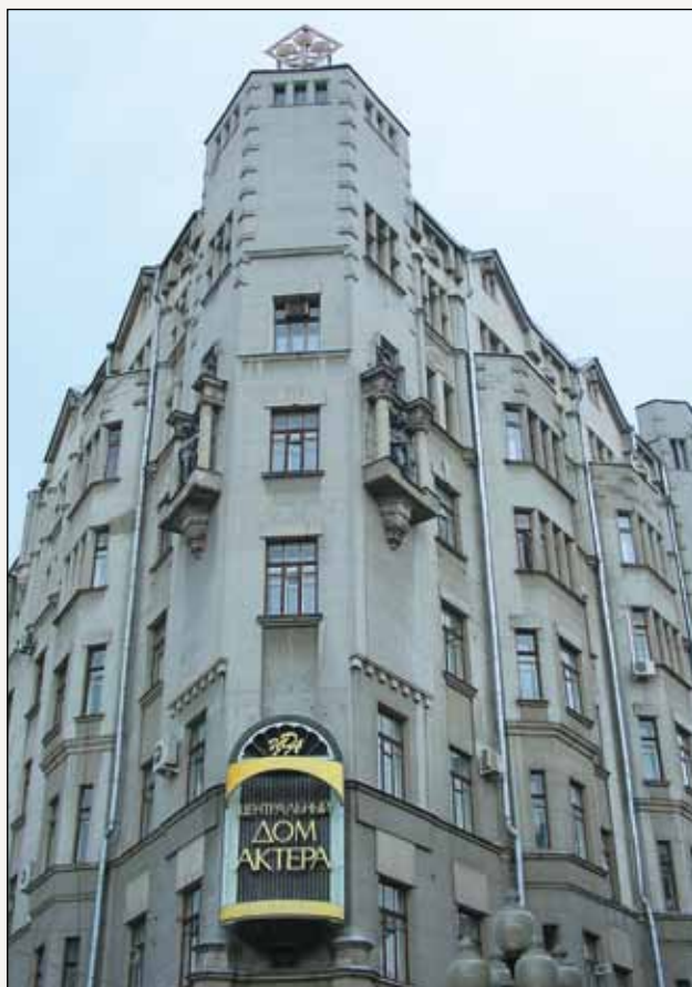
Центральный дом актера на Старом Арбате. Это тот самый «дом с рыцарями», в котором булгаковская Маргарита была окна квартиры критика Латунского