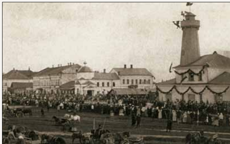
Молога. Пожарное депо. Фото начала XX века

С Мологской землей связаны имена многих известных художников, поэтов, ученых, артистов. Особенно хочется вспомнить имя выдающегося деятеля русской культуры, неутомимого собирателя и исследователя русской старины – графа Алексея Ивановича Мусина-Пушкина. Он стал издателем многих исторических произведений, в том числе «Слова о полку Игореве». Родовые усадьбы Мусиных-Пушкиных – Иловна и Борисоглеб – были настоящим украшением Мологской земли. И еще одно известное имя. Замечательный русский художник-изограф, академик историче-