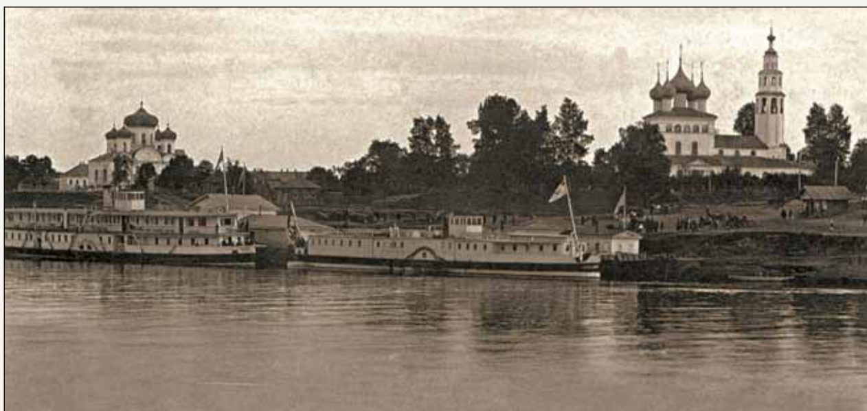
Вид на Мологу и пристань со стороны Волги

съезжались русские, восточные и европейские купцы. Здесь горожане представляли богатую продукцию местных промыслов. Особо славилось в Мологе маслосыродельное производство. Девяносто процентов всего производимого в Ярославской губернии масла делалось именно под Мологой, и отправлялось оно даже в Лондон. В XVII веке Молога была отнесена к дворцовым посадам и поставляла к царскому столу судаков, осетров, стерлядей. В XVIII веке по указу Екатерины II Молога получила статус города и герб. Город удостоился посещения русские цари – Павел I и Николай II. К началу XIX века Молога ежегодно пропускала через свои пристани до семи тысяч судов из нижних поволжских губерний. Роль Мологи как основного транзитного пункта между Владимиро-Суздальской землей и Новгородом Великим была значительна, потому что здесь шла перегрузка с волжских судов глубокой осадки на плоскодонные суда. Причем строились эти малые суда прямо в Мологе, а начало судостроительному промыслу положил, по преданию, Петр I.