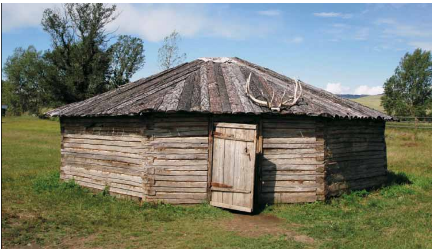
Гостевая юрта Хакасского национального музея-заповедника

только как страна каменных пирамид (све) и земляных пирамид (курганов), но и как страна деревянных пирамид (юрт).