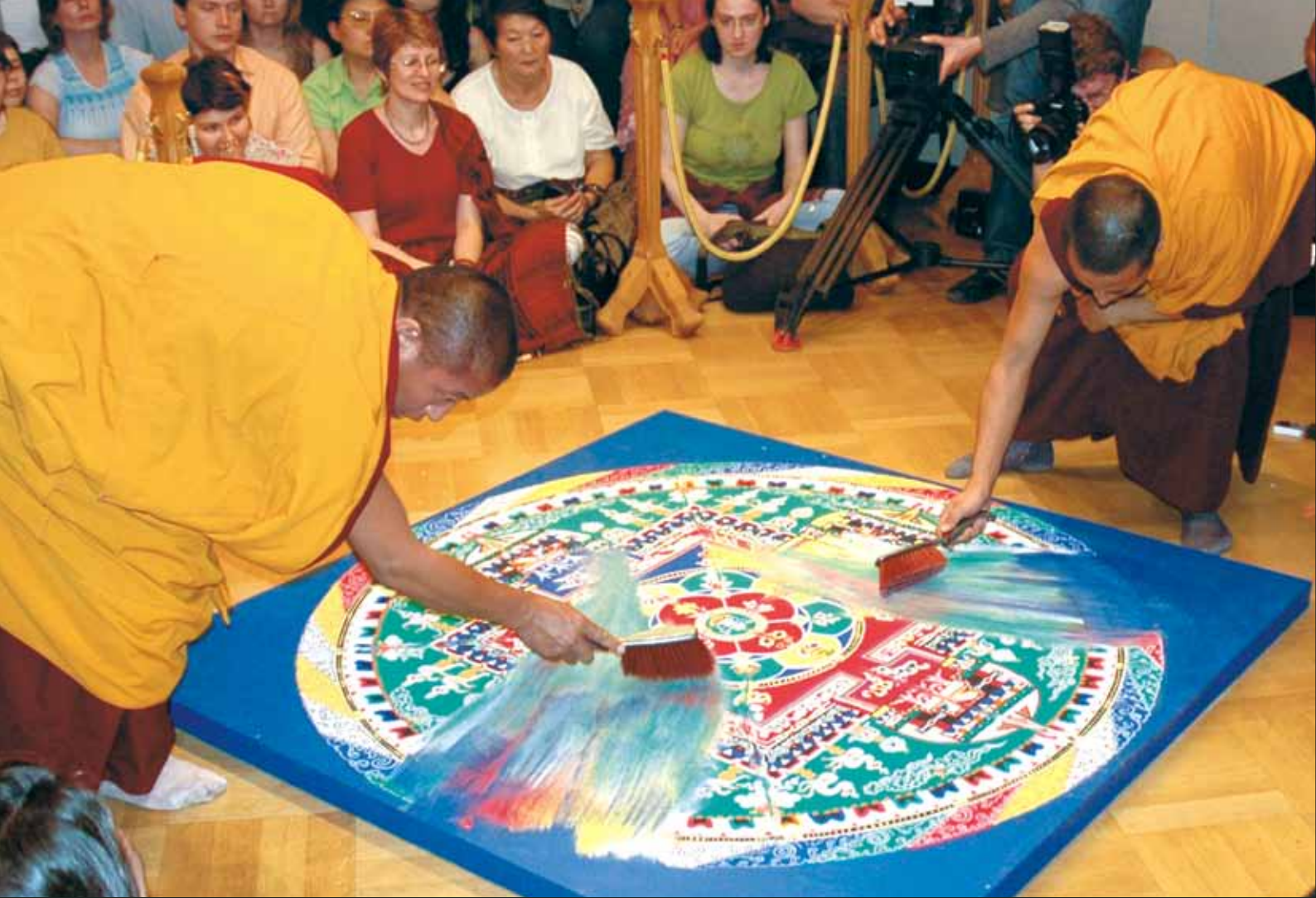
Щеточками аккуратно сметается драгоценный мраморный песок

входом в большинство буддийских храмов и связана с легендой о том, что первыми свидетелями Просветления Будды стали две лани. На мифологическом уровне образы лани и оленя всегда связаны с идеей перехода из одного мира в другой – из непросветленного состояния в просветленное (в легенде), из менее сакрального пространства в сакральное (в храм).