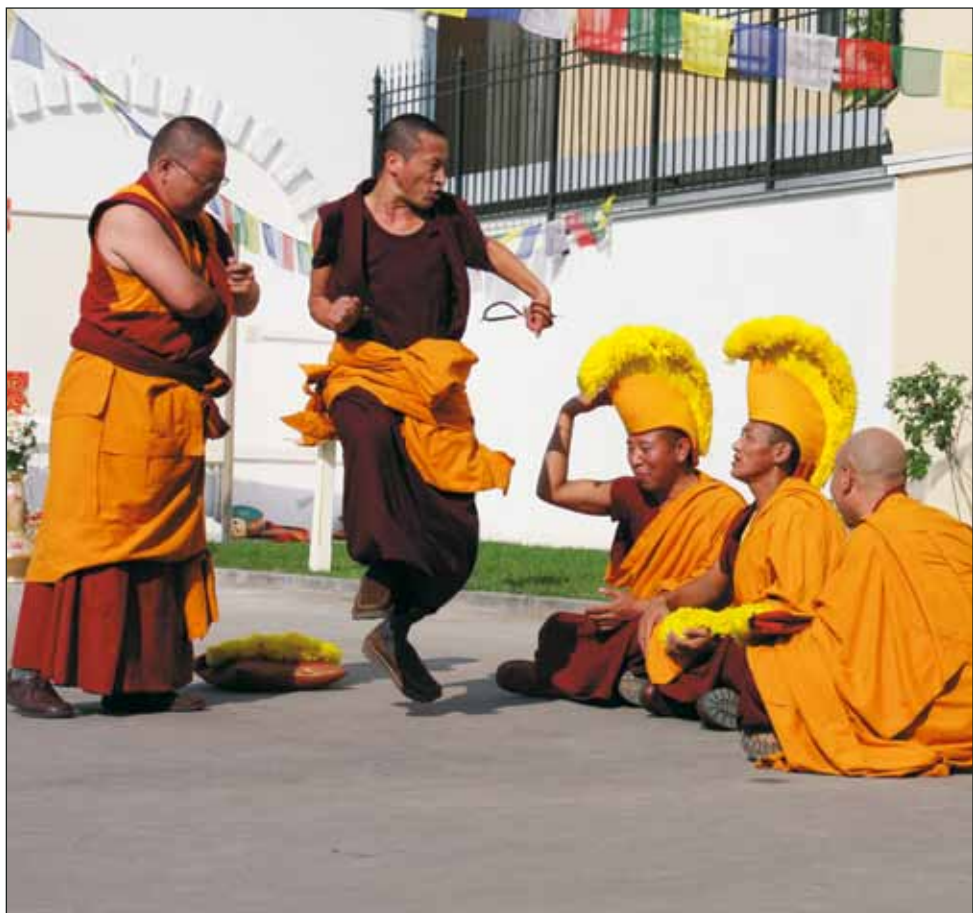
Ученики-монахи показывают традиционный философский диспут ▶

Итак, полное Просветление может быть достигнуто только на Пути без Учения, что в структуре ступы означает шпиль.