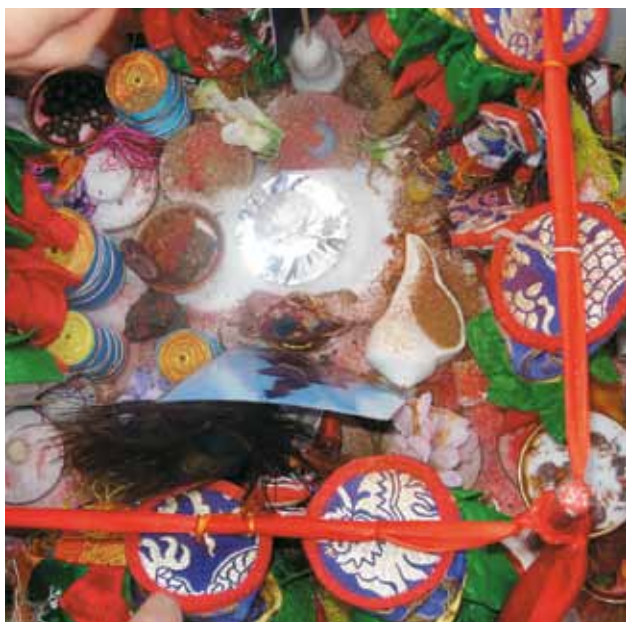
Второй уровень ступы в круглой части. Алмаз, рулоны с молитвенными текстами, статуя Будды Амитаюса, подаренная Его Святейшеством Дуджомом Ринпоче, различные виды подношений