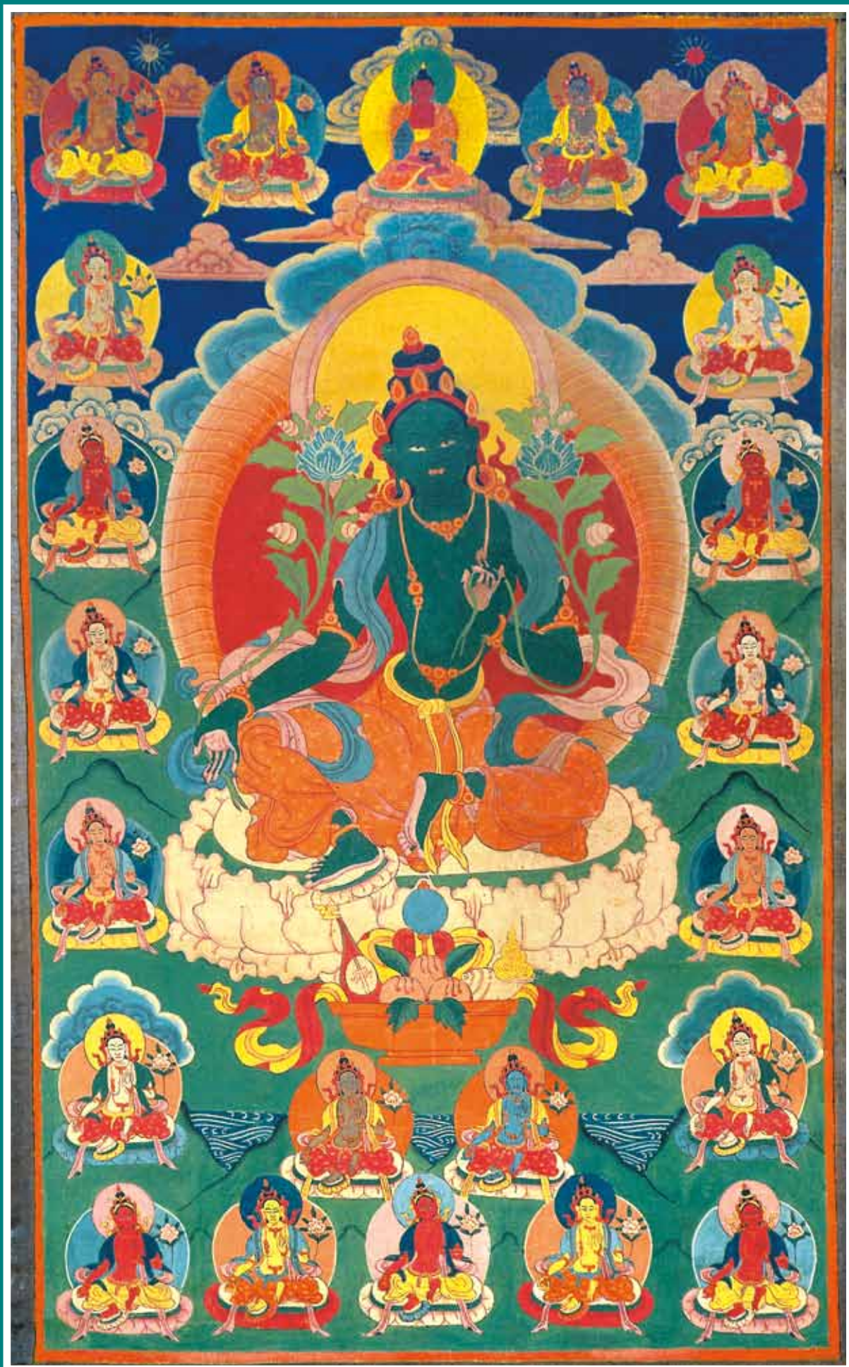
Двадцать одна форма Зеленой Тары. Тханка из коллекции Музея имени Н.К. Рериха