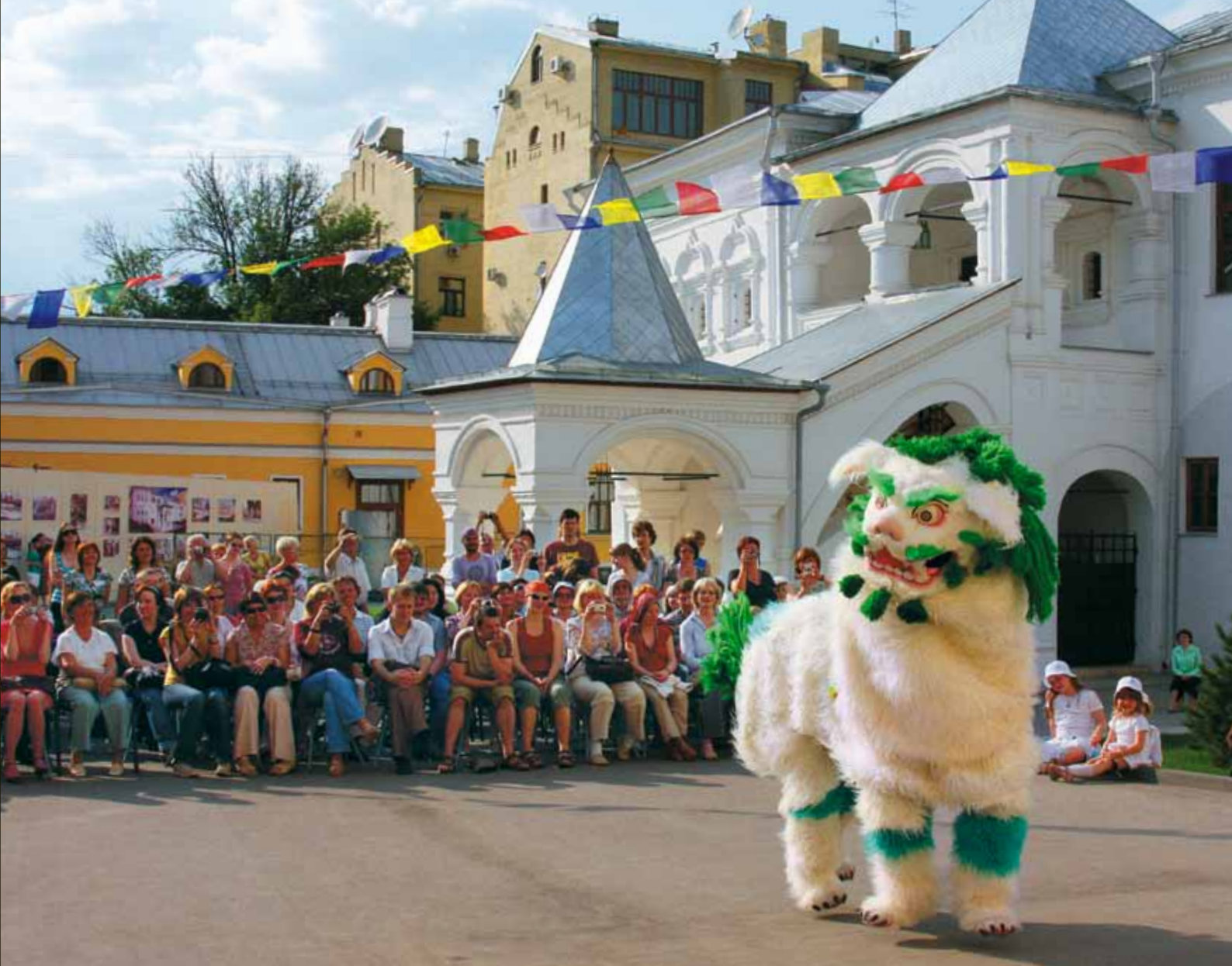
Полюбившийся всем танец снежного льва – благожелание здоровья и мира

Его тринадцать колец символизируют Десять Сил – десять аспектов мудрости Будды и Три существенных воспоминания (знание трех времен – прошлого, настоящего и будущего). Над шпилем расположен зонт, один из восьми благих символов.