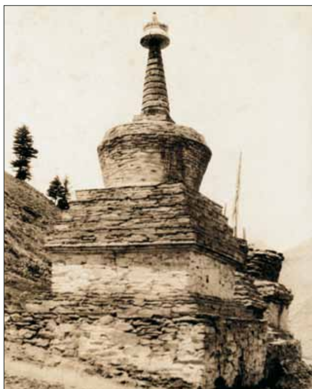
Ступа. Ладак, 1925.

Ступа (тиб. «чортен», монг. «субурган») – это буддийское мемориальное сооружение, символизирующее просветленное сознание Будды. Ступы – древнейшие памятники буддийско-