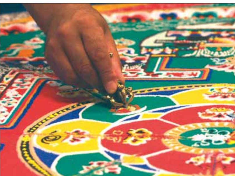
Надрез ваджрой. Так разрушают прекрасную мандалу...

Об этом же, только другими словами, говорил почетный гость фестиваля Верховный лама Калмыкии Тэло Тулку Ринпоче: монахи вкладывают много труда, много душевных сил, чтобы создать мандалу, но процесс разрушения ее занимает у них несколько секунд. «Пока мы живы, – сказал он, – у нас есть возможность создавать благоприятную атмосферу, поддерживать мир, делиться своей любовью, и это именно то, чему учат все мировые религии».