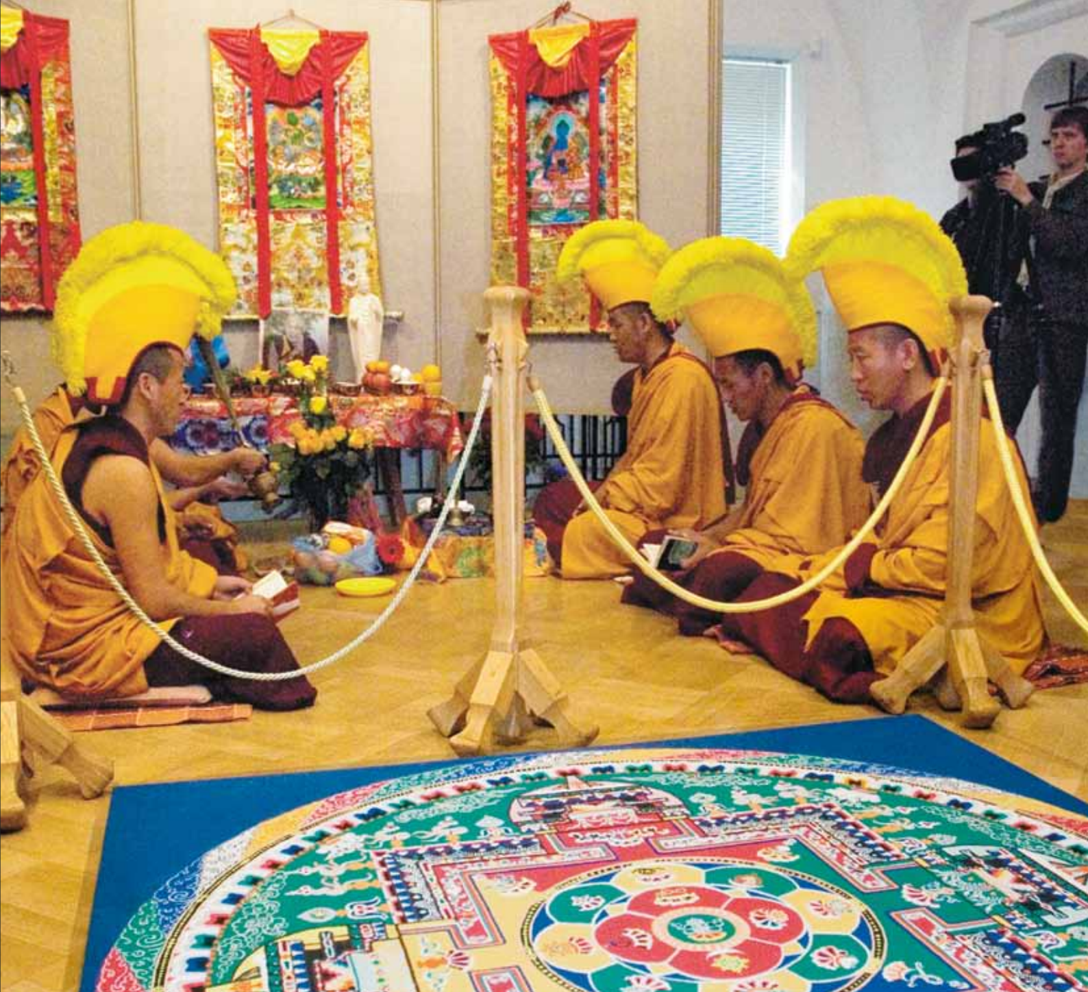
Молитва сопровождала мандалу все дни

деятельность для других лишь тогда эффективна, когда ее результатом становится твое собственное продвижение по пути Духа.