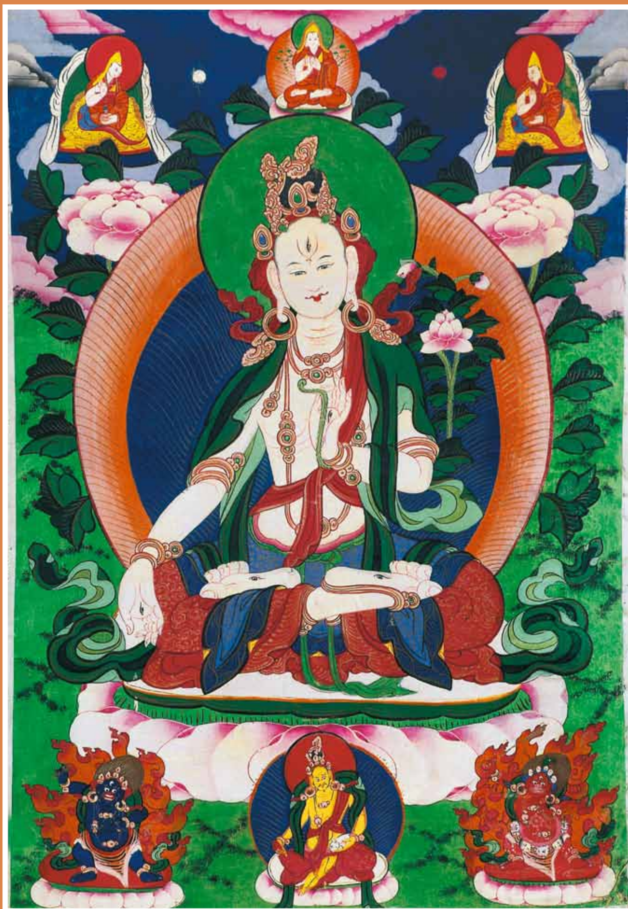
Белая Тара с окружением. Собрание Музея имени Н.К. Рериха