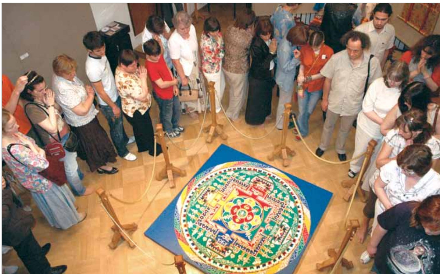
Мандала построена. Теперь у нас есть возможность созерцать ее красоту...

Следующий уровень мандалы – дворец. Принцип его построения очень характерен для традиционного искусства. Он называется «развертка»: объект изображается одновременно с максимального числа сторон, подобно детской игрушке-самоделке, предназначенной для склеивания. Мы видим четыре входа во дворец, увенчанные башнями. Над каждым входом изображены Колесо Закона и две лани: такая группа находится над