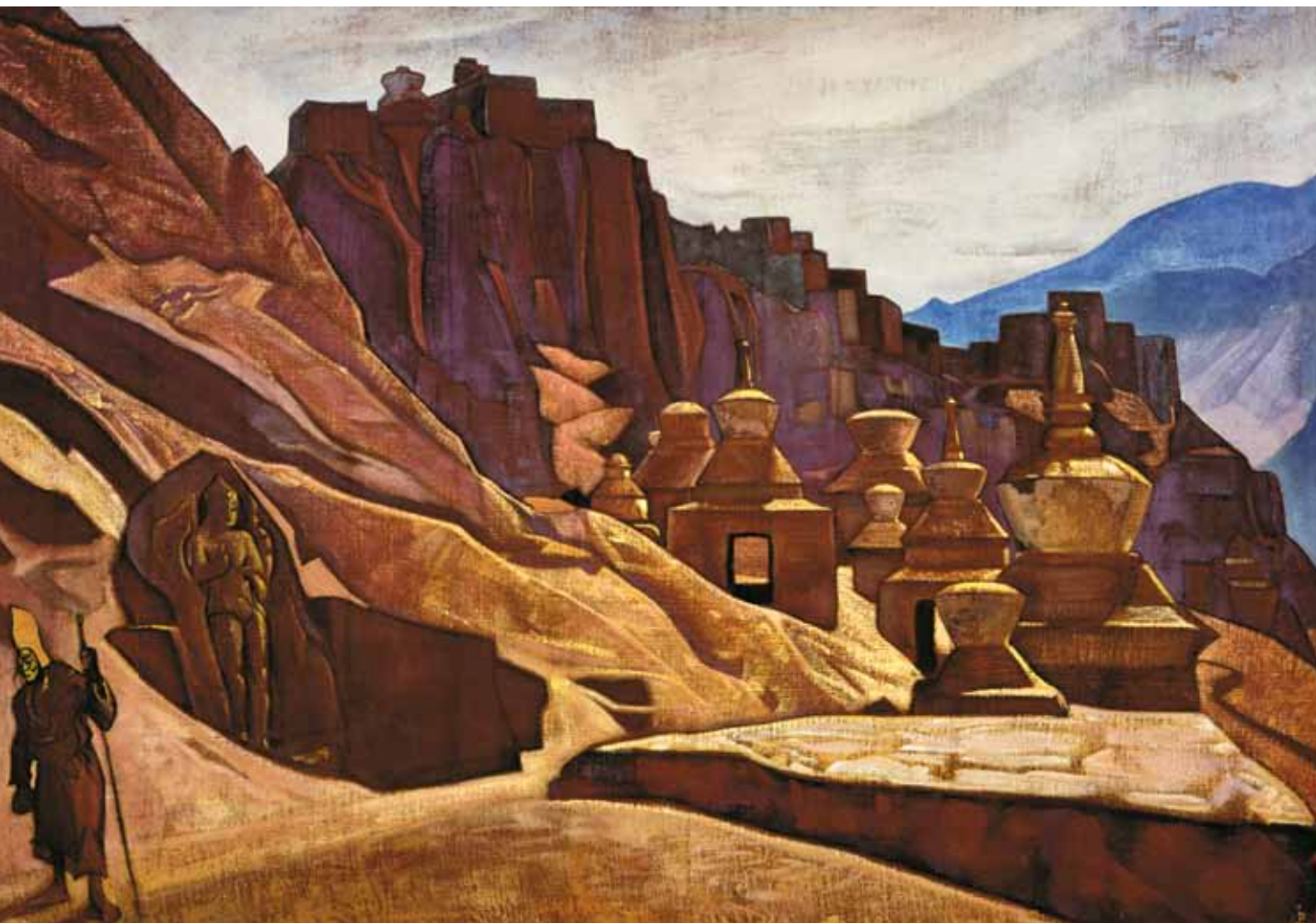
Н.К. Рерих. Твердыни стен (Монастырь Бон-по) . 1925–1926

дилась в конце 1950-х годов – стараниями выдающегося востоковеда Юрия Николаевича Рериха.