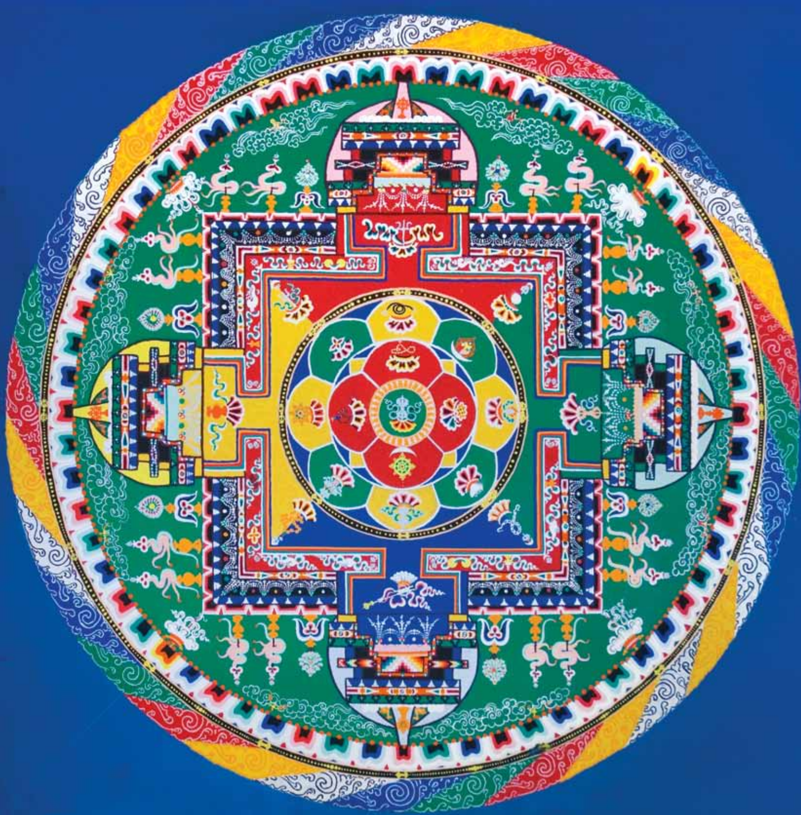
Мандала Зеленой Тары

ней: бирюзы, яшмы, малахита, жемчуга, кораллов. Сейчас, увы, монахам приходится довольствоваться мраморной крошкой, которую они окрашивают в разные цвета. Но пусть и из более скромных материалов – нынешние мандалы все равно поражают своим великолепием!