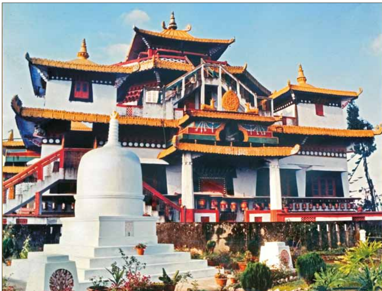
Ступа на месте кремации Е.И. Рерих. Калимпонг. Восточные Гималаи. Индия