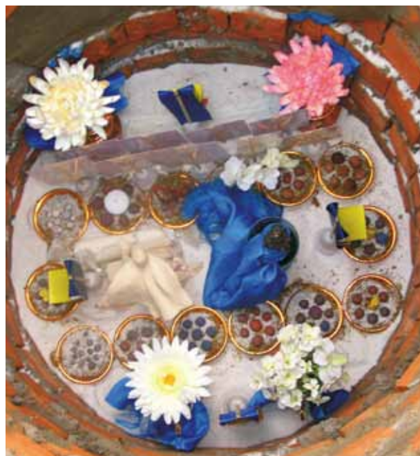
Самый нижний уровень ступы в круглой части. Ваджракилая (алмазный кинжал – драгоценный защитник буддизма), статуя «Защитник» (автор – А. Леонов), фильбу – глиняные шарфики с драгоценными реликвиями святых учителей

Ступа Просветления – важнейшая из всех восьми видов ступ, соответствующих восьми важнейшим эпизодам в жизни Будды. Она символизирует цель буддийского пути – полное освобождение от всех человеческих страстей, от всего, что препятствует избавлению от страданий. Одновремен-