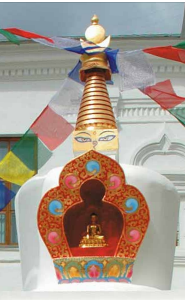
Будда, сидящий в позе касания земли

тая ступенька над тронem обозначает Пять Способностей на Пути Соединения: доверие, усердие, внимательность, медитативную концентрацию и мудрость.