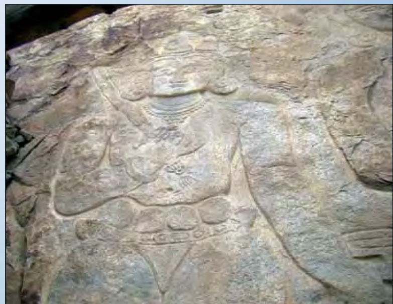
Изображение Будды Манчжушри (слева от Майтрейи). Деревня Тифит

Вторая группа должна была пройти оставшуюся часть индийского маршрута Центрально-Азиатской экспедиции от Леха до местечка Панамик. Прежде всего нужно было найти начало этого пути в самом Лехе. Николай Константинович достаточно детально описал его в своих путевых заметках: «Прошли мимо пруда, где, по преданию, впервые учил Исса. Влево остались доисторические могилы, за ними – место Будды, когда древ-