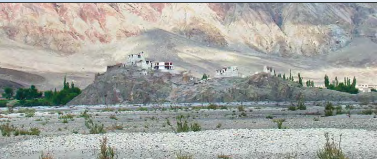
Монастырь Гури. Долина реки Нубры, Ладак

постепенно поднимающимся в гору вместе с ущельем, то удаляясь от него. Автомобильный перевал лежит в стороне от глетчера, который преодолела экспедиция Рерихов, но и с дороги хорошо видно, как круто в гору приходилось забирать караванам. Спускаясь с перевала, дорога петляет серпантином, и на одном из поворотов глетчер снова открывается, но уже с другой стороны.