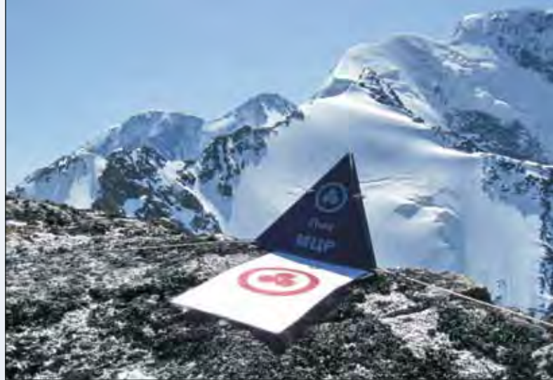
Памятный знак на пике МЦР