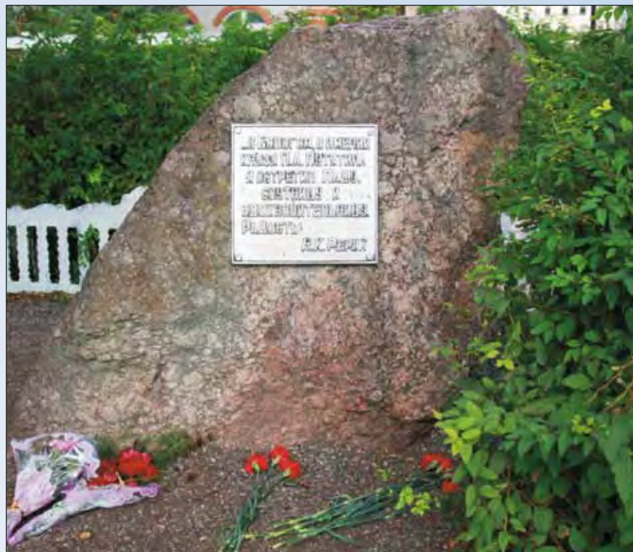
Камень Любви в Бологом

Два вечно стремящихся друг к другу Начала, две космические энергии, рождающие, созидющие, – тема любви богато и разнообразно раскры-