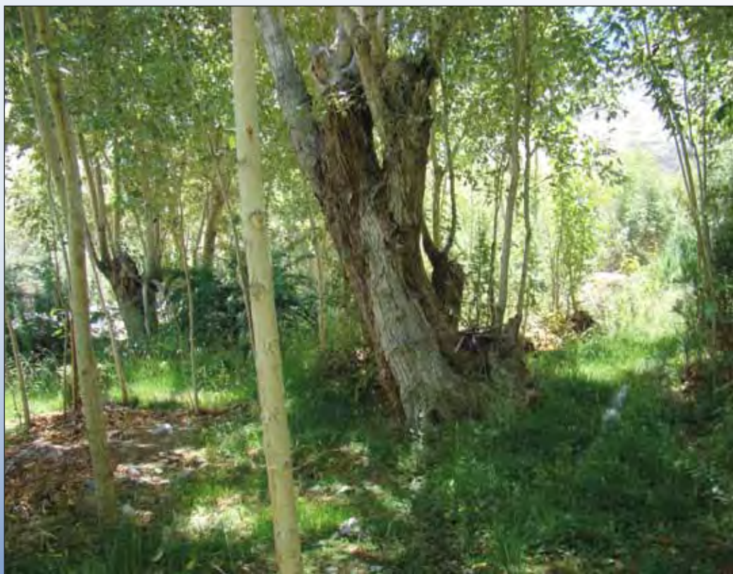
Место остановки Центрально-Азиатской экспедиции Н.К. Рериха близ селения Кхалсар

Дальше лежала запретная для туристов и исследователей зона. Но путевые дневники Рерихов ведут нас сквозь любые преграды, а хождение по вехам Рерихов наполняет теми острыми впечатлениями действительности, которые оживляют, делают предметными описания Рерихов, позволяют проникнуться духом их путешествий, заглянуть в прошлое и прикоснуться к тому непреходя-