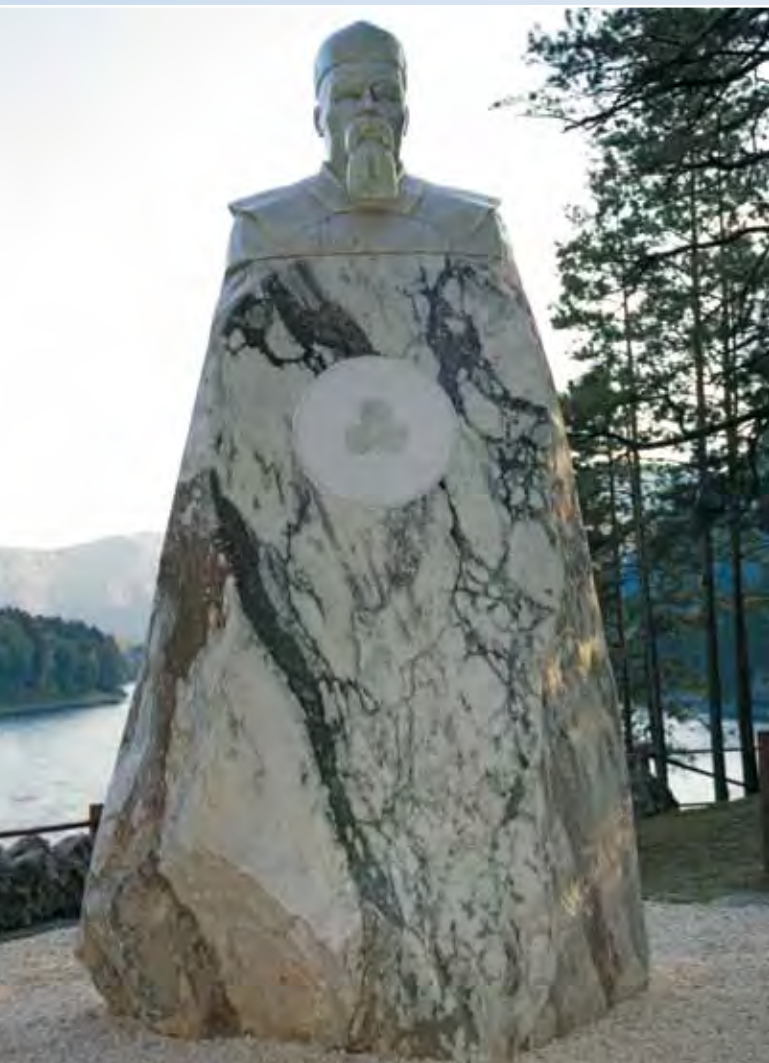
Памятник Н.К. Рериху

Парад станет творческой экспедицией, которая пройдет по местам, связанным с жизнью и деятельностью выдающихся людей, внесших значительный вклад в дело укрепления дружбы между народами Индии и России. Это Афанасий Никитин, Махатма Ганди и Лев Толстой, Николай Рерих и Рабиндранат Тагор, Джавахарлал Неру и Радж Капур. География творческой экспедиции широка: от Алтая через Тьверь, Тулу и Москву к Санкт-Петербургу.