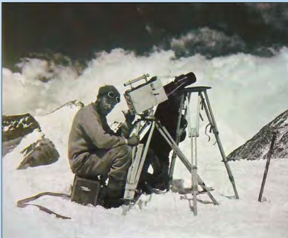
Британская экспедиция на Эверест. 1921