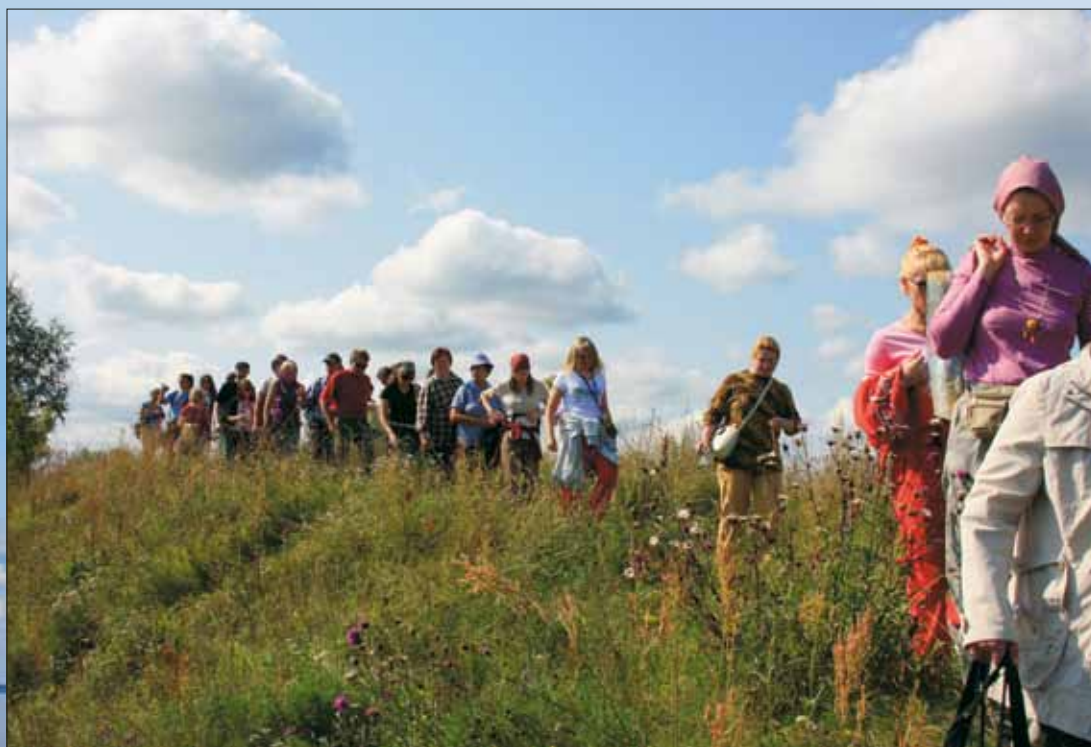
Участники похода направляются к озеру Пирос