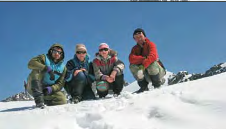
На пике Учителя

тогор» (1938), «Победа (Змей Горыныч)» (1942) и др. На всех этих картинах легендарная гора представлена в юго-западной экспозиции.