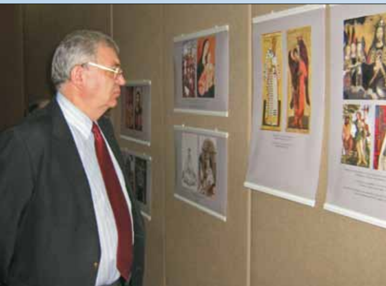
Фотовыставку посетил посол РФ в Мексике В.И. Морозов

На выставке побывало свыше 1000 участников конференции и посетителей музея, они высоко оценили и саму экспозицию, и деятельность МЦР по популяризации творческого наследия семьи Рерихов в разных странах мира и единодушно признали, что идеи Н.К. Рериха об охране культурного наследия востребованы в наши дни. «Истинно, человечество устало от разрушений, вандализма и отрицания» 3 , – писал Николай Константинович