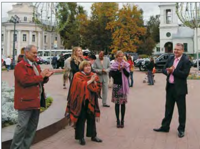
Тверь принимает гостей