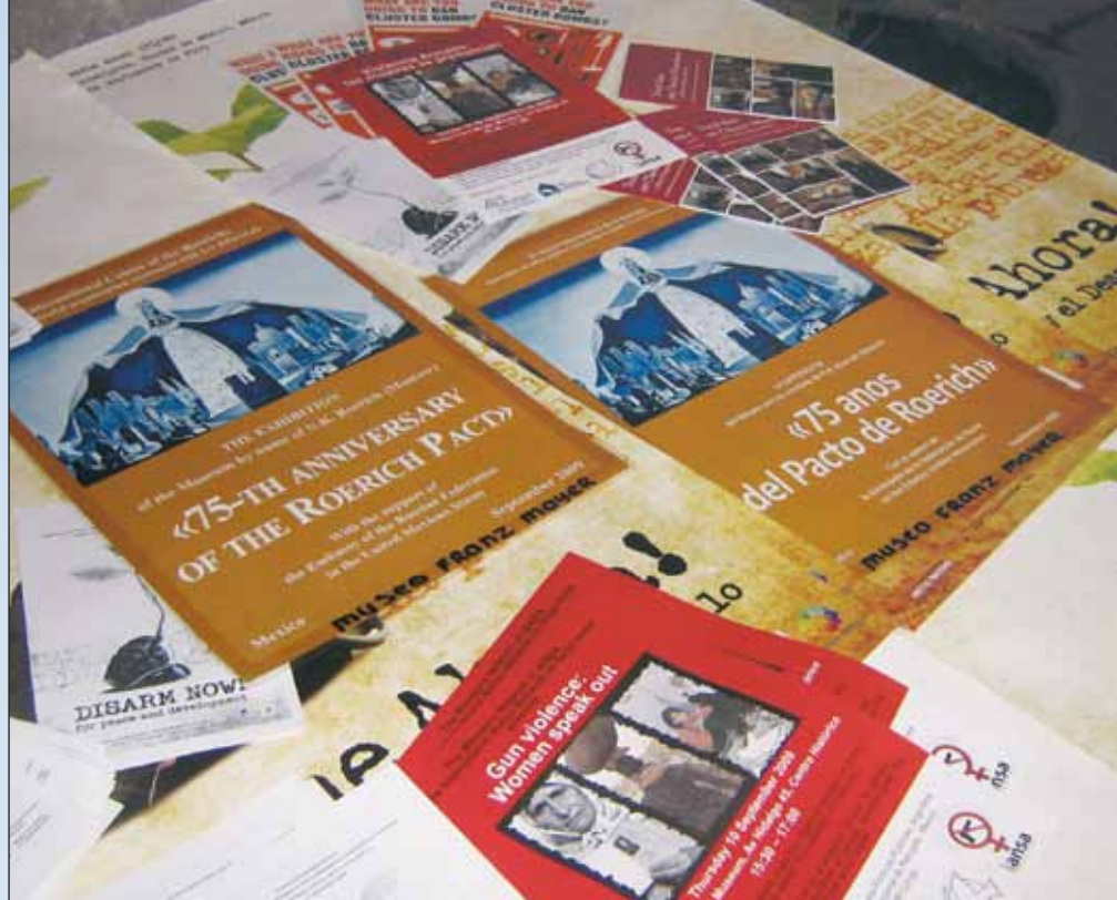
Афиши фотовыставки «75 лет Пакту Рериха» на английском и испанском языках

В течение трех дней участники конференции обсуждали самые острые и насущные вопросы, связанные с необходимостью принять срочные меры по предотвращению вооруженных конфликтов. Предлагались варианты решения проблем разоружения и ограничения распространения ядерного оружия, звучали мысли о том, что настало время перейти от лозунгов и воззваний к миру и разоружению к долгосрочным образовательным и культурно-просветительным программам, которые позволили бы формировать сознание подрастающих поколений на основе понимания фундаментальных ценностей человечества, уважения прав и духовных основ разных народов. Свою