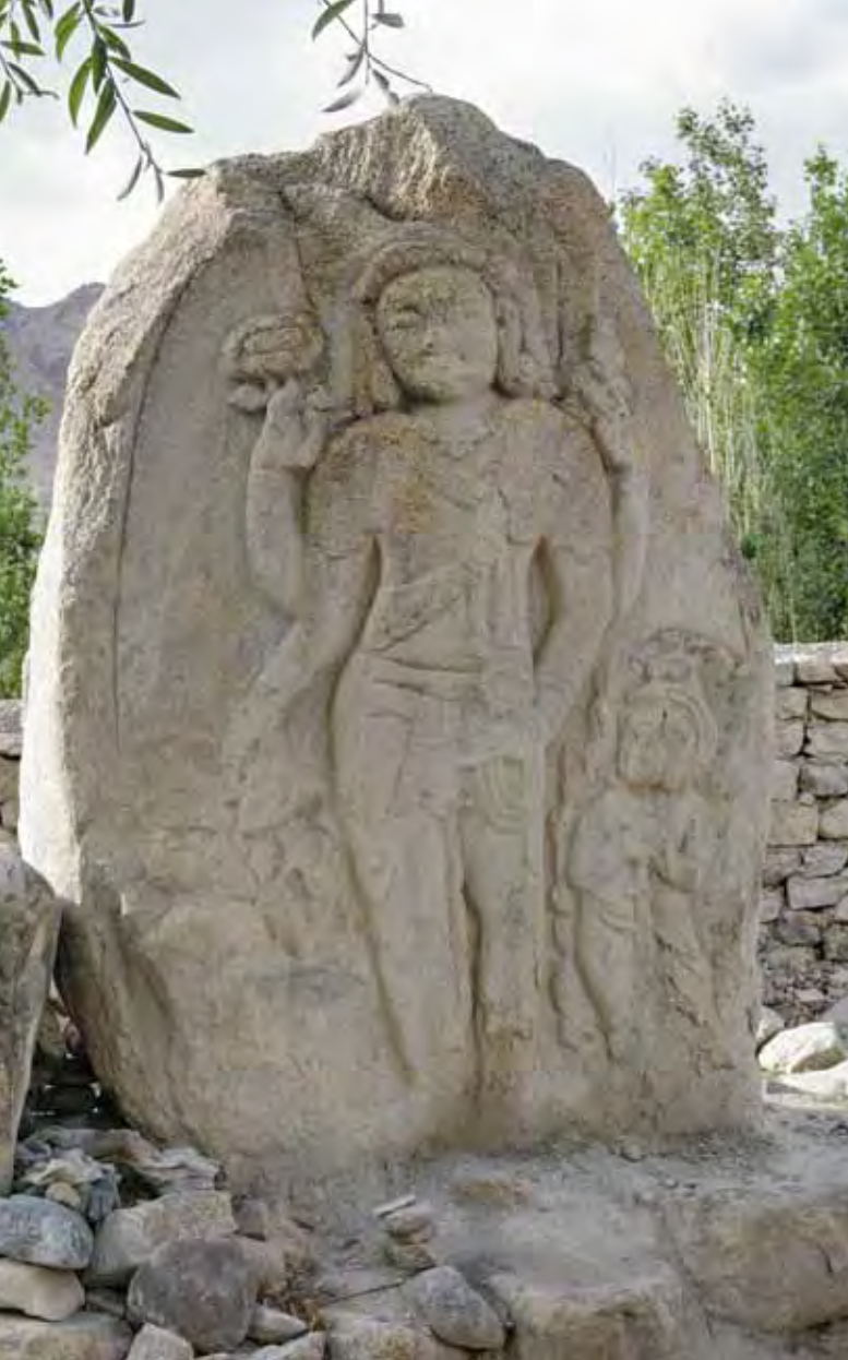
Барельеф Майтрейи в Ле. Ладак