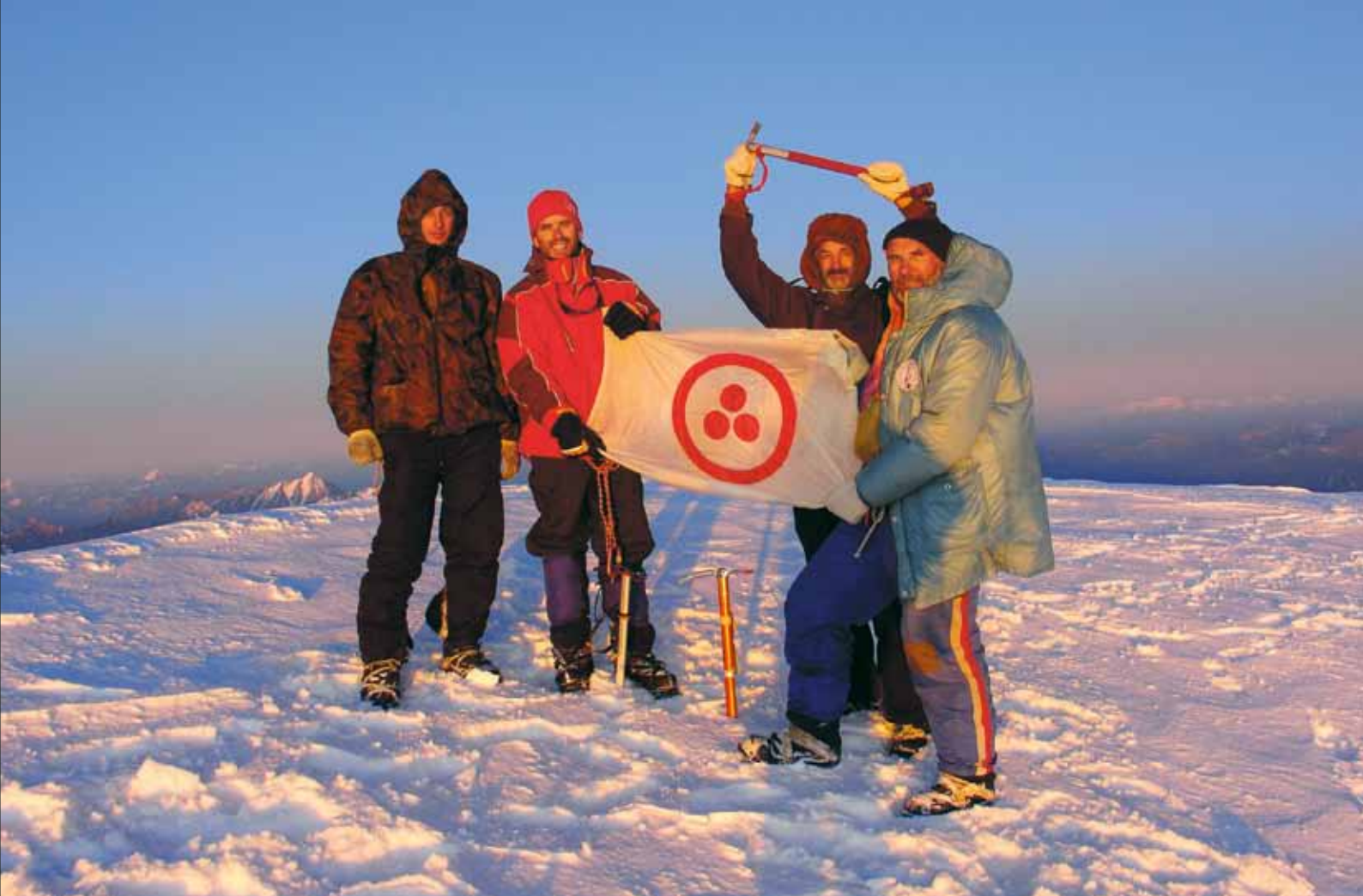
Знамя Мира на восточной вершине Белухи