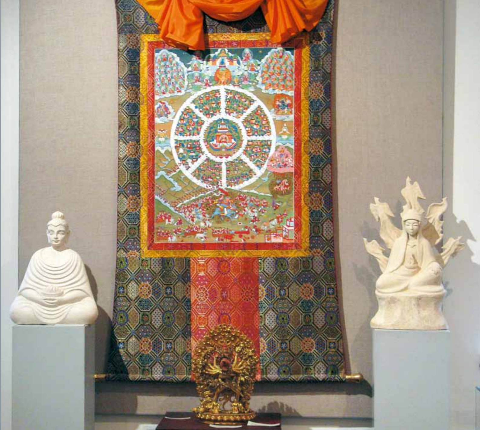
«Будда с пламенной чашей» (2003) и «Огненные мысли» (2007) в выставочных залах Музея имени Н.К. Рериха

натуры Елены Ивановны, вместившей в себя чистоту помыслов и высокое чувство ответственности за свои поступки, самоотверженное служение идеалам.