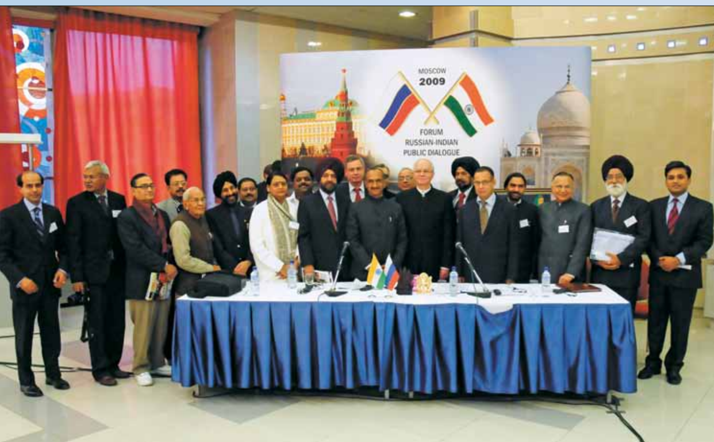
Участники форума «Российско-индийский общественный диалог». Москва, 18–19 ноября 2009 г.

Около 200 индийских и российских специалистов, экспертов и чиновников высокого ранга приняли участие в форуме, в их числе заместитель министра иностранных дел РФ А.Н. Бородавкин, заместитель министра культуры РФ А.Е. Бусыгин, член Индийского парламента, президент Делийского комитета партии Индийский национальный конгресс Агарвал Джай Пракаш, секретарь партии Индийский национальный конгресс Алка Ламба и многие другие. Более 90