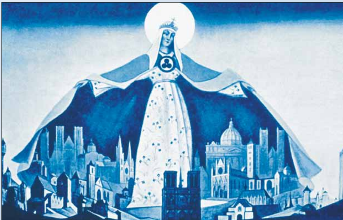
Н.К. Рерих. Мадонна Защитница (Святая Покровительница). 1933

кации, и скоро с ними можно будет познакомиться в полном объеме.