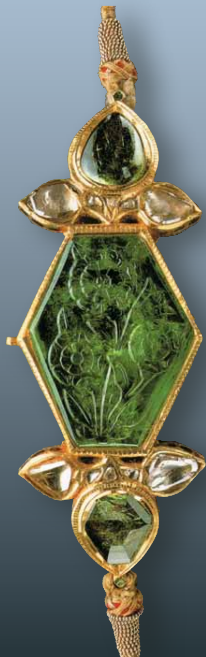
Браслет на плечо (Базубанд). Золото, выемчатая эмаль, резной изумруд и алмазы

ных культур рождались новые формы, новые эстетические идеалы» 4 .