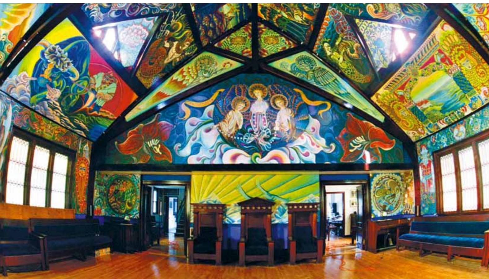
Зал чудес Музея современного Возрождения. Бостон

Первое, что обращает на себя внимание, – колорит картин. На смену прежнему празднику красок пришла суровая гамма коричневых, синих и сероватых цветов, тонов древних резных камней. И – облики героев: если раньше стилистика была отчетливо славянской, то теперь это узна-