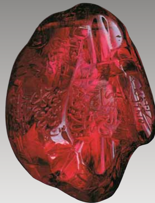
Шпинель с царской надписью («Рубин-Балэ»). Надписи: Тимурид, Улугбек (до 1449 г.), Великий Могол, Шах-Джахан (не датирован). Вес 249,3 карат

Предназначение камней в разное время было различным. Они могли быть предметами религиозных культов и просто украшениями, пере-