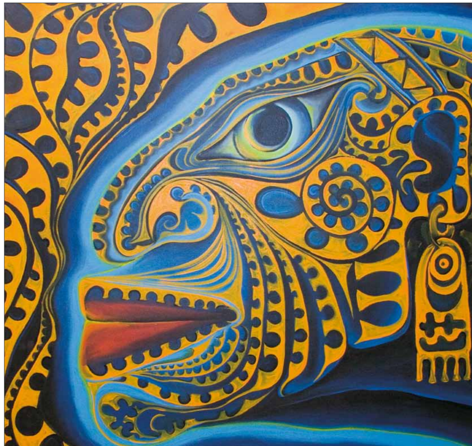
Вождь догонов. 2008