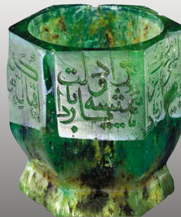
Миниатюрная чашечка с персидскими стихами. Вырезана из изумруда. Вес 252 карата

С момента окончания войны, с 2000 года, судьба коллекции – это непрерывающееся турне по миру с целью активизировать возврат похищенных ценностей и собрать средства на восстановление здания Национального музея Кувейта. Выставка «Сокровищница мира. Ювелирное искусство Индии эпохи Великих Моголов» демонстрировалась во всех ведущих музеях мира: Британском музее, Метрополитен-музее, Музее изобразительных искусств в Хьюстоне, Королевском дворце в Мадриде, Лувре, в Музее исламского искусства в Берлине. Экспозицию посетили сотни тысяч зрите-