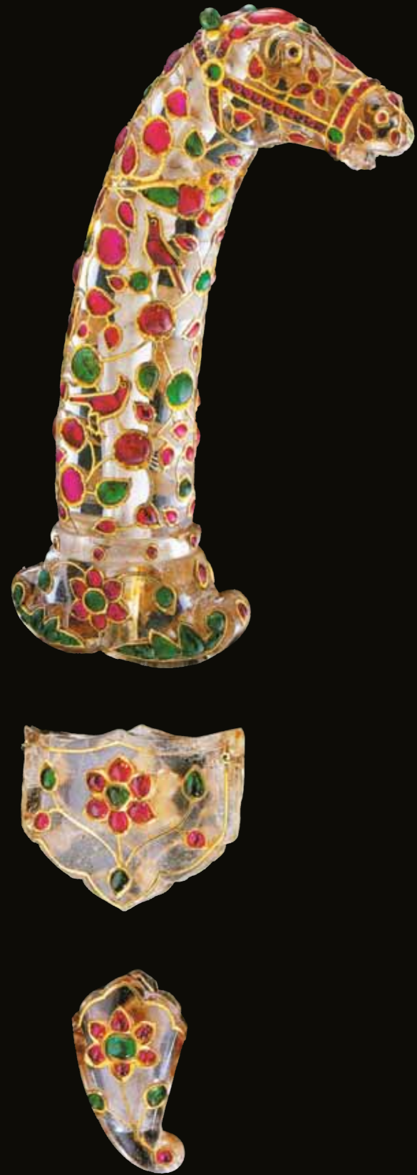
Рукоять кинжала, устье и наконечник ножен. Вырезаны из горного хрусталя; инкрустированы золотом в технике кундан; украшены рубинами, изумрудами и многослойным агатом