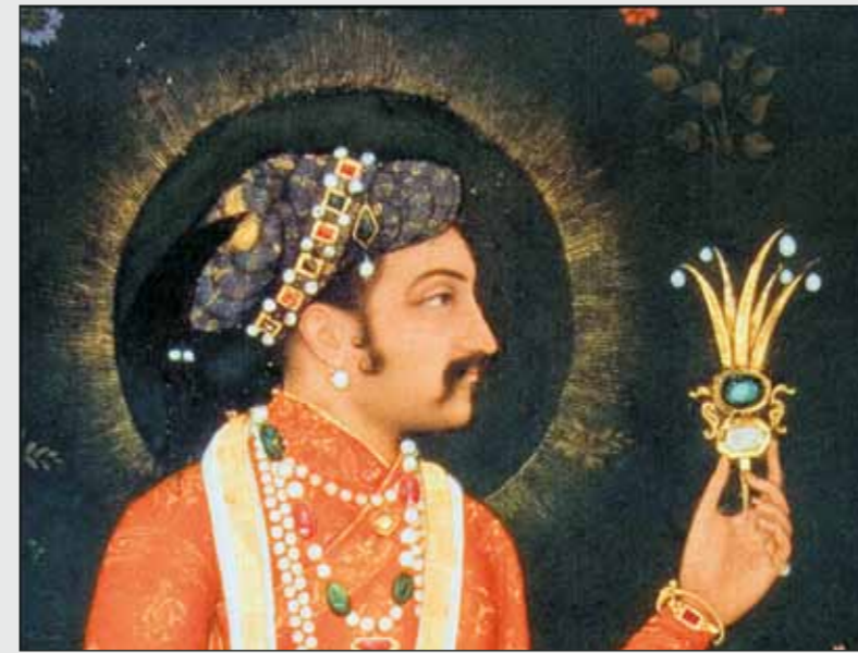
Шах-Джахан (годы правления 1628–1657). Миниатюра. Метрополитен-музей

в изделии. По мнению специалистов, кольца с таким большим числом бриллиантов, абсолютно идеально подобранных по форме и размеру, позволяют говорить о том, что выбор драгоценных камней у придворных ювелиров был очень велик. Возможно было подобрать какие угодно кристаллы для создания поистине сказочных произведений ювелирного искусства Востока.