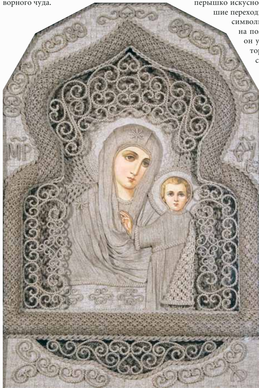
Икона «Богоматерь Казанская»