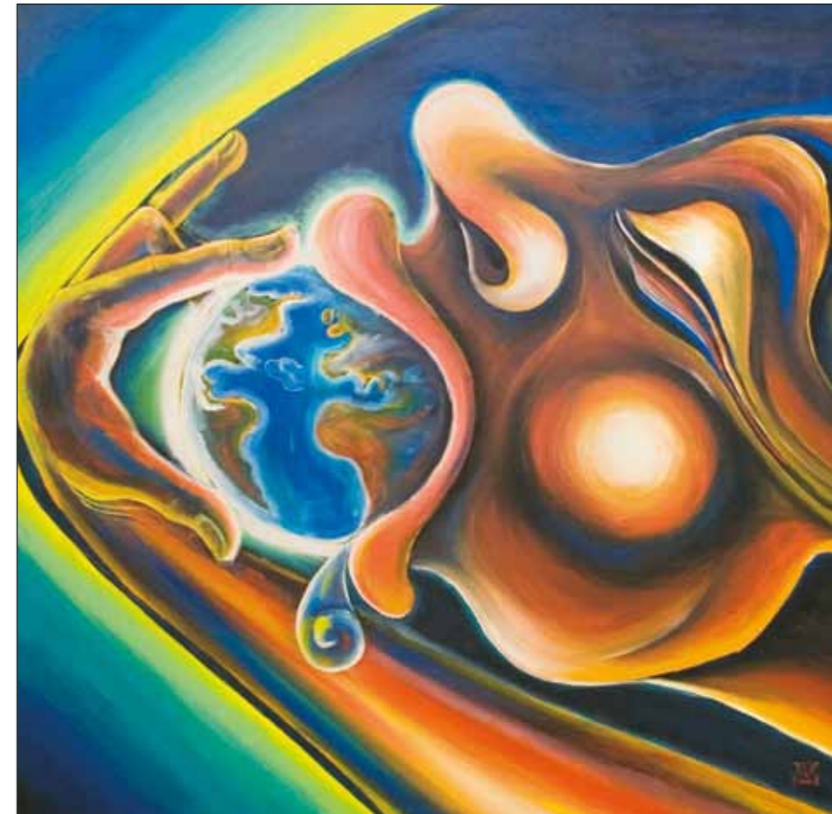
Ева, пожирающая Землю. 2008