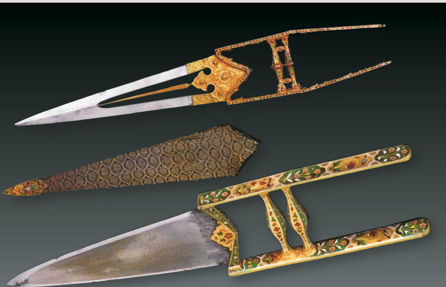
◀ Кинжалы катар и ножи с наконечником. Украшены рубинами, изумрудами и алмазами

А буквально через год-два коллекция наконец вернется в Кувейт, и на этом всемирное путешествие сокровищ, будем надеяться, благополучно завершится.