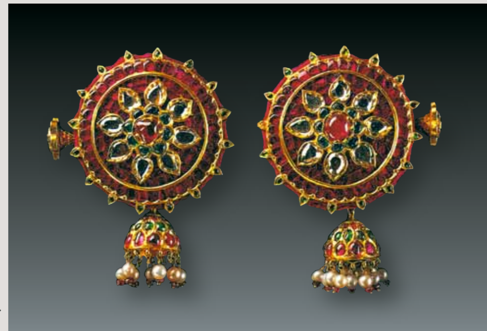
Пара плагов для ушей. Золото, рубины, алмазы и изумруды

кие Моголы были весьма толерантны, и жен никто не принуждал менять веру.