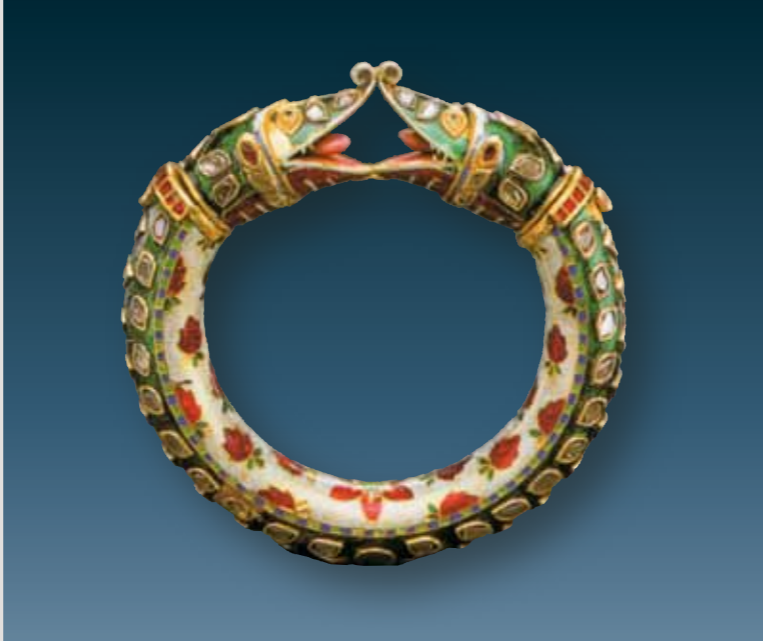
Браслет. Золото, декорирован выемчатой эмалью, алмазами, рубинами и стеклом

Коллекция эта, как мы уже сказали, не является наследной, сохраняемой веками. В течение сорока лет эмир Кувейта шейх Нассер Сабах аль-Ахмад аль-Сабах и его супруга шейха Хуссах аль-Сабах целенаправленно собирают предметы мусульманского искусства и археологии. Отдельная часть собрания – коллекция индийского ювелирного искусства XVI–XVII веков, ее по праву считают самой крупной, самой представительной в мире.