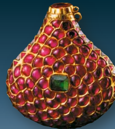
Маленький флакон. Золото, рубины, изумруды и природные кристаллы алмазов

правители поддерживали торговые и культурные связи с соседними государствами, с которыми у них было много общего во вкусах и мировоззрении, и нередко вывозили оттуда зодчих, искусных миниатюристов и ремесленников, имевших за своими плечами многовековые художественные традиции. В результате чудесного сплава различ-