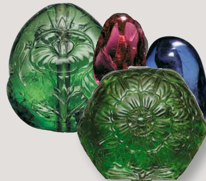
Гравированные изумруды, бусина из шпинели ( «Рубин-Балэ» ) с царской надписью, бусина из сапфира (чистого голубого цвета)

Примечательны кольца с алмазами так называемой природной огранки – это почти совершенные по форме кристаллы, найденные в природе и в первозданном виде использованные