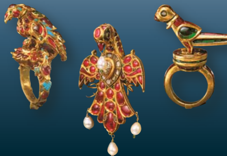
Кольцо и подвеска. Золото, рубины, изумруды, бирюза. Кольцо с поворачивающейся и качающейся фигуркой птички. Рубины, изумруды, хризоберилловый кошачий глаз, сапфир

Индия во времена упадка утратила свои сокровища. В коронных драгоценностях всех европейских государств есть камни, вывезенные различными путями из Индии. Лучшие из них украшают российские и британские короны. Многим европейским королевским домам достались ювелирные шедевры индийских раджей. Почему же коллекция была собрана именно в Кувейте? На первый взгляд удивительно, ведь страна эта так далека от Индии. Но оказывается, почти треть населения Кувейта так или иначе имеет исторические корни, связанные с территорией Ин-