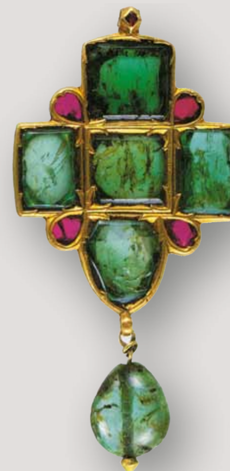
Подвеска – золото, изумруды, рубины

правители поддерживали торговые и культурные связи с соседними государствами, с которыми у них было много общего во вкусах и мировоззрении, и нередко вывозили оттуда зодчих, искусных миниатюристов и ремесленников, имевших за своими плечами многовековые художественные традиции. В результате чудесного сплава различ-