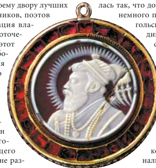
Подвеска с портретом-камеей императора Шах-Джахана. Изготовлена из золота, украшена рубинами и камеей из многослойного агата, обратная сторона — из серебра, гравирована и покрыта чернью

Лучшая ювелирная коллекция, наиболее полная и совершенная, которая существует сегодня в мире, — это коллекция, хранящаяся в Национальном музее Кувейта.