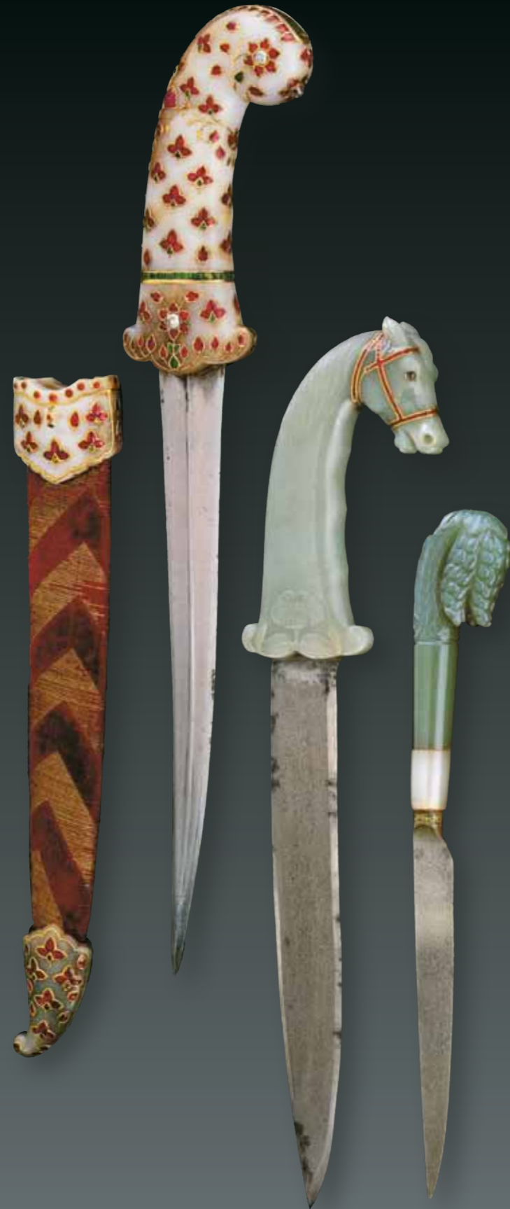
Слева: кинжалы и ножны с устьем и наконечником. Клинки – джохарская сталь; рукояти, устье и наконечник ножен вырезаны из нефрита, инкрустированы золотом; украшены рубинами, изумрудами и алмазами. Справа: нож – лезвие из джохарской стали, рукоять вырезана из нефрита