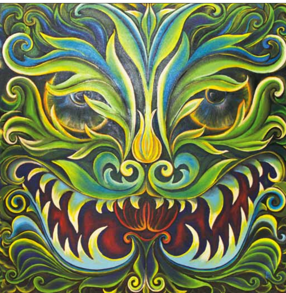
Дух леса. 2009