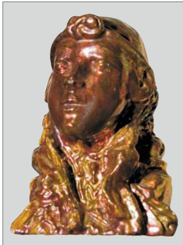
М.А. Врубель. Голова египтянки

Справа от двери – камин из местного приокского камня, известняка. На выступе каминного портала расставлены предметы, которые были дороги хозяину, в их числе декоративная майолика «Голо-