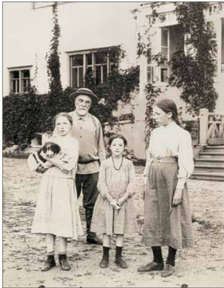
В.Д. Поленов с дочерьми возле западной террасы Большого дома. 1909

Все же это не защитило Василия Дмитриевича и его семью от трудностей послереволюционного времени. Усадьба Борок 8 была национализирована,