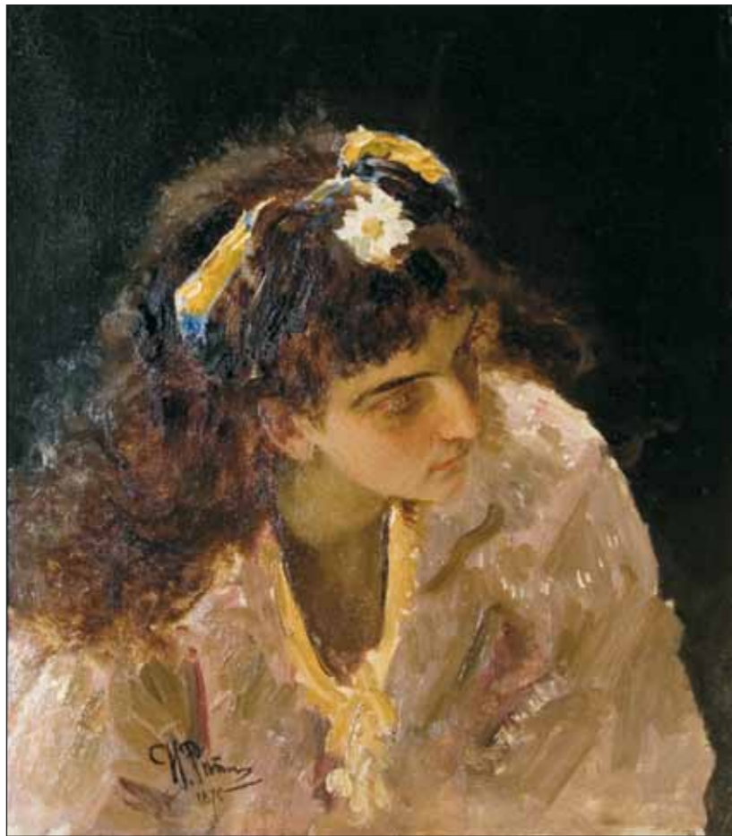
И.Е. Репин. Голова индийской красавицы. Этюд

вича по Академии художеств и Товариществу передвижных выставок. Все – подлинники. В среде близких Поленову художников родилась традиция обмениваться картинами, точнее, этюдами и эскизами. Ныне эти работы больших мастеров – И.Е. Репина, В.М. Васнецова, И.И. Левитана, Н.Д. Ярошенко, К.А. Савицкого, В.Е. Маковского, А.Е. Архипова, С.А. Коровина, А.М. Васнецова – представляют собой уникальные произведения искусства. Здесь же и представитель более старшего поколения – И.И. Шишкин, его картины «Сосновый лес», «Бор в Сестрорецке».