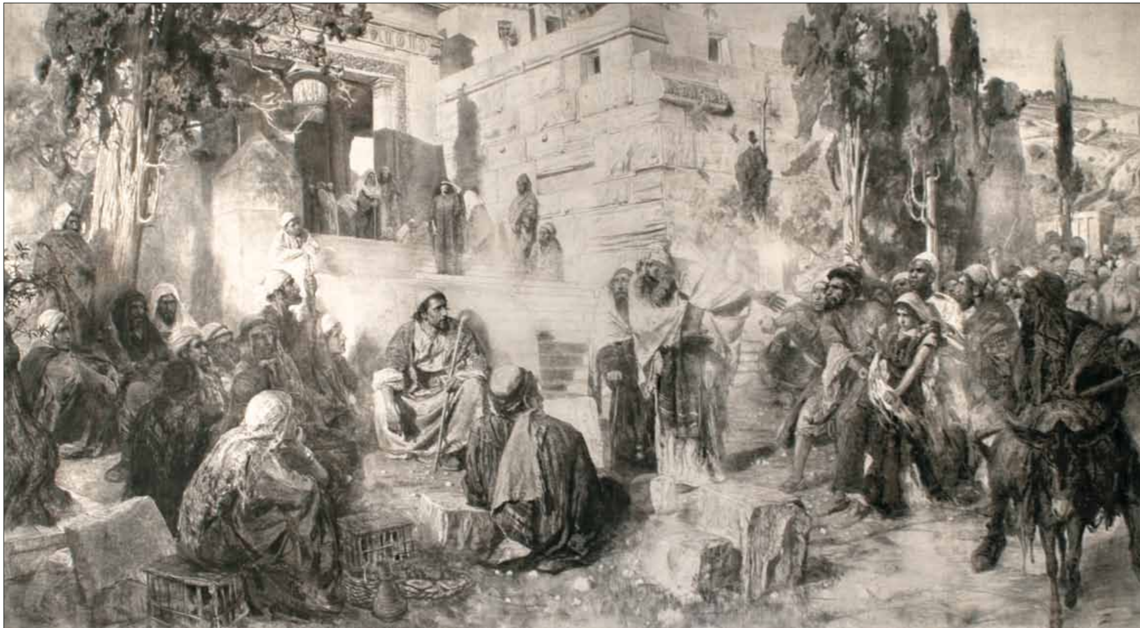
В.Д. Поленов. Христос и грешница. Холст, уголь. 1885

в написании своих картин, Поленов дважды совершил специальные поездки на Восток. Он привез много этнографического материала из Греции, Сирии, Египта, Палестины. В результате путешествия была создана огромная серия «Из жизни Христа» – свыше шестидесяти картин! – и несколько раз была представлена зрителям. Эти выставки вызвали широкий резонанс и стали крупнейшим художественным событием предреволюционных лет.