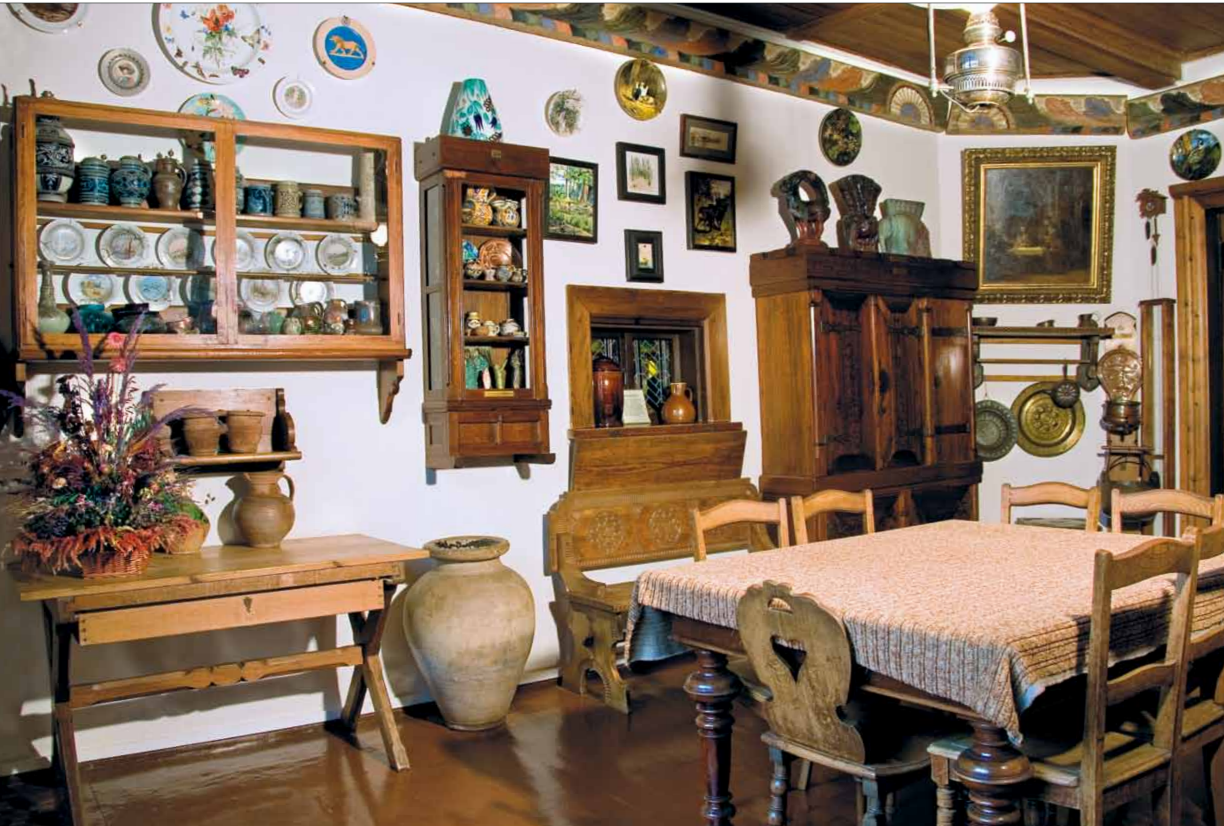
◀ Столовая. Коллекция декоративно-прикладного искусства

В столовой хранятся и такие уникальные предметы, как медный римский умывальник