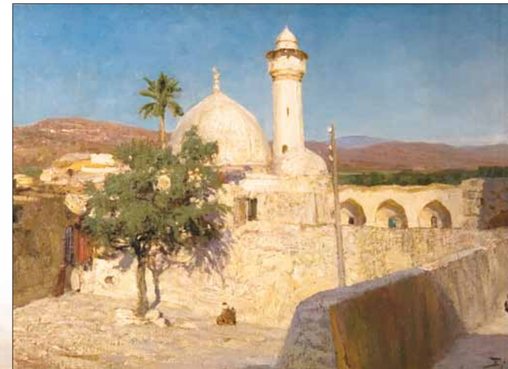
В.Д. Поленов. Мечеть в Дженне. 1903

Рядом находится здание, которое получило название Адмиралтейство . Это просторный лодочный сарай для зимовки поленовской флотилии, которой он тщательно занимался и постоянно пополнял ее. В настоящее время здесь устроен выставочный зал, где также демонстрируется уникальная поленовская диорама. В 20-х годах Василий Дмитриевич сделал свою последнюю творческую работу – увлекательное «Кругосветное путешествие». Это серия акварельных картинок;