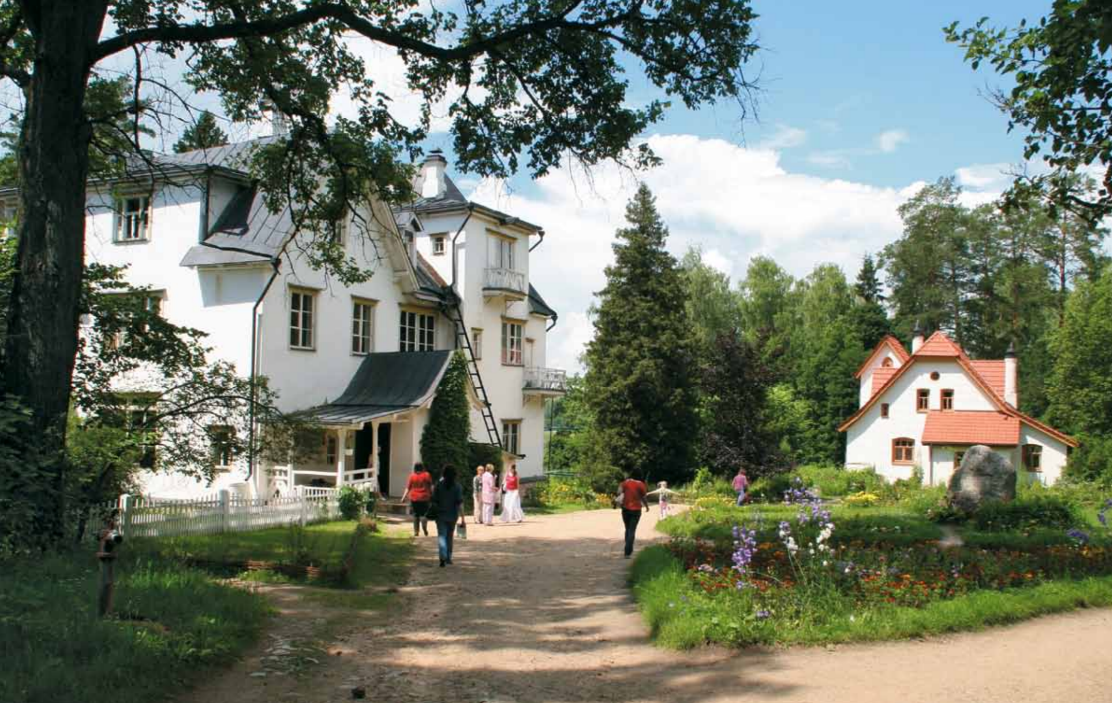
Большой дом (слева) и Аббатство (мастерская художника)

построил усадьбу и назвал ее по местному названию Борок. Еще построил две школы, одну церковь, мастерскую и много лодок, а я самолично устроил дамбу, вышло сто восьмое чудо света» 1 .