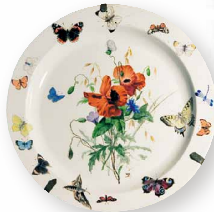
В.Д. Поленов. Блюдо «Бабочки»

XIV века, медное флорентийское ведро 1641 года, медный русский ковш.