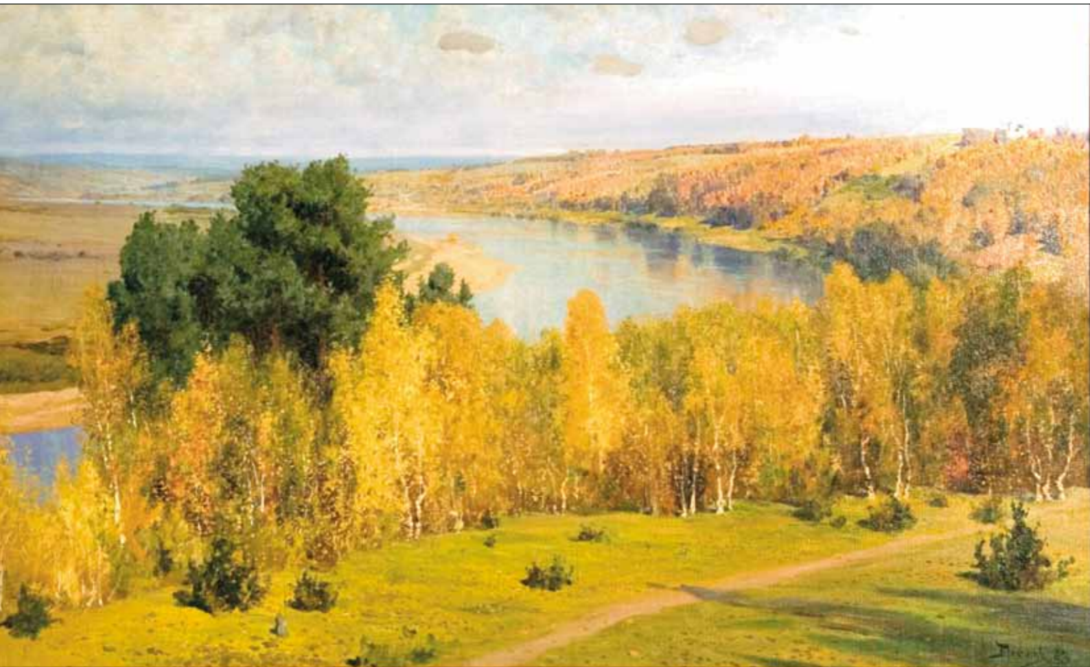
В.Д. Поленов. Золотая осень. 1893

ровой картины. В угловой комнате второго этажа в настоящее время экспонируются работы разных периодов творчества Поленова, начиная от ранних этюдов до крупных полотен, созданных в 1880–1890 годы. Комната называется пейзажной . Здесь собраны этюды, написанные в Нормандии, в местечке Вель, а также картины, являющиеся шедеврами русского пейзажа. Художник придавал образам родной природы эпическое звучание, монументальность и своеобразную декоративность. Поселившись в приокских местах,