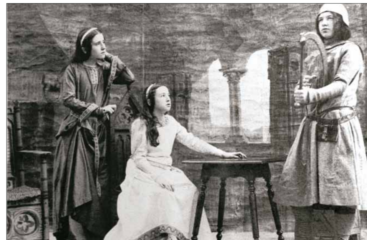
Сцена из спектакля «Замок Трифильтц»