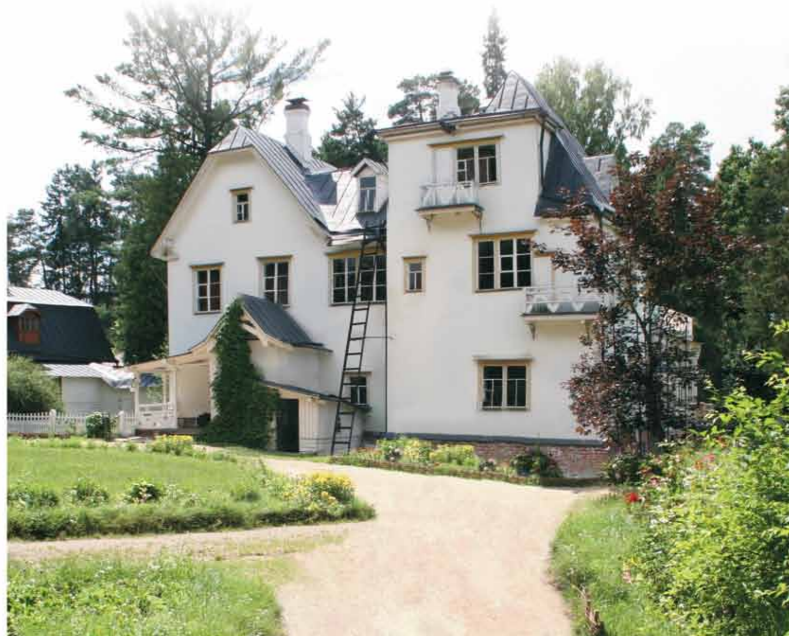
Большой дом. 2008 ▶