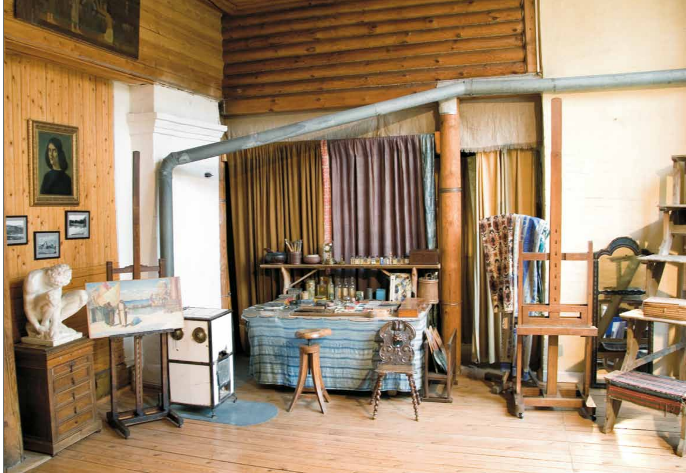
Фрагмент интерьера Аббатства. 2008