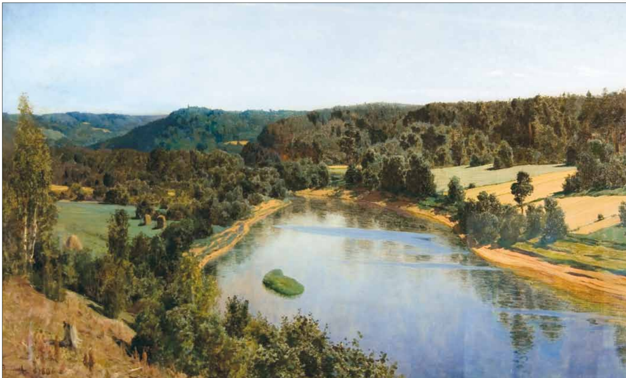
В.Д. Поленов. Река Оять

зыкальные вечера. Хорошо сохранилась фисгармония, на которой Поленов аккомпанировал себе, когда пел своим детям немецкие песни. У окна стоит старинное немецкое пианино фирмы Блютнер. Василий Дмитриевич с увлечением занимался музыкальным творчеством. Не имея специального образования, он сочинил ряд романсов на стихи любимых поэтов, и прежде всего Лермонтова, написал даже оперу и ораторию, которые были поставлены в Москве.