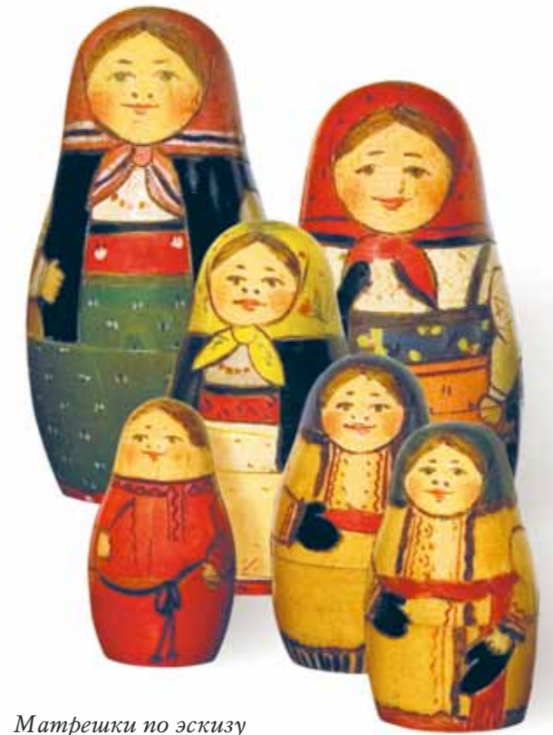
Матрешки по эскизу С.В. Малютина. 1890

В «русской витрине» хранится настоящая реликвия русской культуры – одна из первых мат-