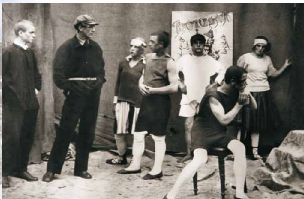
Репетиция спектакля. Постановщик танца – Асаф Мессерер (второй слева). 1936