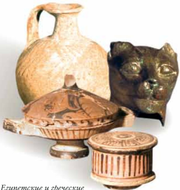
Египетские и греческие древности

В витринах представлены коллекции египетских и греческих древностей, собранные отцом и самим Василием Дмитриевичем. У окна – красивый декоративный стол из разноцветных кусочков античного мрамора, изготовленный в Петербурге. От отца Поленов унаследовал страсть к путешествиям и любовь к античности, которая нашла отражение в его художественных работах. Из каждой поездки по европейским или восточным странам он привозил что-нибудь примечательное и экзотическое.