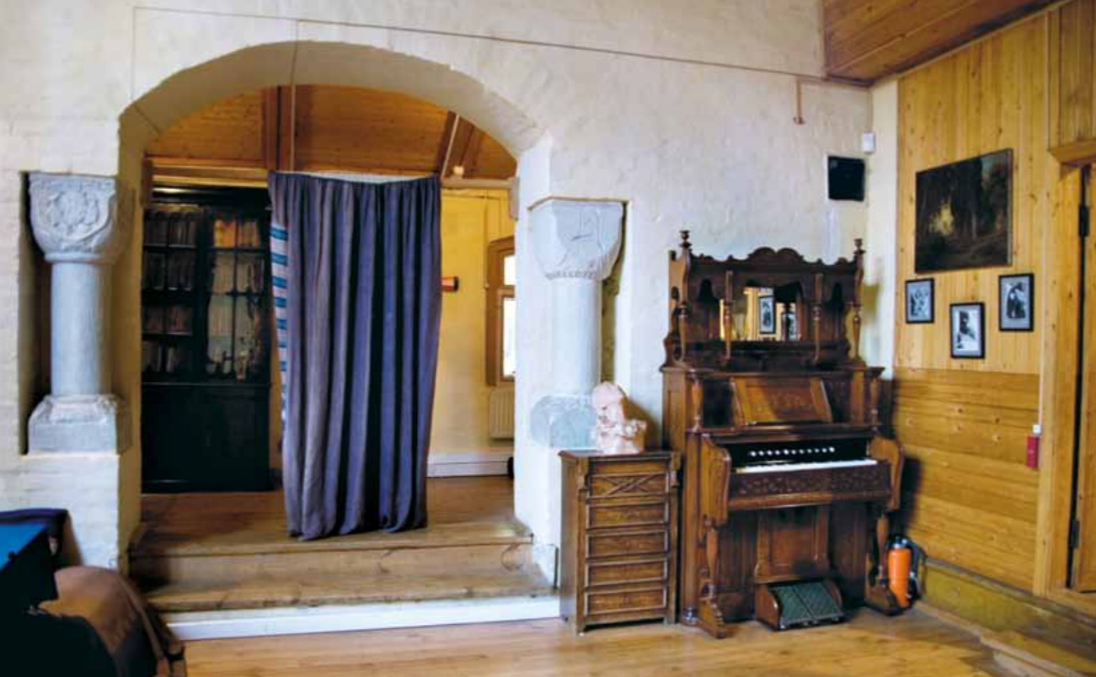
В Аббатстве проходили спектакли домашнего театра

силием Дмитриевичем. На родовом гербе Поленовых изображен ствол погибшего дуба, от корня которого начинается жизнь молодое деревце. Еще в XVIII веке основатель рода А.Я. Поленов (1738–1816), один из первых русских просветителей, законодатель, выбрал этот мудрый и лаконичный символ – в нем запечатлена мысль о сохранении через традиции связи поколений.