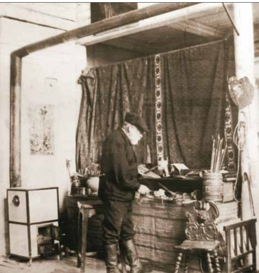
В.Д. Поленов в Аббатстве. 1911

«Если моим художественным детям Коровину и Головину удастся сделать что-либо равноценное их таланту, то я получу великую награду за мои труды, больше я ничего не желаю» 5 , – признавался Поленов. Константин Коровин был одним из его любимых учеников. Яркий талант, индивидуальность (которая впоследствии сделает его одним из основоположников русского импрессионизма) не поощрялись преподавателями-передвижниками – Коровин был выпущен из Московского училища живописи с дипломом «некласного художника». Но Поленов верил в его дарование и оказывал ему большую душевную поддержку. Благодарный ученик писал учителю и другу: «Милый мой, никто бы никогда не поощрил меня, и поэтому никто не поднял мой дух, если не встретил Вас... Знай-