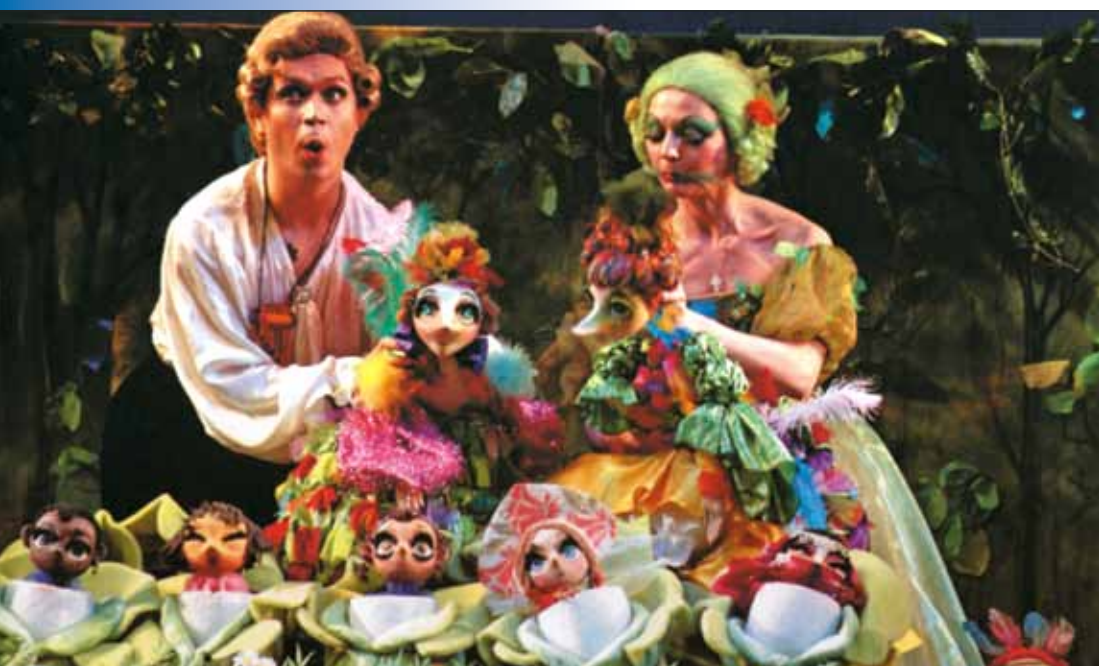
Сцена из спектакля «Волшебная флейта»

шестой, о котором еще никто не знает, и до репетиции надо уговорить художника. У заслуженной артистки не получается сцена. Она не может взвизгнуть так, как ему хочется, потому что это не по системе Станиславского... На репетиции он будет тридцать раз бегать от режиссерского столика за кулисы, подозрительно вежливым голосом разговаривать с электриками, которые сегодня почему-то нерасторопны, доказывать кому-то, что пудели виляют хвостом именно так, а не как-либо иначе, спорить о философской концепции сказки. Во всем этом будет масса наблюдательности, ума, знаний, юмора.