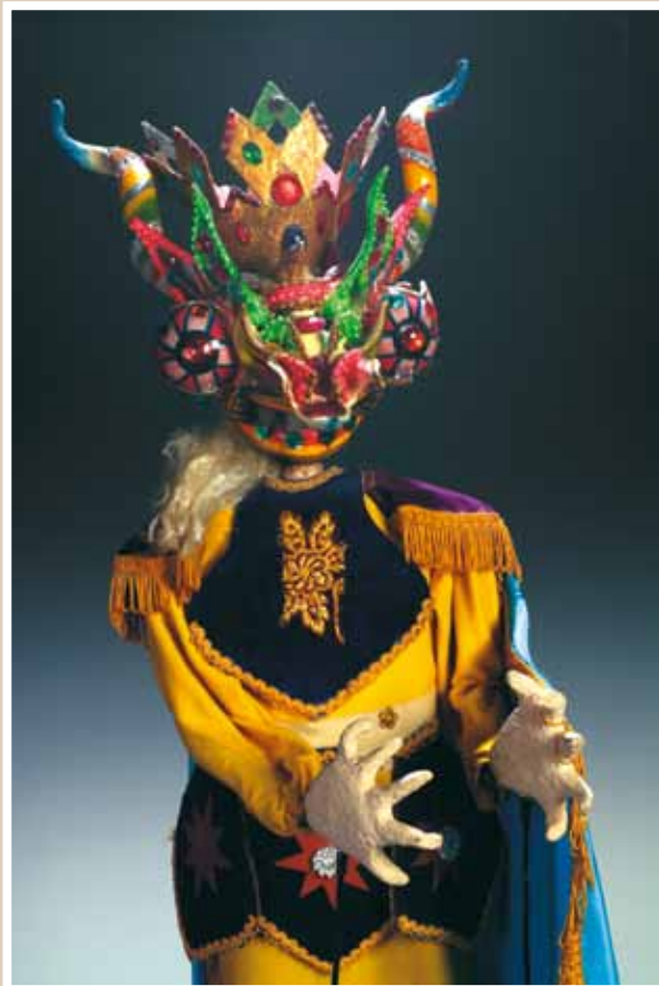
Пио – дух шахты. Спектакль «Два дяди для одной сказки». Театр «Нина». Кочабамба, Боливия, 1985