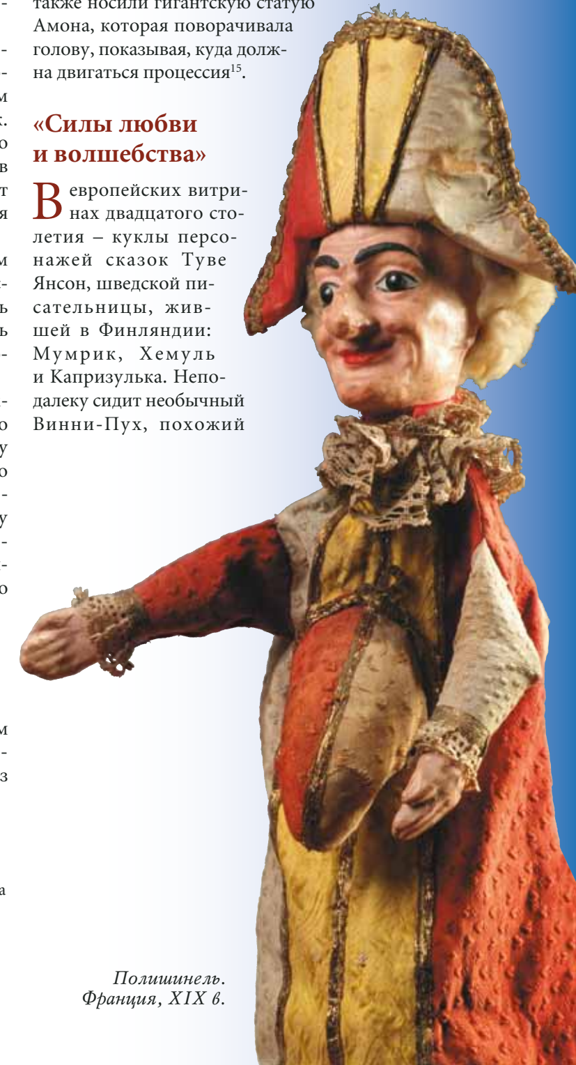
Полишинель. Франция, XIX в.

В европейских витринах двадцатого столетия – куклы персонажей сказок Туве Янсон, шведской писательницы, жившей в Финляндии: Мумрик, Хемуль и Капризулька. Неподалеку сидит необычный Винни-Пух, похожий