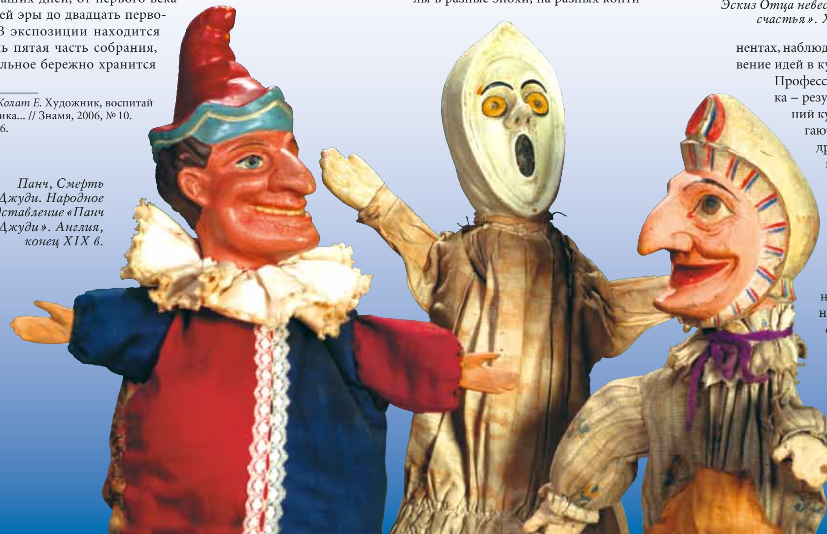
Панч, Смерть и Джуди. Народное представление «Панч и Джуди». Англия, конец XIX в.

в трех запасниках. В фондах музея – античные марионетки, куклы и маски ритуально-обрядовых действ, куклы, участвовавшие в традиционных религиозных, героических и сатирических представлениях; театры XX и XXI веков представлены куклами из России, Европы и Азии, куклами из лучших спектаклей театра имени С.В. Образцова и куклами из сольной программы С.В. Образцова.