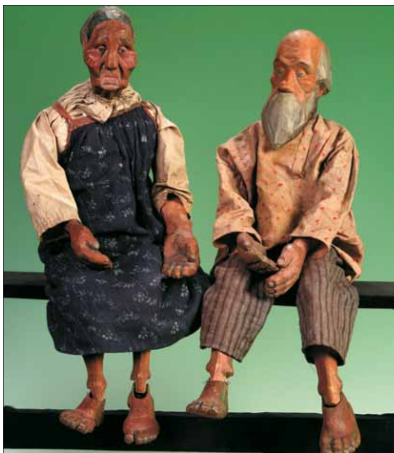
Старик и Старуха. Спектакль «Литанюшка». Художник В.А. Фаворский. Мастерская при Камерном театре. Москва, 1920-е гг.

поражение, что было для них очень болезненно, и прекратили работать с куклами. Но дружить с С.В. Образцовым не перестали и в 1948 году передали театру коллекцию своих кукол.