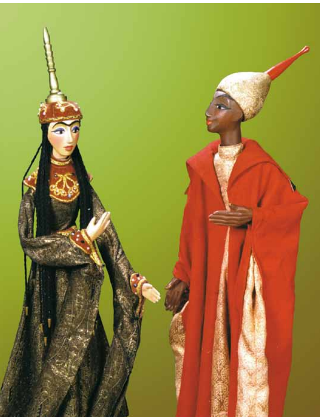
Буддур и Аладдин. Спектакль «Волшебная лампа Аладдина»

ей, а самих себя часто сравнивали с прорицателями, жрецами, пророками. Идея Рока, Судьбы, человека-марионетки на рубеже XIX–XX веков стала важным философско-эстетическим постулатом.