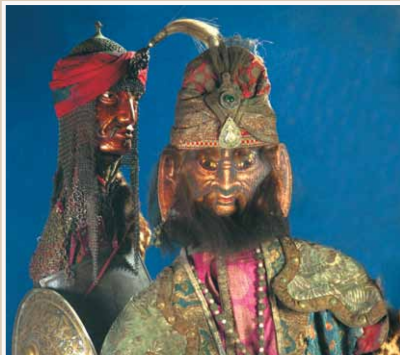
Аббас и предатель Шимр. Мистерия «Тазие» о гибели полководца Хусейна. Иран, XIX в.