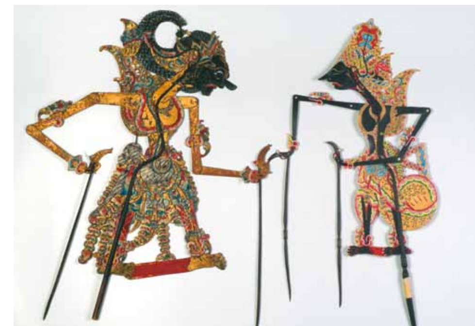
Персонажи традиционного театра теней. Ява, Индонезия, 1960-е гг.