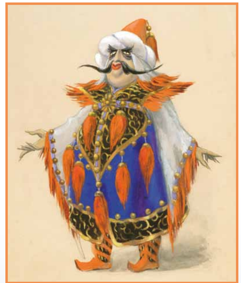
Эскиз Отца невесты. Спектакль «Гасан – искатель счастья». Художник Б. Тузлуков. ГЦТК. 1956

Зрители перед спектаклем имеют возможность познакомиться с временными выставками (40–50 кукол). Переходя от витрины к витрине, мы погружаемся в историю рождения, жизни и изменения театральной куклы в разные эпохи, на разных континентах, наблюдаем причудливое взаимопроникновение идей в культуре.