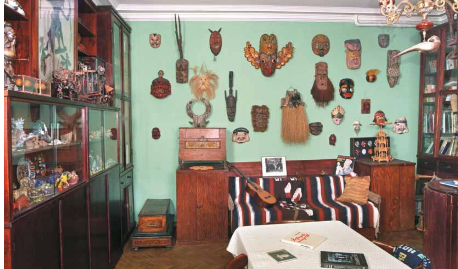
Кабинет в Мемориальной квартире С.В. Образцова

◀ Сцена из спектакля «По щучьему велению»