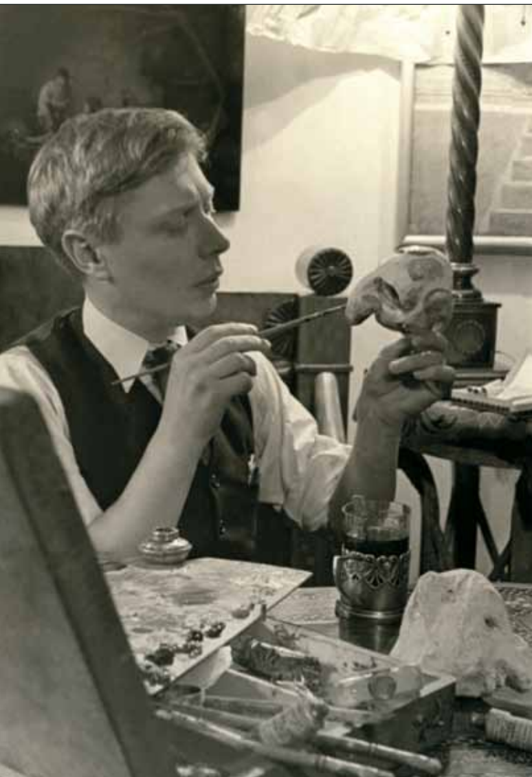
Мастер-кукольник за работой

Мастера. Мистическая древность мира кукол пересекается здесь с современностью, прожившие много веков античные марионетки из красной глины и маски религиозных мистерий соседствуют с ультрасовременными куклами-актерами, мимика ко-