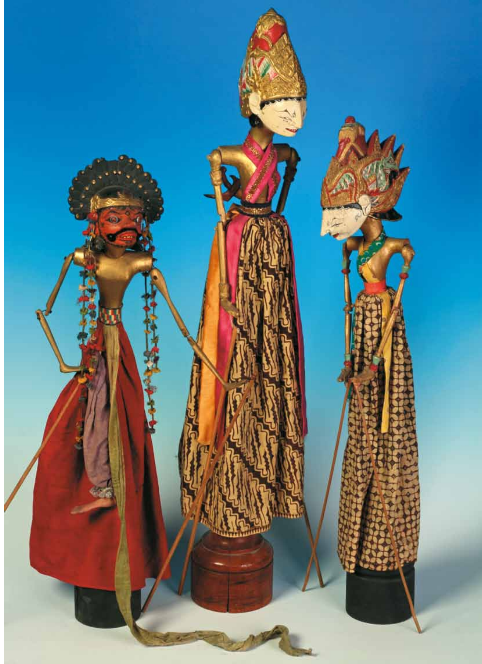
Петрук, Принц и Возлюбленная Принца. Спектакль «Принц с острова Мадура». Ява, Индонезия, XX в.