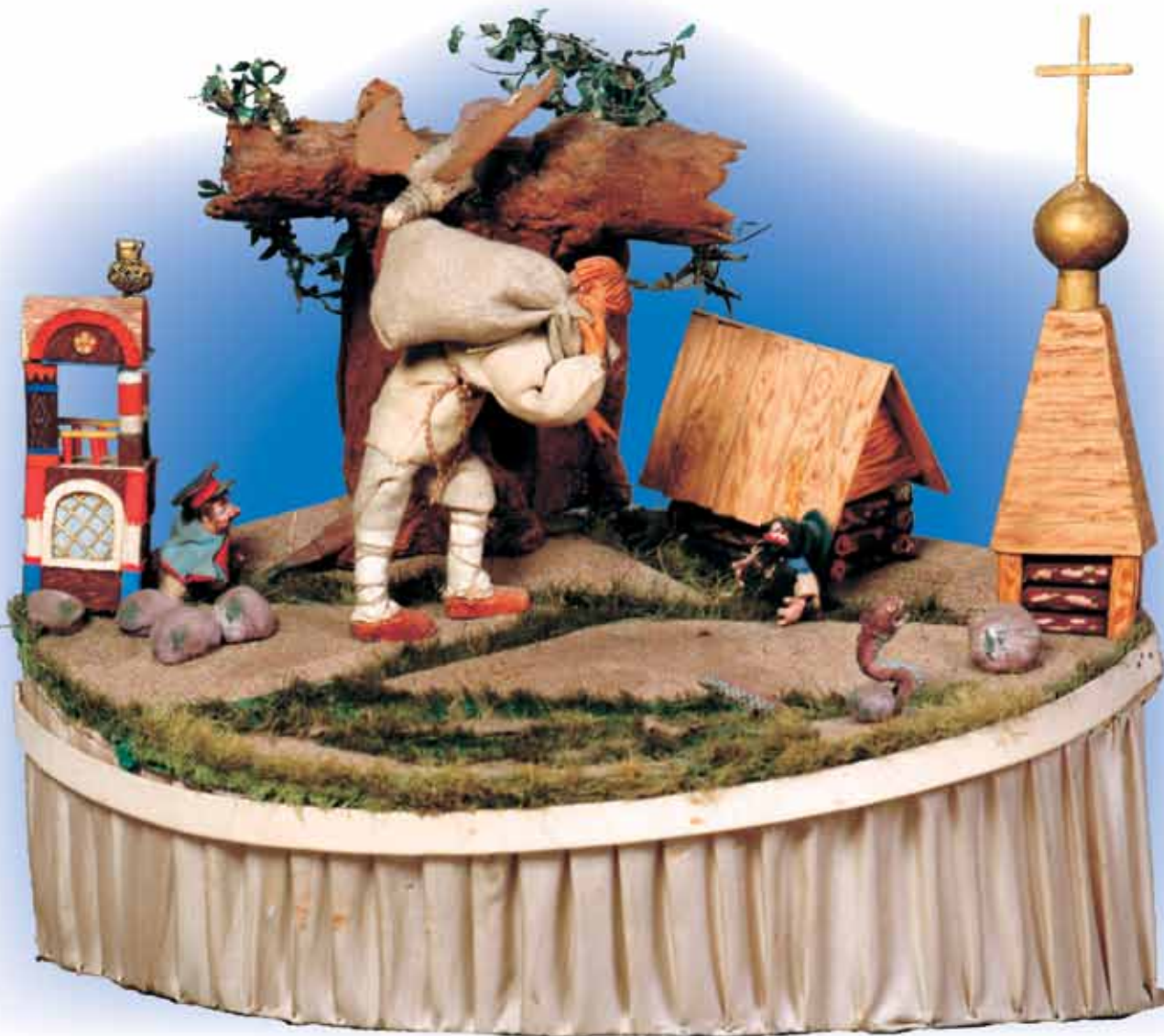
Макет декорации к спектаклю «Братья Монгольфье». Художник Т. Александрова. ГЦТК, 1934

Музыкальные часы на фасаде Центрального театра кукол имени Сергея Образцова возвращают нас в мир детства