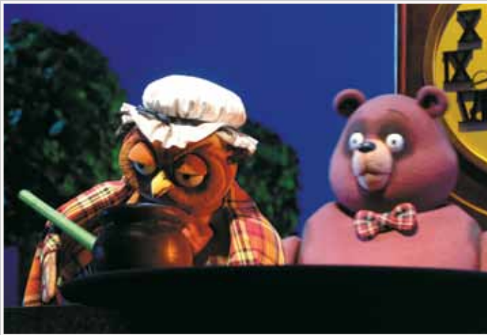
Сцена из спектакля «Винни по прозвищу Пух»