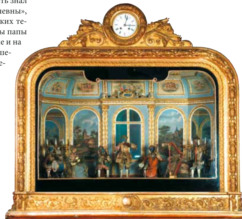
Часы «Обезьяний оркестр». Германия, XVIII в. Мемориальная квартира С.В. Образцова

струкцию. Супруги Ефимовы считали, что кукла прежде всего должна быть произведением искусства. Но в 1930-е годы у театров не хватало средств, куклы стали делать из того, что было под рукой. Между сторонниками Образцова и Ефимовых произошел «игровой» спор, Ефимовы потерпели в нем