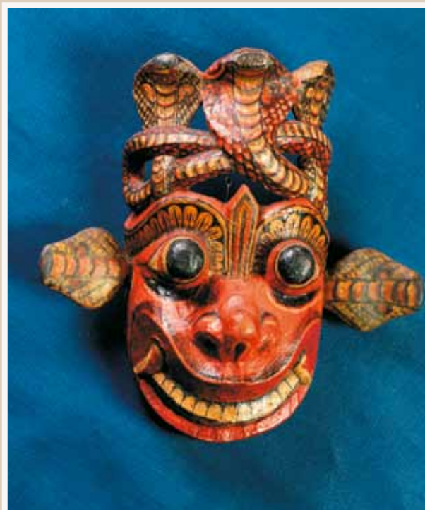
Лечебная маска племени сингалезцев. Дерево. Цейлон.

ет, что актер-кукольник тихонько снимет куклу с руки, положит ее на стол, и будут сидеть втроем художник, актер и кукла. Сидеть и молчать... А думать все равно будут о кукле: почему не получилось, почему не возникла жизнь?» Не полувившаяся кукла полетит в корзину, и все начнется сначала. И наконец наступит момент, «когда вставишь глаза и увидишь, кто на тебя смотрит» 5 .