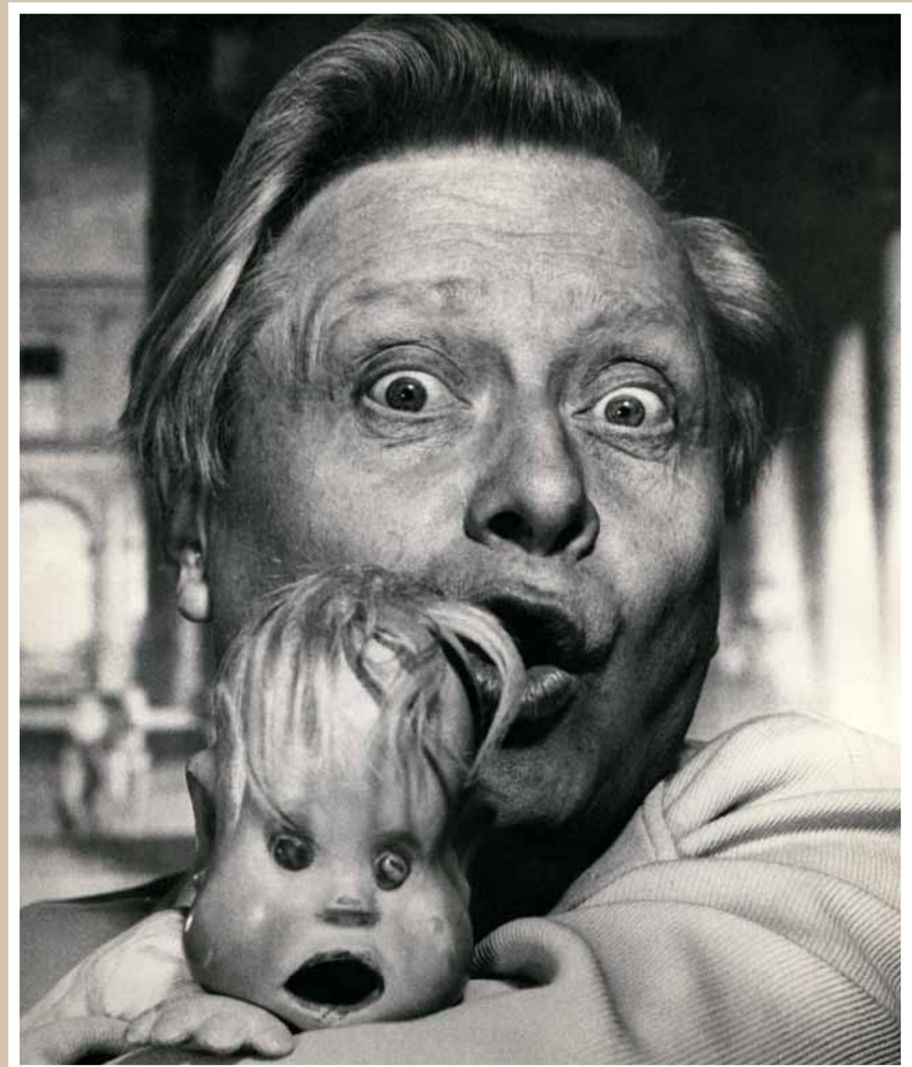
С.В. Образцов с Тягой. Концертный номер «Колыбельная»

Конечно, куклы, сделанные гениальным кукольником, занимают в музее особое место – справа от входа, в почетном красном углу. По словам