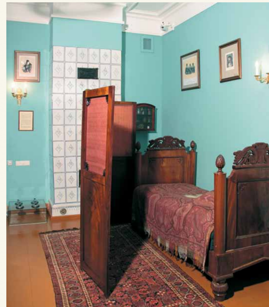
Интерьер спальни Н.В. Гоголя

Творчество было для Гоголя смыслом жизни, однако осознал он свое призвание, предназначение не сразу. В детстве он писал элегии, за которые его хвалил В.В. Капнист. В юности – пробовал себя в жанре трагедии (известна не сохранившаяся