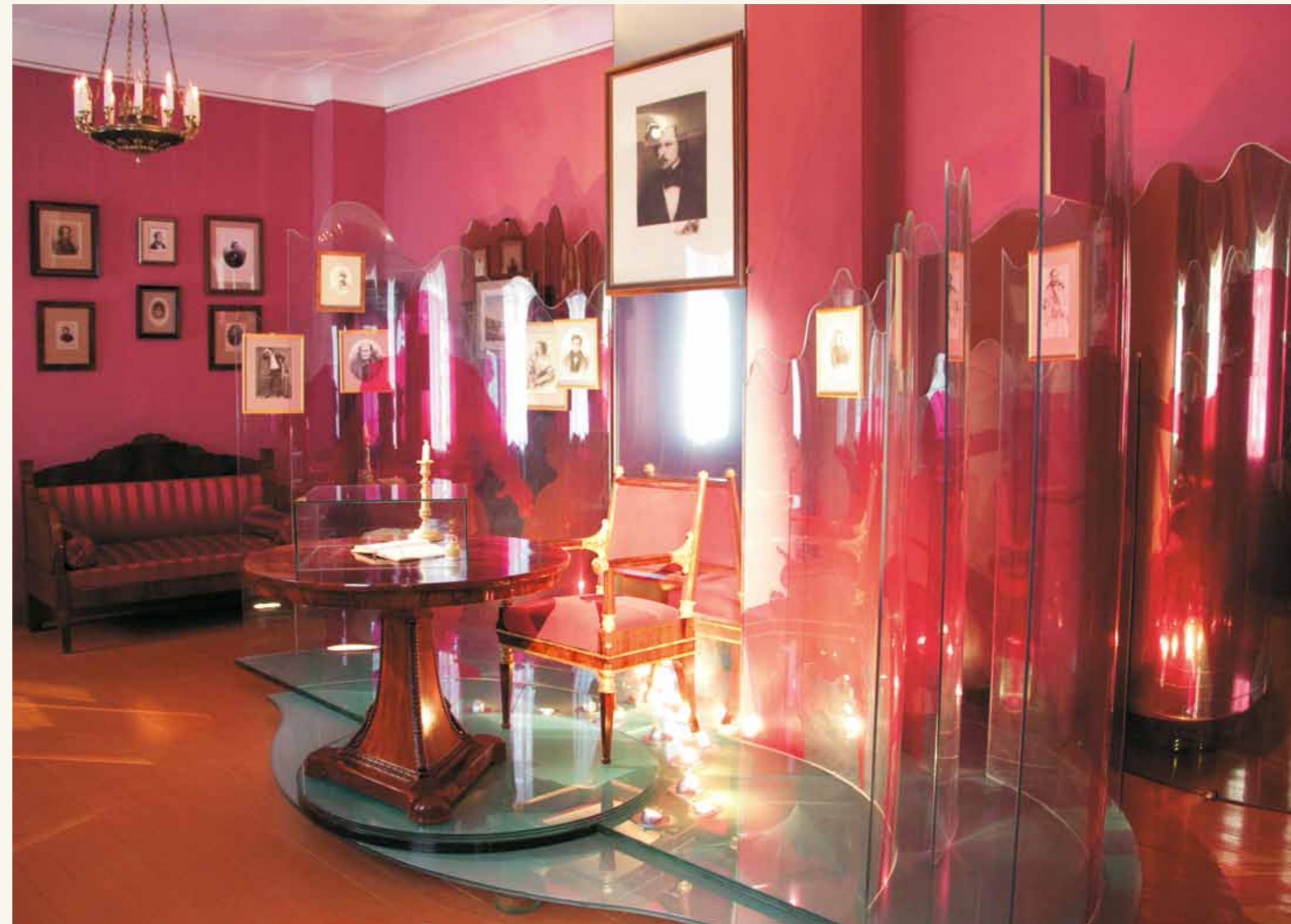
Инсталляция в зале «Ревизор» ▶