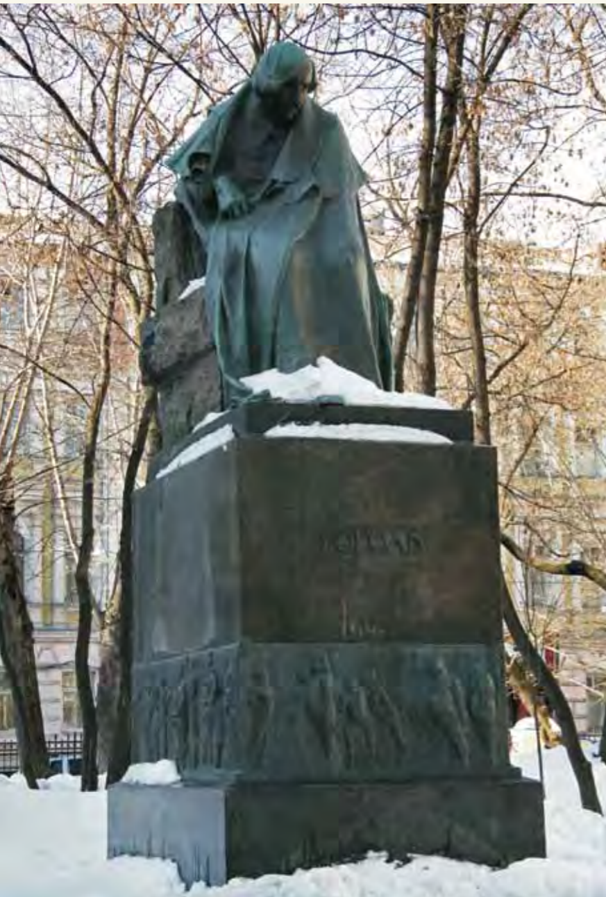
Н.А. Андреев. Памятник Н.В. Гоголю. 1909

В глубине двора – памятник Гоголю работы Н.А. Андреева. У этого памятника своя история. В 1909 году, к столетию писателя, монумент был установлен на Арбатской площади, «потом в 30-е годы XX века его сочли чересчур пессимистичным и убрали за стены Донского монастыря, где он чудом избежал переплавки. Когда началась оттепель, по настоянию москвичей “андреевский” Гоголь был возвращен городу. В 1959 году, к 150-летию со дня