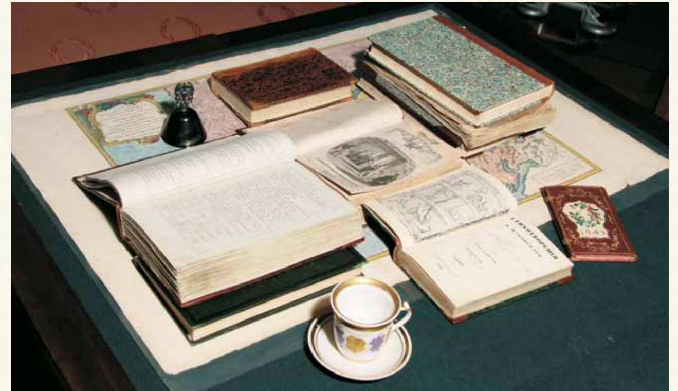
Книги из библиотеки Гоголя

вообще и душу человека вообще <...> я обратил внимание на узанье тех вечных законов, которыми движется человек и человечество вообще» 10 . В результате этих наблюдений и чтения духовной и светской литературы – Иоанна Златоуста, Василия Великого, Ефрема Сирина, Григория Нисского, Иоанна Дамаскина, Димитрия Ростовского, митрополита Филарета (Дроздова), Задонского Затворника Георгия (Машурина), протоиерея Сабинина, пресвященного Михаила (Десницкого) и др. – Го-