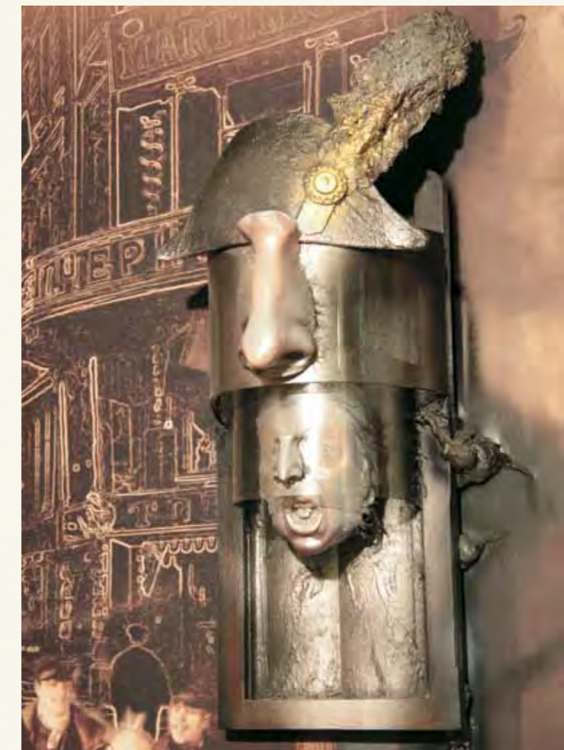
Зал «Воплощения». Инсталляции «Ревизор», «Нос»

Известны слова Гоголя, обращенные к юношеству: «Забирайте же с собою в путь, выходя из мягких юношеских лет в суровое ожесточающее мужество, забирайте с собою все человеческие движения, не оставляйте их на дороге, не подымете потом!» 31 В залы музея часто приводят на экскурсию именно детей, чаще всего младшего и среднего школьного возраста. Сотрудники музея говорят, что даже самые маленькие сорванцы притихают, слушая рассказ экскурсовода о пути писателя и разглядывая героев его бессмертных произведений, созданных фантазией художника-оформителя.