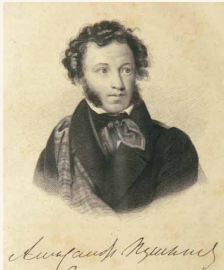
Портрет А.С. Пушкина. Гравюра на стали К.Я. Афанасьева с оригинала О.А. Кипренского. 1869

не тронув копытами земли, превратились в одни вытянутые линии, летящие по воздуху, и мчится вся вдохновенная Богом!...» 1 – такой Н.В. Гоголю в поэме «Мертвые души» представилась Русь-тройка. «Русь, куда ж несешься ты? дай ответ. Не дает ответа. Чудным звоном заливается колокольчик; гремит и становится ветром разорванный в куски воздух; летит мимо все, что ни есть на земле, и, косясь, посторониваются и дают ей