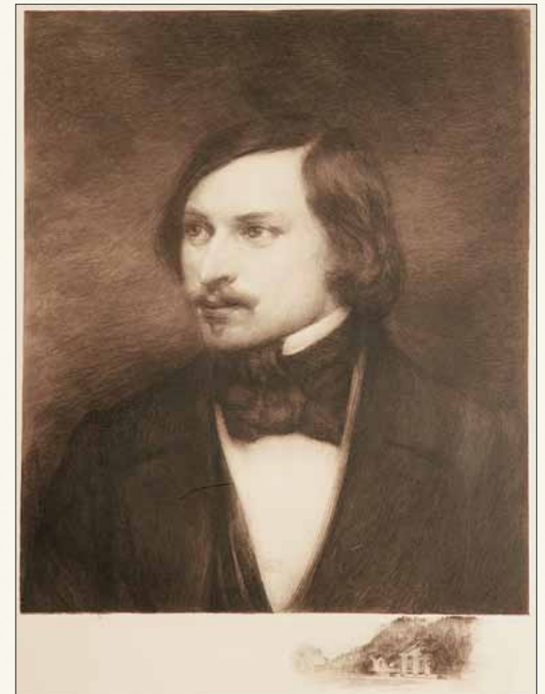
Н.В. Гоголь. Литография М.В. Рундальцева. 1909

Гоголь бесспорно гениален еще и потому, что, увидев низкую природу своего века, он попытался отыскать в славянской истории героическое и показал Тараса Бульбу – образ, который до сих пор остается воплощением героического начала, цельности, глубокой, коренной нравственности, воплощением личности, прожившей свой век в эпоху,