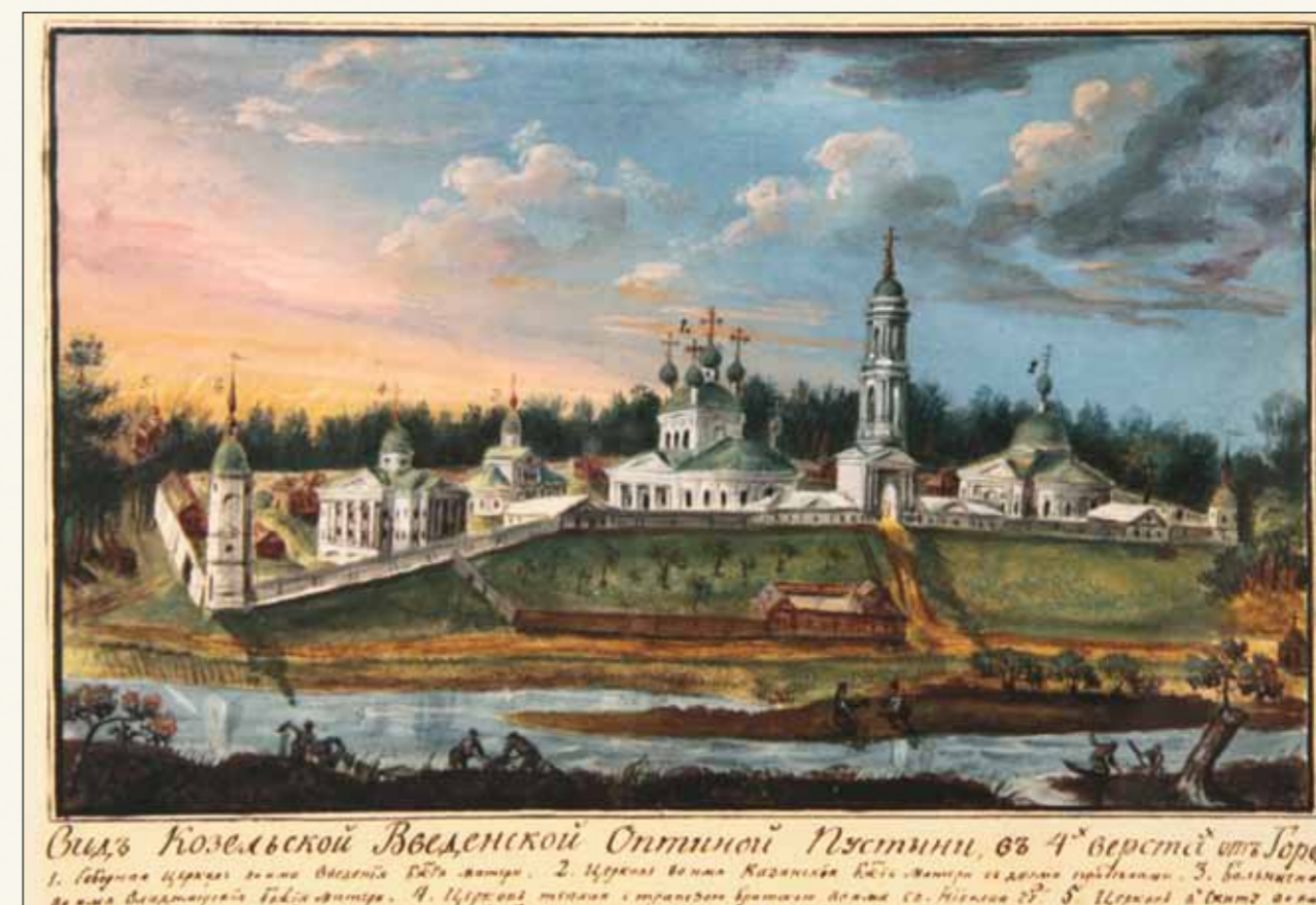
Вид Козельской Введенской Оптиной Пустыни

Малороссия подарила Гоголю мир народных и религиозных преданий, волю к жизни, стремление к добру, социальному и нравственному. Великороссия открыла ему главное предназначение, указала жизненное поприще – писательский дар.