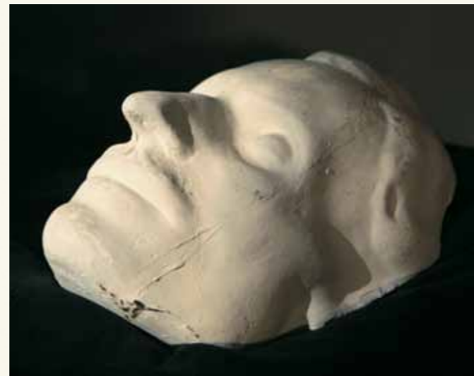
Один из гипсовых отливов посмертной маски Гоголя