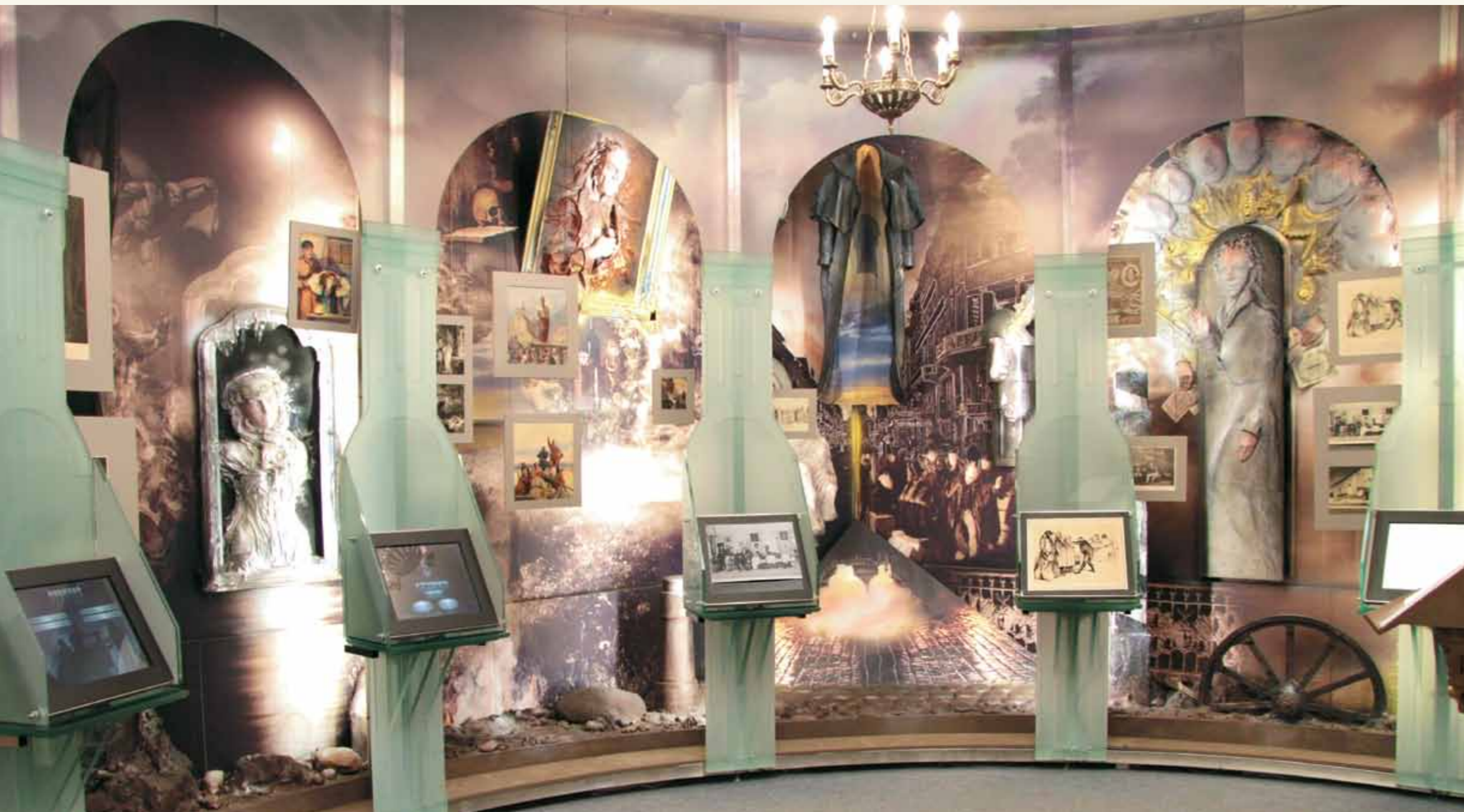
Фрагменты панорамы зала «Воплощения»: «Майская ночь, или Утопленница», «Портрет», «Шинель»

боровании, хотя и был очень слаб, так как соблюдал строгий Великий пост, первая неделя которого особенно трудна для верующих. Его последние слова, сказанные в состоянии духовного просветления, обретенного лишь перед кончиной: «Как сладко умирать!»