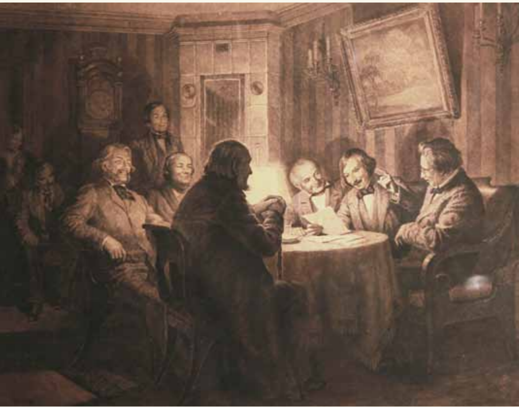
В.В. Данилова, О.А. Дмитриев. Гоголь читает комедию «Ревизор» 5 ноября 1851 года. Офорт с картины В.Е. Маковского. 1952

ля наряду с произведениями А.С. Пушкина и Л.Н. Толстого были переведены на английский в 1880–1890-е годы: Гоголя в Америке «только недавно открыли <...> Нет сомнения, что он произвел огромное впечатление и что в самом ближайшем будущем его переведут сполна» 25 . В 1985 году в США при Университете Северного Иллинойса было основано Гоголевское общество, стал издаваться «Гоголевский бюллетень» (The Gogol Bulletin, № 1, 1985).