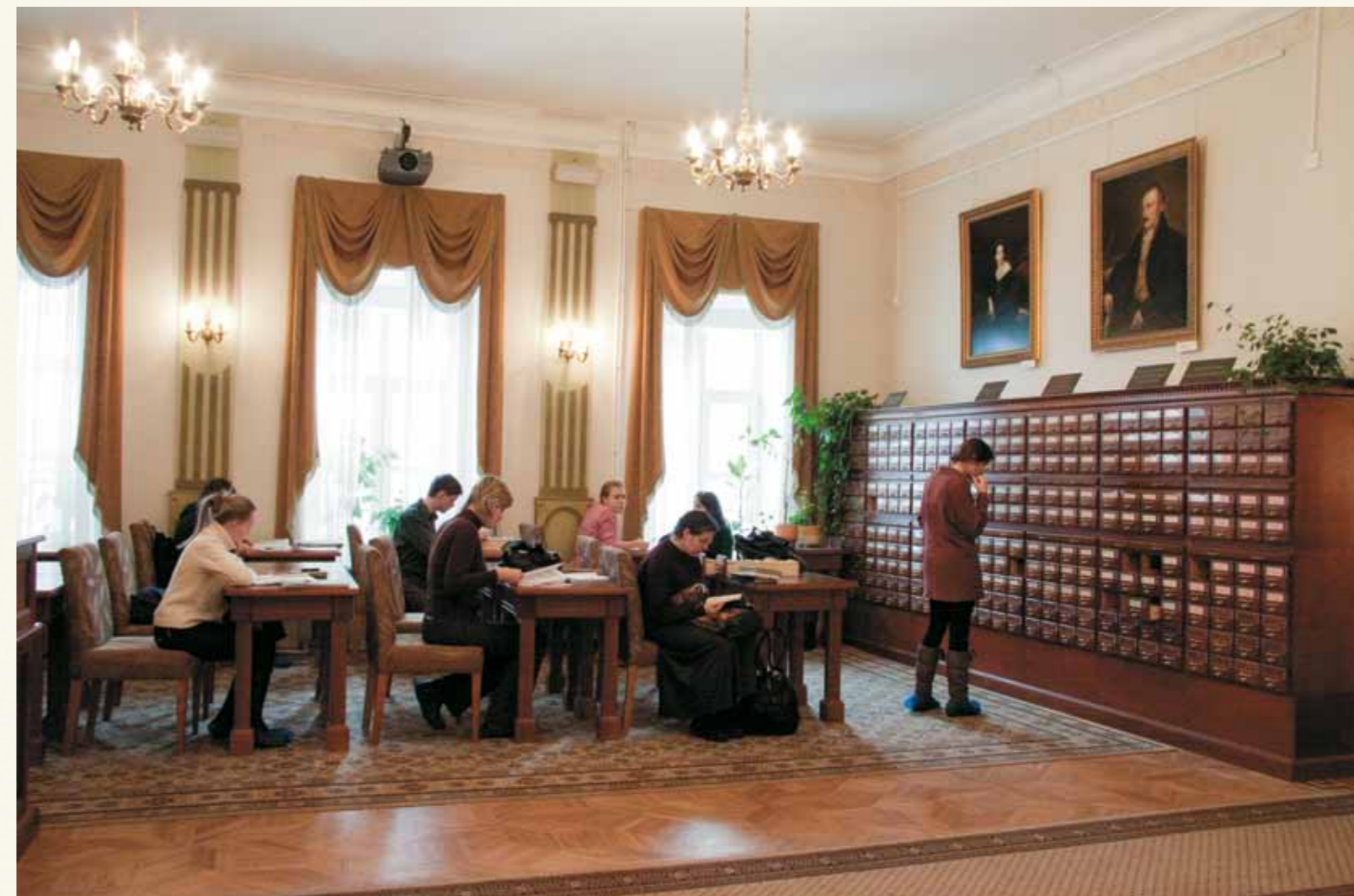
Музыкально-театральная гостиная. Общий вид