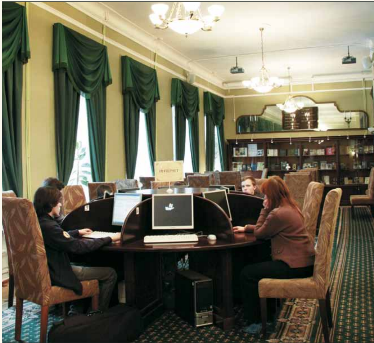
Гуманитарный читальный зал