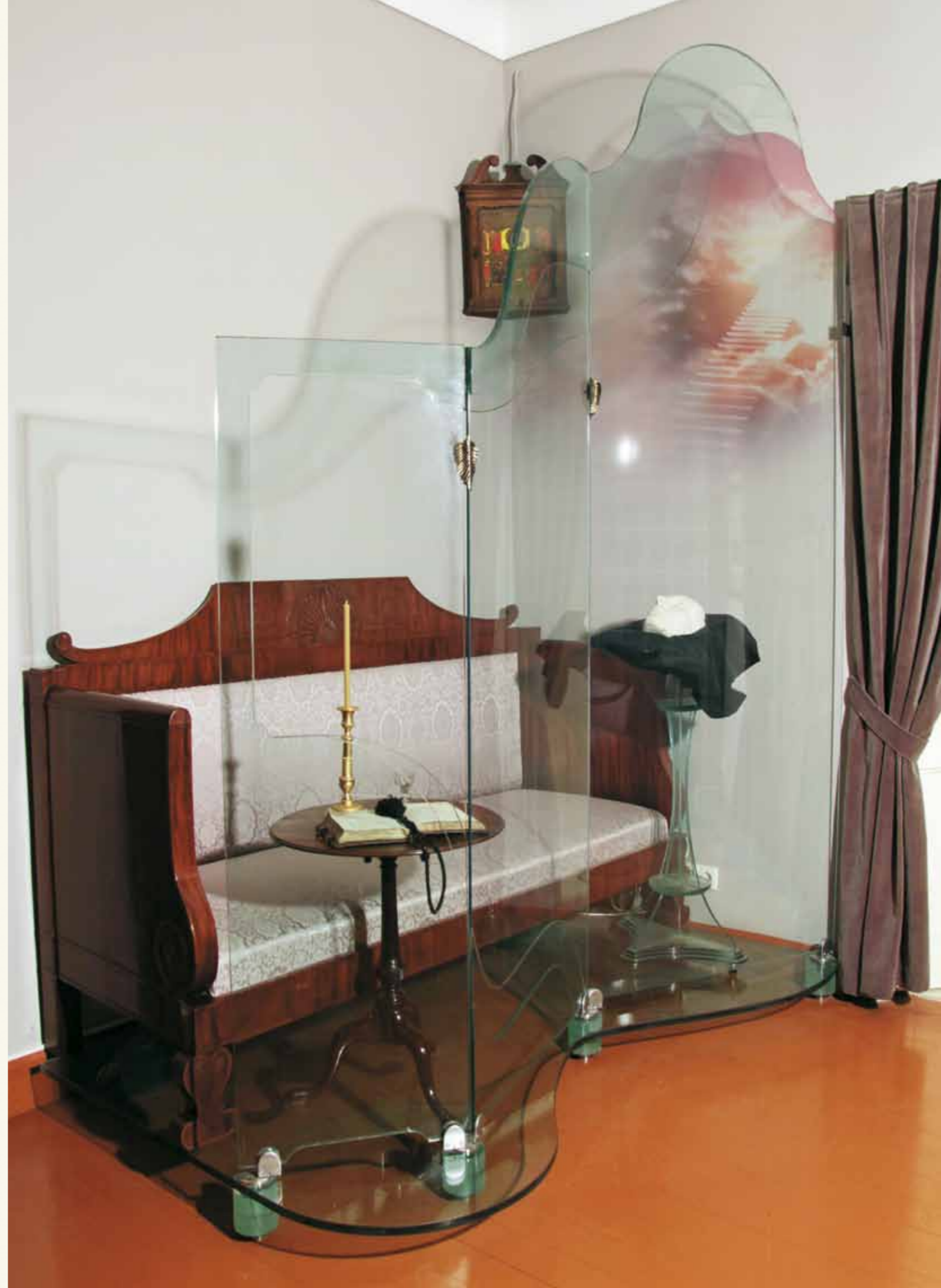
Инсталляция в зале «Комната памяти» ▶