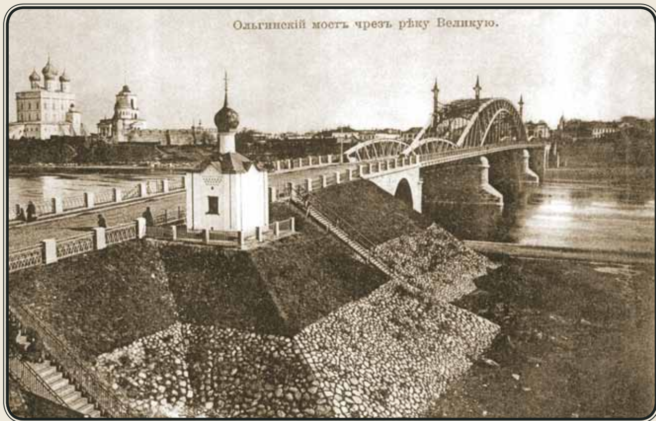
Анастасиевская часовня. 1911.

о творчестве Н.К. Рериха, нашла эскизы росписей свода и стен неизвестной часовни. Ученые предположили, что эскизы сделаны в 1913 году для Анастасиевской часовни в Пскове. Для подтверждения этого были выполнены пробные расчистки внутренних стен. Из-за срочности решения проблемы работы проводились зимой специали-