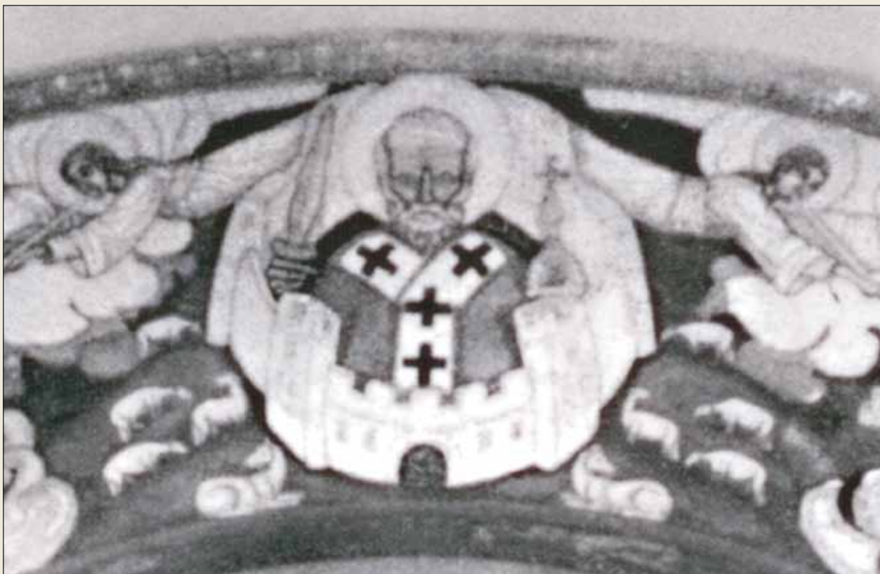
Николай Можайский. Роспись храма Святого Духа в Талашкине по эскизу Н.К. Рериха (1912–1914). Не сохранилась.

одеянии с омофором, с мечом в правой руке и церковь в левой. «Вокруг крепостной стены вольно пасутся лошадки» 7 . Подобный иконографический тип Николая Можайского представлен в часовне Святой Анастасии в Пскове.