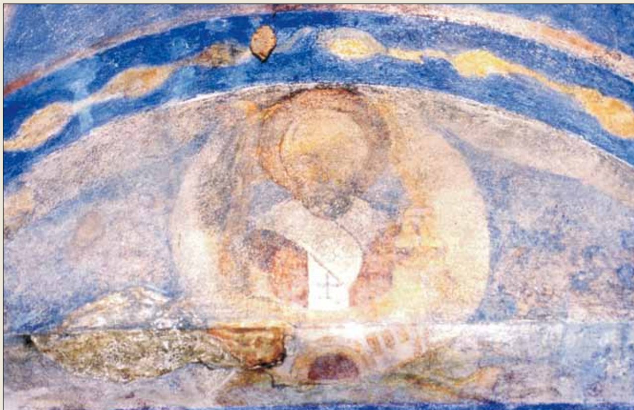
Николай Можайский. Роспись южной стены Анастасиевской часовни в Пскове (1913). Фото 2001 г.

вописи. Художник так объяснял содержание сюжета: Царица помогает «путникам неумелым, незнающим различить, где добро, где зло». Трон Царицы опирается на земную твердь, река у ног – «река жизни», голова Царицы достигает небесных сфер. Богородица сложила руки, моля за род людской, который борется с волнами житейского моря 5 . По сторонам изображены охраняемые ангелами города.