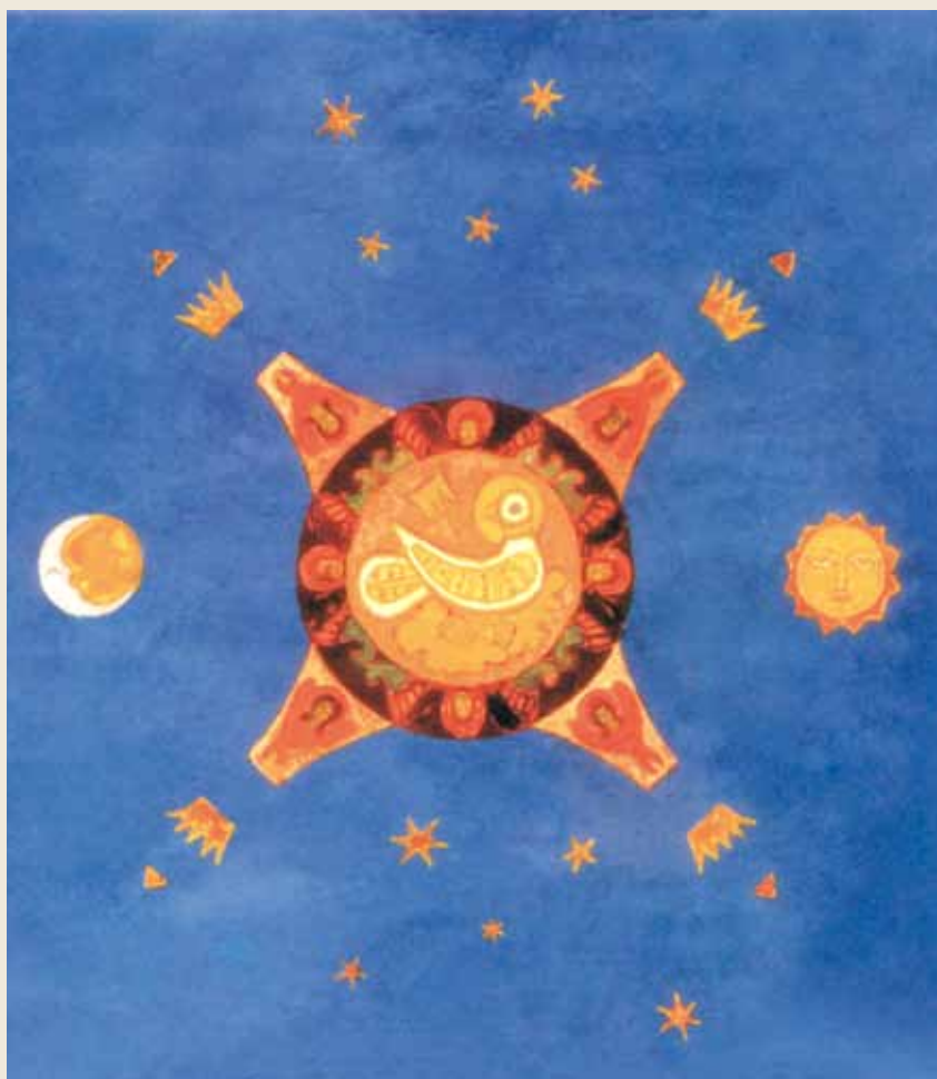
Н.К. Рерих. Святой Дух. Эскиз росписи плафона для Анастасиевской часовни в Пскове. 1913

По версии Г.Г. Донского, на стене изображена Богоматерь. Эту версию поддерживает Н.С. Рахманина, она указывает, что в росписях часовни есть