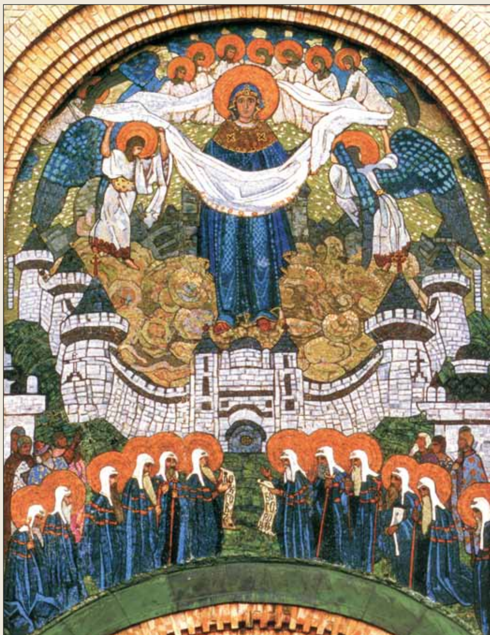
Н.К. Рерих. Покров Богоматери. Мозаика церкви Покрова Пресвятой Богородицы села Пархомовка (1906). Фото 2001 г.

В своем творчестве Николай Константинович неоднократно обращался к образу Богоматери. Использованный для эскиза церкви Покрова и для росписи церкви Святого Духа образ «Царица Небесная над рекой жизни» не каноничен, ему нет аналогов в древнерусской жи-