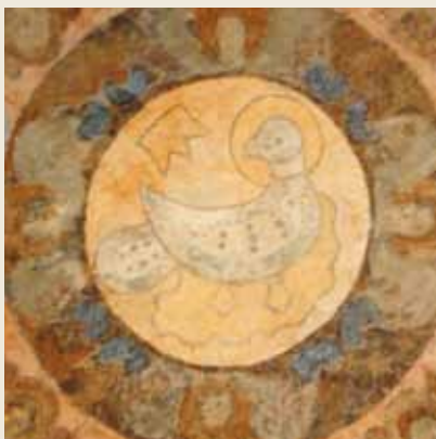
Фрагмент росписи плафона. Современный вид

Сохранность фресок на сегодняшний день удовлетворительна, существуют потертости, утраты, но в целом сюжеты хорошо читаются. На плафоне изображено небо с луной, солнцем, звездами и Святым Духом в виде стилизованного голубя, от которого исходят лучи света и херувимы. На западной стене, над входом, расположен сюжет «Спас Нерукотворный и ангелы». Два ангела в золотистых одеждах поддерживают убрис с образом Спаса Нерукотворного. По сторонам от входа помещены фигуры