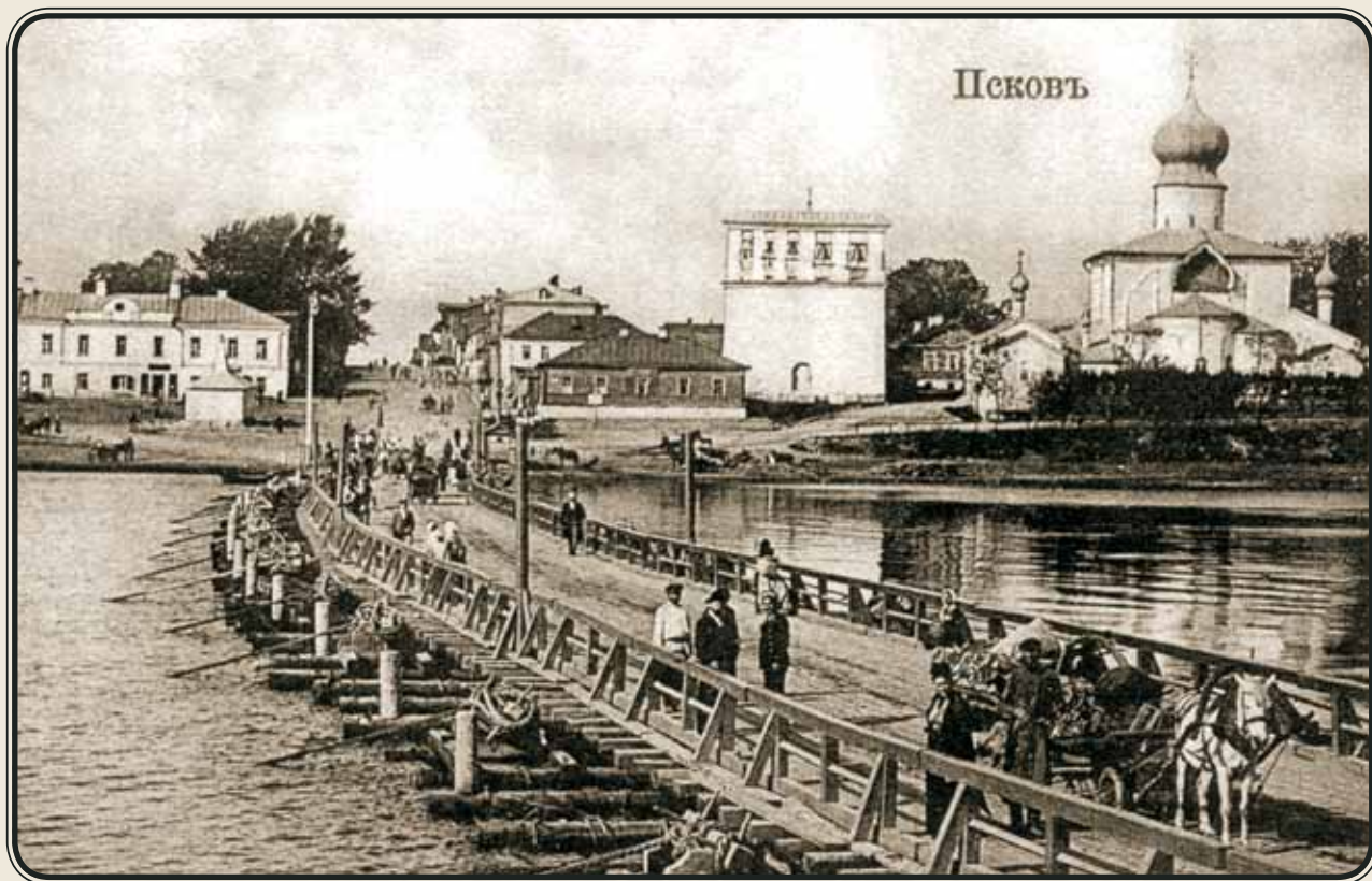
Наплавной мост. Открытка начала XX в.

Маленькая часовня была выполнена в подражание древним формам псковской архитектуры. Квадратная в плане, она не имела апсиды и была покрыта сомкнутым сводом, который завершался небольшим барабаном с круглой главой. Это при-