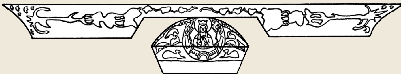
Богоматерь. Роспись северной стены Анастасиевской часовни в Пскове (1913).

ворного Спаса, а слева и справа от входа – фигуры святых князей, составляющие с ним единую композицию. Для церкви Покрова Богоматери села Пархомовка Николай Константинович делает несколько эскизов, среди которых «Спас Нерукотворный», «Покров Пресвятой Богородицы» и неосуществленный – «Царица Небесная над рекой жизни». Образ Царицы Небесной художник положил в основу решения алтарной росписи церкви Святого Духа в Талашкине. Роспись южной арки над входом содержала сюжет «Николай Можайский». Снаружи над входом в церковь помещалась мозаика «Спас Нерукотворный», над другим входом – «Святой Дух» в виде стилизованного голубя. Известно, что для часовни в Пскове создаются четыре эскиза: «Спас Нерукотворный и князья святые», «Святой Дух»; а два других, естественно предположить, – образы Богоматери и Николая Угодника. Это объясняется и временем написания эскизов – 1913 год; Рерих работал тогда в церкви Святого Духа в Талашкине.