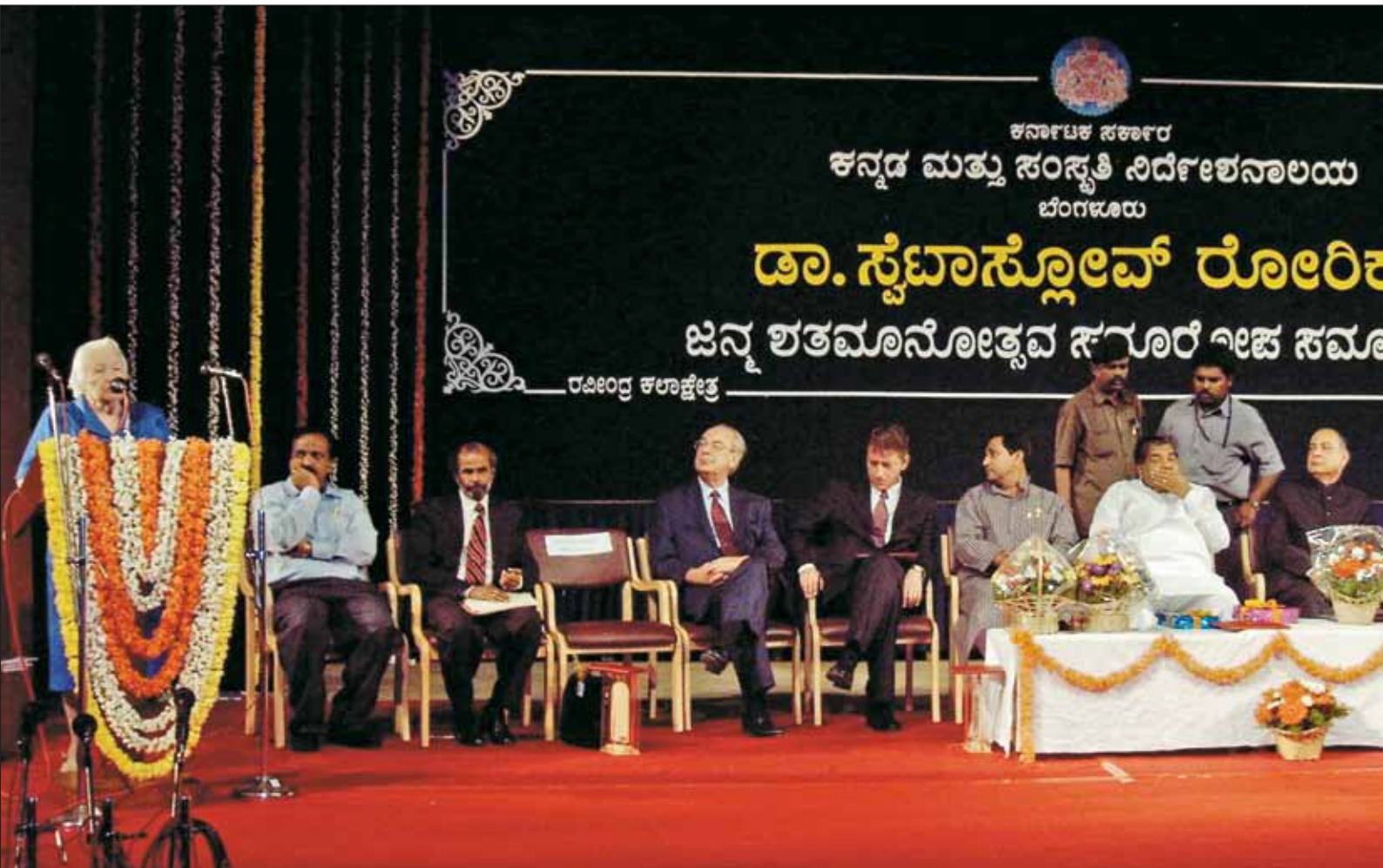
Торжественная встреча, посвященная 100-летию юбилею С.Н. Рериха, организованная при участии главного министра штата Карнатака Дхарма Сангха. Октябрь 2004 г.

Конечно, я так считала. Он стал президентом МЦР в октябре 1999 года, и с ним наступил но-