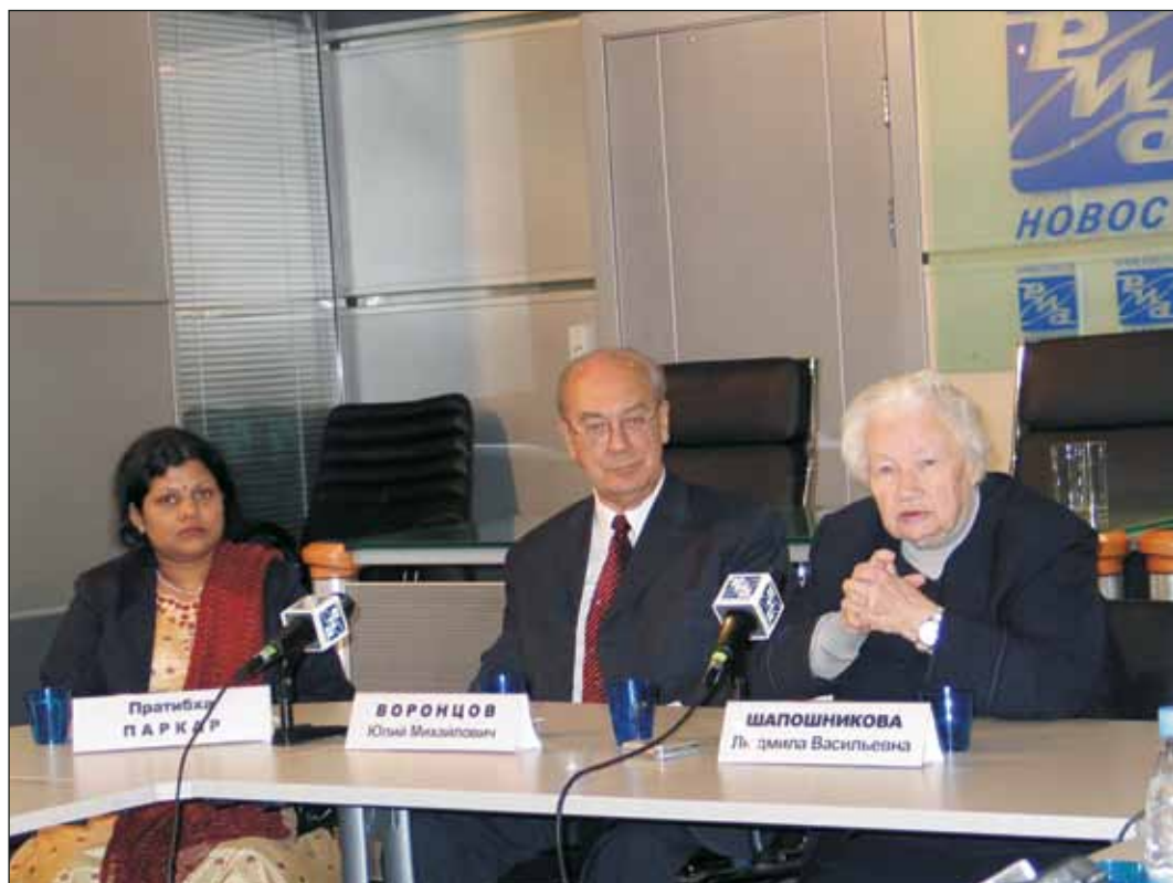
Пресс-конференция МЦР в РИА «Новости». 11 ноября 2004 г.

Не считая возможным отвечать на такие обвинения Рыжкова, Юлий Михайлович вышел из правительственного кабинета, хлопнув дверью так, что с потолка посыпалась штукатурка. Он даже не