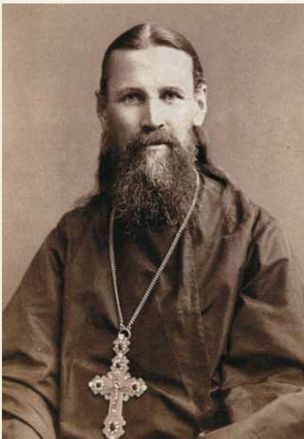
Святой праведный Иоанн Кронштадтский

о чем думают огненные служители» 4 . И еще: «Расширение горизонта и границ творчества будет залогом новых форм и новых ступеней. На пути к Миру Огненному уявим огненное устремление, и утончение чувств, и уплотнение мыслеформ» 5 .