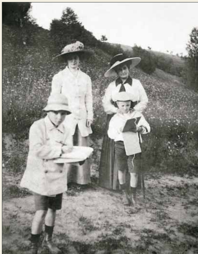
Е.И. Рерих (слева) с Юрием, Святославом и губернанткой на прогулке

на и Николай Константинович проводили много времени среди природы: на летние месяцы они уезжали из Петербурга в какое-нибудь уединенное место в одной из ближайших губерний или, если того требовала работа главы семейства, отправлялись в зарубежные поездки. Родители всячески поощряли тягу мальчиков к живой природе, учили детей понимать ее язык, слушать ее мудрый голос, любить ее красоту. «Светкина любовь ко всему живому простирается и на дождевых червей, улиток и прочих мерзостей, – писала Елена Ивановна своему мужу, находившемуся в отъезде. – Набрал этой гадости целую массу, все ведерки и банки заняты этой коллекцией, и не позволяет выбрасывать» 5 . Родители часто выходили с сыновьями на совместные творческие прогулки, где каждый, помимо общения, занимался своим делом: дети ловили бабочек и стрекоз, собирали гербарий, делали зарисовки в своих тетрадах, Елена Ивановна фотографировала, Николай Константинович писал картины. Живой пример любви родителей к природе, искреннего внимания к каждому ее явлению был для мальчиков лучшей школой жизни.