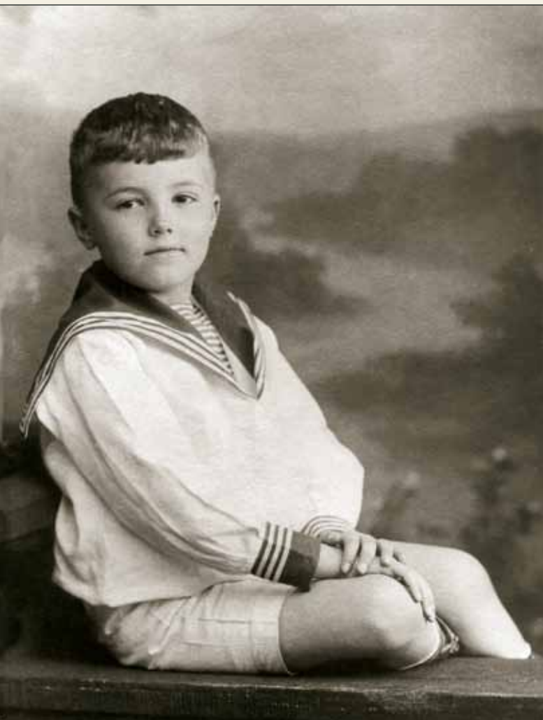
Юрий Рерих. [1910]

И они шли высшим путем – путем Знания и Сердца, путем труда и непрестанного совершенствования, неся в душе пример своих великих родителей. Этот путь привел их к прекрасным достижениям в своих областях, вписавшим их имена в историю мировой науки и искусства. Но главное качество, которое особенно ценила Елена Ивановна в сыновьях, было качество их духа – «великий синтез, который именно и дает основу нравственности и мудрой любви к Родине» 12 . «Так, без ложной скромности, – писала счастливая мать, – я могу сказать, что я справедливо горжусь своими сыновьями» 13 .