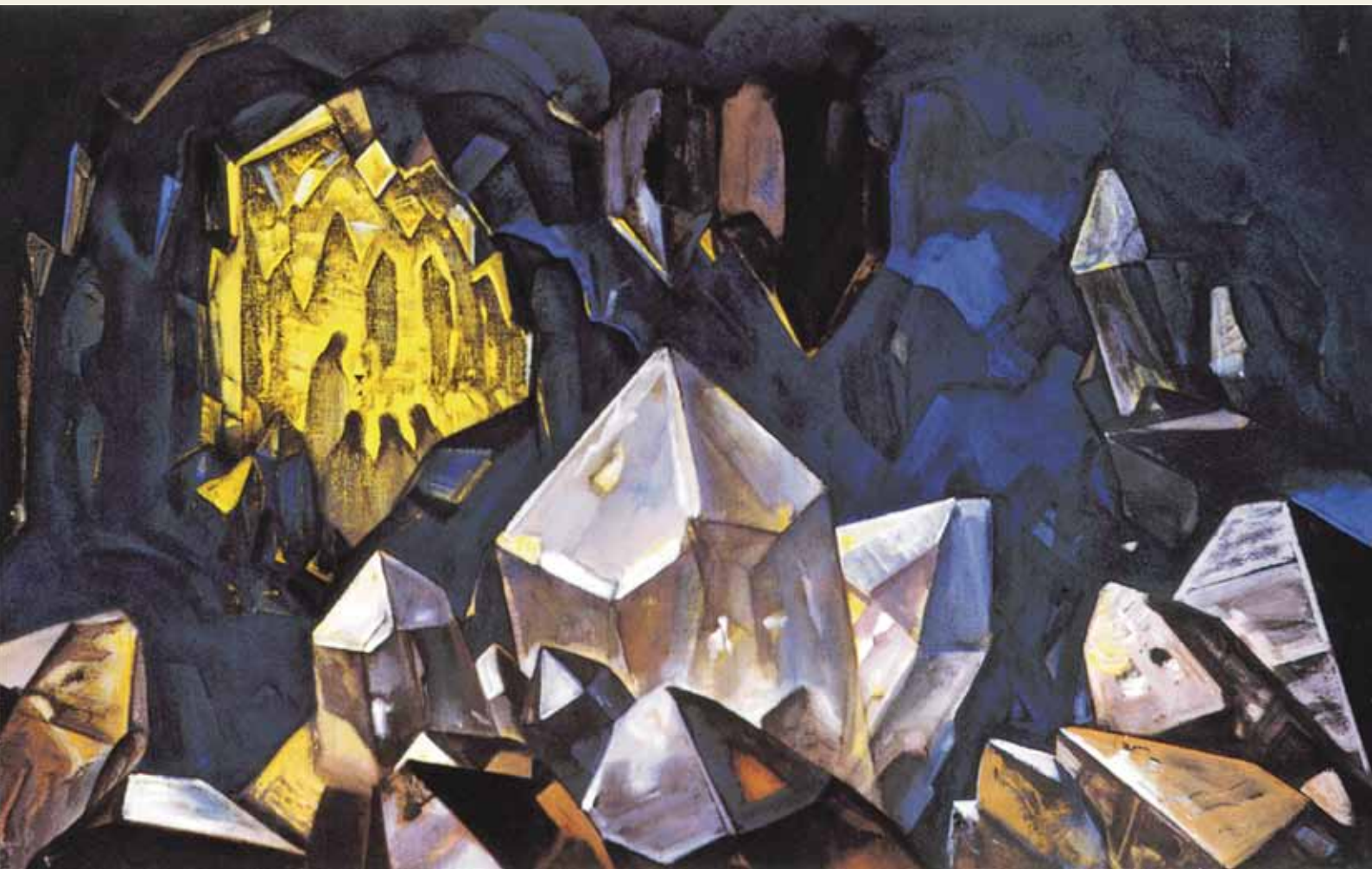
Н.К. Рерих. Сокровище гор. [1933]