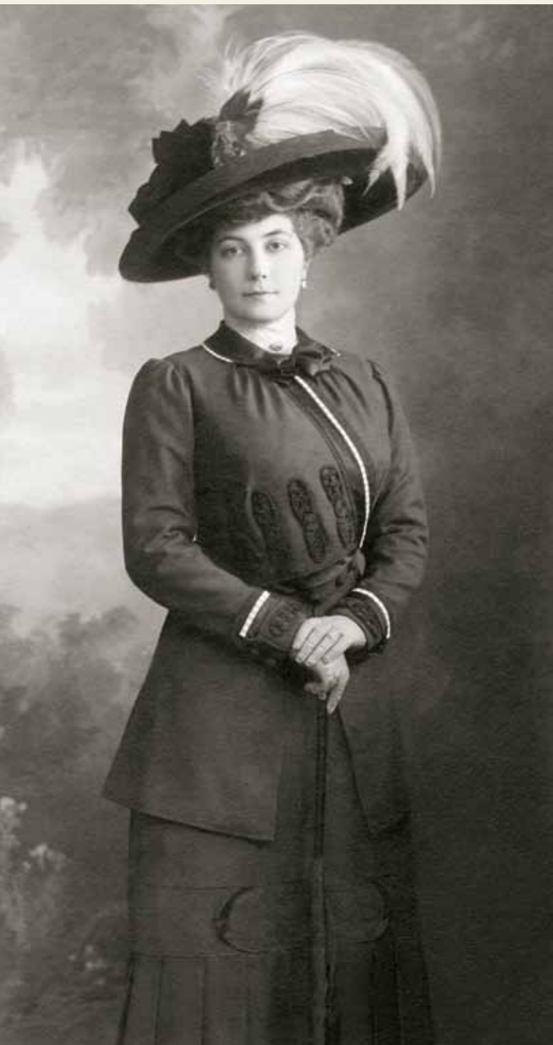
Елена Ивановна Рерих. 1915–1916

В 1920 году она начала записывать первую информацию о новой философской системе, которую назвала Живой Этикой, – современной, целостной концепции космической эволюции человечества – и с тех пор продолжала это делать всю жизнь. Елена Ивановна вступила в реальное сотрудничество с тем Высшим миром, о важнейшей роли которого так глубоко и образно писали русские философы Серебряного века. Работа над Живой Этикой требовала от Елены Ивановны огромного напряжения и немалых усилий. В архиве МЦР хранятся ее записные книжки. По ним мы можем видеть, сколь велик и тяжел был ее труд. Сообщения издали шли не только в словах, но нередко и в мыслеобразах. Она зарисовывала их, слова же записывала. Все это было необходимо затем соединить, систематизировать и представить читателю связный текст, посвященный сложнейшим сюжетам космической эволюции: Высшие миры, Мир Огненный, Иерархия Космоса, взаимодействие энергетических систем Мироздания, энергоинформационный обмен, роль энергетики человеческого духа в этом обмене, Великие законы Космоса и многое другое. Елена Ивановна записывала, а Николай Константинович Рерих запечатлевал все это на своих великолепных полотнах. Они работали вместе, как работали в древности жрец и художник, как трудились в старину святой и иконописец. Один видел, другой запечатлевал, или,