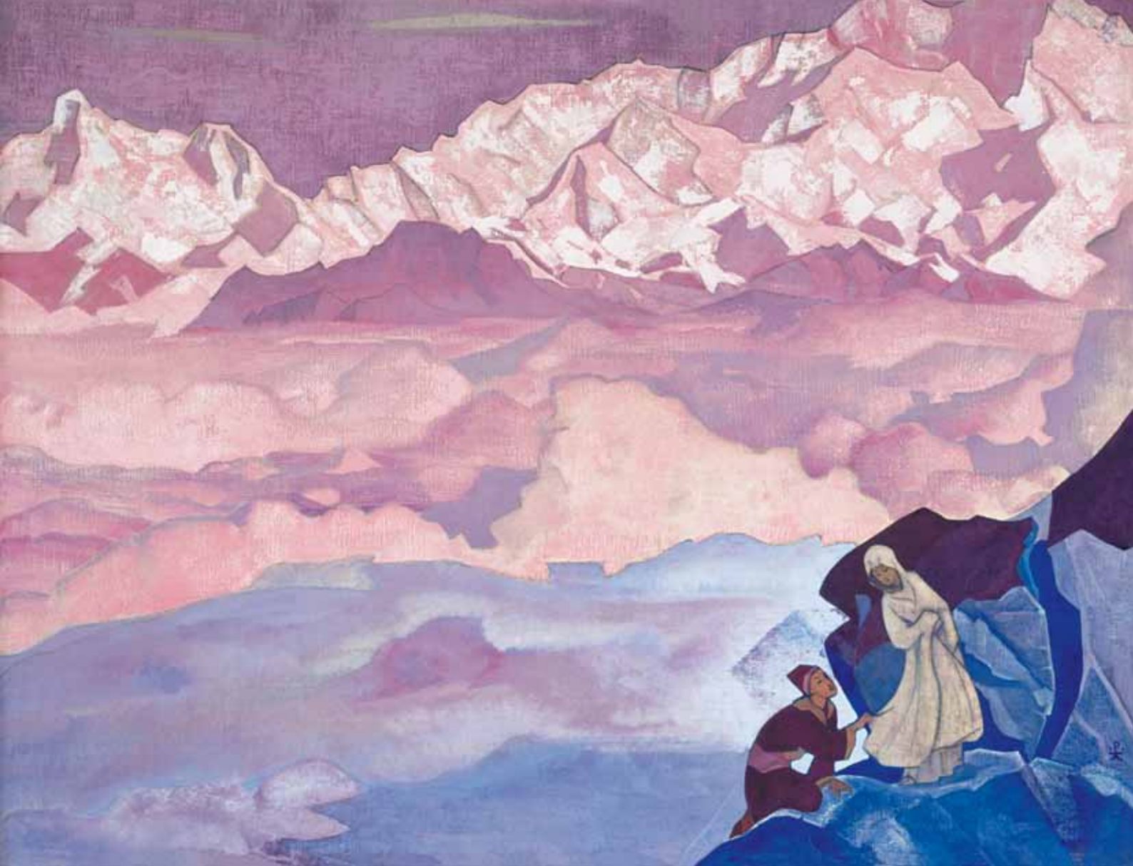
Н.К. Рерих. Ведущая. Из серии «Его Страна». 1924

ства материи иных состояний и измерений» 6 . Этот метод существенно отличается по принципу получения информации от методов, принятых в современной гуманитарной науке, где подразумевается напряженное вживание исследователя в постигаемую проблему или явление, происходящее преимущественно по горизонтали. В гуманитарных науках метод вживания и интуитивного постижения действительности известен давно и конституирован в рамках феноменологического и герменевтического подходов. Основатель феноменологии Э. Гуссерль писал: «...философия в своей научной работе принуждена двигаться в атмосфере прямой интуиции, и величайшим шагом, который должно сделать наше время, является признание того, что при философской в истинном смысле слова интуиции, при феноменологическом постижении сущности открывается