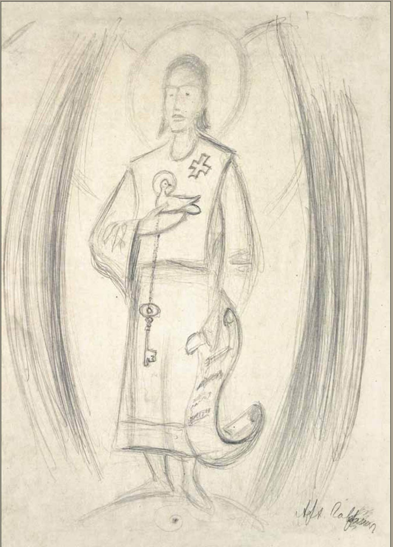
Е.И. Рерих. Архангел Гавриил