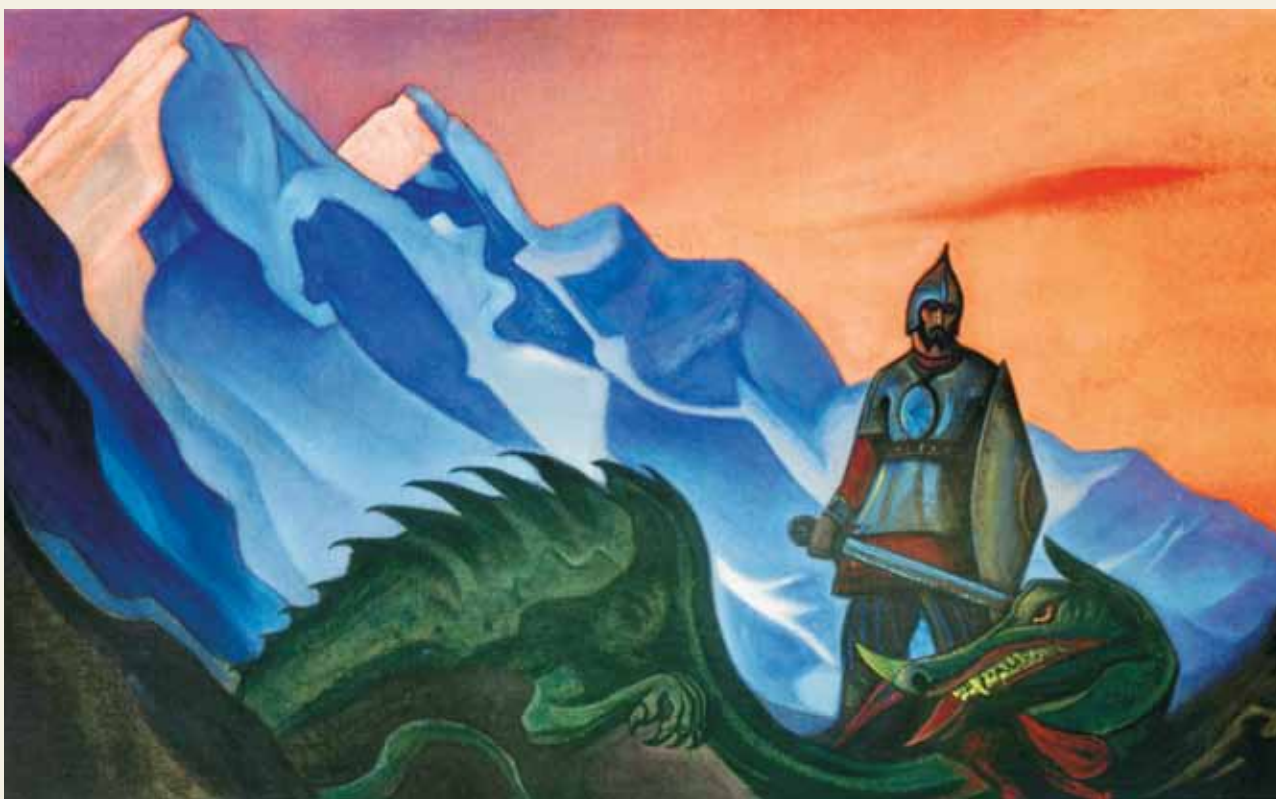
Н.К. Рерих. Победа. 1942