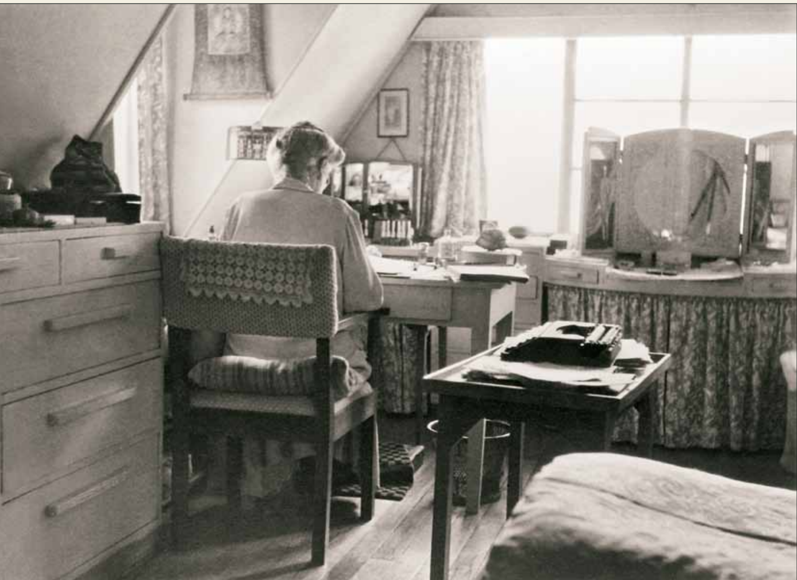
Елена Ивановна Рерих. Калимпонг. 1949–1955