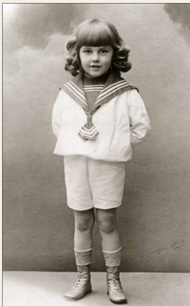
Святослав Рерих. [1908–1909]

Основой развития детей Елена Ивановна считает воспитание сердца и расширение сознания: оба