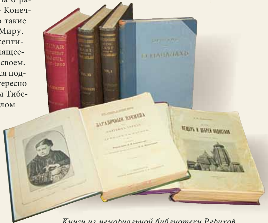
Книги из мемориальной библиотеки Рерихов

Безусловно, решающее воздействие на формирование мировоззрения Елены Рерих и впоследствии на ее собственное творчество оказала философская мысль Востока. Возможно, что мастерски написанные очерки Е.П. Блаватской, опубликованные на страницах «Русского вестника» в 1880 и 1884–1885 годах и впоследствии составившие книгу «Из пещер и дебрей Индостана», в которой она рассказала о богатейшей природе, уникальных исторических памятниках и разнообразных верованиях и обычаях народов, населяющих Индию, стали для Елены Рерих той самой «первой книгой», с которой начался ее поход к сокровенному знанию. По собственному признанию Блаватской, один из главных героев повествования – такур Гулаб Лалл-Сингх, человек необычный во многих отношениях и обладавший глубокими познаниями, – имел вполне реального прототипа – ее Учителя Махатму М. Это мнение разделяла и Елена Ивановна. «...Еще в России <...> Прекрасный, Мужественный и Суровый Облик Учителя заполнил мою душу и с тех пор жил и живет в моем сердце как Высший Идеал, как Мечта Сокровенная» 9 , – писала она 17 ноября 1953 году Б.Н. и Н.И. Абрамовым. Связь Е.П. Блаватской с Великими Учителями никогда не ставилась Е.И. Рерих под сомнение, и впоследствии свою миссию она видела органически связанной с миссией этой удивительной женщины, которую называла «нашей национальной гордостью», «мученицей за Свет и Истину», мечтая о том времени, когда в России