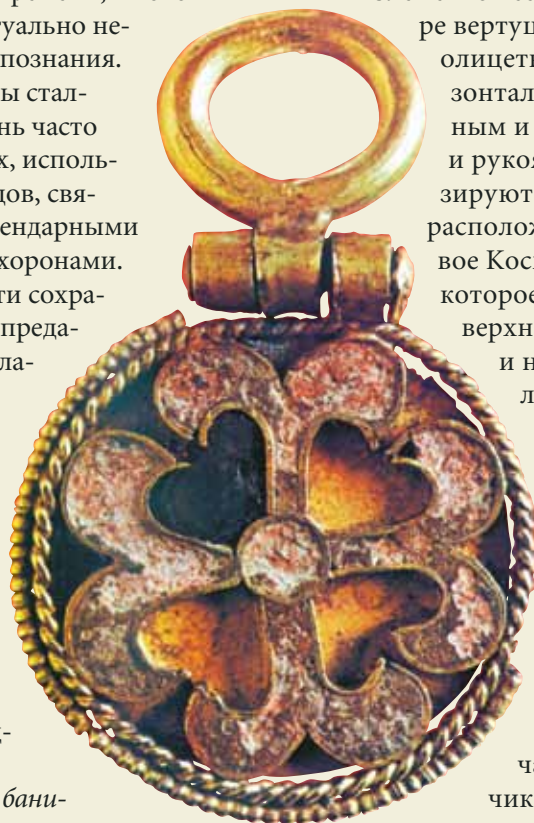
Золотое украшение для ремня. IX в. Национальный исторический музей, г. София, Болгария

В этом обычае можно слышать далекие отголоски ритуальной инициации мальчиков, выступающих в роли героя, установившего своим