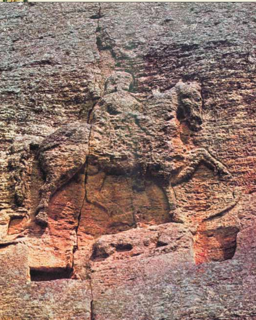
Каменный барельеф «Мадарский всадник», высеченный на скалах на высоте 23 метра в окрестностях села Мадара. XVIII–IX вв.

лизирован огромный массив информации и отделено все, что казалось сомнительным или не имеющим прямой связи с проблемой. Достоверно известно только имя верховного и единственного праболгарского бога – Тангра. Сведения можно было найти только в близких религиозных учениях, сопоставляя и находя параллели с тангризмом. Это зороастризм, орфизм, тантризм и, конечно, богомилство, а также производные от него ереси в Европе, которые являлись, вероятно, попыткой пересмотра христианства и реабилитации основных постулатов старой праболгарской религии. Другим источником могут служить культуры соседних народов, нося-