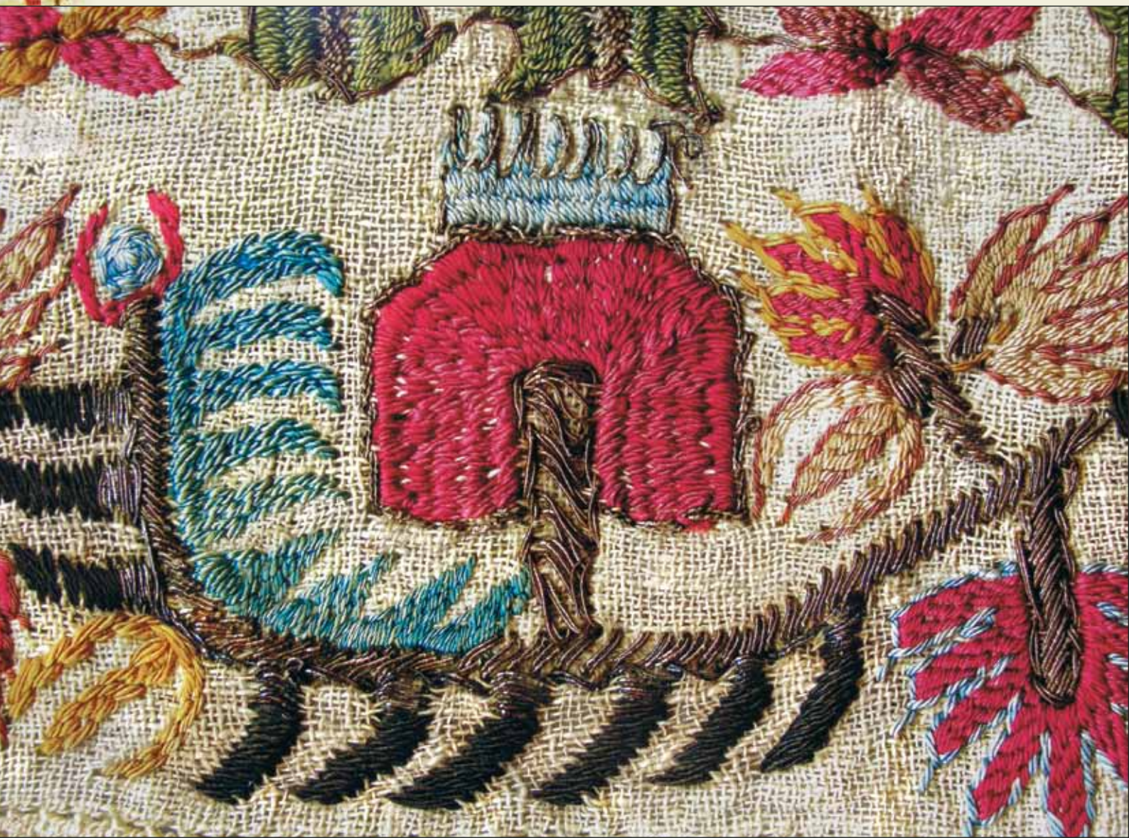
Сокай – украшение традиционного наряда невесты (Северная Болгария). Конец XVIII в. Музей Национальной художественной академии, Болгария