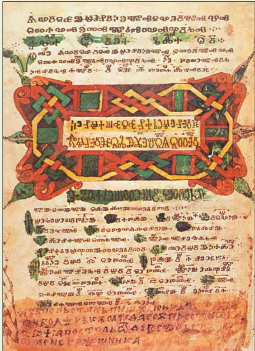
Лист из Асеманиева Евангелия – памятника древнеболгарской глаголицы. XI в. Библиотека Ватикана

О древней языческой культуре праболгар мы знаем очень мало. Хотя исследован и проана-