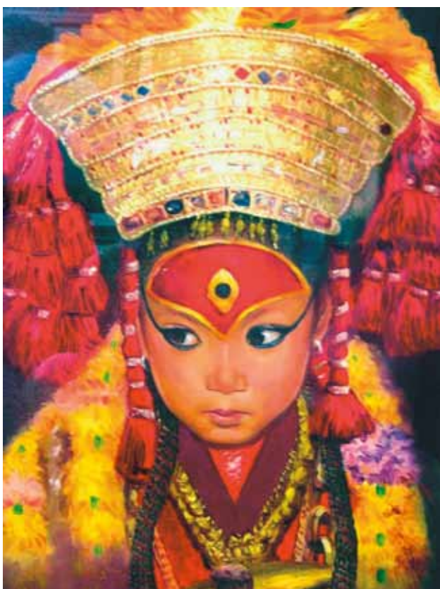
В торжественном облачении