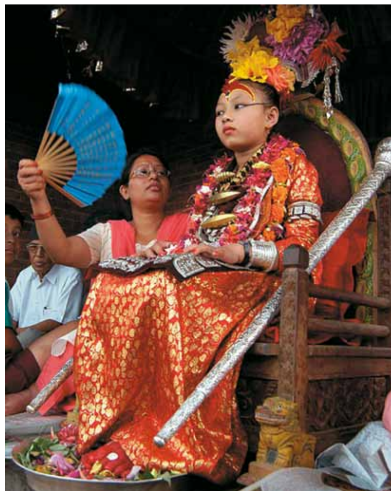
Божественная Кумари на троне

Но на этот раз король был, видимо, в романтическом настроении и, глядя на богиню, как-то неожиданно отметил про себя, что она обладает не-