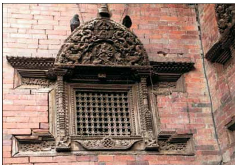
Окно, в котором появляется божественная Кумари

Буддизм был знаком непальцам значительно раньше, чем индуизм. Согласно принятой версии, клан шакья (уже упоминавшийся выше в связи с выбором кандидатуры на роль Кумари), у правителя которого в полнолуние 8 апреля 623 года до н.э. и родился, известный ныне как Будда Ша-