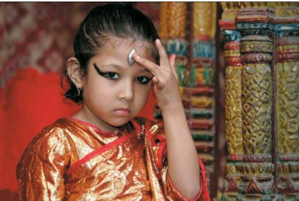
Взгляд живой богини

жизни непальцев красноречиво говорят поэтические строки местного писателя Гьянканджи Манандхара: