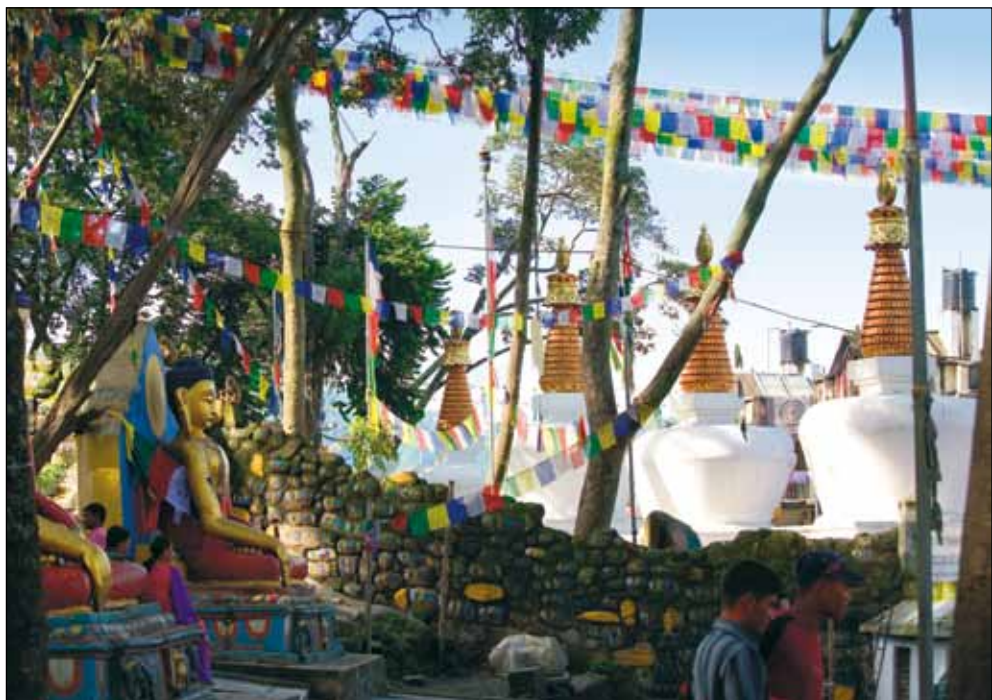
Окрестности ступы Сваямбуднатх. Катманду