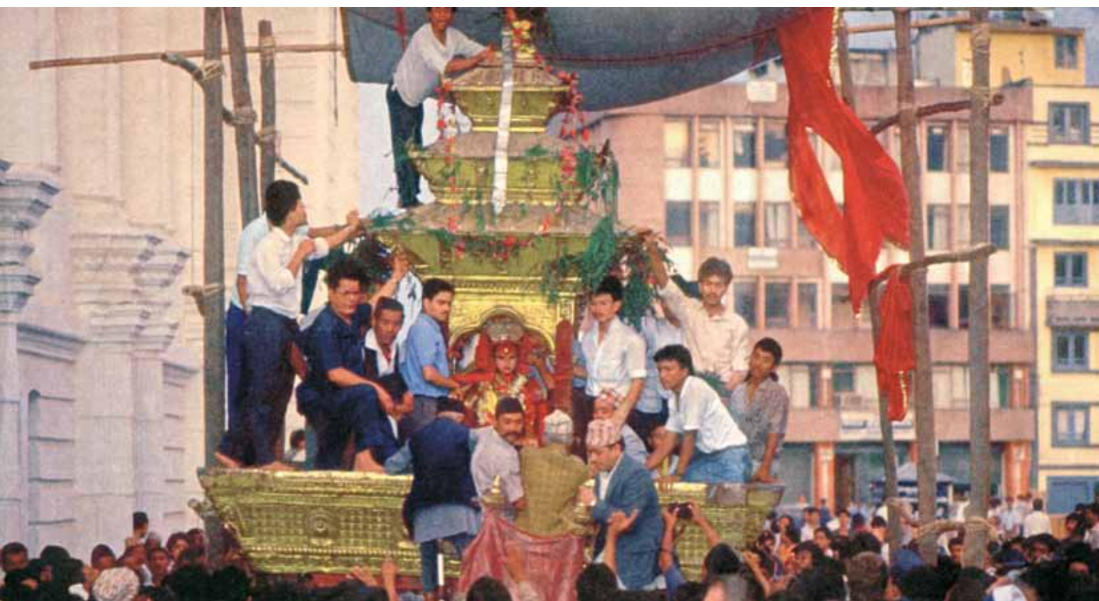
На празднике Индра Джатра. Колесница богини Кумари пробирается через толпу жителей Катманду

снисходительный) характер, черные волосы, темные глаза, матовая, без каких-либо видимых изъянов кожа, здоровые зубы, отсутствие дурного запаха, бородавок, следов от шрамов или глубоких порезов, хорошо развитые ножки, правильная походка, крепкое здоровье и т. д. Непременное условие – соответствие гороскопов кандидатки и здравствующего короля. В одном из текстов содержалось положение о том, что «бедрa у нее должны быть, как у оленихи, и чтобы шея напоминала морскую витую раковину».