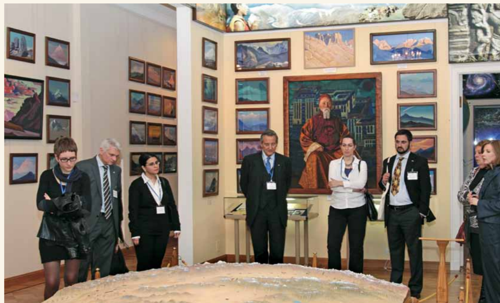
Члены австрийской делегации в зале Центрально-Азиатской экспедиции

Частные коллекции и инициативы приобретают все большее значение. Частные инвесторы, предлагая новые способы финансирования, содержания и пополнения коллекций, могут действовать более гибко и динамично, чем хранители крупных государственных коллекций.