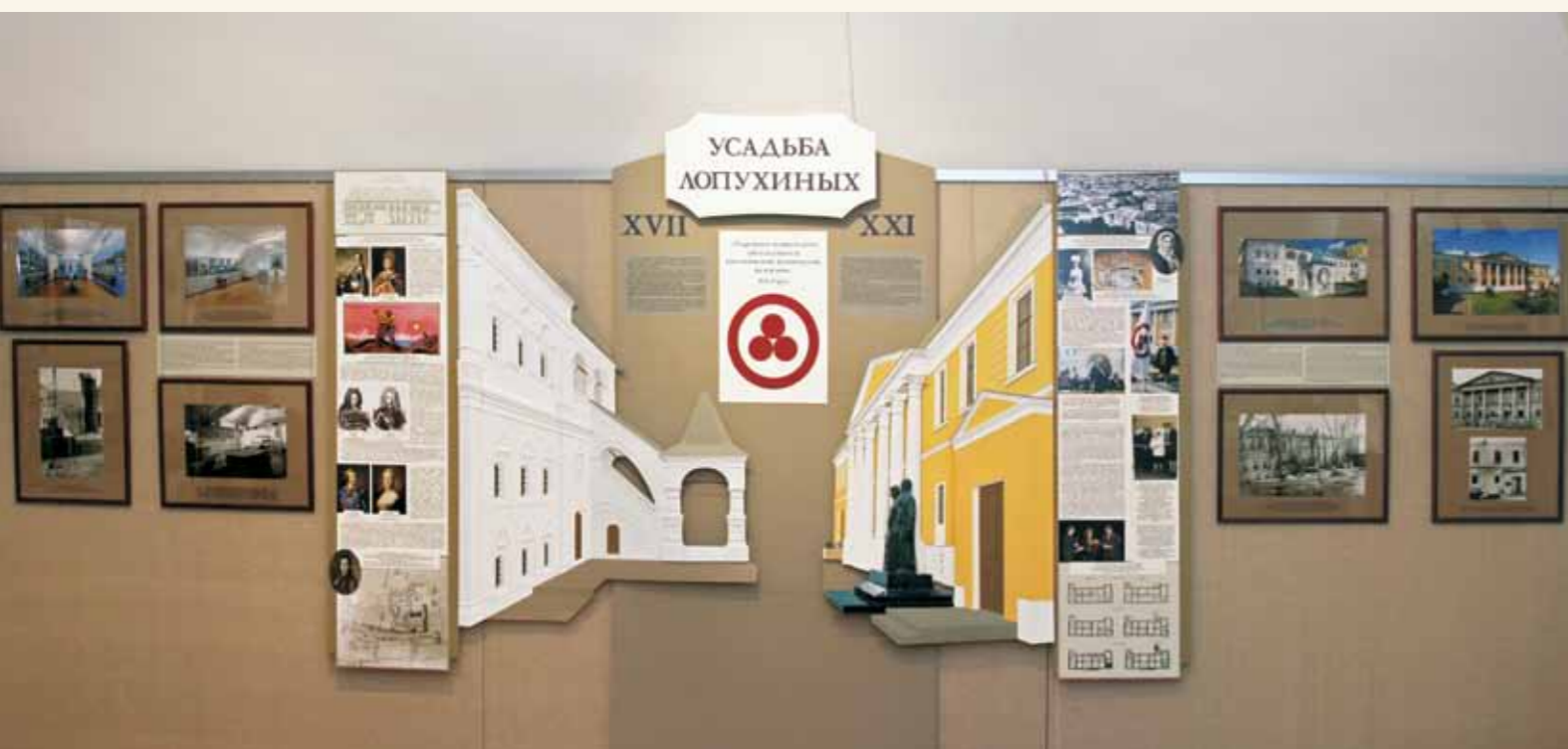
Фрагмент экспозиции «Усадьба Лопухиных. Прошлое. Настоящее. Будущее»

Eurora Nostra сотрудничает с неправительственными организациями и в России – ее членами являются, например, Национальный фонд «Возрождение русской усадьбы»; Московское общество по защите архитектурного наследия, которое подго-