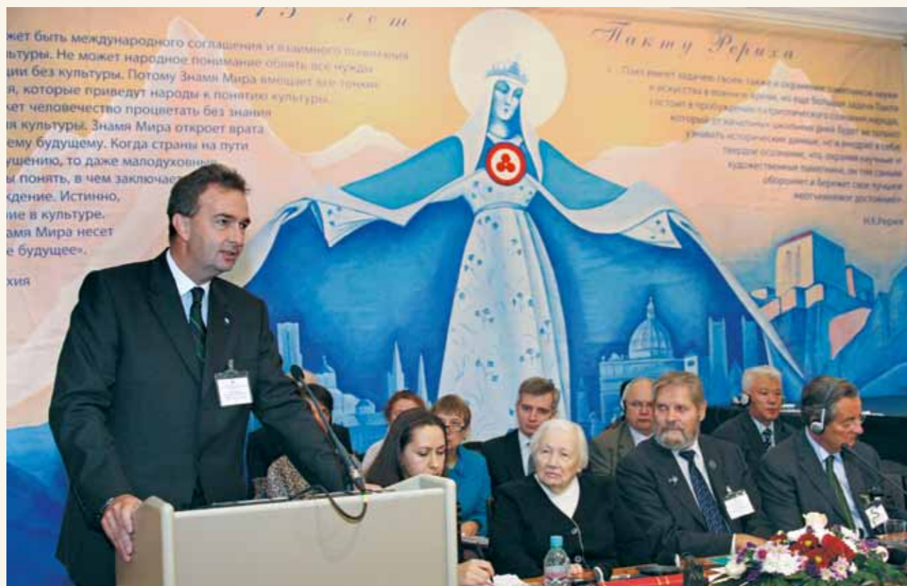
С приветствием выступает Карл фон Габсбург-Лотринген (Австрия)

это прекрасный пример частной инициативы, отличная модель участия неправительственной организации в этой важной государственной задаче. Несомненно, такая инициатива нуждается во всемерной поддержке со стороны государства.