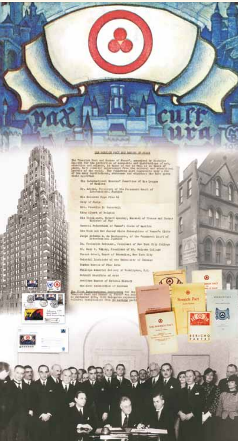
Баннер экспозиции «75 лет Пакту Рериха»

Конференция, посвященная юбилею Пакта Рериха, прошла в Международном Центре-Музее имени Н.К. Рериха с 8 по 11 октября 2010 года. Ее организаторами выступили: Российская академия художеств, Российская академия естественных наук, Российская академия космонавтики имени К.Э. Циолковского, Институт истории естествознания и техники имени С.И. Вавилова РАН, Международная ассоциация фондов мира, Международный гуманитарный общественный фонд «Знание» имени академика К.В. Фролова, Всероссийское общество охраны памятников истории и культуры, Международная Лига защиты культуры, Благотворительный Фонд имени Е.И. Рерих, Мастер-Банк. Этот представительный форум собрал ученых и общественных деятелей со всего мира. В церемонии открытия конференции приняли участие представители посольств Франции и стран, подписавших Пакт Рериха, – Индии, Гватемалы, Колумбии и Коста-Рики.