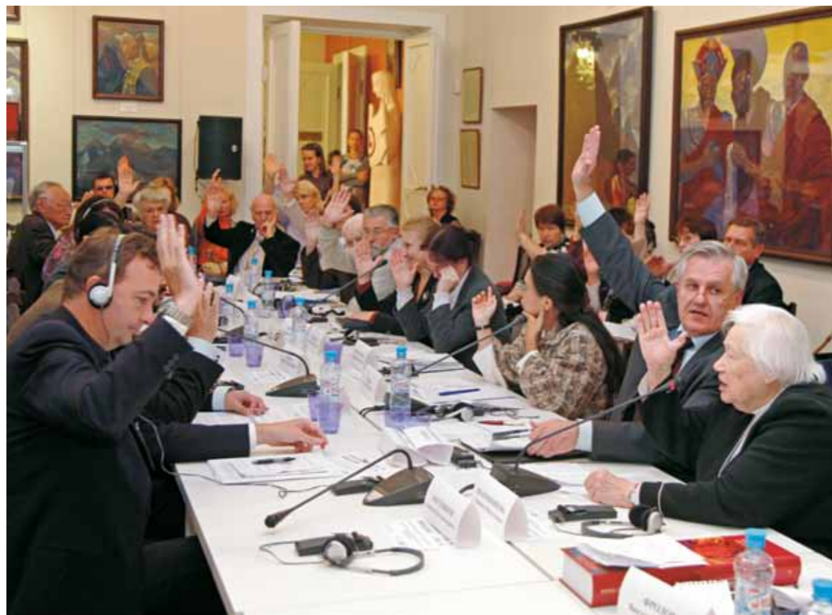
Принятие резолюции международной конференции

5. Не допускать очернение и клевету имен и наследия Рерихов и тем самым прекратить нарушение международных принципов и норм, установленных в актах ЮНЕСКО. Предпринять все необходимые меры для выполнения своего международного обязательства, а именно: обеспечить уважение культурного наследия Рерихов в обществе, особенно при помощи образовательных, разъяснительных и информационных программ.