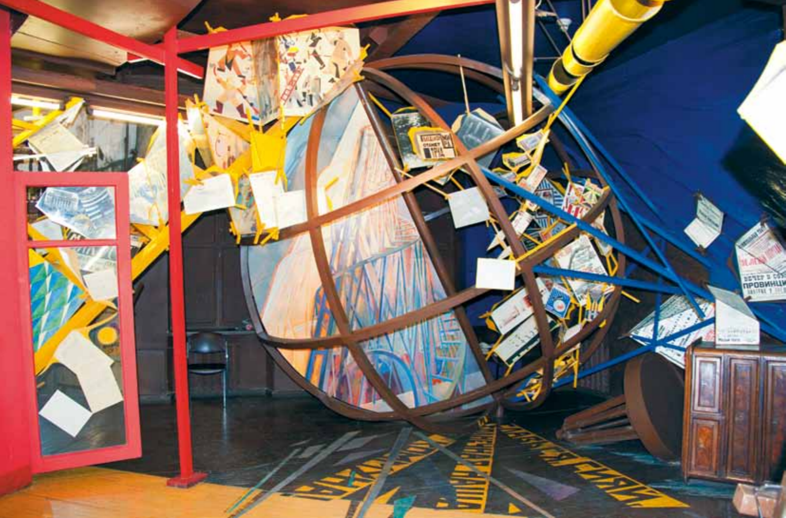
«Да здравствует новая религия!»

му, где одно время находилась редакция журнала «ЛЕФ», где постоянно кипела работа. Многие ожидают увидеть здесь «творческий беспорядок», который часто характерен для неординарных людей. Но Маяковский был в этом плане очень педантичен. Возможно, ощущая некоторый хаос в душе, в своей жизни, ему хотелось видеть хотя бы внешний порядок в своем доме, которого он так долго ждал. Здесь все всегда было разложено по полочкам и ящикам, аккуратно прибрано. В комнате нет ни грамма роскоши, хотя в двадцатые годы Маяковский был уже известным поэтом и мог себе ни в чем не отказывать. Но такой уж он был человек, предпочитавший больше отдавать другим, нежели обрести ненавистным для него бытом. Есть лишь единственное, чем он позволяет себе «обращаться», – это записки, они нескончаемым потоком шли на сцену во время его выступлений. За всю жизнь он соберет более 20 тыс. самых разных записок и будет их бережно хранить в шкатулке красного дерева, которая, как и раньше, стоит на его рабочем столе.