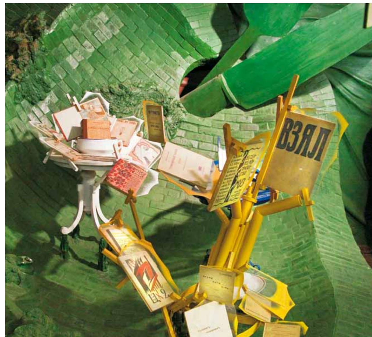
«Долой ваше искусство!»

День этого знакомства он отметит в автобиографии отдельной маленькой главкой под заголовком «Радостнейшая дата». Об отношении Владимира Маяковского с Лилей Брик написано