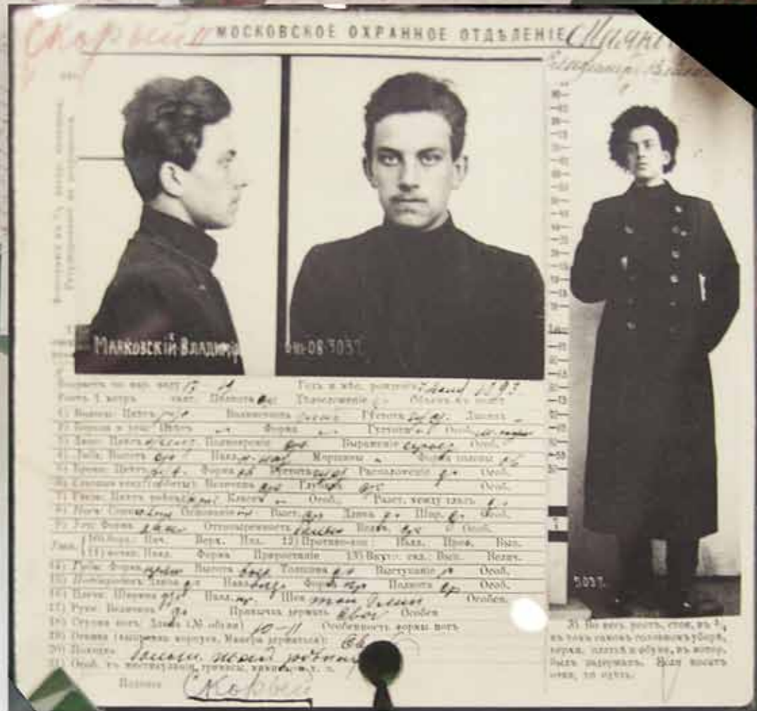
Регистрационная карточка Московского охранного отделения. 1908

борьбы ему помогают запрещенные книги, листовки и прокламации, которые привозит из Москвы сестра Людмила, когда приезжает на каникулы домой. Именно эта литература валится из-под крышки парты Маяковского буквально на головы посетителям: Маркс, Энгельс, Ленин и Каутский; поражающий набор для 12-летнего подростка! Свой детский восторг от всего запрещенного Владимир Маяковский потом тоже вспомнит: «Приехала сестра из Москвы. Восторженная. Тайком дала мне длинные бумажки. Нравилось: очень рискованно. Помню и сейчас. Первая: