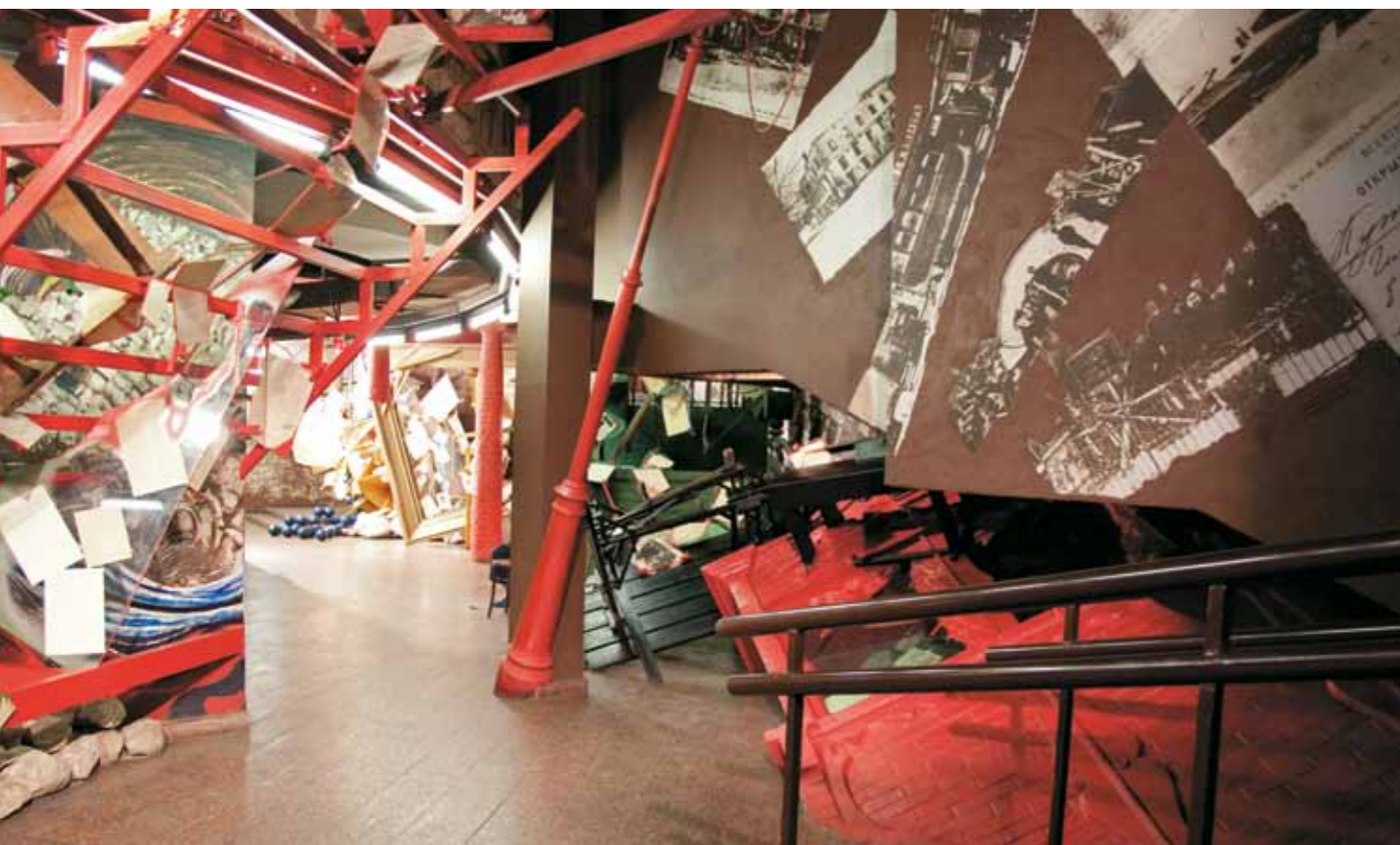
Зал «Рождение человека, поэта, гражданина»

«Володю заинтересовал маяк. Ему объяснили устройство и назначение маяка: он далеко светит и указывает путь морякам. Володя поднялся наверх и сказал Оле: