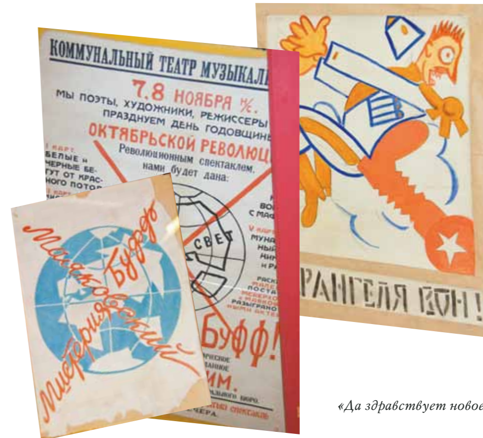
«Да здравствует новое искусство!»

«Однажды на одном жарком диспуте о путях советской живописи я настолько увлекся страстным спором, что забыл о ждущей меня дома срочной работе. Была уже полночь, когда я вернулся в свою холодную комнату. Надо было приготовить ужин и написать около двадцати пяти листов (состав-