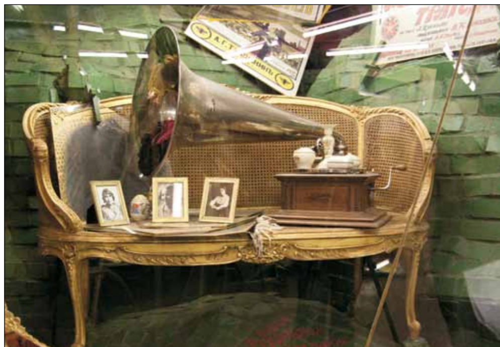
«Долой вашу любовь!»

«Зимой 1913 года я был в Луна-парке, в бывшем театре Комиссаржевской, и стоял в помещении для оркестра вместе с Хлебниковым и другими “будетлянами” – мы смотрели трагедию Маяковского “Владимир Маяковский”, в которой главную роль исполнял он сам. Театр был набит до последней возможности. Ждали колоссального скандала, пришли ужасаться, негодовать, потрясать кулаками, свистать, – а услышали тоскующий, лирический голос, жалующийся со страстной искренностью на жестокость и бессмыслицу окружающей жизни.»