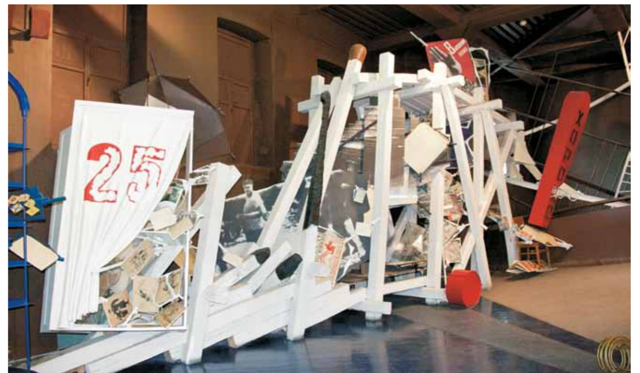
Мост в социализм

Вместе с ним мы оказываемся в мастерских Пикассо, Леже... Вызывает улыбку представленный в этой инсталляции дружеский шарж Делоне – кстати, это первый шарж, который был нарисован на Маяковского. Хотя сам Маяковский был весьма ироничен по отношению к себе, о чем свидетельствует собственноручно нарисованная им на себя карикатура в одной из записных книжек во время очередного пребывания в Париже.