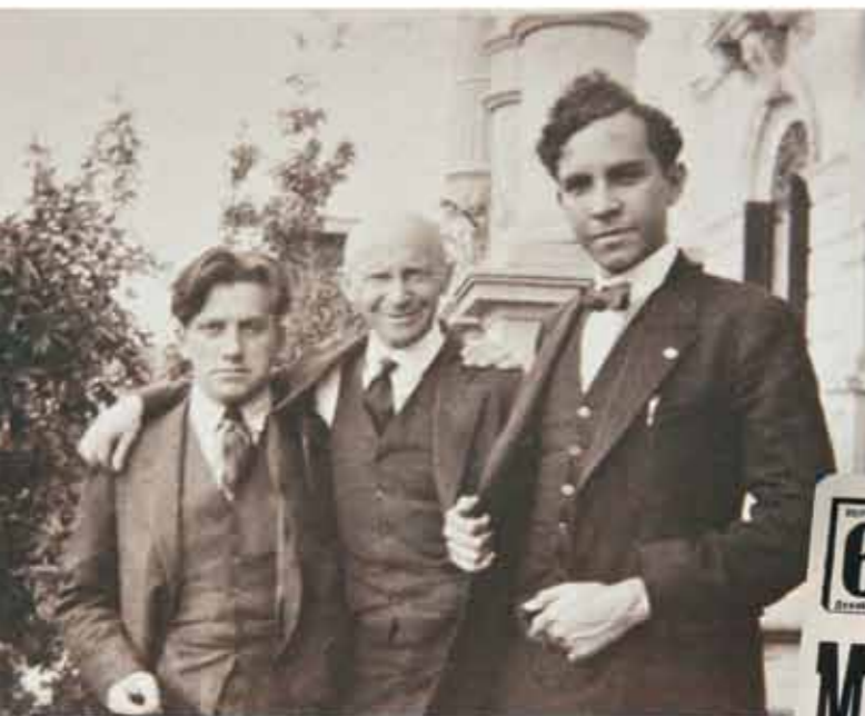
Во дворе советского полпредства в Мексике. В.В. Маяковский, В.Я. Волинский и Ф. Морено. 1925

он скажет, что в Америке нет никакой свободы, а есть только статуя. На афише одного из выступлений отчетливо читается главный тезис, заявленный Маяковским: «Бог – доллар, доллар – дух святой». Он проведет в этой стране лишь три месяца, хотя с большим трудом ему удалось добиться полугодовой визы. В итоге будут строки: