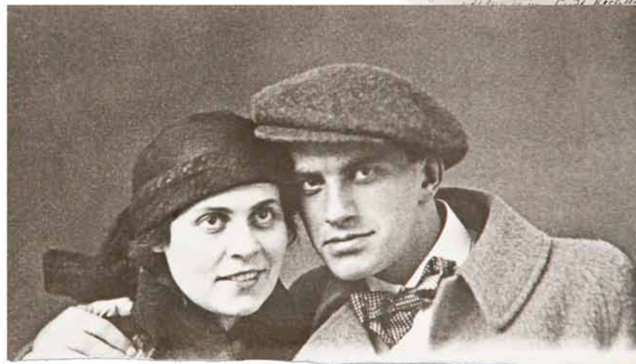
Лиля Брик и Владимир Маяковский. 1915

ваться, – ворчал он» (А.М. Нюренберг. «Маяковский с художниками»).