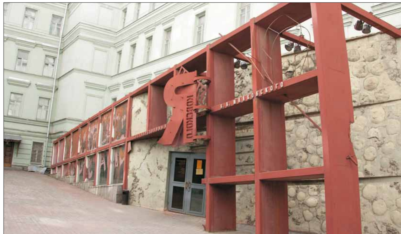
Фасад Музея В.В. Маяковского в Лубянском проезде

Нет единственно верной интерпретации того, что мы увидим внутри музея. Входя в этот дом и эту эпоху, вы начинаете разгадывать ребусы, загадки, и только от вас зависит,