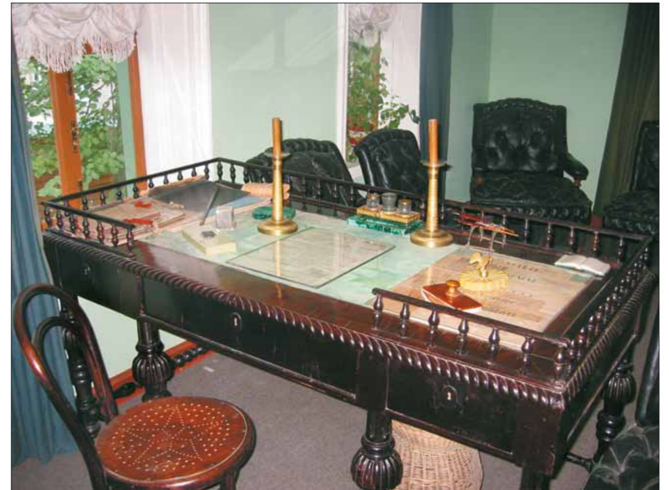
Рабочий стол писателя в его кабинете

наты резко контрастируют с новой, перестроенной частью дома, они суровы и аскетичны. В мастерской – спортивные гантели, каждое утро Толстой занимался зарядкой; велосипед, подаренный ему английской фирмой Rover, на котором он учится ездить в шестьдесят семь лет; инструменты для изготовления сапог и сами сапоги, которые он собственноручно сделал для своего друга Фета.