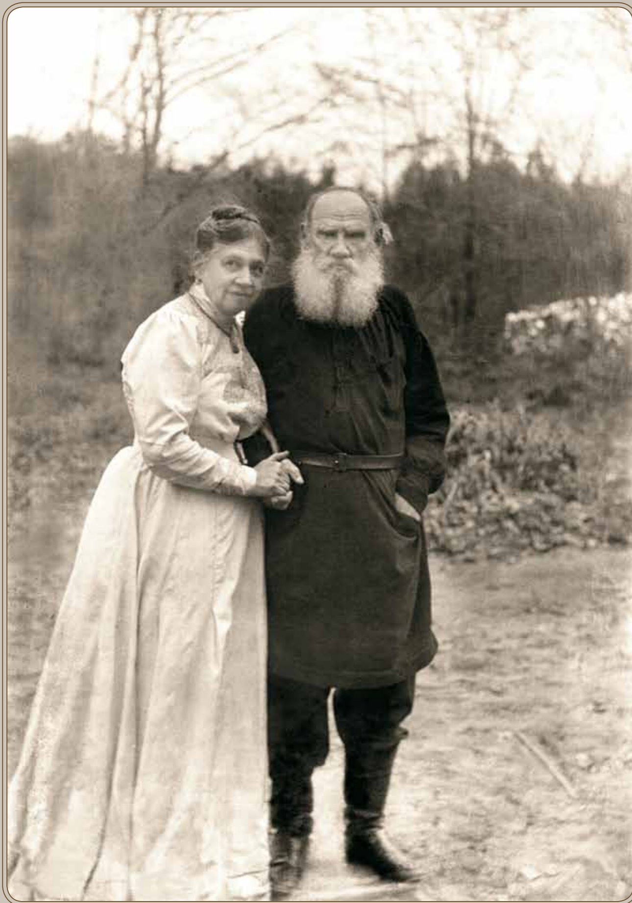
Фотопортрет Софьи Андреевны и Льва Николаевича Толстого незадолго до его ухода