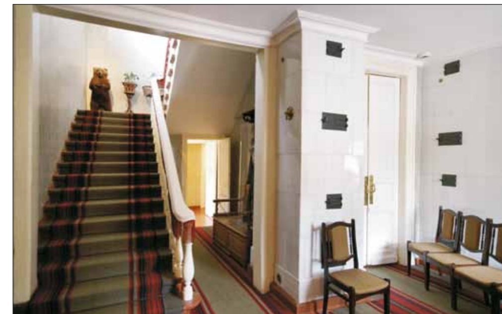
Прихожая и лестница на второй этаж

Льва Толстого) с надворными постройками и садом. Сад сыграл решающую роль – Толстого не остановило ни соседство с тремя фабриками, ни то, что дом необходимо было перестраивать под большую семью. В год покупки дома в Хамовниках Льву Николаевичу пятьде-