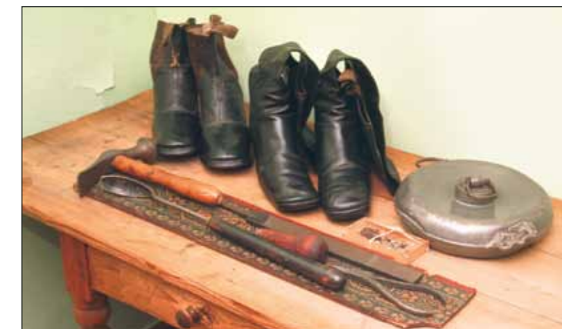
Ботинки, собственноручно сделанные графом Толстым

Сонечка... Соня... Софья Андреевна... Как был с ней счастлив Толстой первые годы. Он писал в дневнике: «Неимоверное счастье... Не мо-