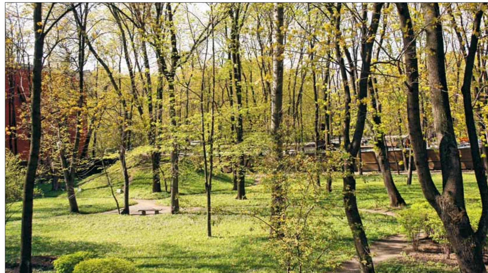
Насыпная горка в осеннем саду