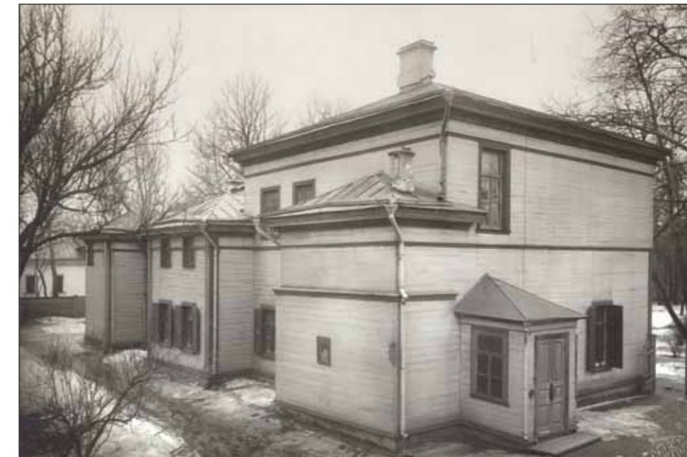
Усадьба ранней весной

«В городе человек может прожить сто лет и не хватиться того, что он давно умер и сгнил. Разбираться с самим собой некогда, все