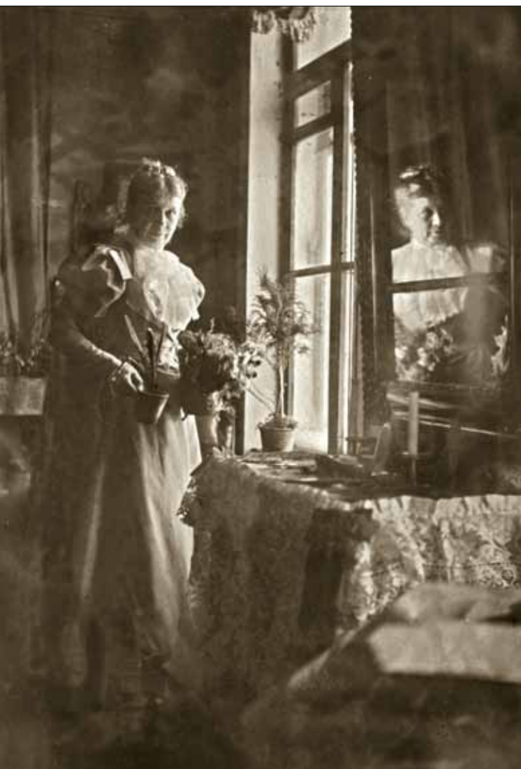
Софья Андреевна Толстая

жет быть, чтобы это все кончилось только жизнью» 6 . Молодая восемнадцатилетняя жена принесла заботу и уют, которых так недоставало в доме ее мужа. К моменту женитьбы Толстому исполнилось тридцать четыре года, и он уже составил для себя определенные представления о том, каким должен быть этот брак, — он хочет «воспитать» супругу непременно из незнатного рода и берет в жены «дочь врача, дворянина по выслуге». Он покупает ей платья у лучших портных, настаивает, чтобы она ездила