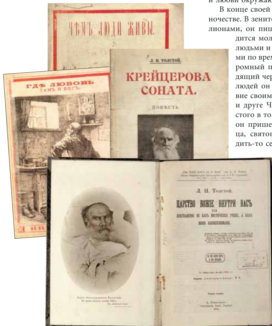
Прижизненные издания поздних произведений писателя