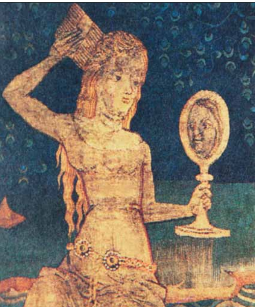
Девушка, смотрящаяся в зеркало. Средневековая шпалера

перед ним. Историк М.М. Забылин описывает различные формы гаданий на зеркалах и подчеркивает: «Такие гадания производят только самые смелые девушки, которые более осознанно и серьезно хотят ознакомиться со своей будущностью» 3 . В народе верили: это опасно.