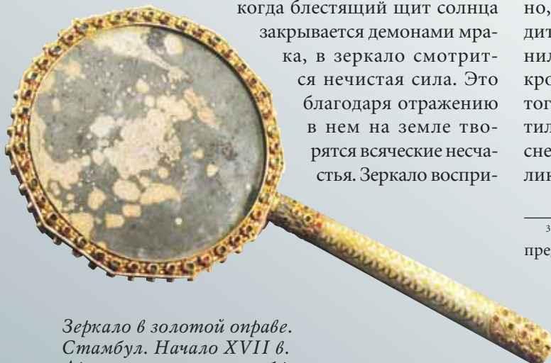
Зеркало в золотой оправе. Стамбул. Начало XVII в. Драгоценные камни, нефрит, чеканка, стекло, инкрустация