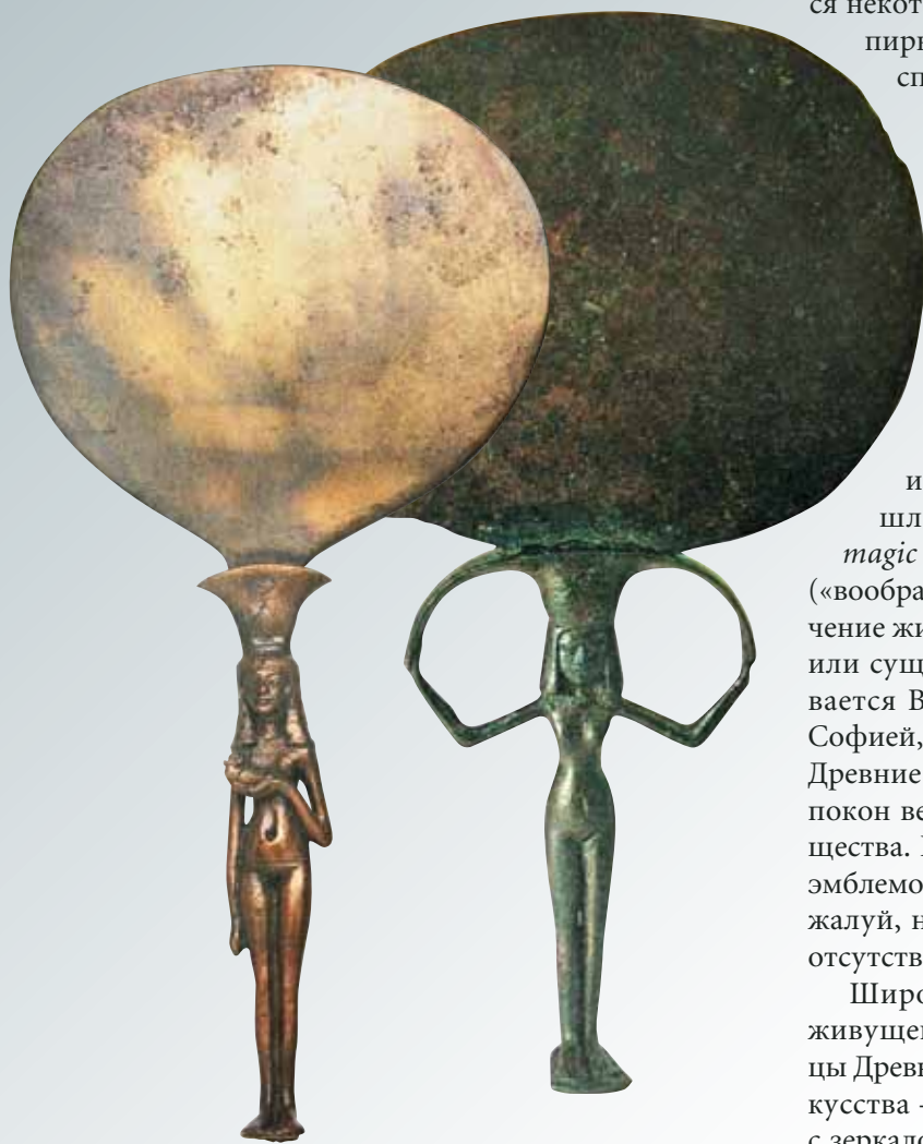
Полированные бронзовые зеркала. Древний Египет, XV в. до н.э.

Широко использовалось понятие двойника, живущего в зеркале. Его умели «вызывать» жрецы Древнего Египта. Среди образцов скифского искусства – сидящая женщина в длинном одеянии с зеркалом в руках и стоящий перед ней молодой воин. Исследователи обнаружили, что зеркало вовсе не атрибут богини: оно является формой раскрытия «двойника» противоположного пола в зеркале. У индийцев, таджиков, персов и других народов, предки которых были близкими родственниками скифов, так совершался свадебный обряд: жених и невеста должны смотреться в одно зеркало. У некоторых народов принято, чтобы молодые впервые увидели друг друга именно отраженными в зеркале. Кстати, практика «общения с двойником» и сегод-