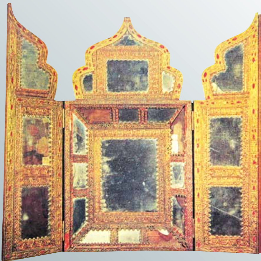
Зеркало-складень. Конец XVII – начало XVIII в.