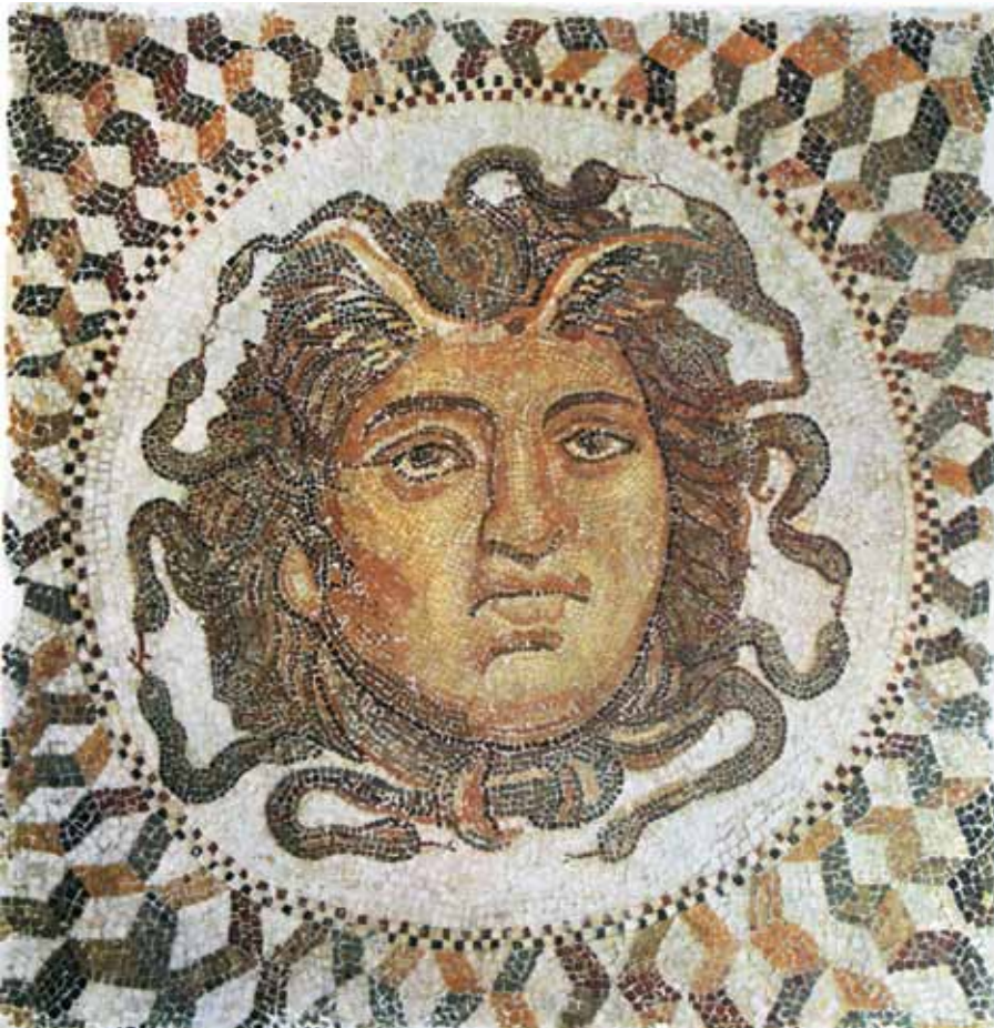
Горгона Медуза. Древнеримская мозаика

рая идет в Аид, и его “светлую душу”, или отражение в воде и зеркале, которое остается там, где он умирает» 2 .