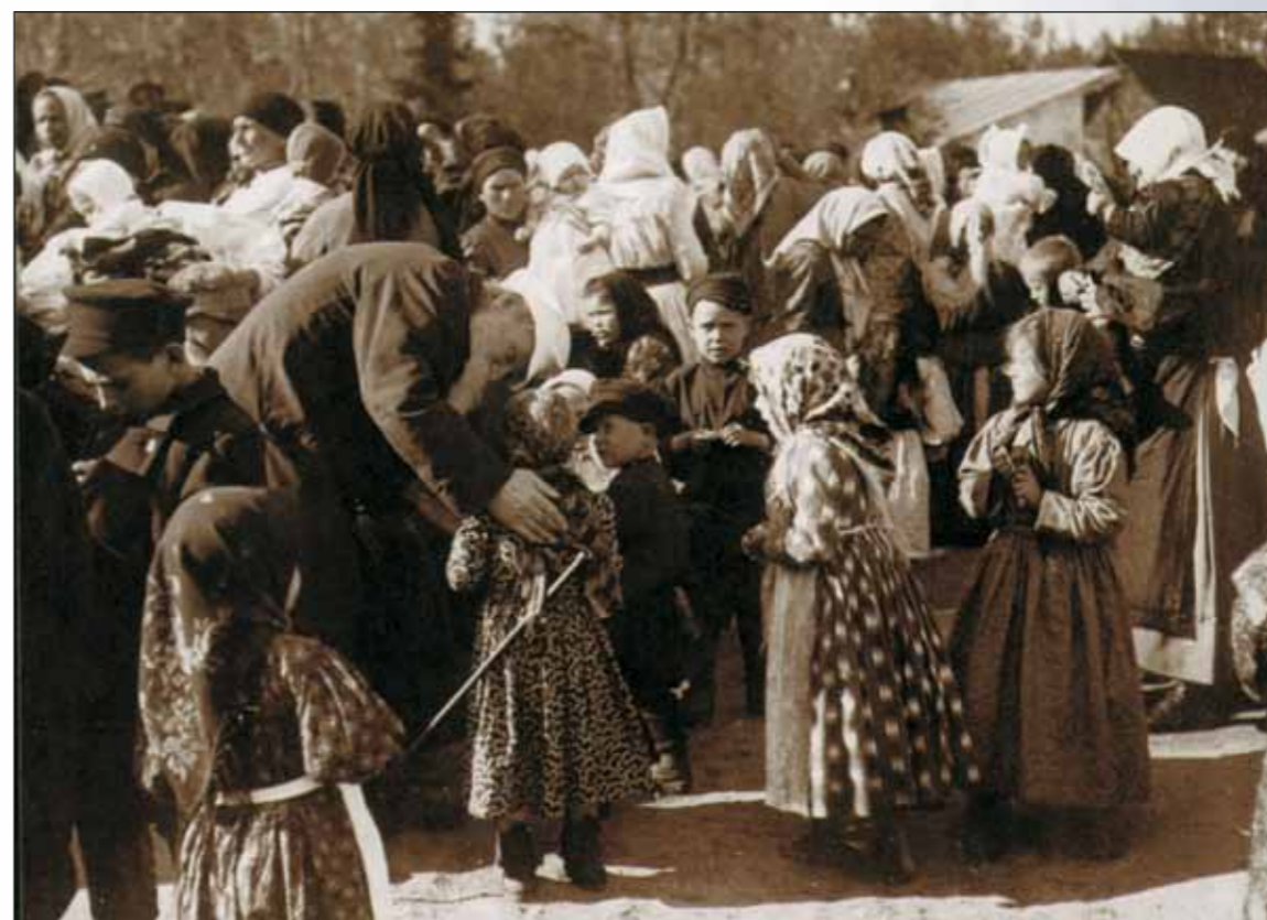
Л.Н. Толстой среди крестьян. 1909

национальные костюмы: тут были и русские крестьянки, шотландцы и итальянцы... И чего мы с мамой не придумывали!» 8 , – вспоминала Татьяна Львовна.