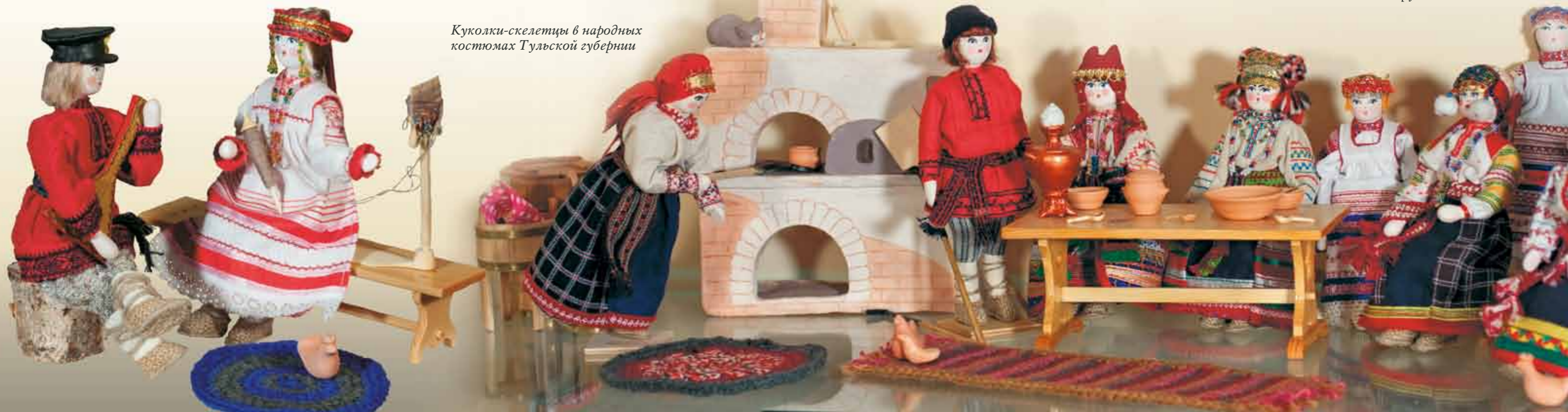
Куколки-скелетцы в народных костюмах Тульской губернии