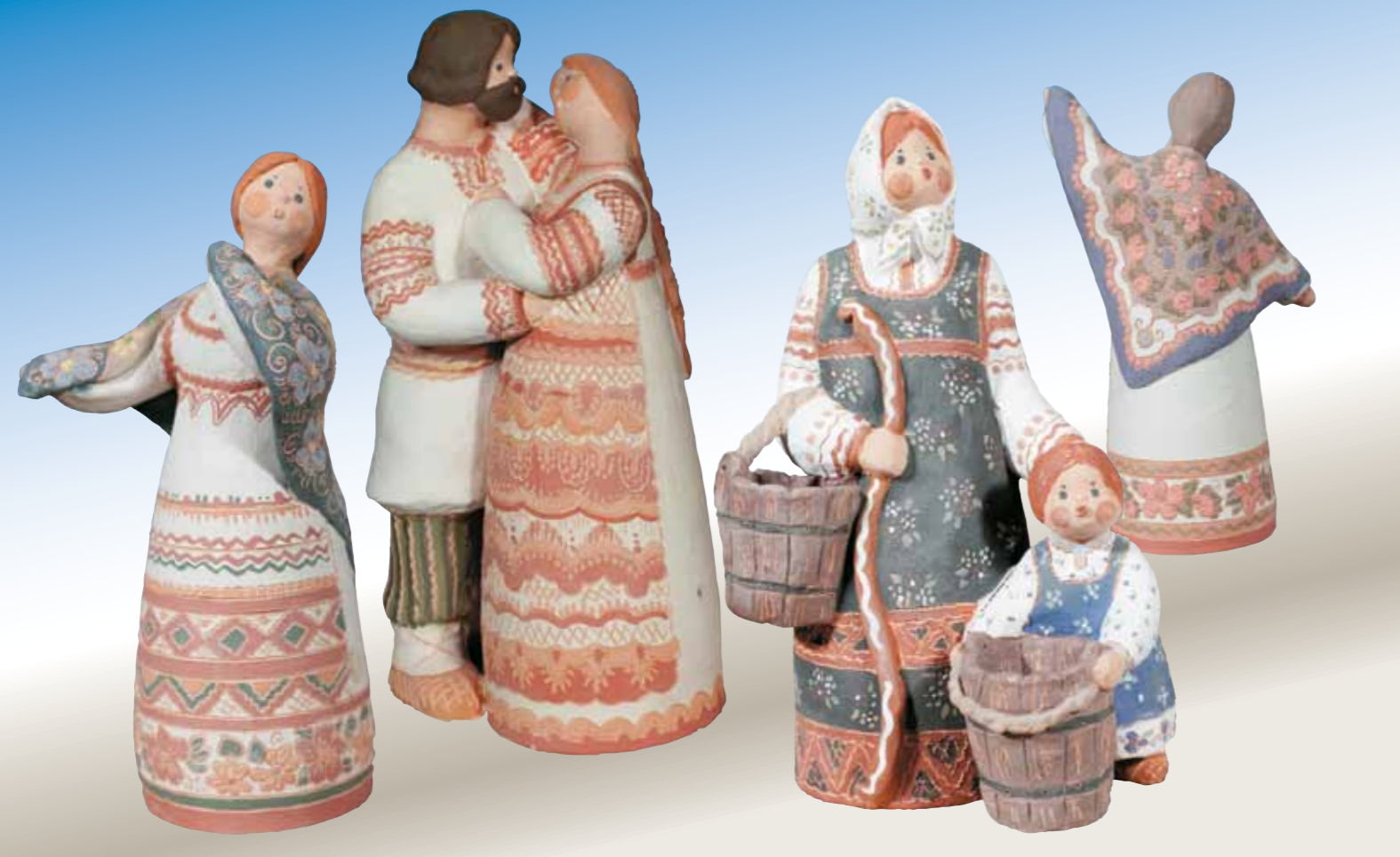
Народные образы яснополянской керамики

всем не отапливались. Некоторые мастерицы до сих пор хранят огромные валенки, которые спасали в холода. Воду грели кипятильником и добавляли в ледяную глину, чтобы можно было ее размесить. Люди приходили по зову души. В 1990-е годы в Туле закрывались оборонные предприятия, много специалистов осталось без работы. Те, кого сюда привела судьба, не всегда имели художественное образование, но в этом был свой положительный момент – человек с дипломом будет делать то, чему его научили, а в новом деле важен свежий взгляд, который помогал бы в поиске нового стиля.