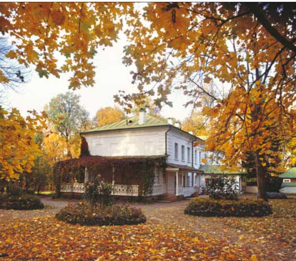
Дом Толстых в Ясной Поляне. 2010