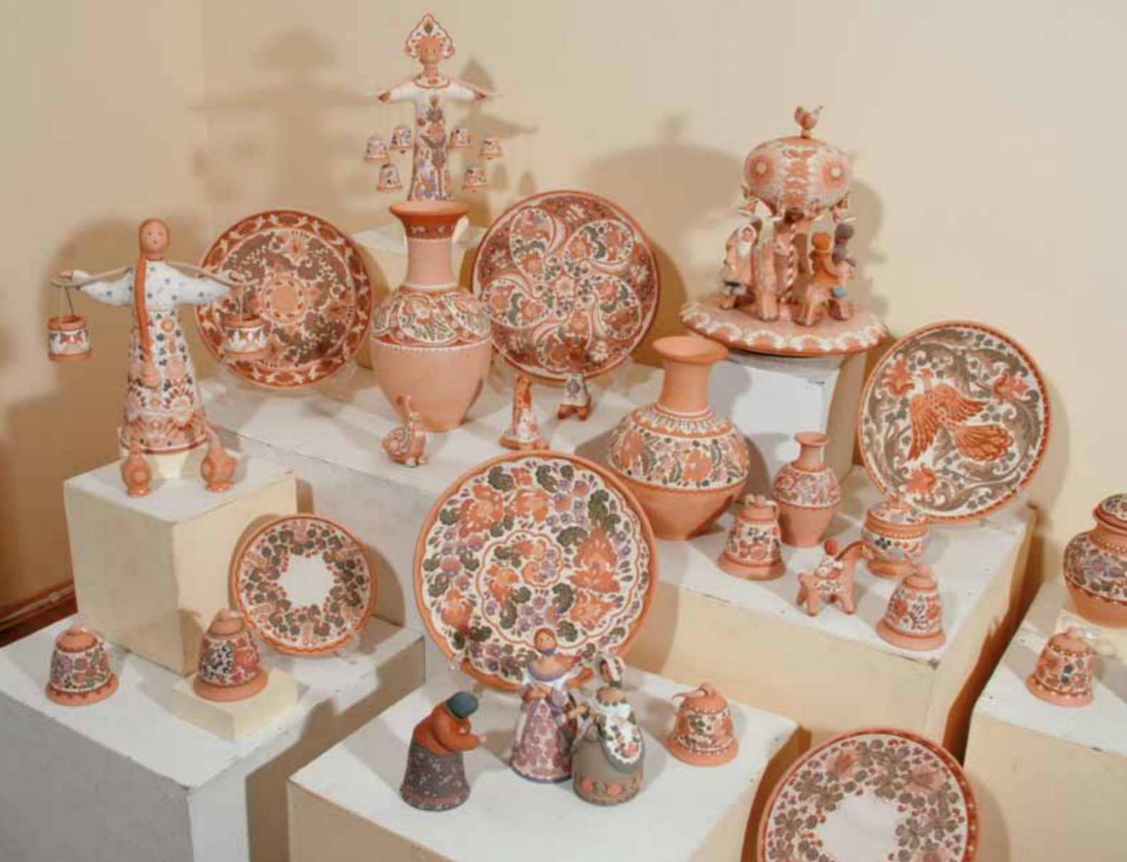
Изделия с ангобной росписью