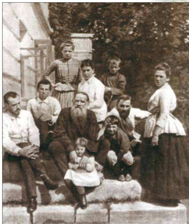
Л.Н. Толстой в кругу семьи

«...Вся жизнь человеческая наполнена произведениями искусства всякого рода, от колыбельной песни, шуток, украшений жилищ, одежд, утвари