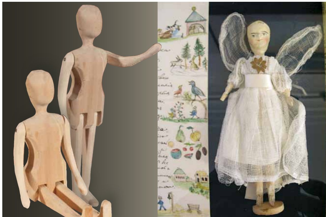
Куколочки-скелетцы без одежды