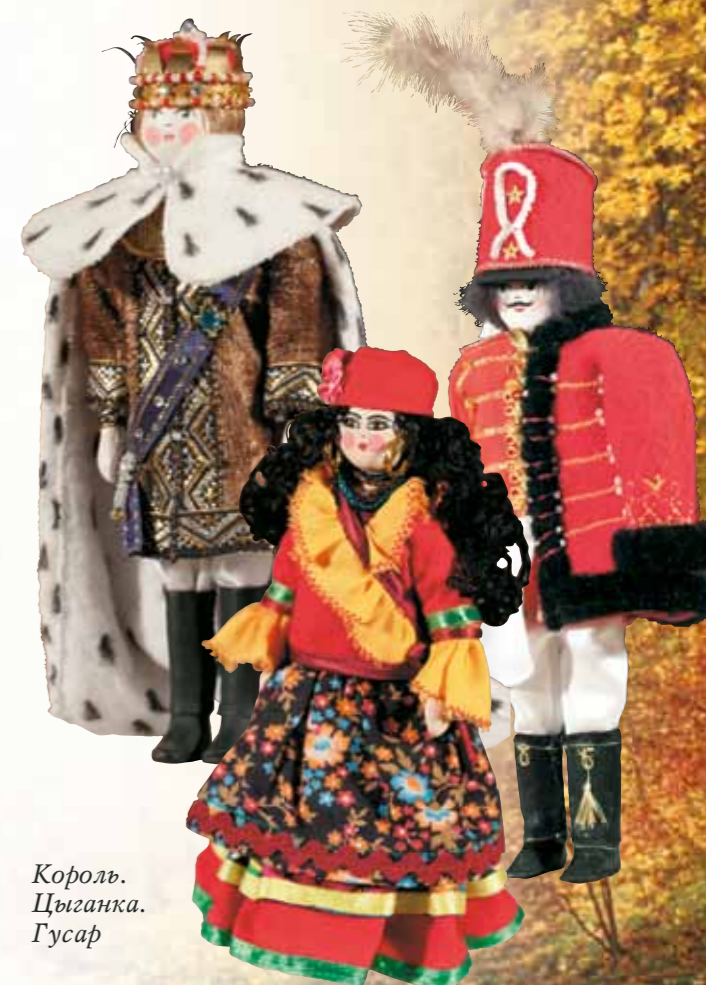
Король. Цыганка. Гусар