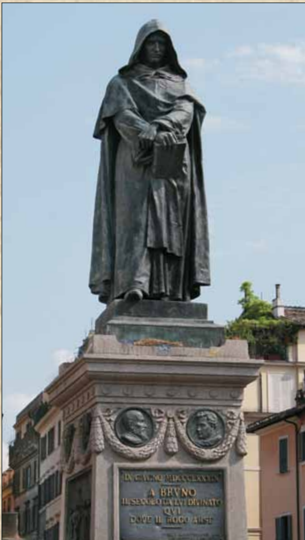
Памятник Джордано Бруно в Риме на месте его казни

Это был, без преувеличения, один из интереснейших исторических периодов, отмеченный зарождением новой науки, более глубоким,