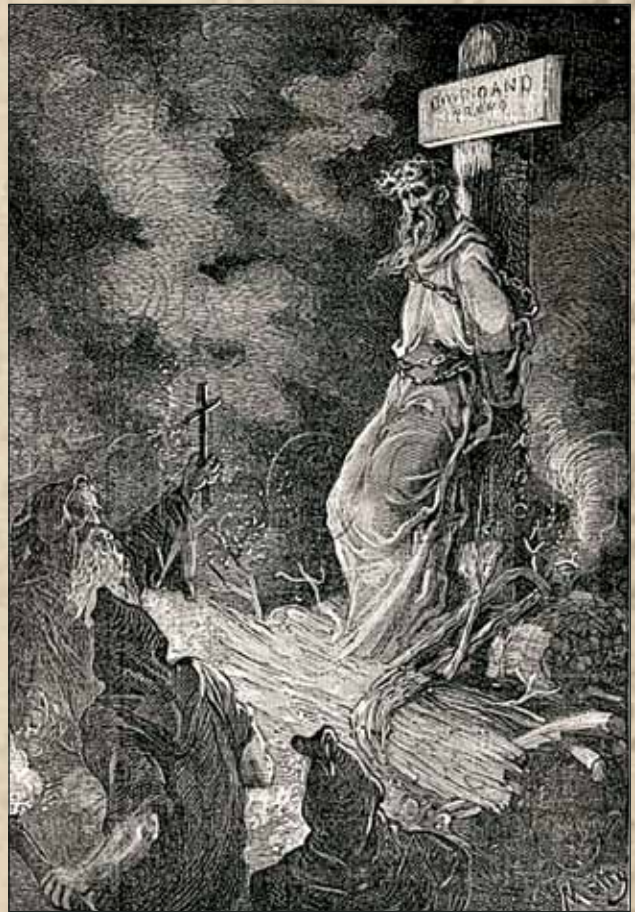
Мотти. Джордано Бруно – итальянский философ, арестованный и сожженный инквизицией. Гравюра