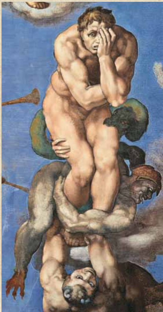
Микеланджело. Страшный суд. Фрагмент. Сикстинская капелла. 1535–1541. Ватикан

Джованни Боккаччо, Лоренцо Валла 10 , Франсуа Рабле, Томас Мюнцер, Эразм Роттердамский, Ян Гус, Никколо Макиавелли.