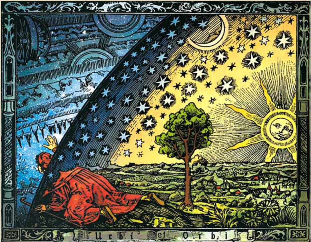
К. Фламарион. Вселенная. Гравюра на дереве. Париж, 1888. Раскраска Хайкенвельдер Хуго. Вена, 1998

сти материи и о вечном ее изменении; мысль об относительности массы тел; представление о круговороте материи, атомов (здесь стоит заметить, что научная разработка в XX веке идеи круговорота атомов на Земле принадлежит одному из виднейших русских ученых-космистов – В.И. Вернадскому 17 ).