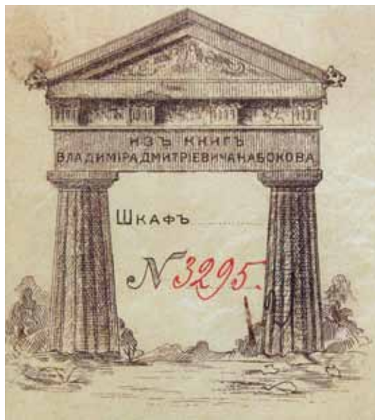
Экслибрис В.Д. Набокова

<...> В этой части обширной библиотеки приятно совмещались науки и спорт: кожа переплетов и кожа боксовых перчаток. Глубокие клубные кресла с толстыми сиденьями стояли там и сям вдоль книгами выложенных стен. В одном конце поблескивали штанги выписанного из Англии пунчинг-бола, – эти четыре