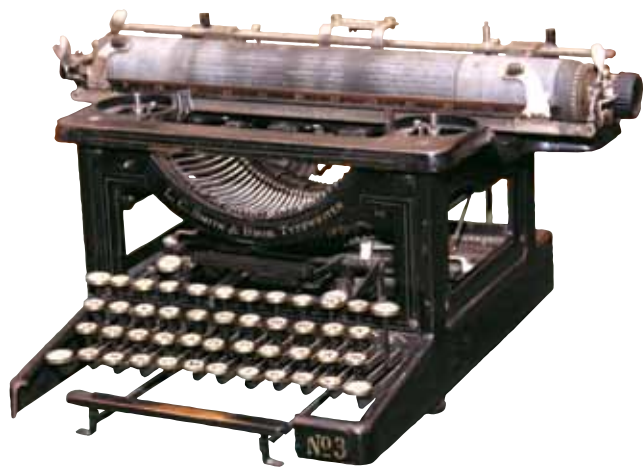
Пишущая машинка начала XX века

живописи и графики. Отделать и обставить заново один из богатейших когда-то особняков столицы – эта задача не под силу небольшому музею, который многие годы существовал только благодаря бескорыстному труду его сотрудников и помощников и такой же бескорыстной помощи дарителей. Главным для нас стало другое – сохранить неповторимую атмосферу «единственного дома», стать тем местом, куда будут приходиться все, кому интересен и дорог Набоков-писатель – читатели, исследователи его творчества, переводчики, художники и музыканты, в творчестве которых есть набоковские темы и мотивы.