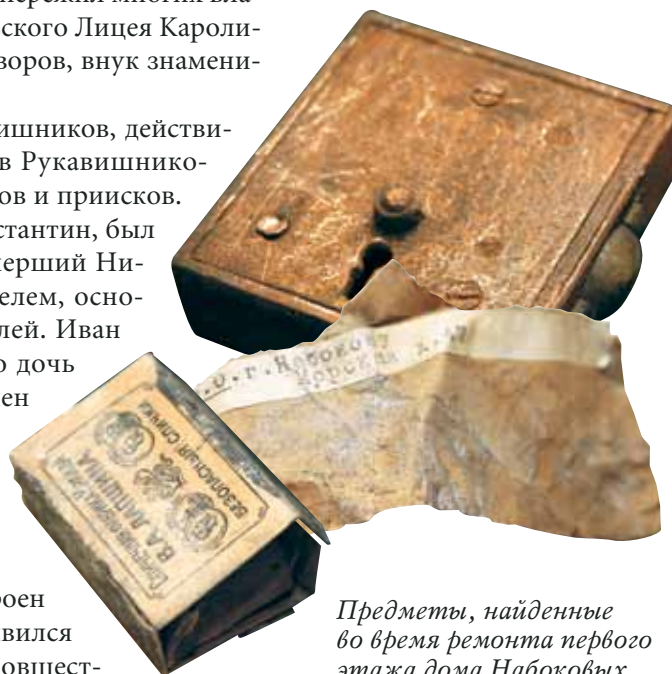
Предметы, найденные во время ремонта первого этажа дома Набоковых в 1999–2000 гг.