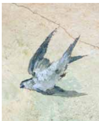
Ласточка. Фрагмент расписного потолка «Зеленой гостиной»

боковы называли «комитетской». Это название она получила после того, как В.Д. Набоков стал одним из основателей и руководителей конституционно-демократической партии (другое название – «Партия народной свободы») и соредактором ежедневной партийной газеты «Речь». Здесь действительно непрерывно заседали. Возможно, именно это детское воспоминание о долгих многолюдных заседаниях и породило тот замечательный абзац в романе «Пнин», в котором одной фразой изложена личная религия профессора Пнина, а возможно, и профессора Набокова: «Пнин <...> не верил в самодержавного Бога. Он смутно верил в некую демократию духов. Быть может, души умерших образуют комитеты, которые на своем непрерывном заседании решают участь живых».