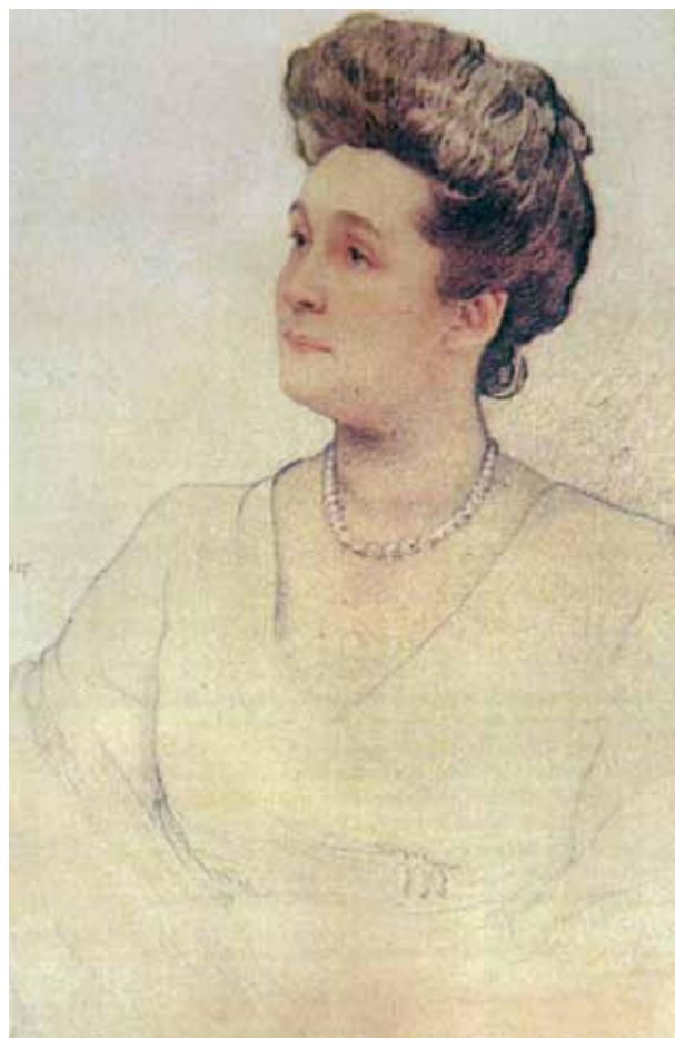
А. Бакст. Портрет Е.И. Набоковой

Уезжая из своего родного дома в ноябре 1917 года, никто из Набоковых не думал, что покидает его навсегда. Они взяли с собой вещей на несколько месяцев, рассчитывая переждать столичные беспорядки в Крыму, в имении своих друзей. Дом остался, с книгами, с картинами на стенах, с рисунками