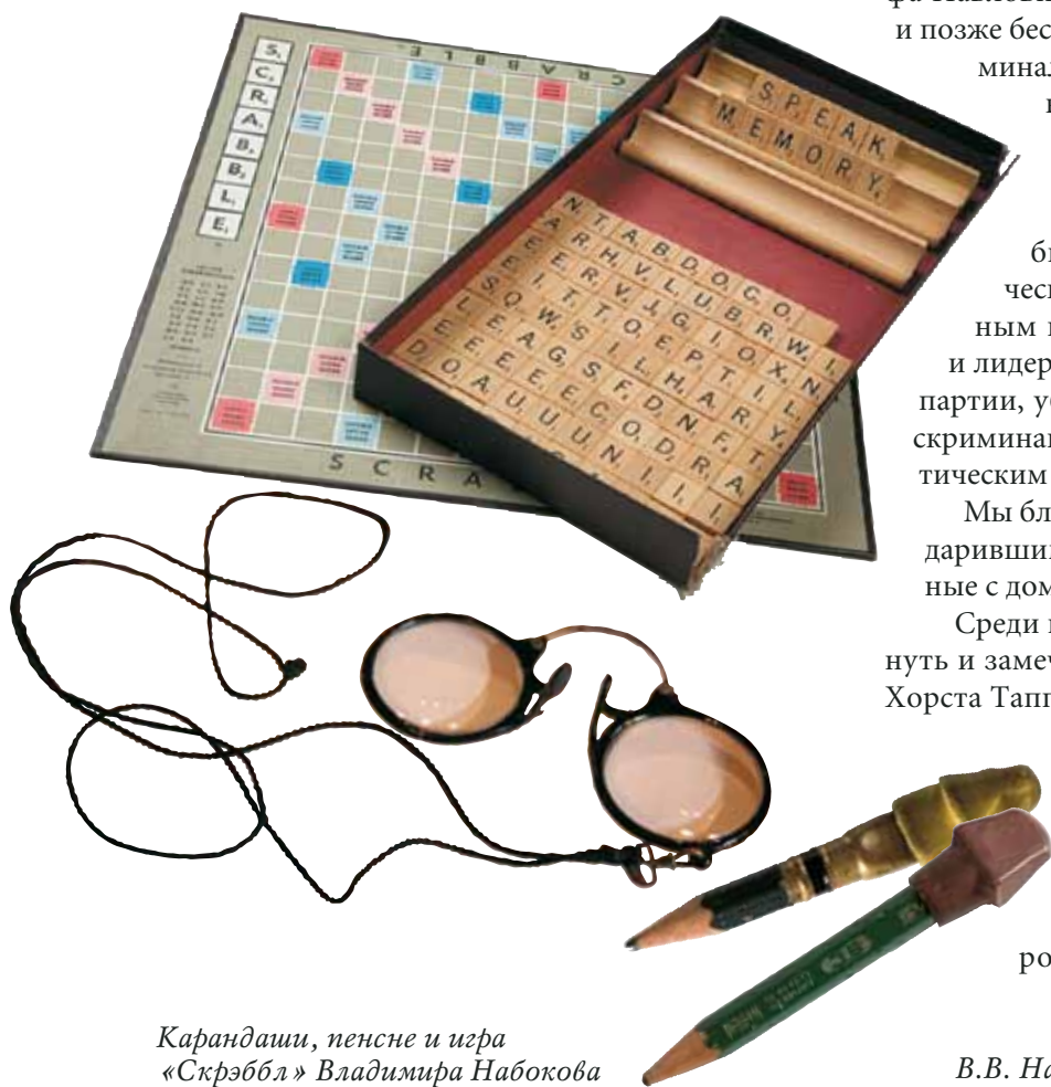
Карандаши, пенсне и игра «Скрэббл» Владимира Набокова

Мы, конечно, не ставили своей целью полное воссоздание исторической обстановки дома – интерьеров, мебели, библиотеки, коллекции