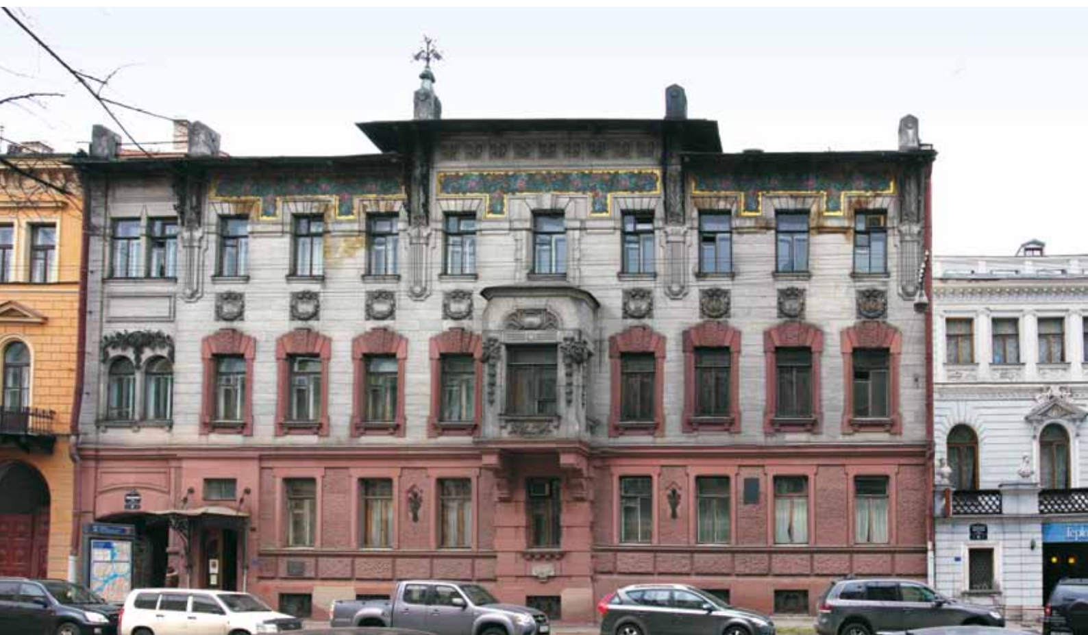
Дом и музей Набоковых. Санкт-Петербург, ул. Большая Морская, 47

жизни. Сам Набоков в ответ на этот вопрос обычно отшучивался: в доме, говорил он, должны быть старые слуги, а если я куплю дом сейчас, то мои слуги уже не успеют постареть.