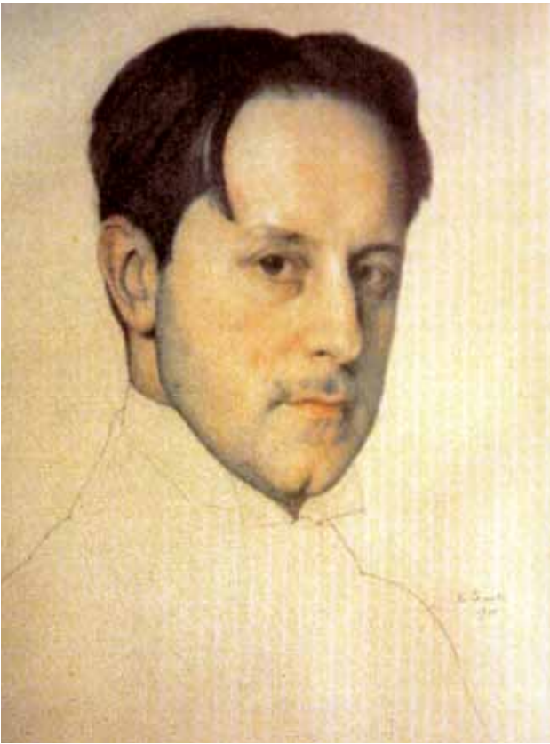
К. Сомов. Портрет художника М.В. Добужинского. 1910

ска – где она потеряла одну шпору – к прекрасному острову Св. Лаврентия, и через Аляску на Доусон, и на юг, вдоль Скалистых Гор, где наконец, после сорокалетней погони, я настиг ее и ударом рампетки «сбрил» с ярко-желтого одуванчика, вместе с одуванчиком, в ярко-зеленой роще, вместе с рощей, высоко над Боулдером.