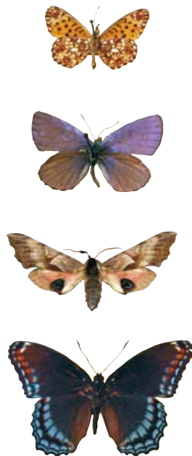
Бабочки из коллекции В.В. Набокова

За эти годы музей вырос, и теперь мы мечтаем о том времени, когда весь особняк на Большой Морской снова станет домом Набокова.