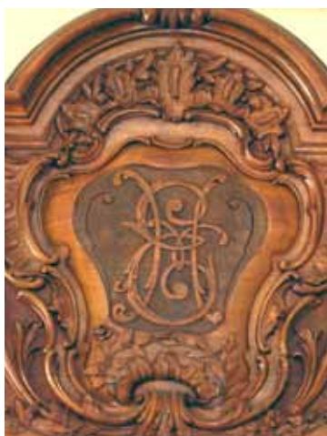
Монограмма Елены Ивановны, матери Владимира Набокова

В те годы, когда Набоковы поселились в отеле «Монтрё Палас», он казался очень похожим на петербургскую «Асторию», которую от набоковского особняка отделяют всего четыре дома. Сейчас и номер Набоковых на шестом этаже, и сам отель перестроены, и уже мало что осталось от того стиля Art Nouveau , который окружал Набокова и в петербургском детстве, и в последние годы жизни. О Набокове в отеле напоминает только название номера и скульптура недалеко от входа, где Набоков теперь окружен его современниками-музыкантами. Правда, джаз и рок-музыку Набоков, выросший неподалеку от Мариинского театра, и, по его словам, двенадцать раз слушавший там оперу Глинки «Руслан и Людмила», так и не смог полюбить.