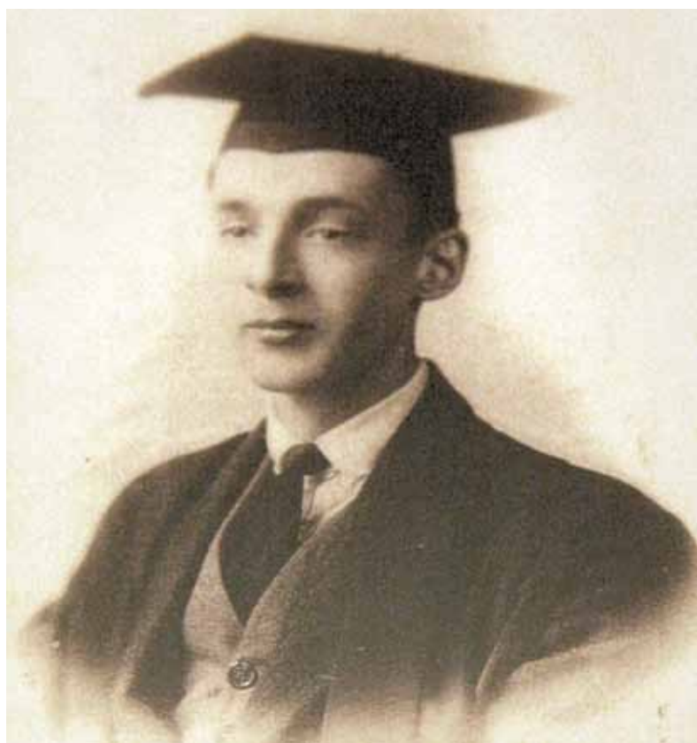
Владимир Набоков – студент Тринити-колледжа. Кембридж, ноябрь 1919 г.

Помню, как я медленно выплыл из обморока шахматной мысли <...> За такой же доской, как раз уместившейся на низком столике, сидели Лев Толстой и А. Б. Гольденвейзер 6 ноября 1904 года по старому стилю (рисунок Морозова, ныне в Толстовском Музее в Москве), и рядом с ними, на круглом столе под лампой, виден не только открытый ящик для фигур, но и бумажный ярлычок (с подписью Staunton), приклеенный к внутренней стороне крышки. Увы, если присмотреться к моим двадцатилетним (в 1940 году) фигурам, можно было заметить, что отлетел кончик уха у одного из коней, и основания у двух-трех пешек чуть подломаны, как край гриба, ибо много и далеко я их возил, сменив больше пятидесяти квартир за мои европейские годы; но на верхушке королевской ладьи и на челе королевского коня все еще сохранился рисунок красной коронки, вроде круглого знака на лбу у счастливого индуса. <...>