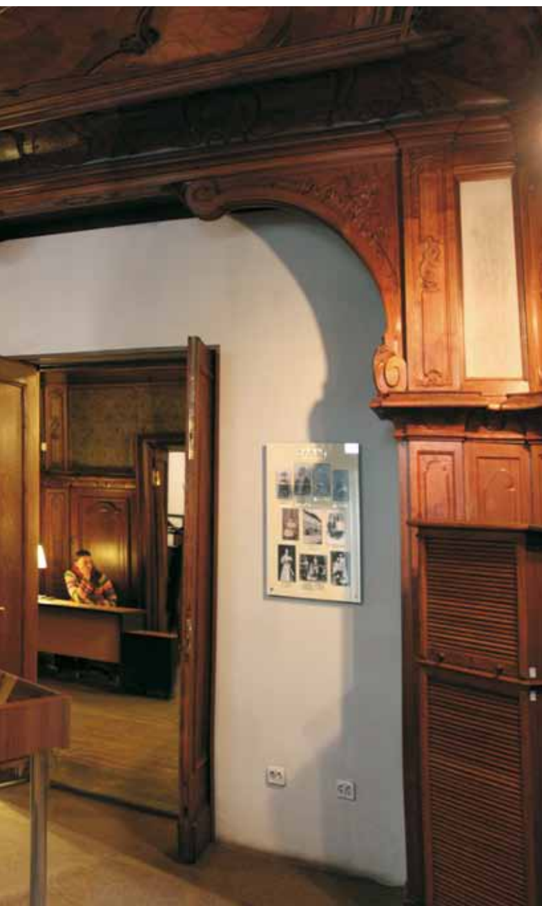
◀ Большой зал музея (бывшая столовая дома Набоковых)

Сначала Набоковы, по традиции русских политэмигрантов предыдущего века, направились в Лондон, где жил один из братьев Владимира Дмитриевича, дипломат Константин Дмитриевич