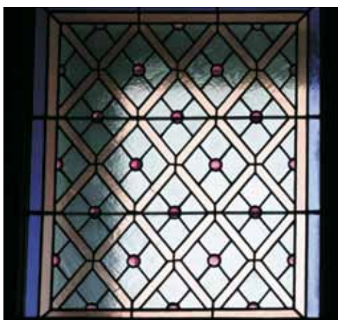
Фрагмент витражного окна над входной дверью

освещения и лифт. Была и комната-изолятор с отдельной канализацией на случай, если кого-то из семьи настигнет инфекционная болезнь. В доме был телефон и специальная для него комната, которую так и назвали – телефонная.