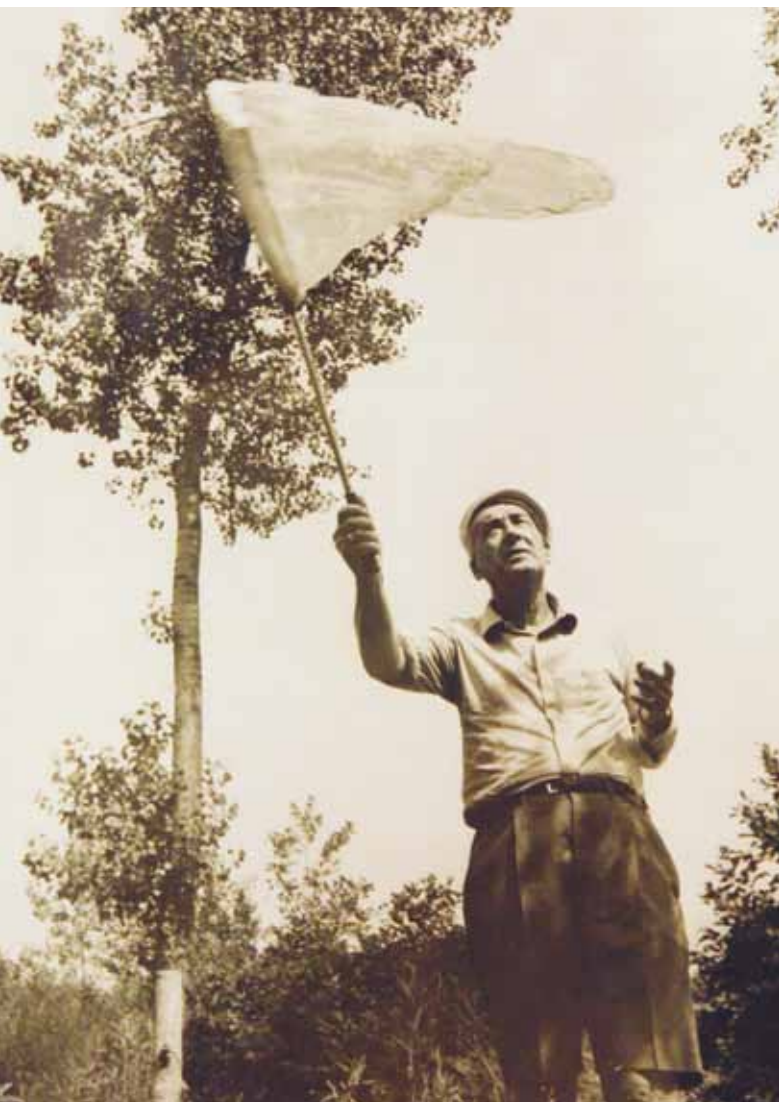
В.В. Набоков.