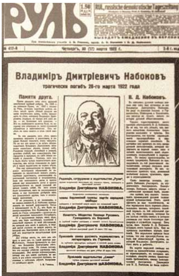
Газета «Руль» (Берлин). 30 марта 1922 г. Некролог В.Д. Набокова. В газете «Руль» были опубликованы первые произведения В.В. Набокова