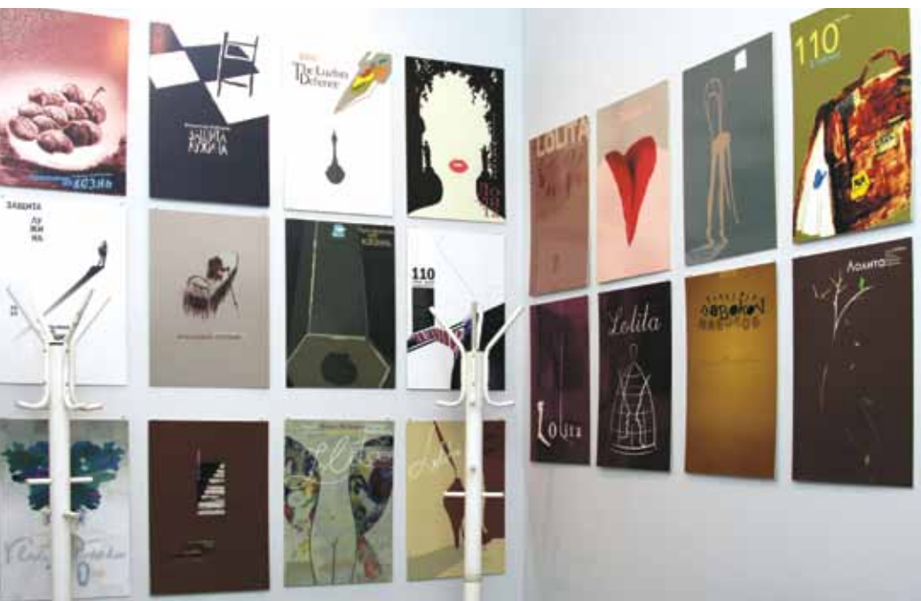
Плакаты на темы произведений Набокова (выставка работ студентов-дизайнеров СПбГУ)

Однако создание музея в доме стало возможно только после «открытия» Набокова в России. Уже в начале девяностых годов в одной из комнат первого этажа была открыта небольшая экспозиция; постепенно музей рос и теперь занимает весь первый этаж. Официально музей открылся в 1999 году, к столетию со дня рождения Набокова. Первые девять лет он существовал как общественный музей, а с 2008 года музей вошел в состав Санкт-Петербургского государственного университета.