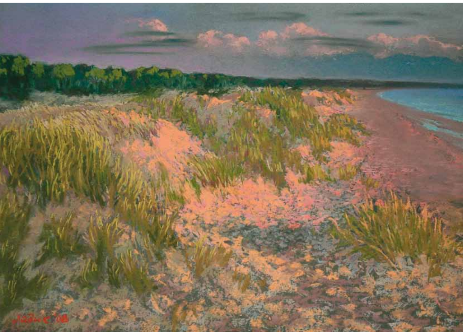
Розовые дюны. 2008