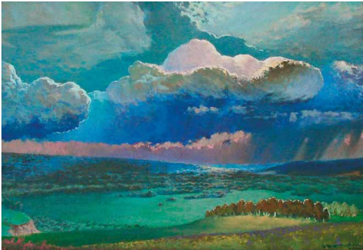
Дивногорские дали. 2004