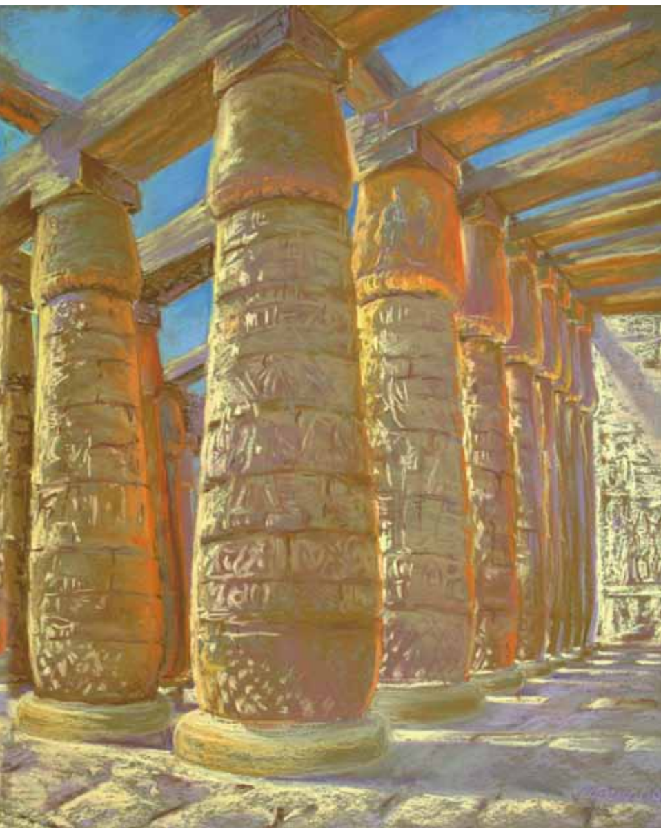
Небо дня. Храм Рамзеса. 2009

Зачастую пейзаж – самый красивый, трогательный, достоверный, вызывающий самые лучшие чувства и эмоции, все равно