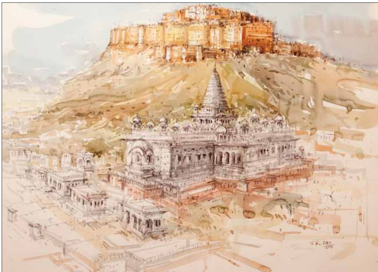
Крепость Мехрамгарх. Бумага, акварель

и считается одним из его прототипов. Усыпальница Хумаюна, императора из династии Великих Моголов, – первый на Индийском субконтиненте сад-мавзолей могольского типа. В середине XVI века вдова императора Хамида Бану Бигум заказала его гробницу известному в ту пору персидскому архитектору Мирак Мирза Гиязу, на счету которого уже было множество построек в Бухаре. На архитектуру мавзолея сильно повлияли самаркандские постройки династии Тамерлана. Богатое убранство гробницы, утопающей в персидских коврах, и величие сада, раскинувшегося вокруг на тринадцати гектарах, поражало воображение современников, описывавших усыпальницу Хумаюна.