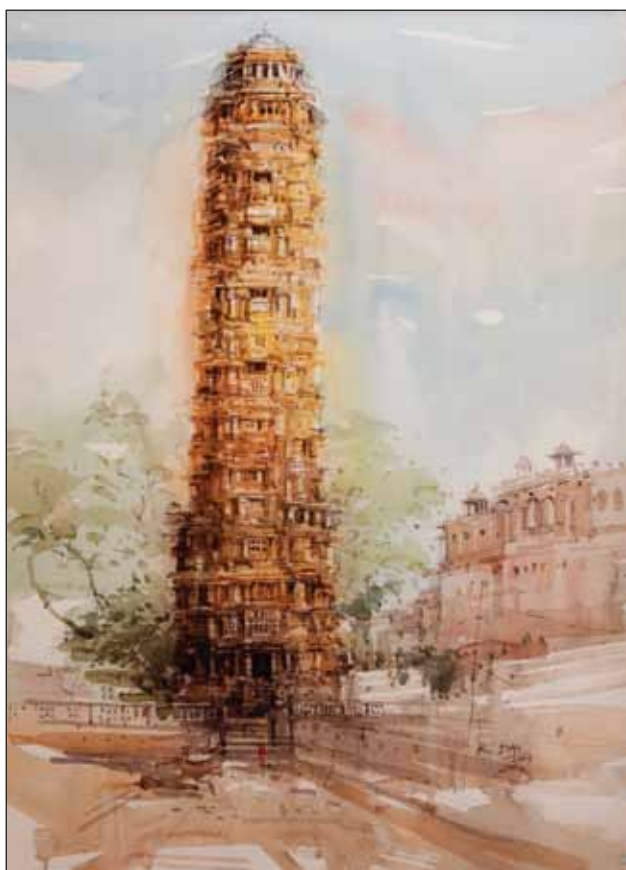
Виджай Стамбх. Бумага, акварель