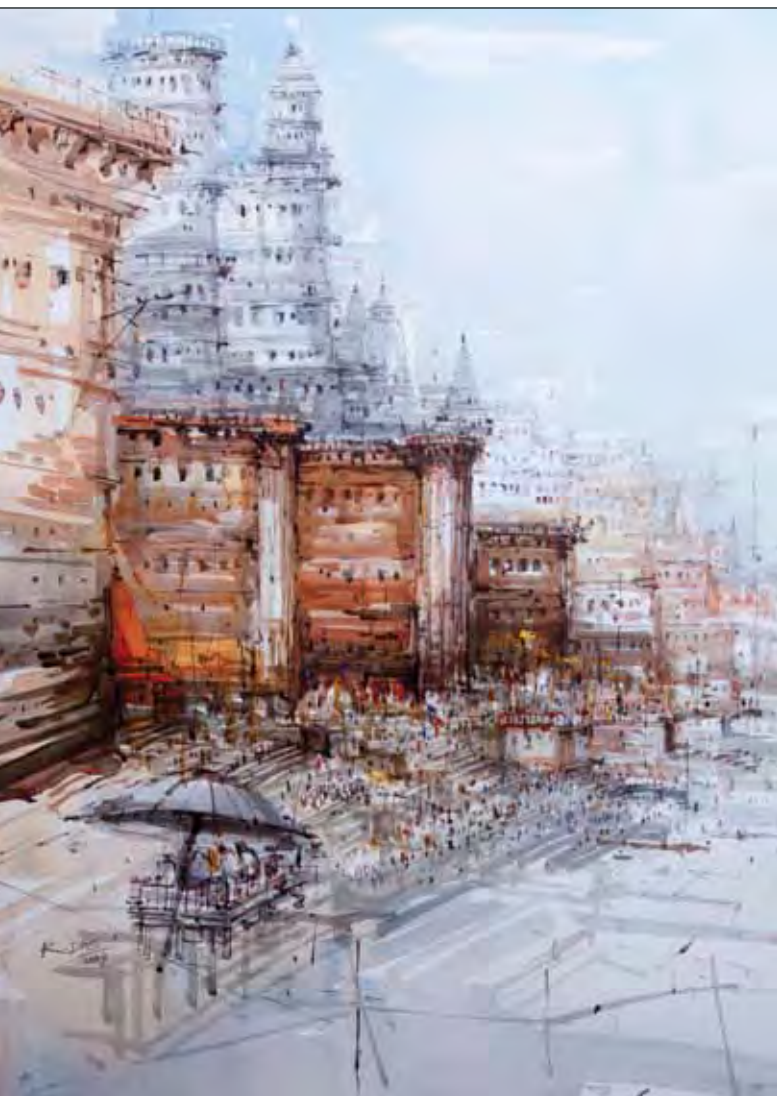
Вид на гхаты. Бумага, акварель

Варанаси называют городом тысяч храмов и святилищ, но самое священное место здесь – это гхаты , где уже несколько тысячелетий производятся ритуальные омовения и кремация умерших людей. «Вид на гхаты» – одна из акварелей Кашинатха Даса. Расположенный вдоль западного берега реки, этот комплекс ступенчатых сооружений является главным храмом Шивы во всей Индии. Каждый вечер на Дасашвамедах-гхате можно наблюдать Ганга Маха Аарти – церемонию поклонения реке Ганге. Всего гхатов около восьмидесяти, но только на двух из них проходят ритуалы кремации – каждый год около сорока тысяч сожжений, которыми занимается особая каста неприкасаемых. Тело умершего омывают водами священной реки, заворачивают в белую ткань, кладут на бревна и обкладывают соломой и сандаловыми благовониями. Огонь зажигает самый старший мужчина из числа ближайших родственников, и вся семья наблюдает за кремацией, продолжающейся несколько часов.