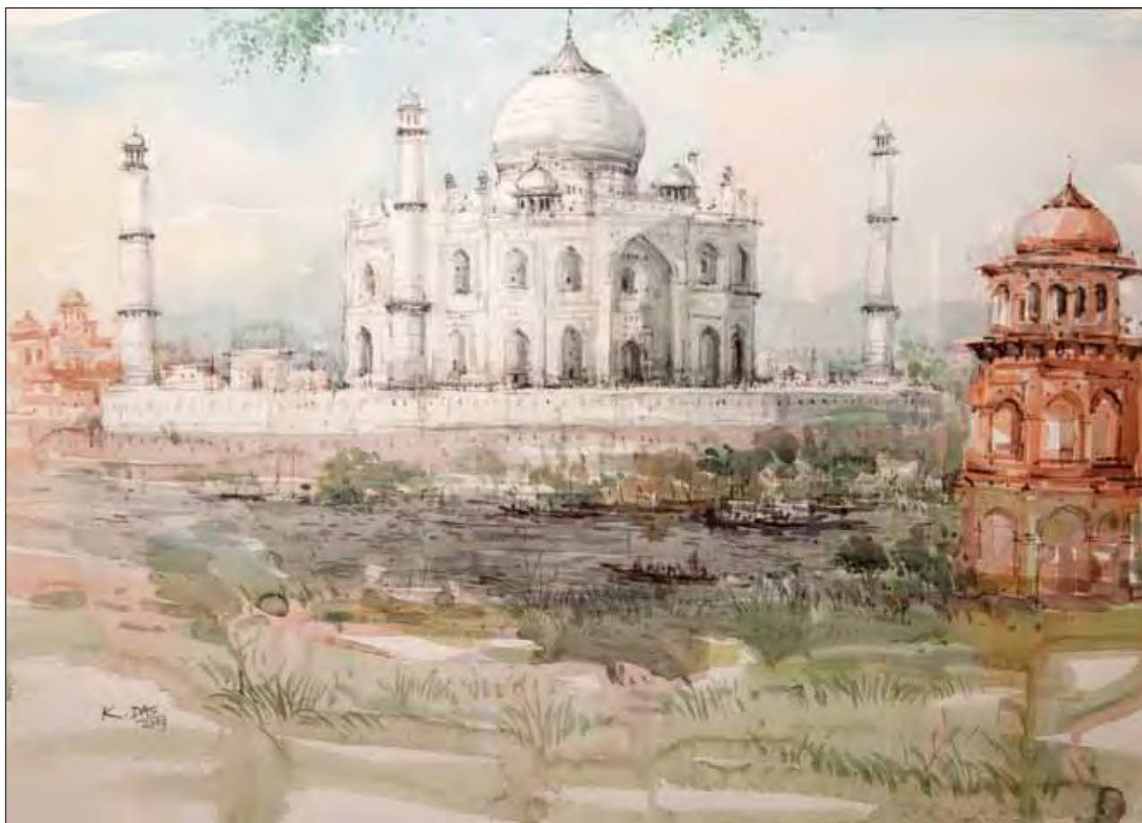
Тадж-Махал. Бумага, акварель

явился на публике – подданные увидели поседевшего, состарившегося правителя. Два года длился официально объявленный траур по Мумтаз, двадцать два года потребовалось для того, чтобы завершить строительство усыпальницы. Тадж-Махал выполнен в традициях двух культур: сам мавзолей облицован прекрасным белым мрамором, украшенным разноцветной мозаикой и инкрустацией из самоцветов, а массивные ворота, две мечети по бокам мавзолея и окружающая весь комплекс высокая стена сделаны из красного песчаника. Правление Шах-Джахана ознаменовало расцвет династии Моголов – это был период благополучия и стабильности. Его империя не знала значительных войн, и правитель мог позволить себе тратить баснословные суммы. В грандиозном строительстве этой «поэмы в камне» было задействовано более двадцати тысяч человек – сюда были приглашены лучшие зодчие и ювелиры Индии, Персии, Самарканда. Шах-Джахан даже выписал мастеров из Венеции, чтобы те обучили его рабочих технике инкрустации мрамора драгоценными и полудрагоценными камнями. Белоснежный мрамор добывали в каменоломнях Раджастана, за триста километров от Агры. Кораллы, лазуриты, агат, сердолик привозились со