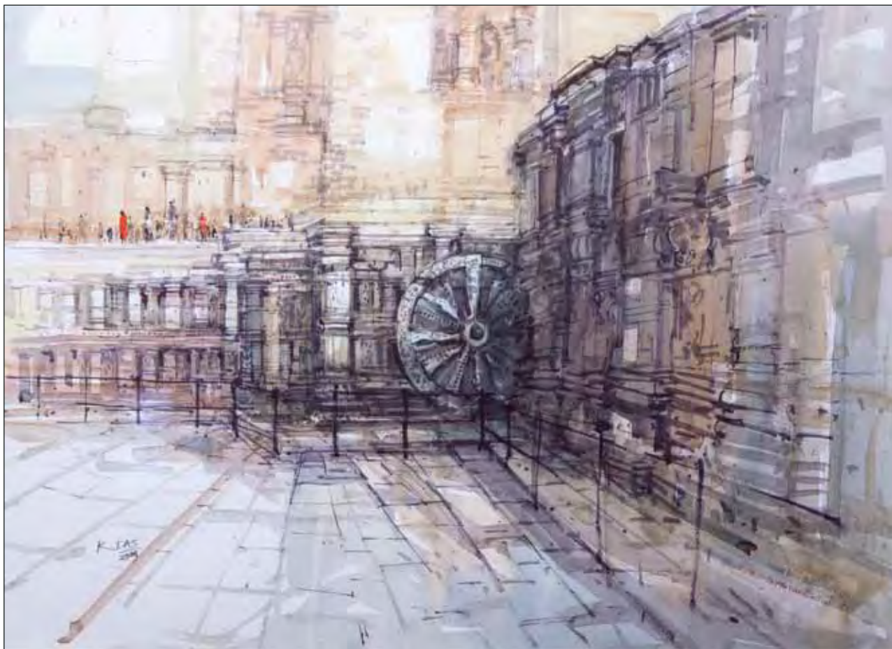
Конарк 2. Бумага, акварель

ным этапом в истории индийской архитектуры. Начиная с династии Гулямов вокруг столицы Делийского султаната возникло множество монументальных построек, положивших начало расцвету индо-исламской архитектуры, сочетающей в себе персидский, турецкий и индийский архитектурные стили. В 1192 основатель династии Кутб уд-Дин Айбек, первый мусульманский правитель Делийского султаната, начал строительство гигантского минарета, который должен был превзойти своим великолепием и внушительными размерами Джамский минарет в Афганистане и стать символом мощи мусульманского правления. При жизни султана был завершен только фундамент, и строительство затянулось на последующие полтора века. Минарет Кутб-Минар является одной из самых выдающихся построек раннего периода индо-мусульманской архитектуры. Стены построек покрыты искусно вырезанной из камня арабской вязью, но некоторые детали явно контрастируют с традиционной архитектурой моголов: колонны, поддерживающие своды пролетов, имеют разную форму и диаметр, на некоторых из них есть фигуры людей и животных. Ислам запрещает какие бы то ни было изображения, но мечеть строилась в спеш-