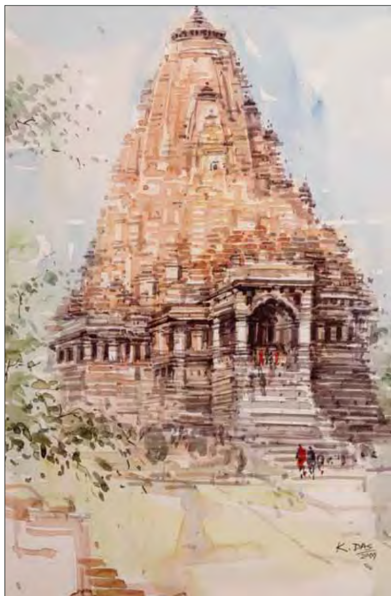
Кхаджурахо. Бумага, акварель

Подобно храмам Кхаджурахо, стены храма Солнца в Конарке покрывают тысячи фигур божеств, а также сцены из жизни людей, в том числе эротические. Построенный королем Нарасимхадевой Первым в XIII веке в честь бога-солнца Сурьи, он является одним из самых грандиозных храмов страны. Семьсот лет назад храм находился на самом берегу океана, но сегодня оказался в трех километрах от него. Спроектированный как огромная колесница бога Сурьи, храм является вершиной архитектурного мастерства средневековой Северо-Восточной Индии: пирамидальная крыша из песчаника взлетает более чем на тридцать метров ввысь. Двенадцать резных колес диаметром чуть меньше трех метров, высеченных у основания храма, – одна из главных