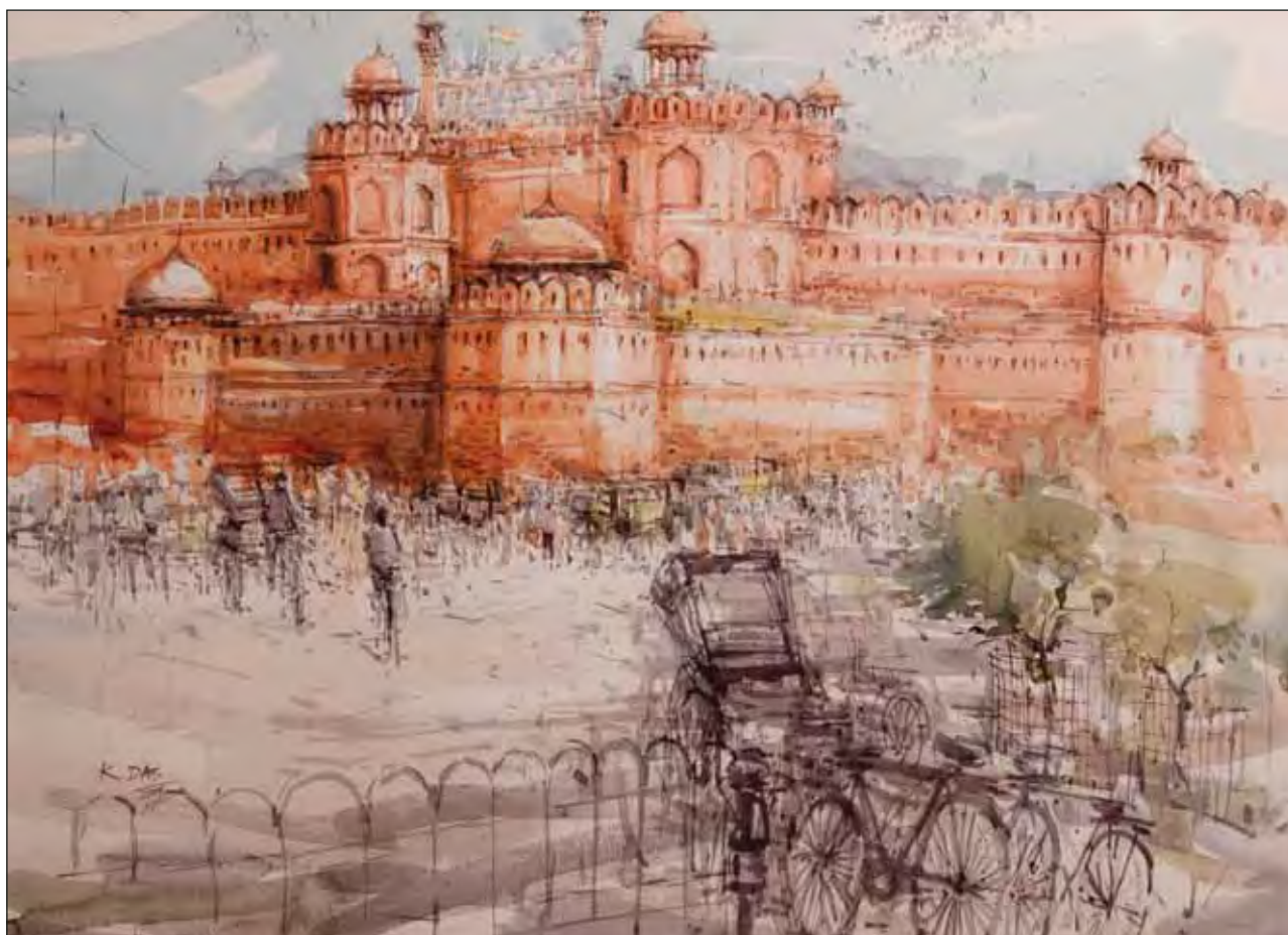
Красный форт. Дели. Бумага, акварель

Архитектурное наследие Индии, соединившее в себе черты многих культур и традиций, является свидетельством больших амбиций ее правителей и ярким примером того, что монументальное искусство всегда было средством достижения не только политических, но и религиозных целей. Прекрасно сохранившиеся в тропическом климате, овеянные легендами образцы каменного зодчества часто содержат больше загадок, чем ответов. Располагая богатейшей традицией искусной резьбы по камню, индийские мастера создали захватывающие дух цитадели и дивные замки, которые вызывают неподдельный восторг и в наши дни, что можно было ощутить и на выставке акварелей Кашинатха Даса. Небрежный, но в то же время сдержанный стиль художника прекрасно передал величие и великолепие Индийской архитектуры – легкость прозрачных цветов и условность изображений дает волю фантазии, не обременяя зрителя лишними деталями. Преувеличенно огромные здания и нарочито условные фигуры людей позволяют почувствовать колоссальные размеры построек и не оставляют сомнений в том, что Индия – страна архитектурных чудес.