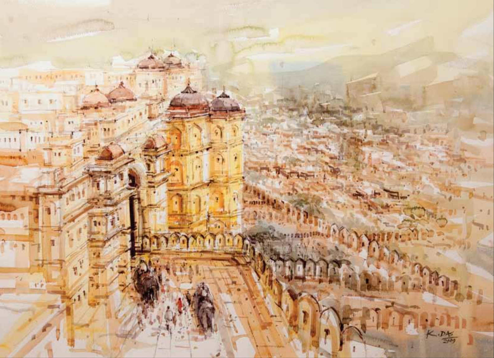
Крепость Амер. Джайпур. Бумага, акварель

часть комплекса и окружающая его стена, длиной почти два с половиной километра и высотой более двадцати метров. Крепость кажется целиком состоящей из каменного монолита и выглядит настолько величественно, что во времена правления моголов никто даже не пытался атаковать ее. Акбар хотел, чтобы крепость была неприступной, и в западной ее части по его приказу были установлены хитроумно спроектированные Делийские ворота . Украшенные искусственной мозаикой из белого мрамора, они имели статус «официальных ворот» султана. Для того чтобы пересечь глубокий ров, наполненный водой, и попасть к внутренним «слоновым» воротам, использовался деревянный мост. Архитектурная хитрость состояла в том, что подъемный мост располагался между внешними и внутренними воротами под прямым углом. В случае осады форта это делало невозможным использование любых таранов и даже боевых слонов: если бы неприятель прорвался внутрь, он оказался бы в ловушке – окруженном со всех сторон каменном «колодце» с частыми бойницами. В начале XVII века Шах-Джахан получил этот форт