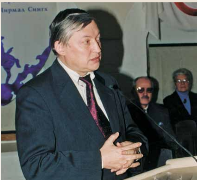
Анатолий Евгеньевич Карпов, многократный чемпион мира по шахматам, посол Детского фонда ООН (ЮНИСЕФ), президент Международной ассоциации Фондов Мира

что в свое время Николай Рерих говорил о новой эре, которая будет покоиться на краеугольных основаниях Знания и Красоты».