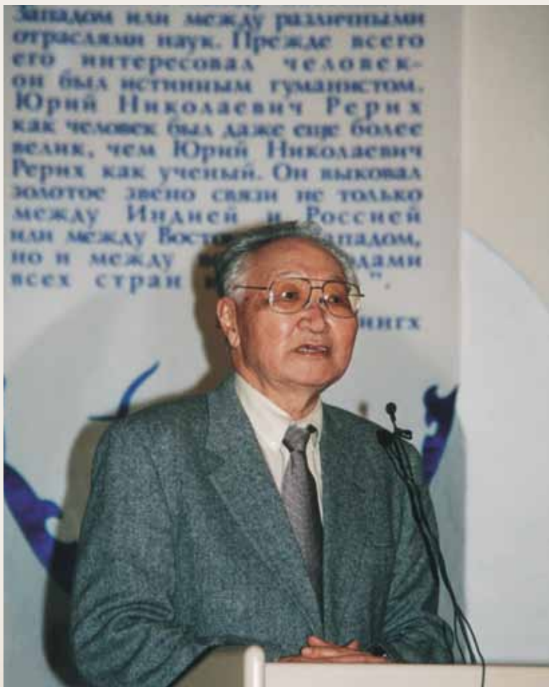
Монгольский ученый, академик Шагдарен Бира