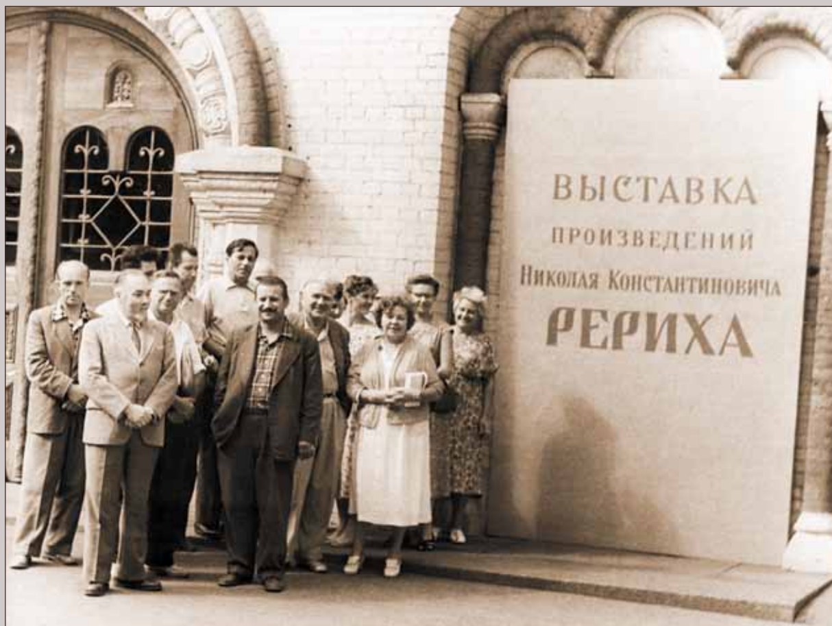
Ю.Н. Рерих на выставке произведений Н.К. Рериха. Москва, 1959

Н а открывшейся в Москве выставке произведений Н.К. Рериха представлены все этапы его творческой жизни, от раннего до постоянно живущего в нем углубленного интереса к древнерусскому искусству. Последняя статья на эту тему, озаглавленная «Русская слава», помечена 1939 годом. Николай Константинович рано подошел к Востоку. Его особенно привлекали проблемы культурной связи, существовавшей между Древней Русью и странами Востока, как ближнего, так и дальнего. Его привлекал кочевой мир наших южных степей, не только обогативший нашу историю воинской славы, но и явившийся проводником культурных влияний, шедших из далекой Индии и Китая. В 1904 году он пишет поэму «Чингисхан»,