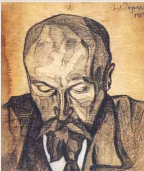
Ю.Н. Рерих. Портрет отца. 1916