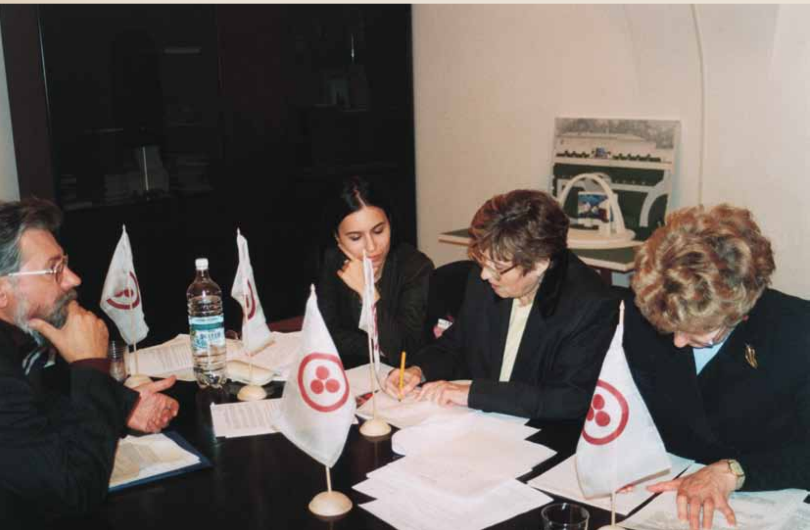
Рабочее заседание Международного Совета фериховских организаций

ние известного кыргызского героического эпоса «Манас», где в художественной форме отражена многовековая борьба кыргызского народа за свою независимость и свободу. Будучи своеобразной устной летописью народа, «Манас» играл огромную роль в культурной жизни кыргызов. Это поэтическая энциклопедия сведений о языческих верованиях, о трех мировых религиях, об истории, философии, этнографии, фольклоре, медицине, музыкальной культуре и т. д. Большая часть доклада посвящена сравнительному анализу эпосов о «Гесэре» и «Манасе», параллелям между смыслообразующими составляющими этих эпических памятников жизни народа.