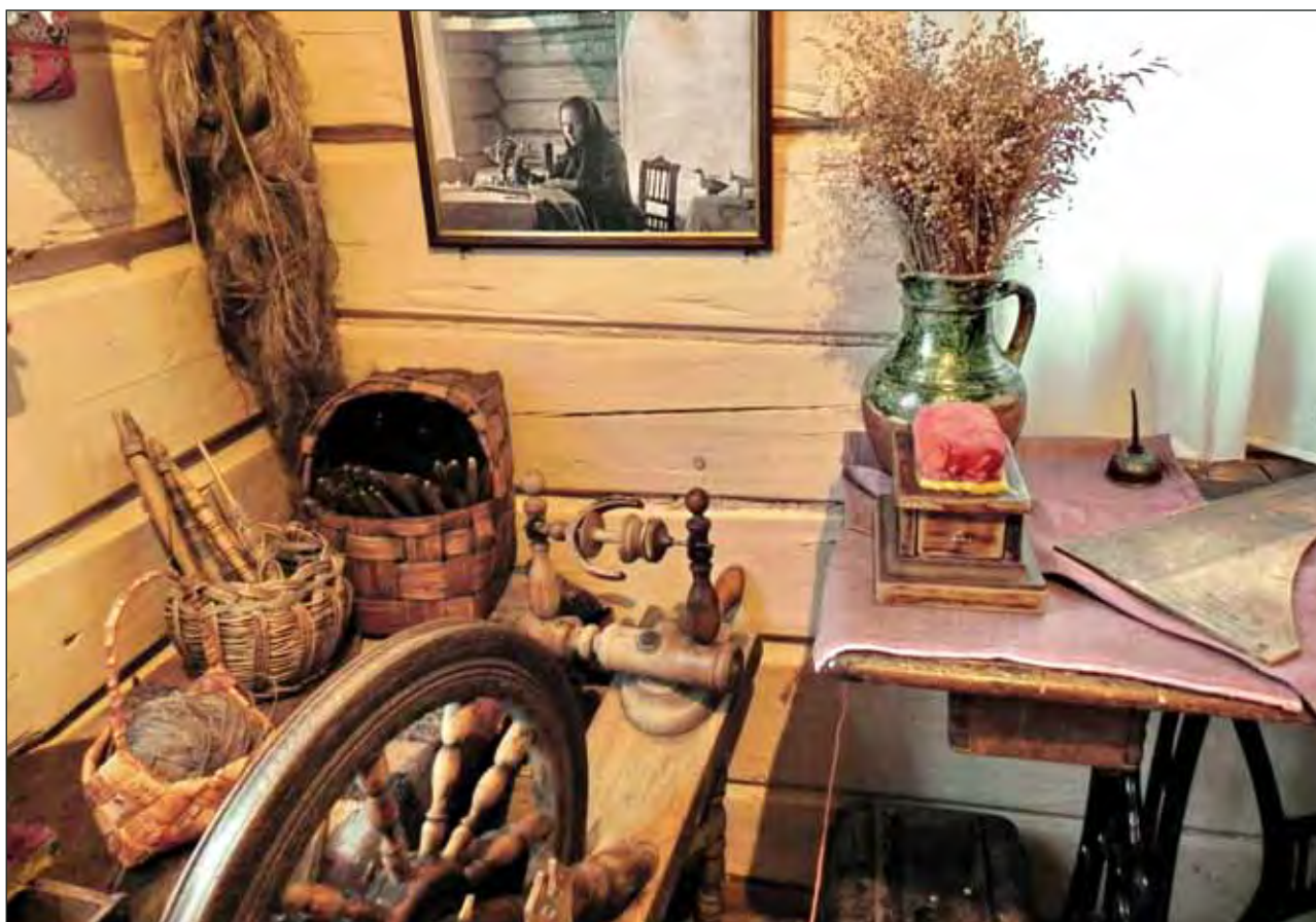
Фрагмент экспозиции Этнографического музея кацкарей. Мартыново. 2011

«Зимой ли в стужу, в лето ли – неслетьё (ненастное), в вёсеннюю ли бездорожь или при осенних хизах (ветрах) – всёгда при струшненьях Сонцо-Белая Корова. С бёла до тёмки маскалит Белая Коровушка по нёбёсной глобке (тропке), зыкая на земь солнешную светлядь. Так было всёгда и так будёт