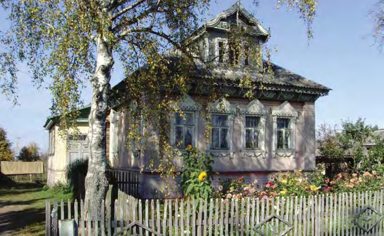
Мартыново. Дом Пресновых. 2008