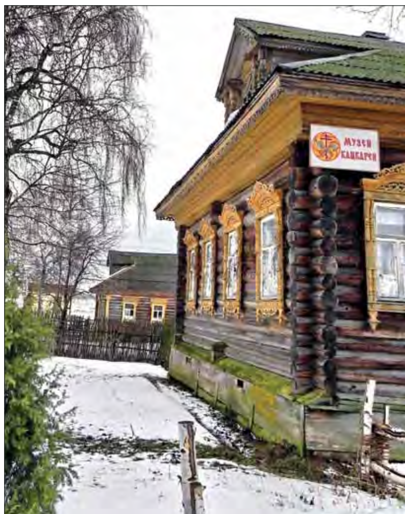
Мартыново. Этнографический музей кацкарей. 2011