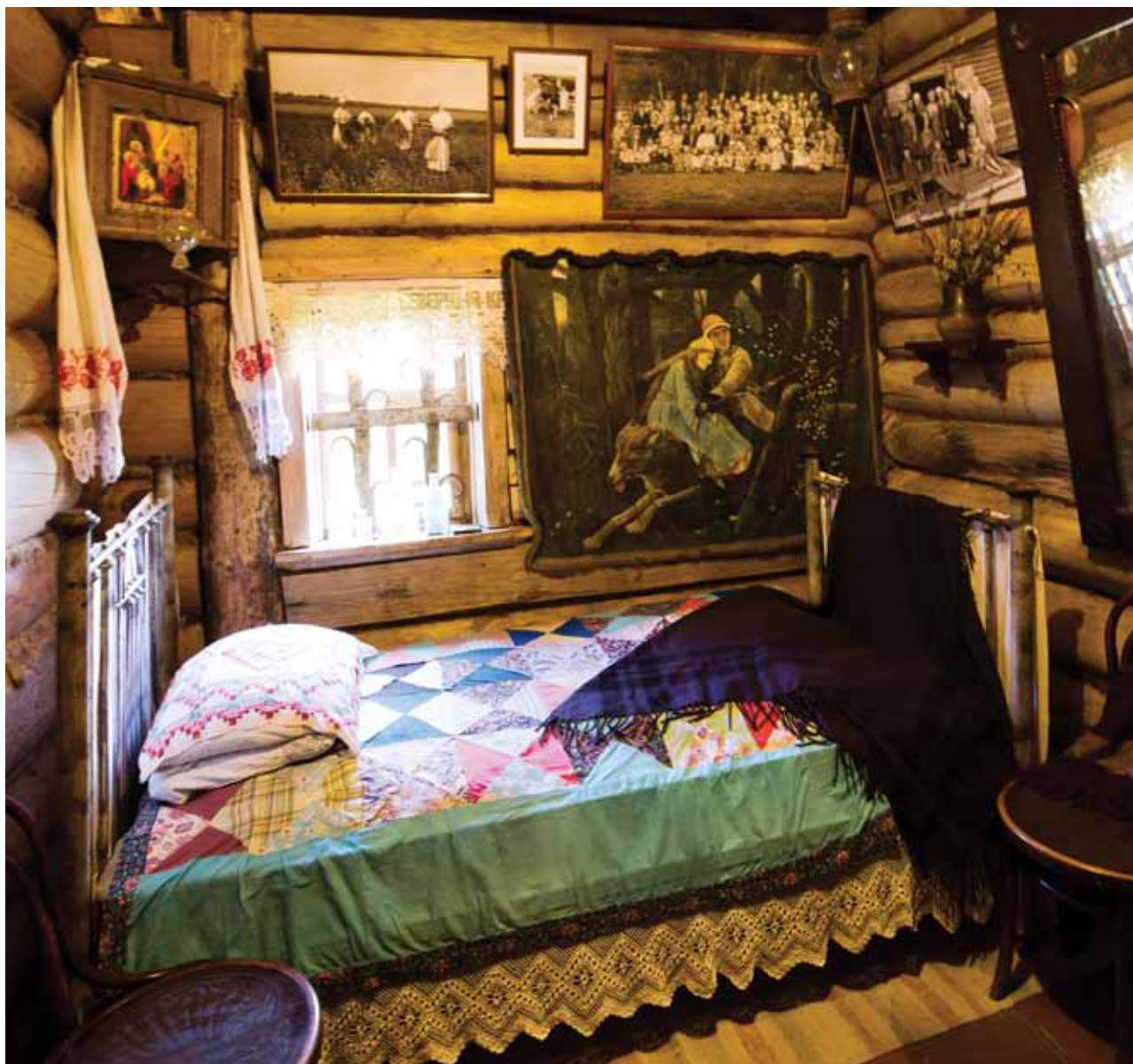
Музейная экспозиция «В горенке».

многочисленные субэтносы умирают на наших глазах. Причина, возможно, не спад пассионарных толчков, как полагал Гумилев, а наступление города на деревню, когда этнические и этнографические границы между людьми стираются, традиции забываются, а особые, диалектные словечки, привезенные из тех или иных мест, намеренно произносятся «правильно», «по-городскому». Этот процесс очень заметен у представителей различных славянских субэтнических групп, в отличие, скажем, от групп кавказских и азиатских, которые стараются создать субэтнические сообщества, диаспоры и внутри них сохранить свою идентичность. В результате идет процесс вытеснения субэтносов из общей этнической культуры современного русского человека. На этом фоне замечательно, что есть люди, готовые возродить свои традиции и обычаи, давать им вторую жизнь.