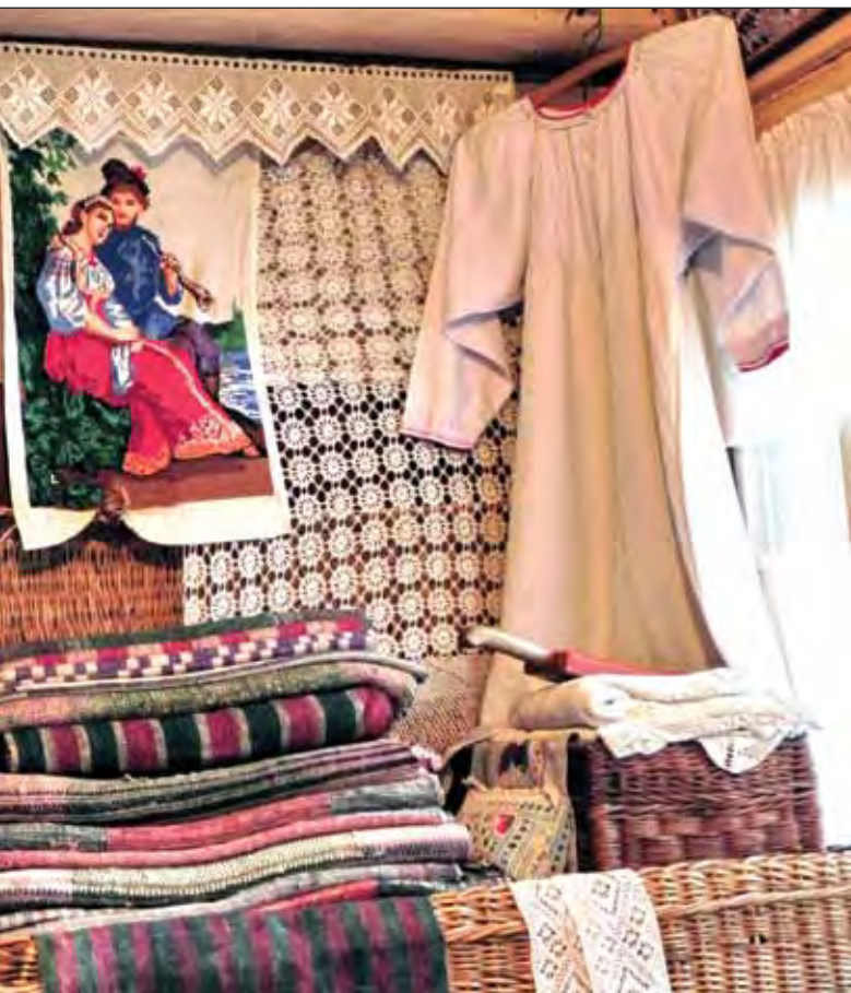
Мартыново. Фрагмент экспозиции Этнографического музея кацкарей. 2011

У кацких стариков и сейчас глаза загорают, как вспомнят святые вечера – Святки (с 7 по 18 января). Вот уж где «струшненья», вот уж «гляжения»! Ребятишки сразу после службы в церкви (а она заканчивалась за полночь) сбивались партиями – партия мальчишек и партия девчонок – и отправлялись славить Христа – в каждый дом постучатся: