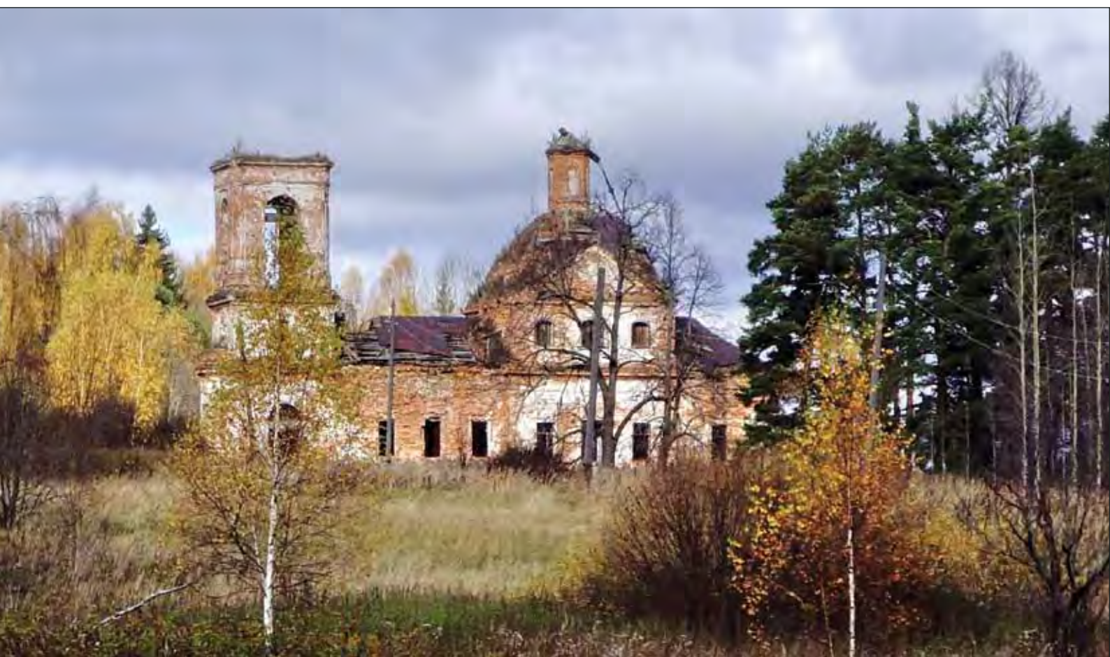
Знаменское. Храм, построенный в 1784 году Николаем Андреевичем Тютчевым. Октябрь 2008 г.

падают с лавок от смеха, когда «переодетые на оборот» герои сватают своего непутевого сынка к «приезжей девке» Огашке ( в ее роли выступают все по очереди туристки), а «баба Маня», не подбирая выражений, бракует всех невест подряд: «Ето откуда же ты к нам, такая монная, примаскалила? С самоёй Москвы?! К нашему-то обормоту?...» Кстати, кацкое выражение «примаскалить» означает вовсе не пренебрежение к москвичам, а обычный глагол «приехать», «прийти», происходящий от финно-угорского «маск» – «путь». До того, как в IX–X веках нашей эры в эти края пришли предки славян вятичи, здесь жили финно-угорские племена меря , которые потом ассимилировались, перемешались со славянами, а вот некоторые слова в кацком диалекте остались. Так что кацкари имеют смешанную кровь, и даже внешне многие из них голубоглазы и беловолосы, как скандинавы.