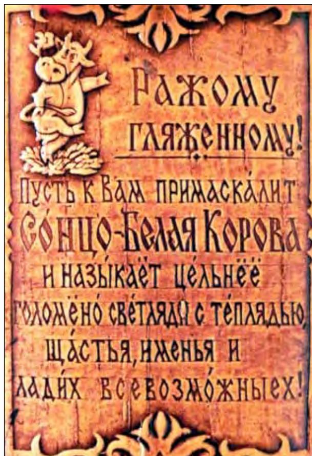
Фото Ирины Мелких. 2011

впредь, покуда стоит наш мир, и самую крепкую клятву обязательнѣ бают на Сонце-Белой Корове. Светлядь с теплядь, радость да именье, да и сама жизнь – всё это передати Белой Коровы. А на зѣмле, на кацких дворах, живут серѣди людей еѣные младшие сѣстры – зѣмные коровушки, такие жо мантурицы (труженицы), дающие благополучие».