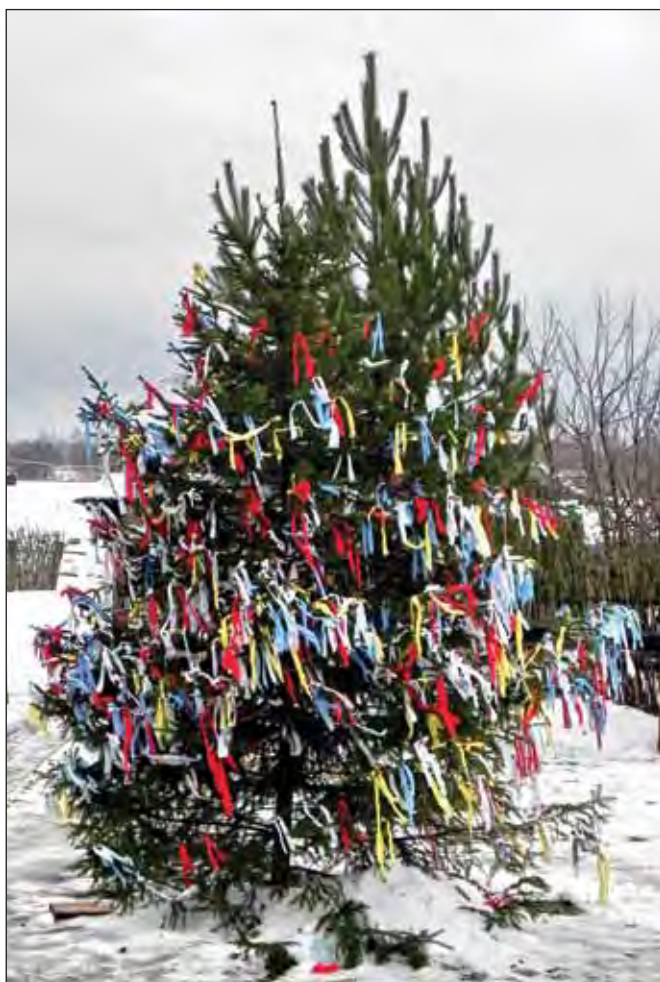
Марьиново. Набанченная рождественская ёлка. 2011

«Названия многих дней в зимнем народном численнике очень выразительны, – говорит учитель. – Попробуйте-ка определить, почему с такой тревогой, то и дело пересчитывая запасы на зиму, кацкари ожидают Петра Полукорма (29 января) и Аксинью Полухлебницу (6 февраля)?» Дети тянут руки: кре-