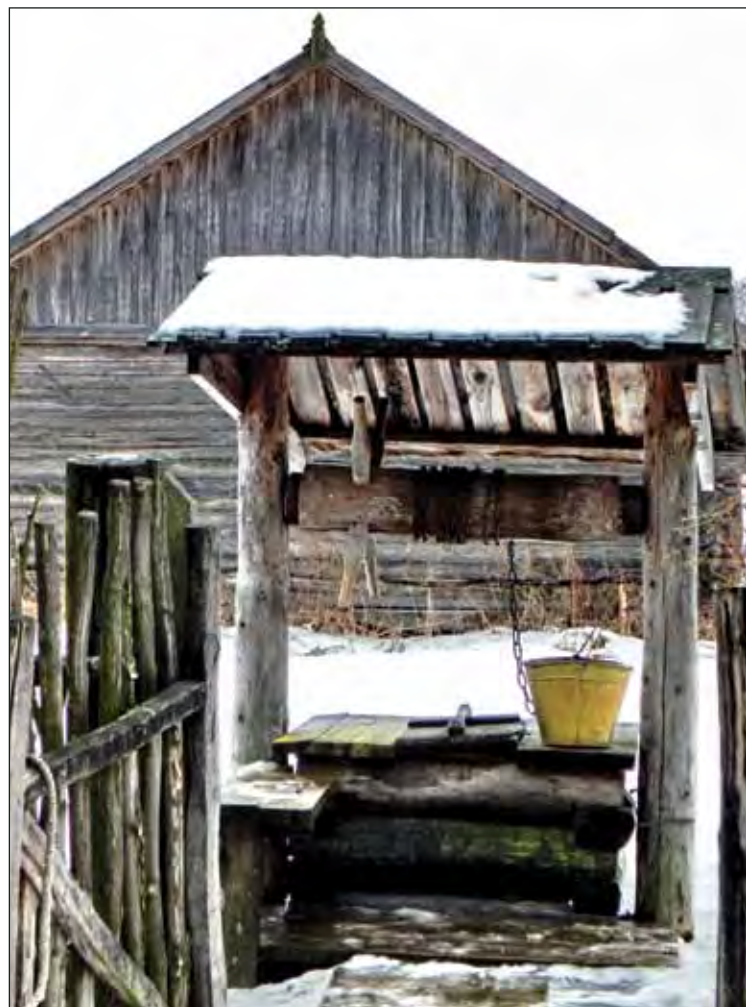
Марьиново. Музейный колодец. 2011

стьяне опасаются, что пропитания, запасенного с осени, им и животным до весны не хватит, придется голодать. Не дай Бог, падеж скотины начнется.