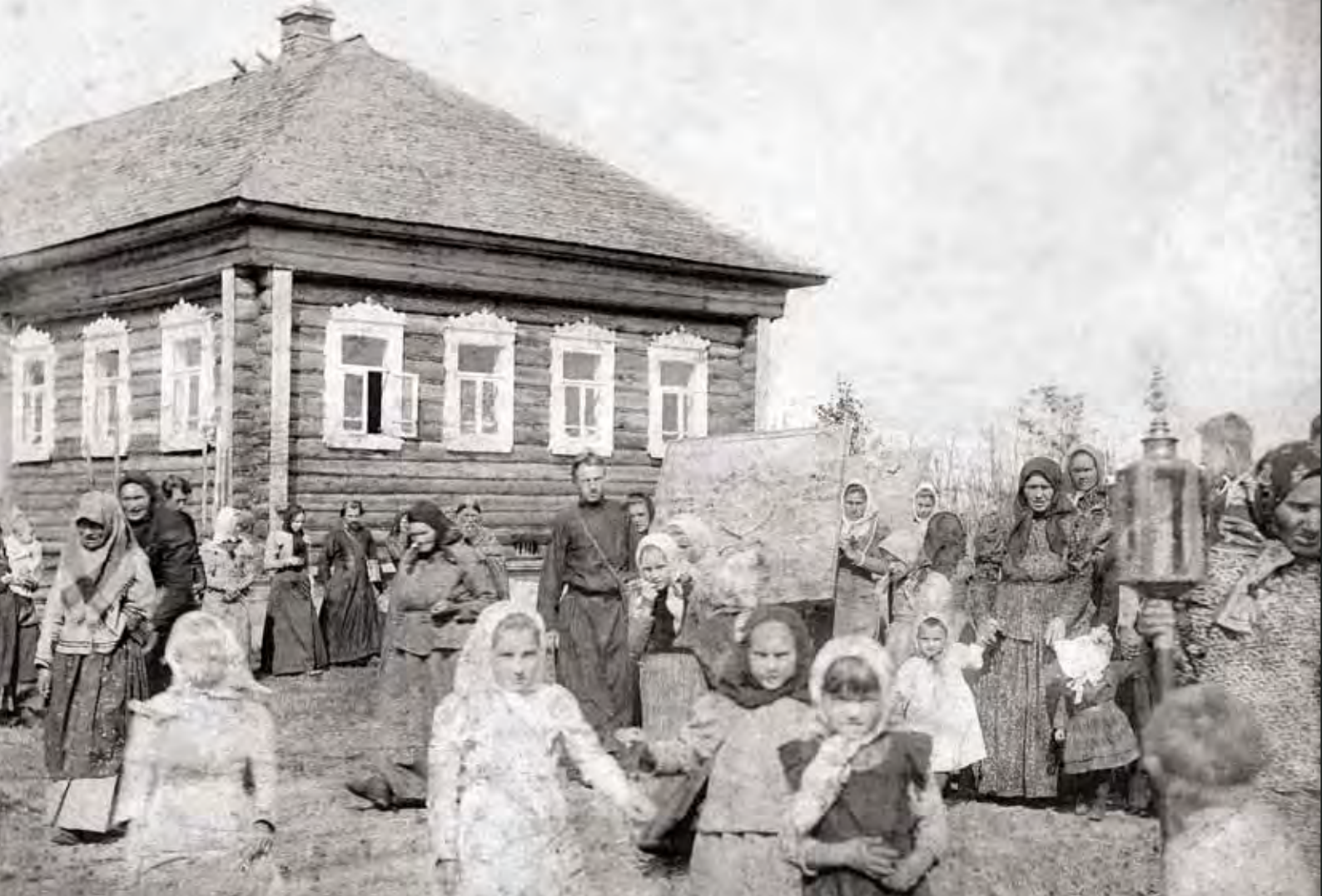
Платуново. Крестный ход. Август 1886 г.

стана – деревню Мартыново, будто попадаешь в иной, затерянный мир, и особенно сказочным кажется он в зимнюю пору.