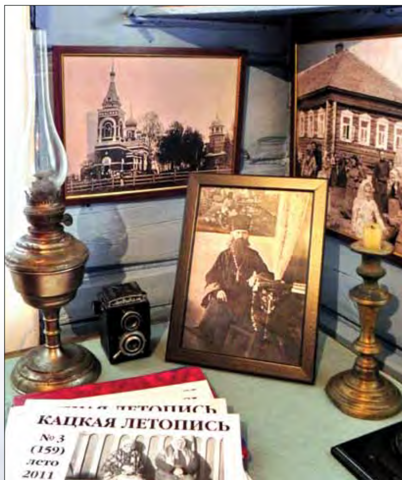
Фрагмент экспозиции Этнографического музея кацкарей. Мартыново. 2011

Особенностей у кацкарей «цельнее голомёно» – то есть немало. Фольклор представлен «прибайкям» (небольшими стихами), «укоронам» (мифами) и «коменничаньями» (пьесами деревенского театра). «Коменничать» – значит «ломать комедию». И точно – в «театре бабы Мани» люди