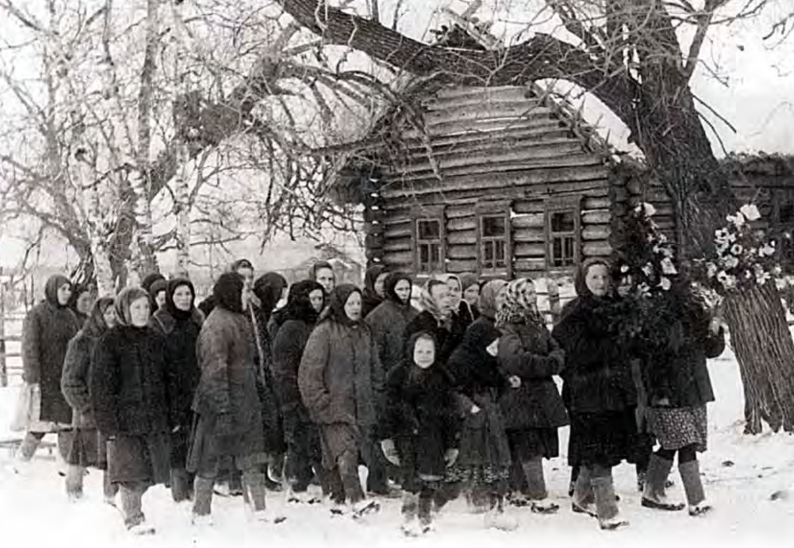
Двяконовка. Хождение со свадебными красами. Ноябрь 1956 г.

если его обладатель не пожелает поделиться им с окружающими. Жадному будет одно несчастье, тяжкие хвори и безвременная смерть. Так полагали кацкари – народ щедрый и работающий, согласно этим принципам они стараются жить и сейчас.