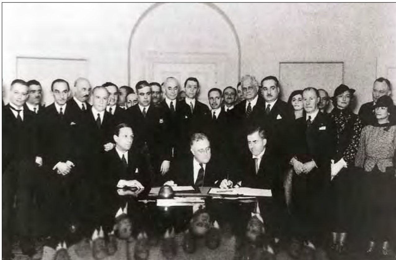
Церемония подписания Пакта Рериха в Овальном кабинете Белого Дома в присутствии президента США Ф. Рузвельта. Вашингтон. 15 апреля 1935 г.

ных санитаров на поле боя. Его неустанные усилия привели к подписанию 15 апреля 1935 года в Вашингтоне Договора об охране художественных и научных учреждений и исторических памятников, который принято называть Пактом Рериха. Этот договор установил следующий принцип для действующего права: «Исторические памятники, музеи, научные, художественные, образовательные и культурные учреждения считаются нейтральными и как таковые пользуются уважением и покровительством воюющих сторон».