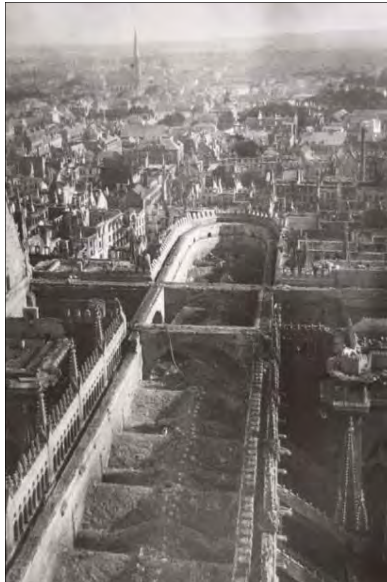
Реймский собор был обстрелян немецкой артиллерией в 1914 г.

Крайне обеспокоенный этими разрушениями, знаменитый русский художник Николай Константинович Рерих, эмигрировавший в 1920 году в Соединенные Штаты, выдвинул идею договора о защите памятников и произведений искусства, параллельного Женевской конвенции, провозглашающей нормы защиты раненых солдат и воен-