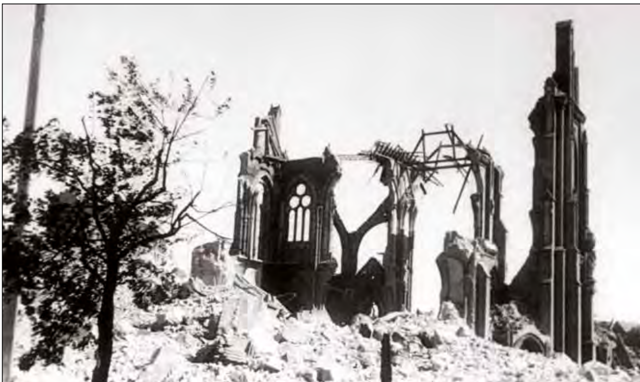
Костел св. Флориана в варшавском районе Прага после взрыва. 1944

Но чаще всего уничтожение совершается преднамеренно, когда атаке подвергаются памятники, места поклонения и произведения искусства, когда целью является уничтожение не просто культурных ценностей, но и вообще культурной идентичности врага, его истории и веры, для того чтобы стереть все следы его присутствия, а иногда и существования как такового. Именно так произошло во время уничтожения Варшавы в конце Второй мировой войны. Не осталось ни одного памятника, ни одной церкви, ни одного здания. И в России, как мы знаем, во время Второй мировой было разрушено множество церквей, дворцов и других монументов, в числе которых были и бесценные дворцы Петродворца и Пушкина, которые были подожжены немецкими солдатами во время вынужденного отступления после 900-дневной блокады Ленинграда.