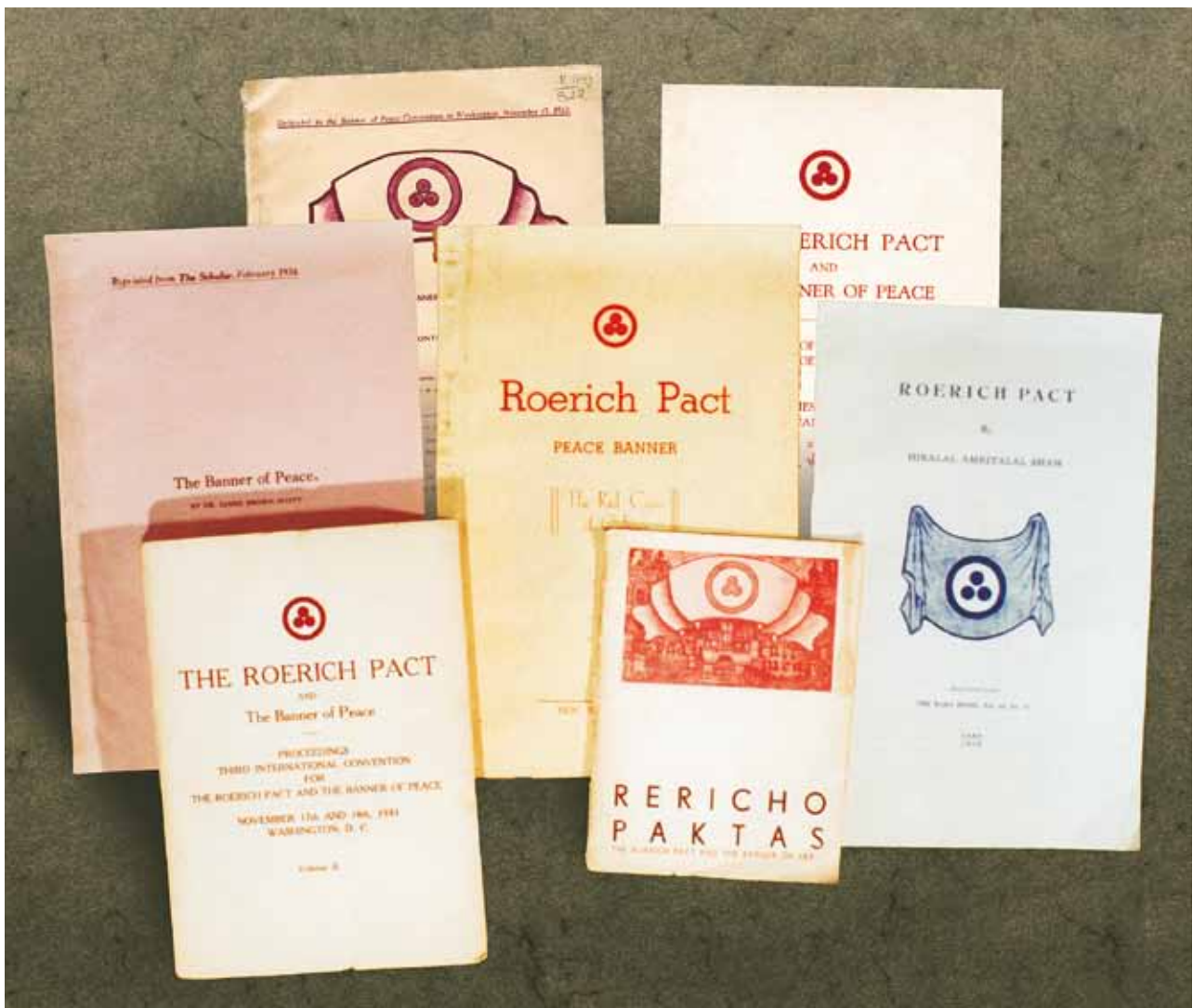
Издания, посвященные Пакту Рериха и Знамени Мира