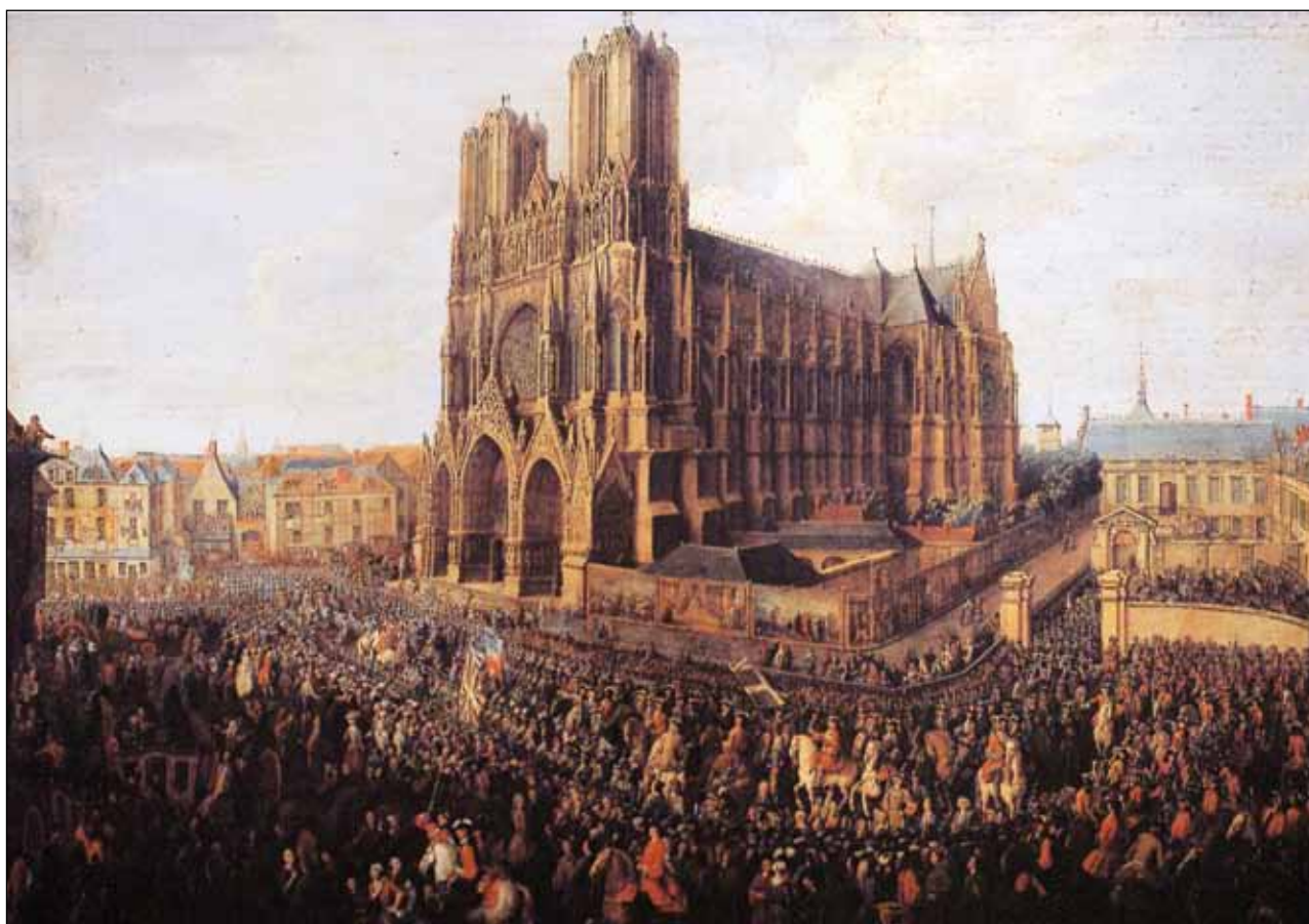
Собор Нотр-Дам де Сен-Жак в Реймсе. Начало XIX века

лиц, взятых в плен. Однако нормы, регулирующие ведение военных действий, пересмотрены не были. Такие нормы, регулирующие ведение военных действий и обеспечивающие защиту гражданских лиц и гражданской собственности от последствий военных действий, были вновь подтверждены и расширены Протоколами к Женевской конвенции, принятыми 12 августа 1949 года 9 .