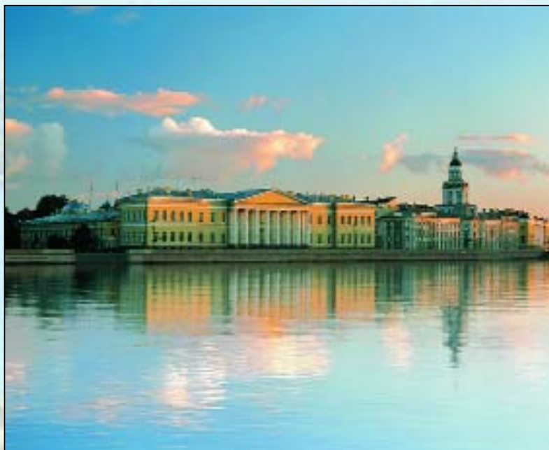
Архитектурный ландшафт Санкт-Петербурга

Особая тема и забота государства и общественности — реконструкция и развитие исторических городов. Мысль о связи между гармонией общественной и гармонией облика исторических городов была очевидной для наших предков, она звучит в «Должности архитектурной экспедиции» — трактате-кодексе 1737—1740 гг.: «Архитектура есть наука, многими учениями и разными искусствами укра-