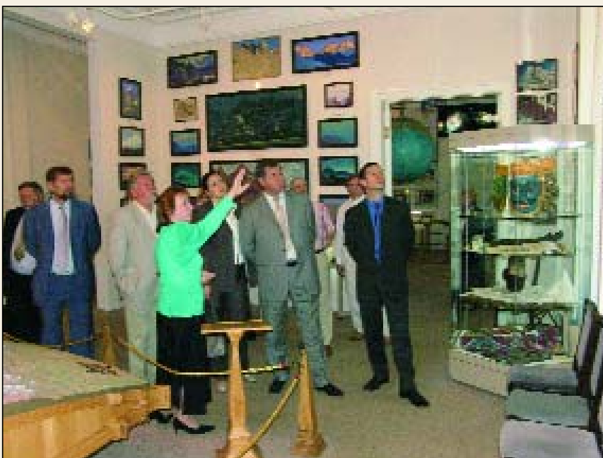
Гости из Днепропетровска в Музее имени Н.К. Рериха

го в дальнейшем будет основан научно-культурный центр. Зная, что в Москве уже существует такое уникальное явление, как неправительственная общественная организация Центр-Музей им. Н.К. Рериха, в городе на Днепре решили использовать уже имеющийся богатый и удачный опыт москвичей.