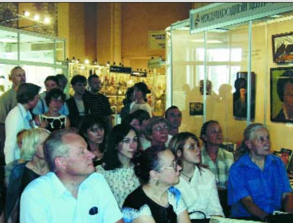
В павильоне «Культура» — день, посвященный экспозиции Музея имени Н.К. Рериха

Н.К. Рерих рядом с Дж. Неру. Книжные издания: «Шамбала», «Знамя Мира» и другие. Как бы перелистывая страницы семейной хроники, зритель знакомится с краткими выдержками из жизни Юрия Николаевича. Среди книг и фотографий разных лет — детство, юность, экспедиция с отцом в Центральную Азию, эпизоды последних лет жизни в Москве, — есть интереснейший документ: разрешение на въезд в Москву от 29 апреля 1926 года, выданное Рерихам Советским правительством. В числе наиболее известных научных работ Юрия Николаевича на выставке было представлено издание МЦР 1992 года — «Звериный стиль у кочевников Северного Тибета»; мы отмечаем его особенно, потому что искусствоведческий термин «звериный стиль» был введен в обиход