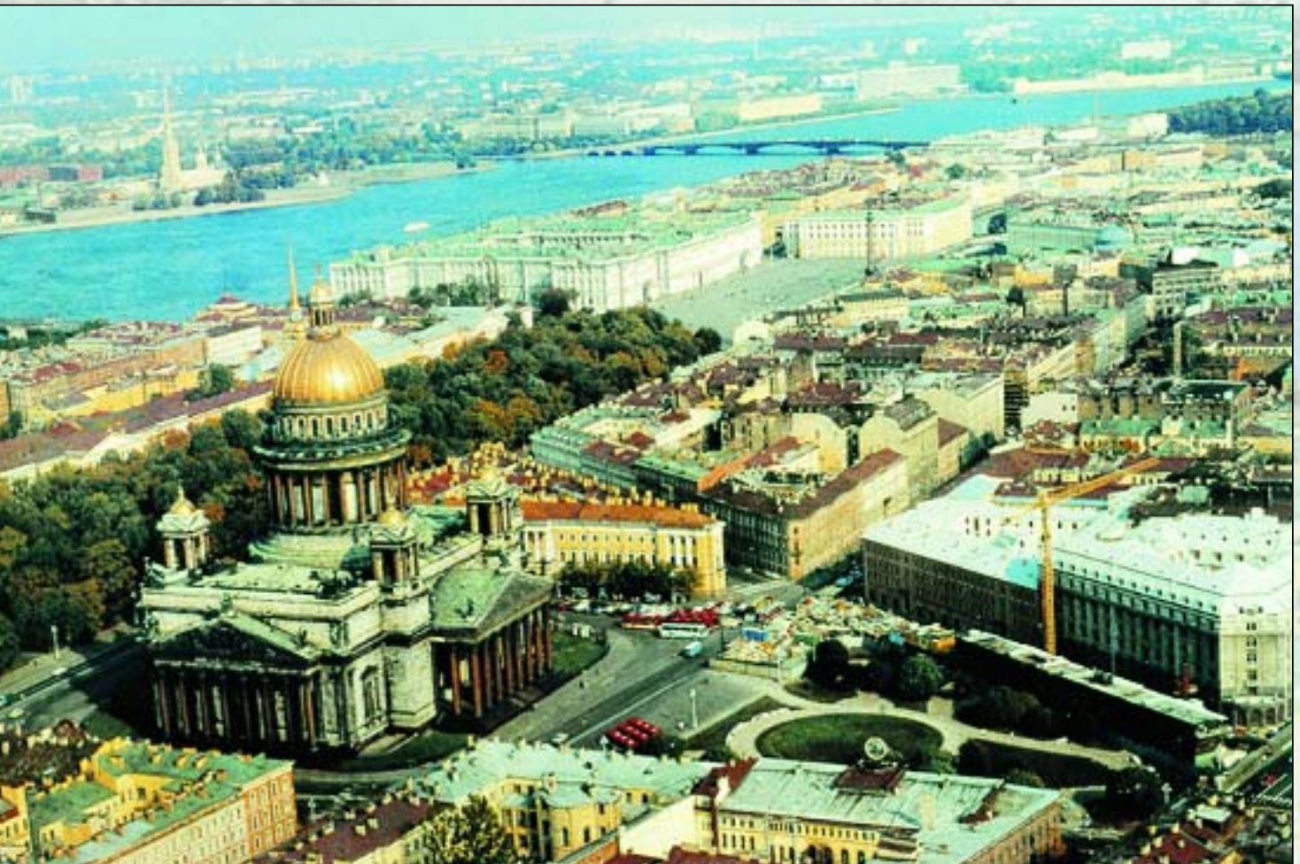
Санкт-Петербург. Вид на Исаакиевский собор

Одна из забот Комитета по госконтролю, использованию и охране памятников истории и культуры Администрации Санкт-Петербурга — реставрация надгробий, находящихся в аварийном состоянии. В 2003 году приведены в порядок захоронение