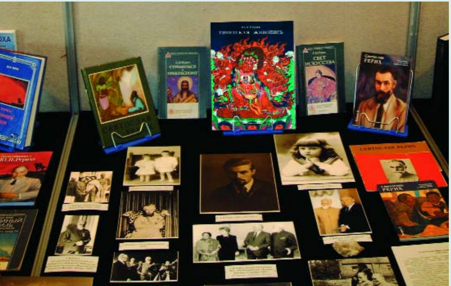
Экспозиция Музея имени Н.К. Рериха в павильоне «Культура»

ный дипломат, тонкий знаток и собиратель народного искусства, она много лет занимается историей национального костюма. Говоря об удивительной схожести линий и принципов кроя в одеждах народов, чьи исторические пути явно никогда не перекрещивались, она заметила, что объяснение такому сходству одно: стремление к гармонии и красоте одинаково для всех. «Разъединение наций разрушает культуру, — сказала она. — Нельзя строить жизнь на антагонизме».