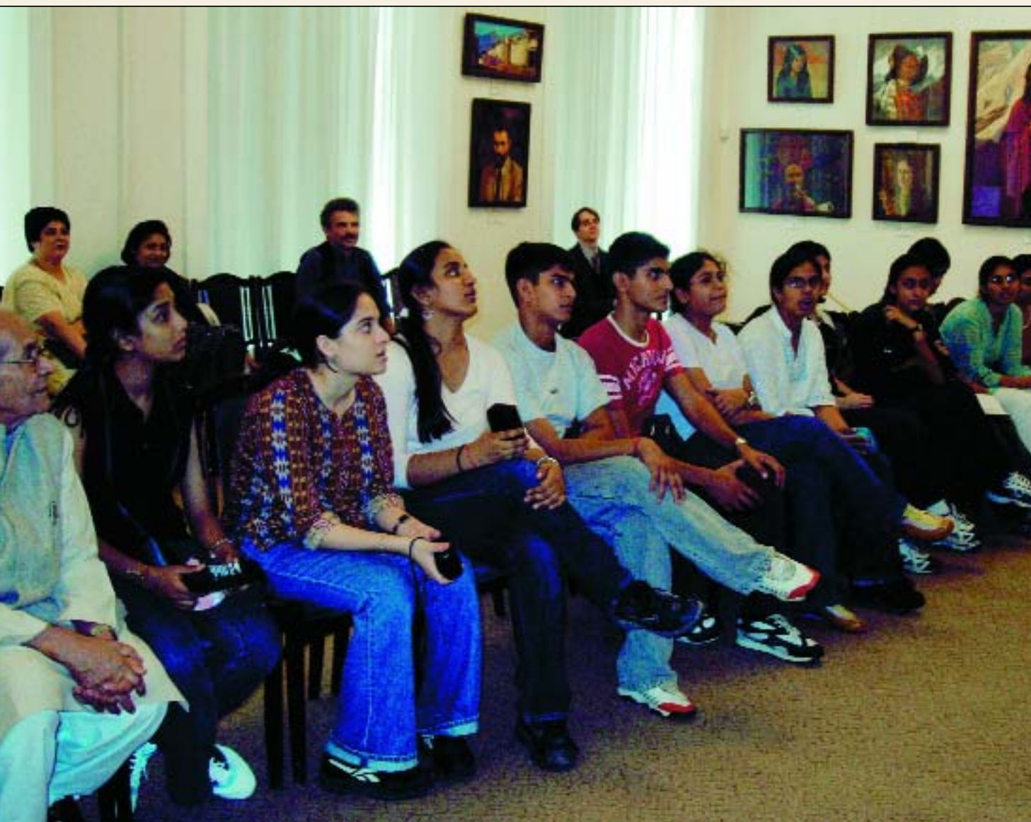
Индийские дети в зале Музея имени Н.К. Рериха