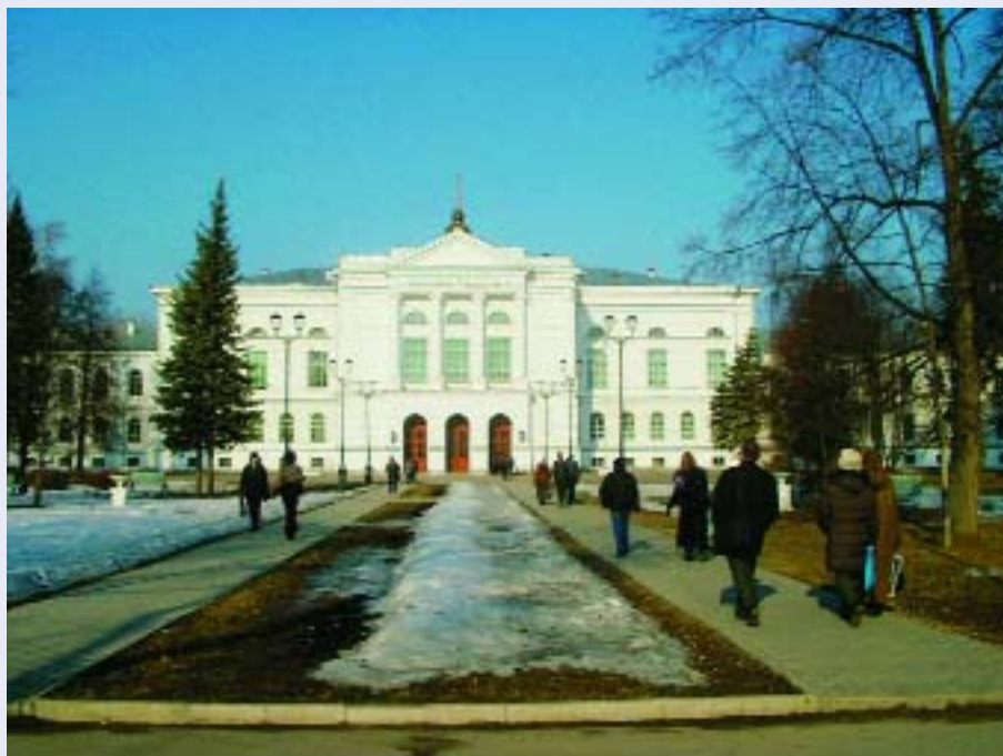
Томский государственный университет

По аналогии с конференцией прошлого года в секцию бы-