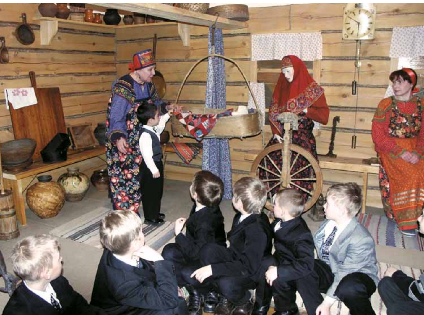
Экспозиция «Русский дом» в Детском музейном центре в Палатах г. Владимира