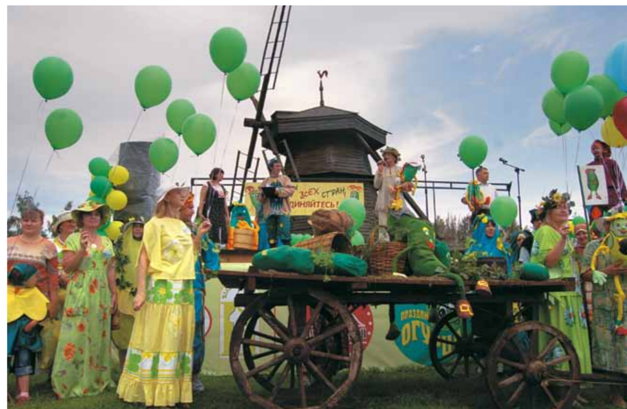
«Праздник огурца» в Музее деревянного зодчества. Суздаль