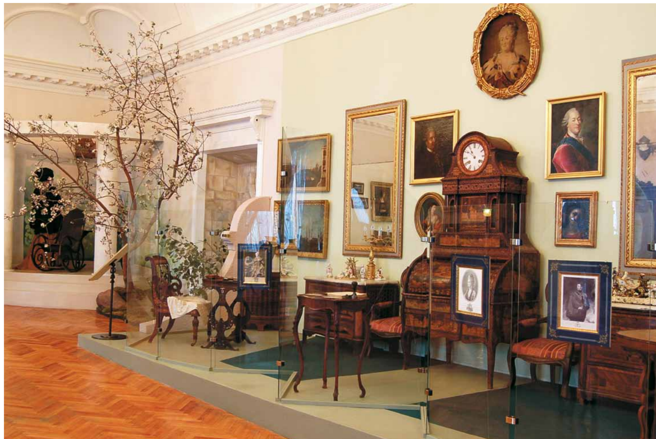
Фрагмент экспозиции «Минувших дней очарование...» в Палатах

Все отделы и службы музея-заповедника размещались в одной комнате. Когда она вошла в здание Исторического музея, глазам предстала неприглядная картина: на бивнях мамонта натянуты веревки – на них сушилось белье. Температура не больше 12 градусов; густой запах щей (в маленькой пристройке живет большая семья сторожа – выселить некуда). В надвратной церкви Золотых ворот военно-историческую экспозицию обогревали четыре печки, стоявшие по углам, – для растопки смотрительница каждое утро носила наверх несколько охапок дров, но температура не поднималась выше 6–8 градусов. В Суздале картина не лучше: в Архиерейских палатах – печи-буржуйки, в фондохранилищах плотный слой инея, в экспозиционных залах бегают мыши... У молодого ди-