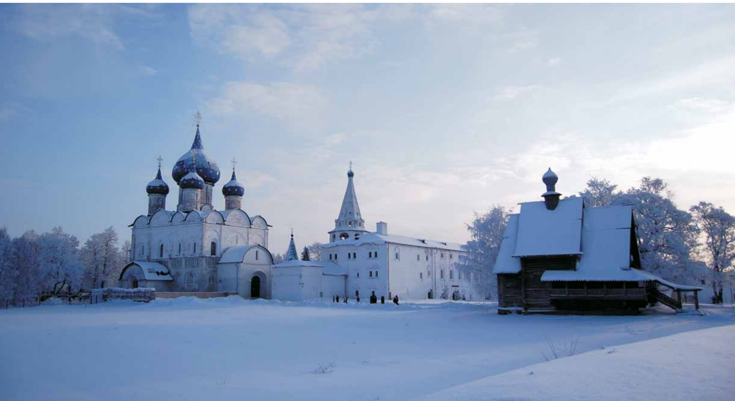
◀ Суздальский кремль зимой

«Когда меня спрашивают, что было самым трудным в те годы, я отвечаю: идеологическое