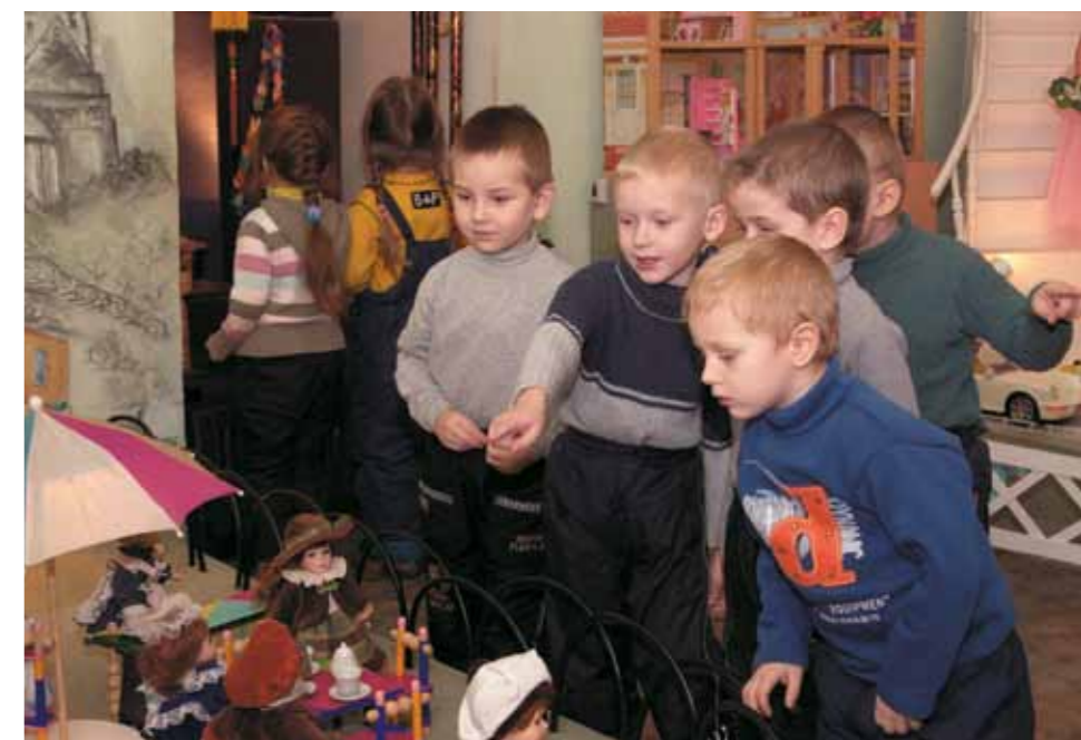
В Детском музейном центре в Палатах