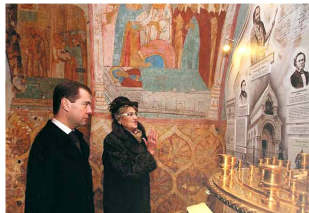
Президент Д.А. Медведев и А.И. Аксёнова в Спасо-Преображенском соборе Спасо-Евфимиева монастыря. Торжества по поводу открытия возрожденного памятника – часовни Д.М. Пожарского. 4 ноября 2010 г.

Постепенно музей набирал опыт: рос профессионализм сотрудников, повышалось качество экспозиций, сформировалась устойчивая способность самостоятельно