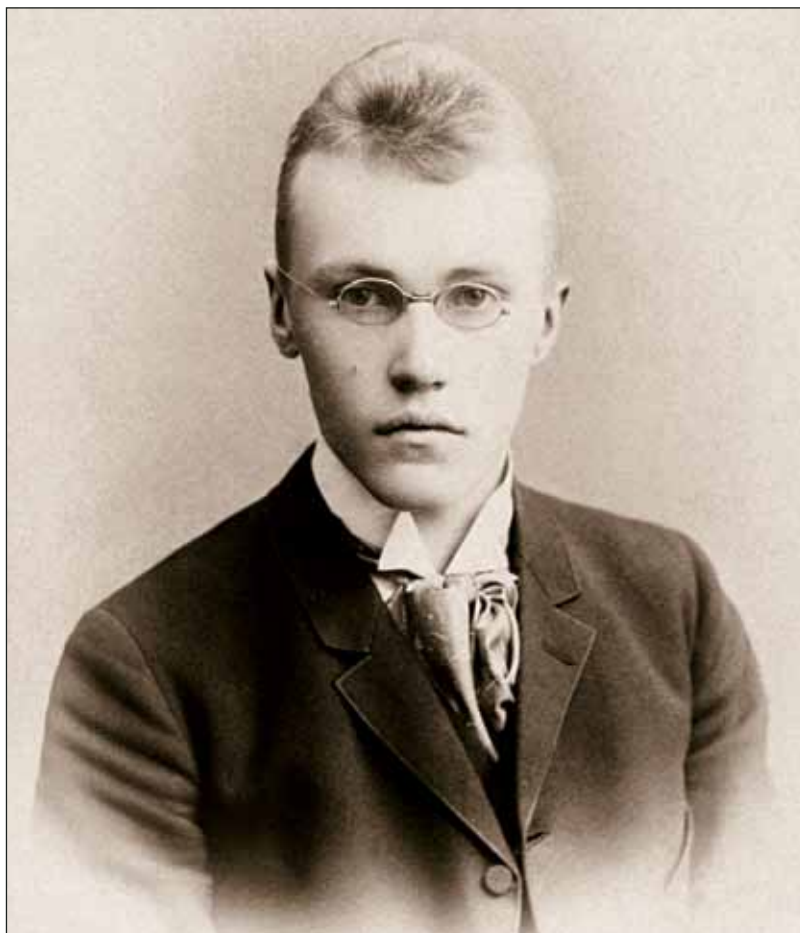
Николай Рерих. 1890-е гг.