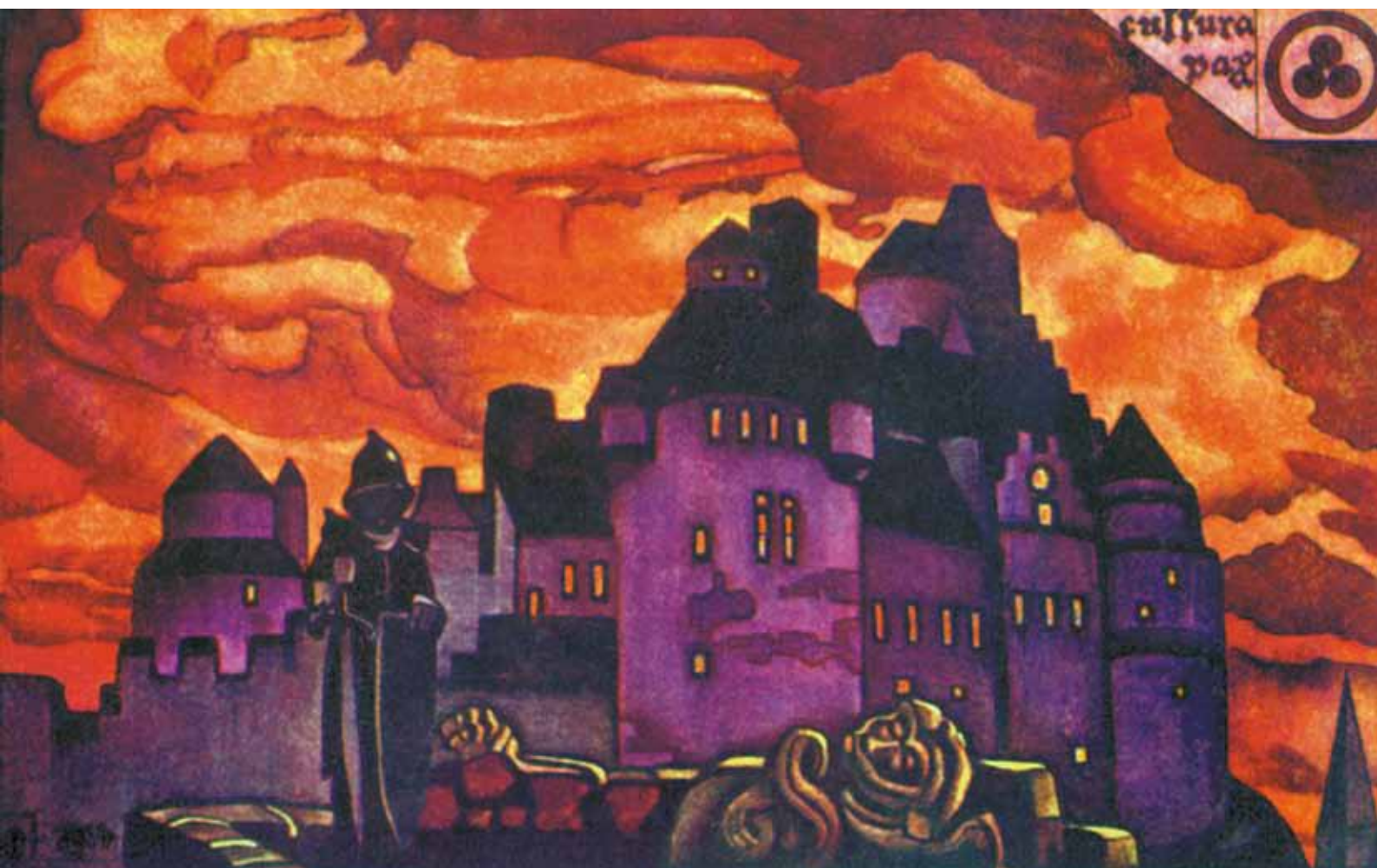
Н.К. Рерих. Зарево. 1914

которого будет заключаться в правовом ограничении и предотвращении разрушительных последствий войны, обороне человеческой жизни и культурного достояния как в военное, так и в мирное время.