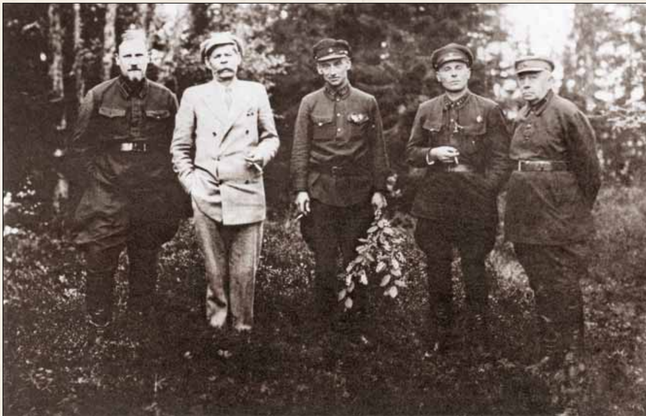
На прогулке в соловецком лесу. Слева направо: А.Я. Мартинелли, М. Горький, Г.И. Бокий, А.П. Ногтев, И.М. Полозов. 1929