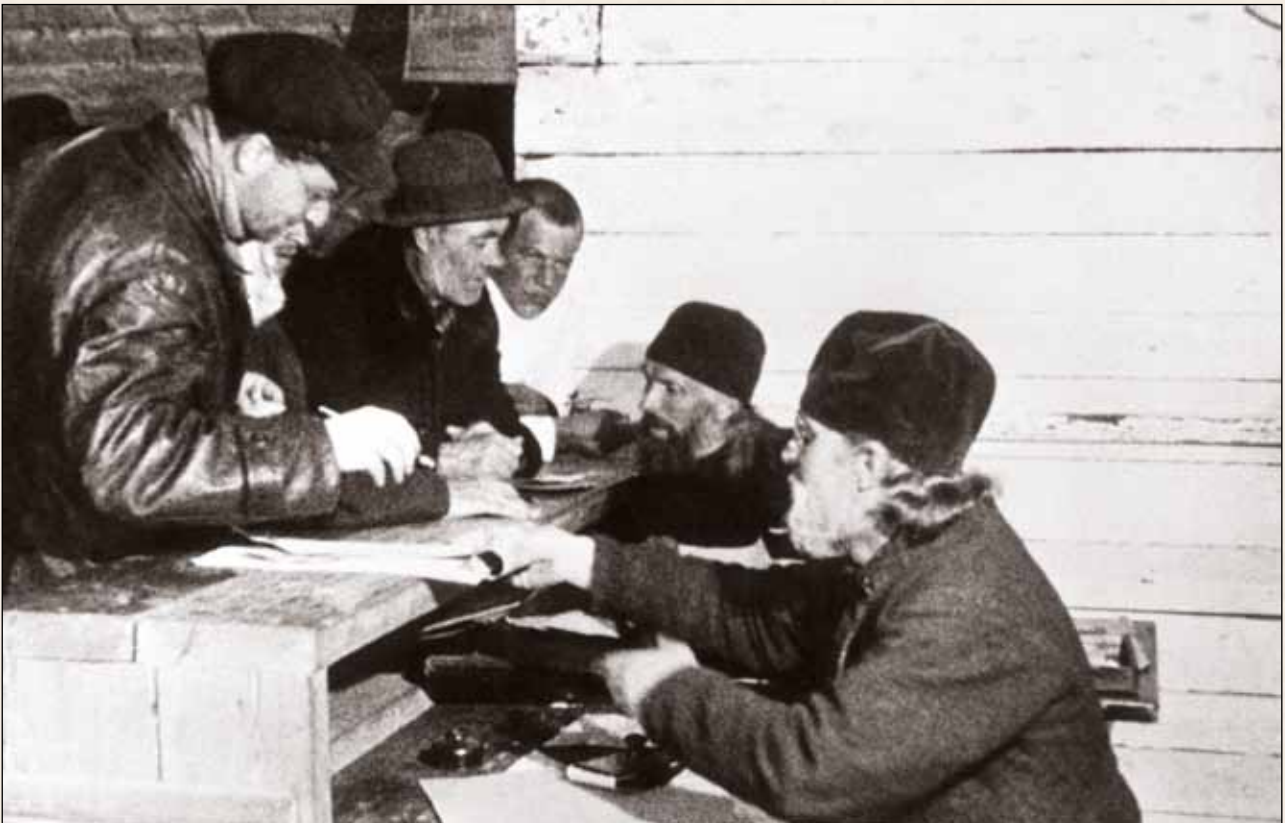
На выдачу почтовой корреспонденции направляли монахов. Кадр из фильма «Соловки», оператор С.Г. Савенко. 1928

«Государство в государстве» работает на совесть, документирует, сортирует «человеческий материал», обеспечивает порядок; тут вам не каторга, а образцовое исправительно-трудовое учреждение, тут о людях заботятся, дают премии,