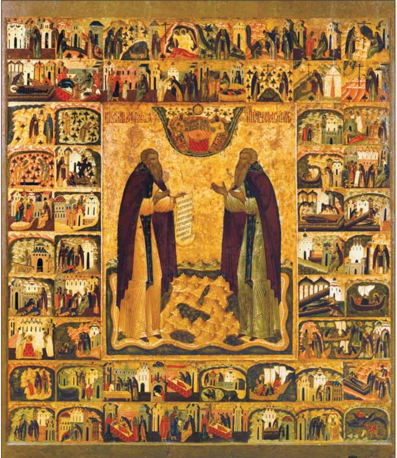
Зосима и Савватий – соловецкие чудотворцы. Икона. 1560-е гг.