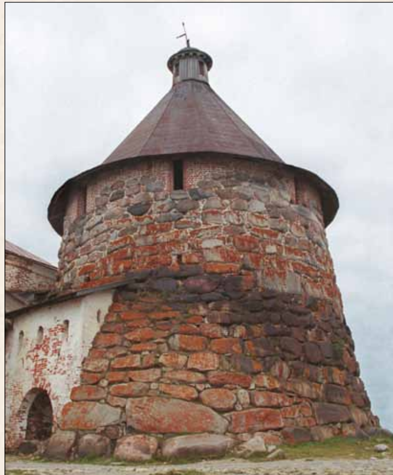
Соловки. Крепостная башня и Никольские ворота. 1966

Старшие завершили образование и начали трудиться на государственной службе еще в первое десятилетие XX в., а к 1917 г. занимали заметное место в области своей специализации. Младшие к началу Первой мировой войны только-только закончили