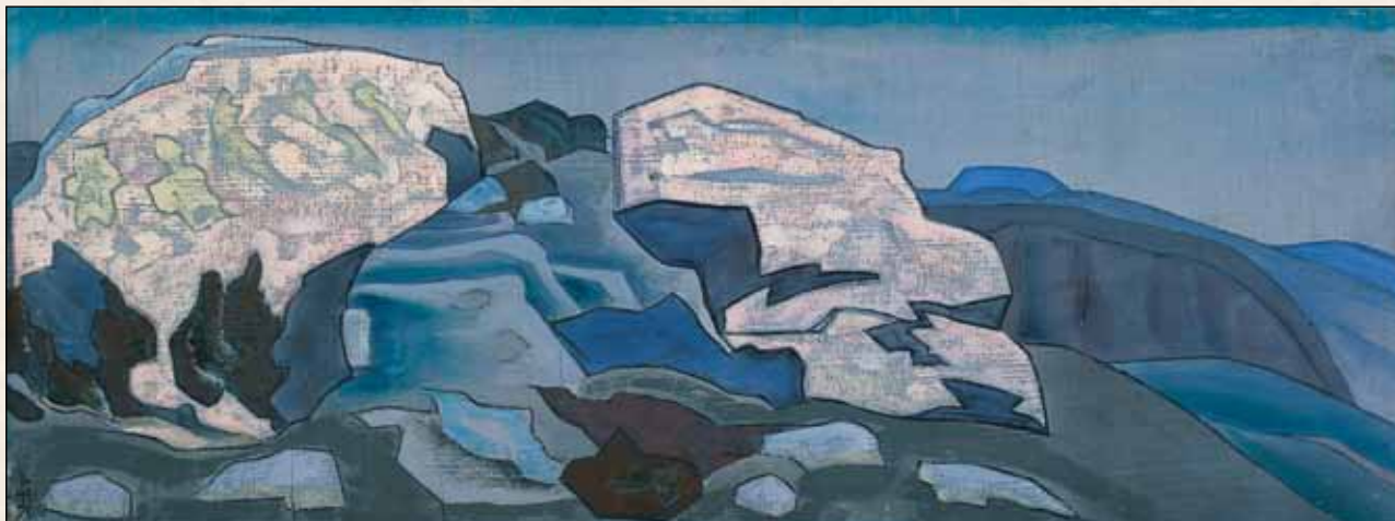
Н.К. Рерих. Скалы и утесы. Из серии «Ладога». 1918. Музей имени Н.К. Рериха