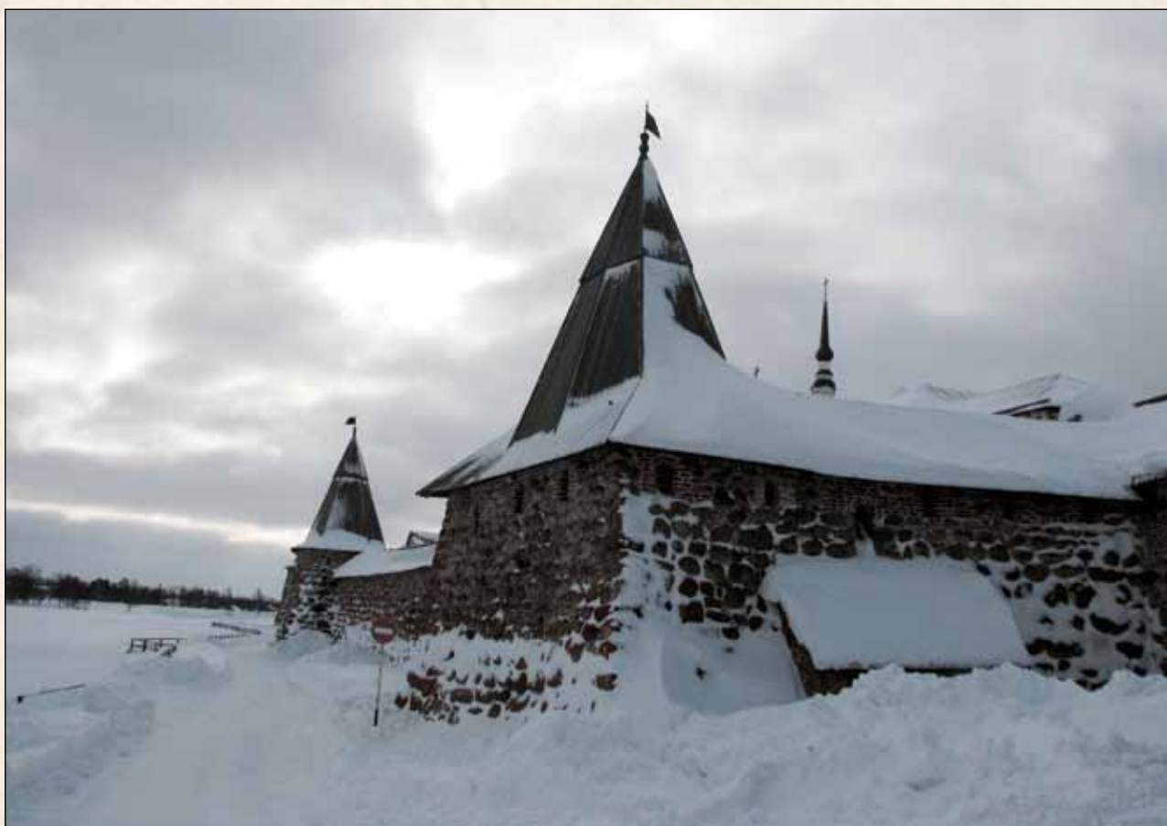
...Перед глазами стены Кремля соловецкого...

паек и даже молоко за вредность. Поощрение ударников, особенно тех, кто делает даровую лагерную работу, обсуждалось на самом высоком уровне. В примечаниях приводится цитата из выступления Сталина. Добрый прищур, замедленно-размеренная речь, глумливый смысл: «...Мы плохо делаем, что нарушаем работу лагерей. Освобождение этим людям, конечно, нужно, но с точки зрения государственного хозяйства это плохо... Будут освобождаться лучшие люди, а оставаться – худшие. Нельзя ли повернуть по-другому, чтобы эти люди оставались на работе, – давать ордена, может быть? А то мы их освободим, вернутся они к себе, снюхаются опять с уголовниками и пойдут опять по старой дорожке. А в лагере другая атмосфера – там трудно испортиться» 21 .