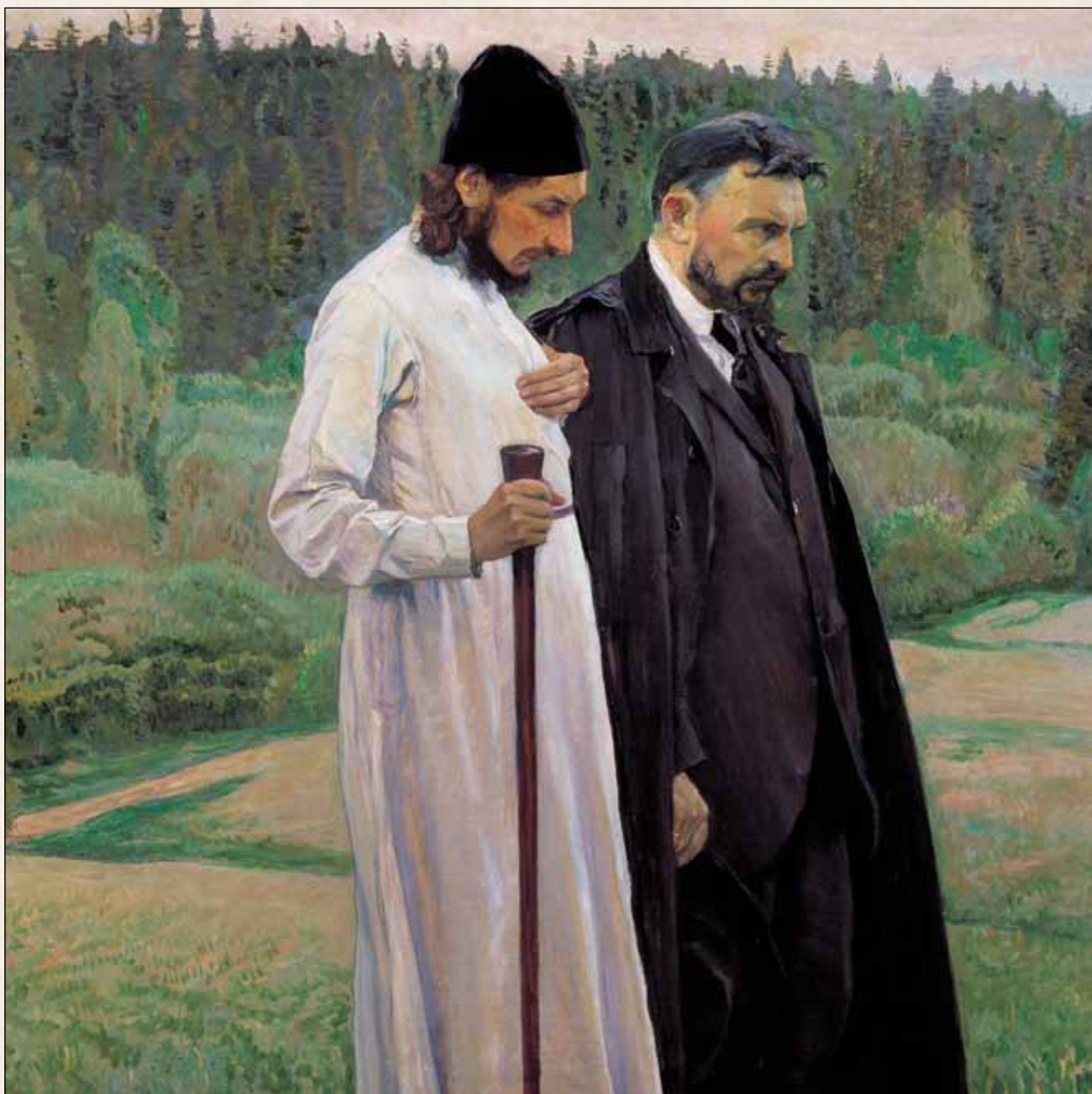
М.В. Нестеров. Философы. 1917