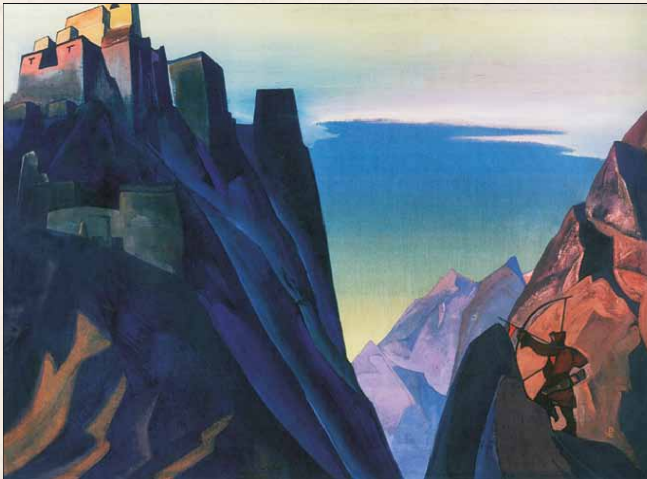
Н.К. Рерих. Шамбале даик (Весть Шамбалы). 1933

метаистории, является понятие «возвратной волны». Поясняя его смысл, Л.В. Шапошникова отмечает: «Как бы то ни было, прошлое сливается с нашим историческим процессом, внося в него свое метаисторическое познание, свое духовное наследие, свое космическое сознание» 13 . Определяя значение и раскрывая космический и конкретно-исторический контекст употребления этих категорий, Л.В. Шапошникова делает научное открытие в области изучения эволюционных особенностей развития человечества. Это открытие, так же как и другие, представленные в книге, имеет огромное значение для исторической науки и для научного знания в целом, ибо наука с позиций философии Космической реальности представляет собой целостное явление.