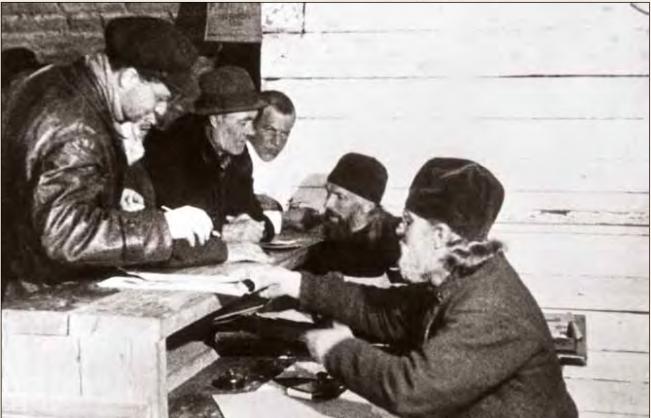
На выдачу почтовой корреспонденции направляли монахов. Кадр из фильма «Соловки», оператор С.Г. Савенко. 1928

«Государство в государстве» работает на совесть, документирует, сортирует «человеческий материал», обеспечивает порядок; тут вам не каторга, а образцовое исправительно-трудовое учреждение, тут о людях заботятся, дают премии,