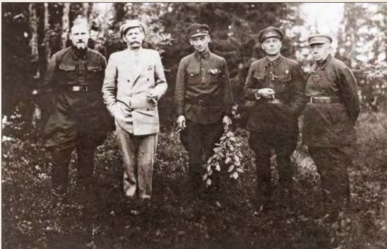
На прогулке в соловецком лесу. Слева направо: А.Я. Мартинелли, М. Горький, Г.И. Бокий, А.П. Ногтев, И.М. Полозов. 1929