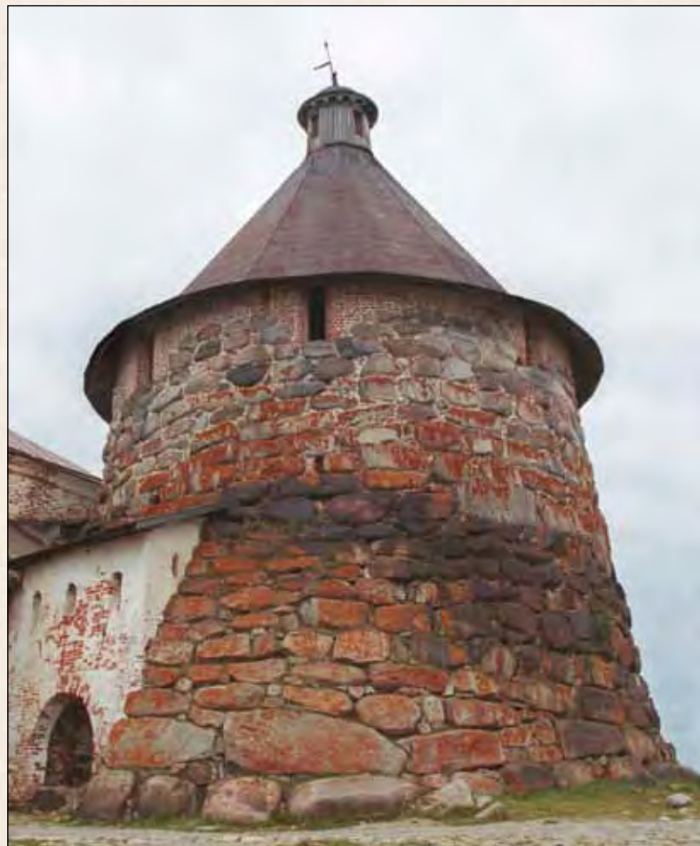
Соловки. Крепостная башня и Никольские ворота. 1966

Старшие завершили образование и начали трудиться на государственной службе еще в первое десятилетие XX в., а к 1917 г. занимали заметное место в области своей специализации. Младшие к началу Первой мировой войны только-только закончили