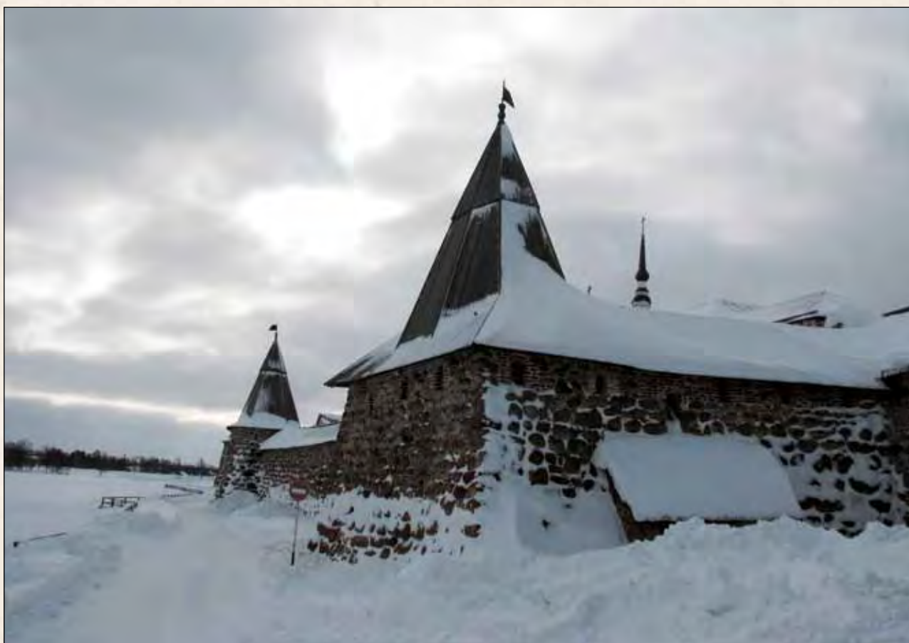
...Перед глазами стены Кремля соловецкого...

паек и даже молоко за вредность. Поощрение ударников, особенно тех, кто делает даровую лагерную работу, обсуждалось на самом высоком уровне. В примечаниях приводится цитата из выступления Сталина. Добрый прищур, замедленно-размеренная речь, глумливый смысл: «...Мы плохо делаем, что нарушаем работу лагерей. Освобождение этим людям, конечно, нужно, но с точки зрения государственного хозяйства это плохо... Будут освобождаться лучшие люди, а оставаться – худшие. Нельзя ли повернуть по-другому, чтобы эти люди оставались на работе, – давать ордена, может быть? А то мы их освободим, вернутся они к себе, снюхаются опять с уголовниками и пойдут опять по старой дорожке. А в лагере другая атмосфера – там трудно испортиться» 21 .