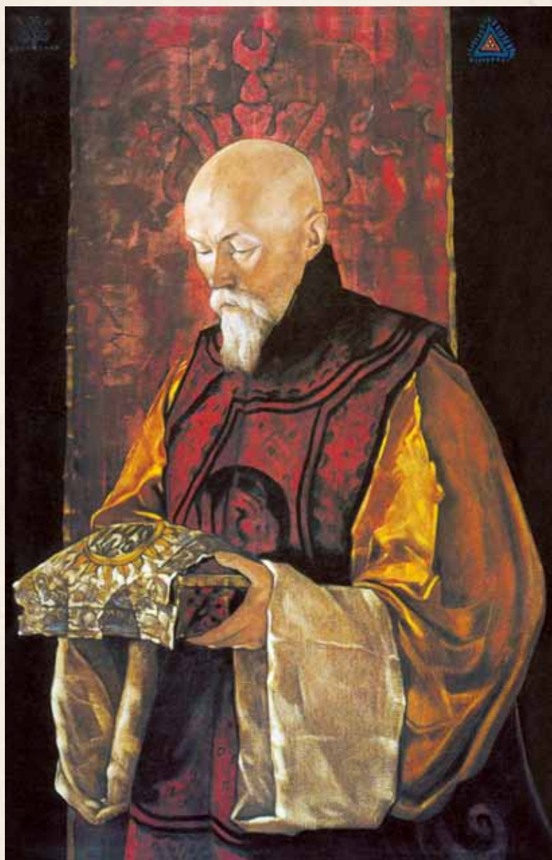
С.Н. Рерих. Портрет Н.К. Рериха с Ларцом (с Камнем). 1928