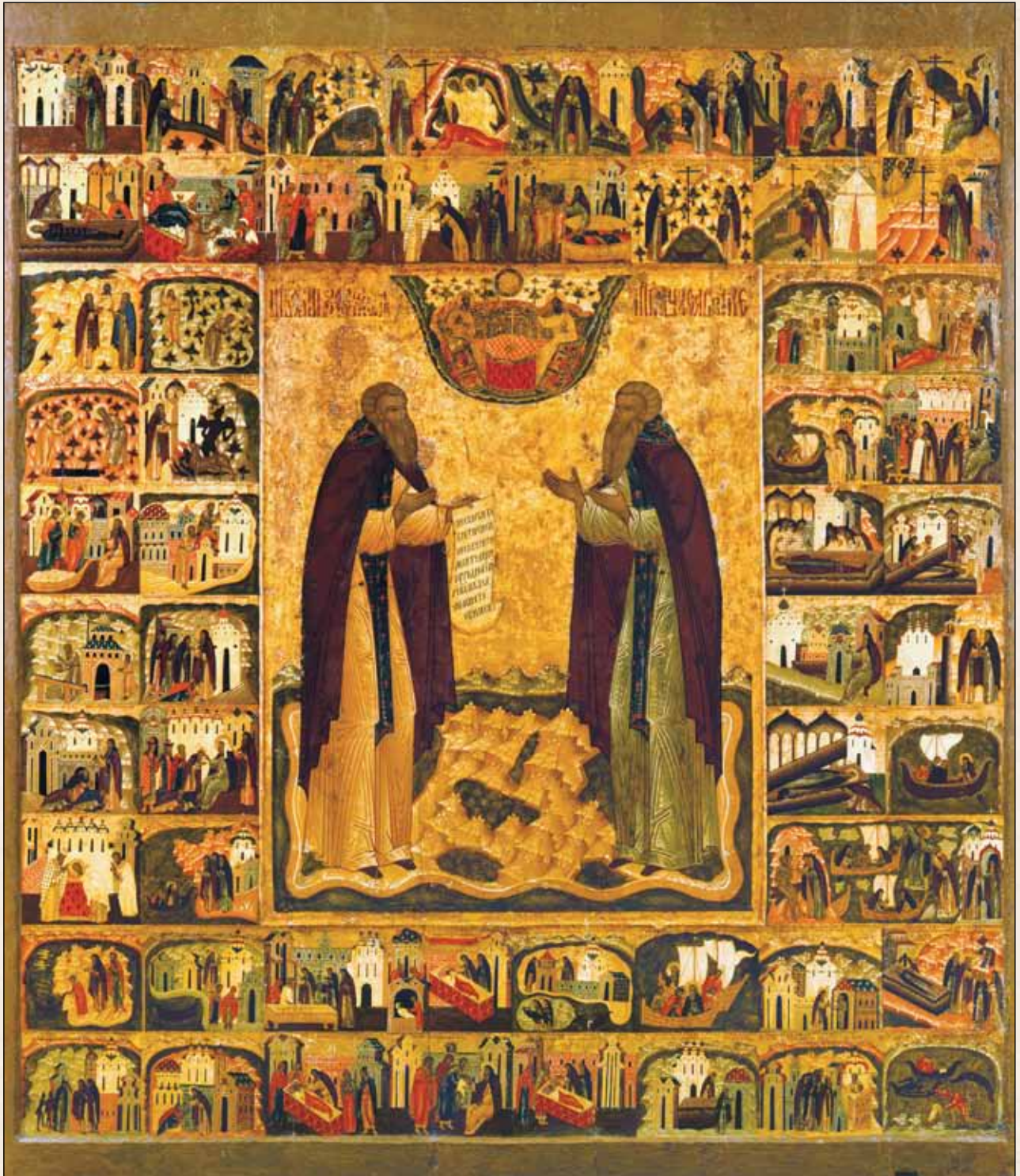
Зосима и Савватий – соловецкие чудотворцы. Икона. 1560-е гг.