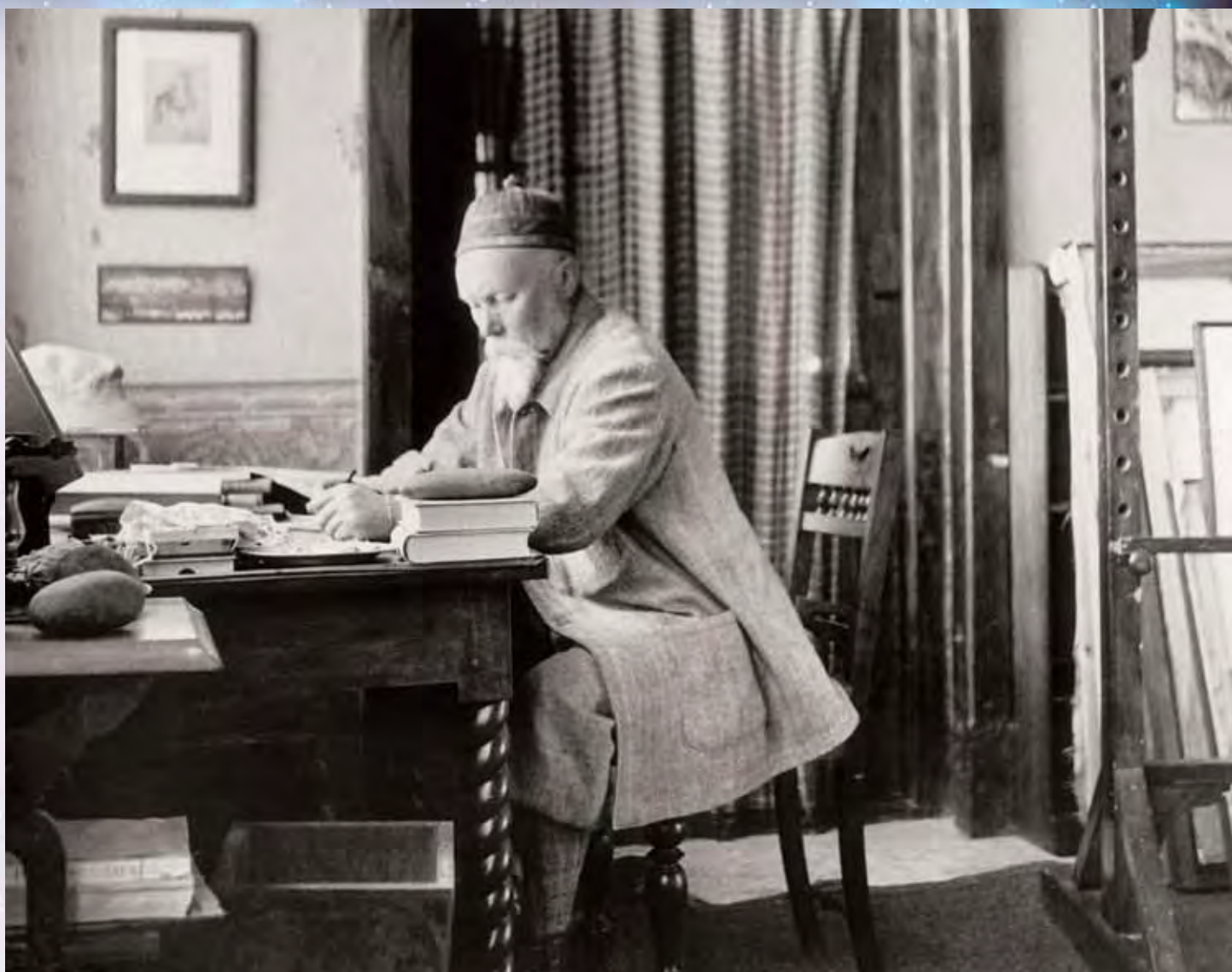
Н.К. Рерих за работой. Индия, Кулу. 1930-е гг.

риха как источник познания Космической реальности, необходимо понять, что процесс этого познания беспредельен. Как можно познать ту реальность, которая есть не только земное бытие, но и инобытие? В каком масштабе и глубине? Для человека это – путь в Беспредельность, и здесь всегда будет оставаться элемент «несказуемого», о котором говорил когда-то Рериху А.А. Блок 4 , ведь для такого процесса познания требуются иные аппарат и система познания, необходимо формирование качественно иного мировоззрения, которое и подскажет соизмеримость выражения «несказуемого». Космическая реальность – это целостная энергетическая система, состоящая из различных структур, включая человека 5 . Она предстает во всех измерениях, состояниях, планах, формах и вне форм, про-