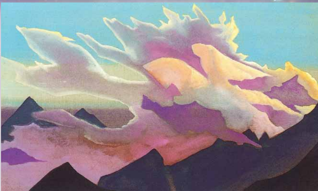
Н.К. Рерих. Светлый витязь . 1933

в маленьком норвежском городке на небе возникла светоносная фигура Христа, благословляющего город; в греческой деревушке наблюдали гигантскую фигуру воина в полном вооружении, поднимавшегося в голубом свете над горизонтом; в других местах видели огненные кресты, огненного ангела на столбах света, огненного всадника, чашу и многое другое. «При землетрясении в Италии, – писал Рерих, – видели все небо в языках пламени. Над Англией видели огненный крест. Суеверие ли только? Или просто кто-то увидел то, что часто не замечали?» 15 В очерке «Свет Неугасимый» он упоминал о многократных видениях К. Минину и другим русским людям Преподобного Сергия, наставлявшего их к спасению родины в годы польско-литовского нашествия. Подобные видения случались и в годы Великой Отечественной войны, что требует своего глубокого исследования, поскольку раскрывает особенности и характер метаисторического процесса. Ценность размышлений Н.К. Рериха состоит в том, что он указал на фактическую массовость подобных явлений, свидетельствующих о взаимопроникновении миров, и на «особо тонкие условия, неуловимые пока человеческим мышлением» 16 , которые способствуют их выявлению.